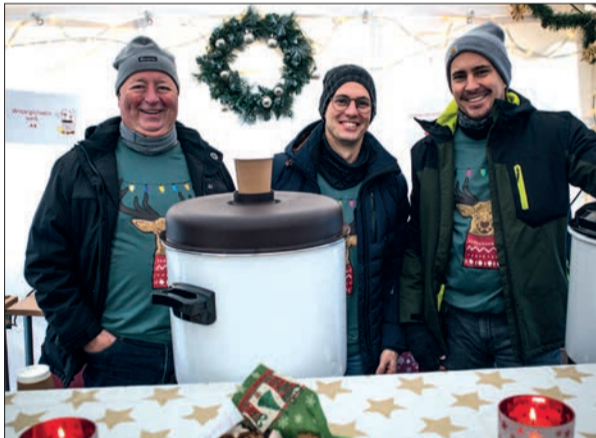
Die Drei von der Glühweintanke betreiben das Geschäft bereits in der zweiten Generation auf dem Angermunder Nikolausmarkt. Aufgrund der enormen Nachfrage erwägt man aus Platzgründen, im nächsten Jahr ein 250-Personen fassendes Zelt aufzustellen.