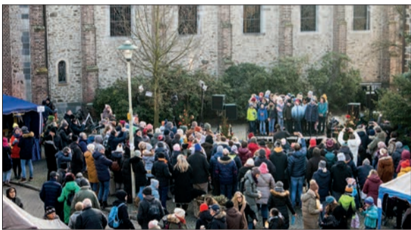
Bereits um 14 Uhr war der Kirchenvorplatz beim Weihnachtsliedersingen der „Singpause“ der Schüler*innen der 4. Klassen der Gemeinschaftsgrundschule Friedrich-von-Spee schon sehr gut besucht.