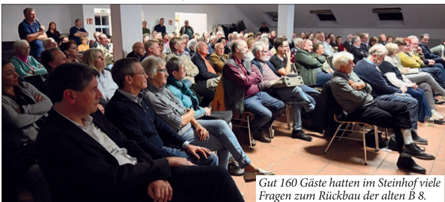
Gut 160 Gäste hatten im Steinhof viele Fragen zum Rückbau der alten B 8.