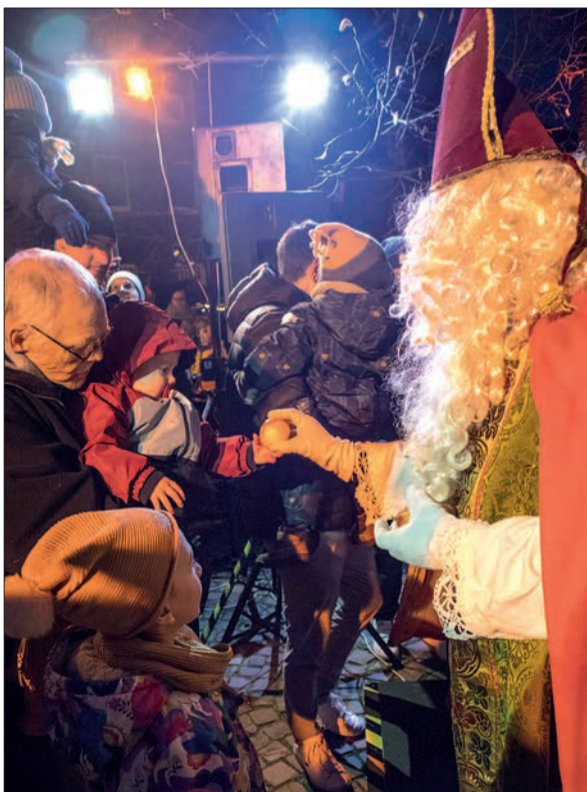
Selbst noch mit Schnuller im Mund kann man schon das kleine Händchen für einen Apfel vom Nikolaus – ganz konzentriert – öffnen.