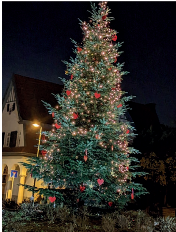
Alle Jahre wieder erstrahlt der große Weihnachtsbaum auf dem Kreisverkehr in Angermund als Tor zur Graf-Engelbert-Straße. Hier fand am 2. Dezember der beliebte Nikolausmarkt statt. Nun kommt die besinnliche Zeit mit vielen Kugeln, lieben Menschen und Hoffnung und Zuversicht.

Beginnen wir mit der Zuversicht. Ist das Glas halb leer oder halb voll? Immer doch lieber halb voll. Ist das Wetter schlecht oder unsere Kleidung nicht die richtige? Dabei ist es so wichtig, Licht und frische Luft zu tanken, damit die Glückshormone namens Dopamin und Serotonin ausgeschüttet werden. Davon brauchen wir gerade in diesen unruhigen Zeiten verschwenderisch