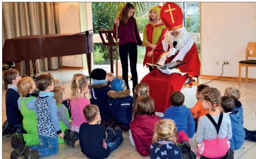
Am dritten Advent wird der Nikolaus wieder in Rahm erwartet – unterstützt von Kindern der Grundschule Rahm.