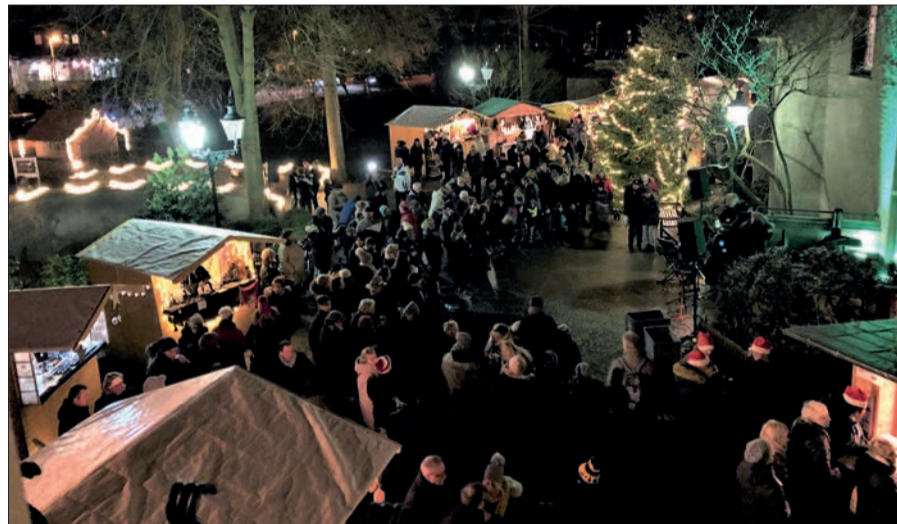
Viele Lichter werden wieder an der Kirche St. Hubertus leuchten, wenn am dritten Adventswochenende der „Weihnachtsmarkt am Zwiebelturm“ stattfindet.

giebigen Bummeln ein. Hier kann man vor allem handgefertigte Weihnachtsgeschenke oder Dekorationen für sich und andere erstehen. Für das leibliche Wohl wird bestens gesorgt sein: Neben Heiß- und Kaltgetränken gibt es deftige Sachen vom Grill sowie Gyros. Die Jungschützen bereiten Waffeln vor. Ein schöner Ort, um die Gemeinschaft im Ort zu leben – gerne auch mit auswärtigen Gästen. sam