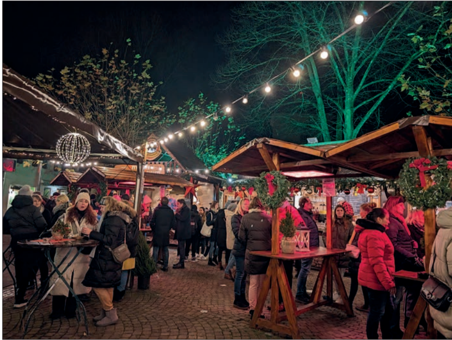
Ein gemütlicher Treff für alle aus Kaiserswerth und von anderswo ist das Winterdorf in Kaiserswerth vor Café Schuster. Hier gibt es neben allen möglichen Leckereien auch eine Bühne mit Live-Musik und ein hübsches Karussell für Kinder.