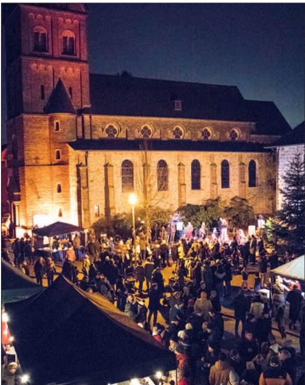
Gemeinsames Weihnachtsliedersingen am Abend.