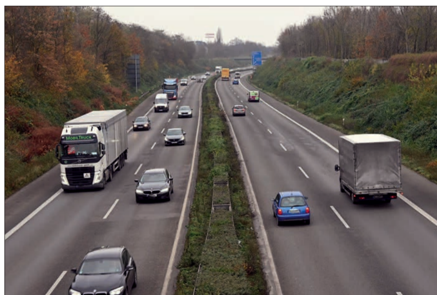
Vier Jahre lang müssen sich die Verkehrsteilnehmer auf der A 59 im Duisburger Süden auf eine Baustelle einstellen.

Es gehe um Erd- und Deckenbauarbeiten für den Aufbau der Fahrbahn, aber auch um Arbeiten an Schutzeinrichtungen und Lärmschutzanlagen. Elf Brückenanlagen sollen ertüchtigt werden. Der Verkehr kann laut Kok weitgehend auf verengten Fahrspuren fließen. Auf Sperren oder Engpässe werde gesondert hingewiesen.