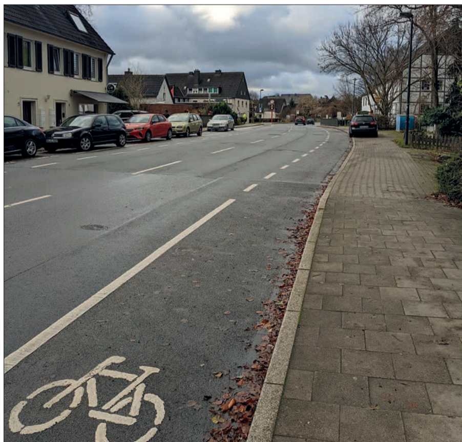
Die Angermunder Straße ist zwischen den beiden Kreisverkehren zur Rennstrecke mutiert. Nun fordern die Bürgerinnen und Bürger eine Tempo-30-Zone. Ein offizieller Antrag steht aber noch aus. G.S.