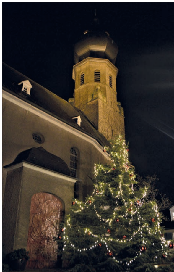
Viele Weihnachtsbäume in unserem Verbreitungsgebiet leuchten derzeit stimmungsvoll - wie hier vor der Kirche St. Hubertus in Rahm. Es lohnt sich, in den Abendstunden einen Spaziergang durch den Düsseldorfer Norden und den Duisburger Süden zu unternehmen: Zahlreiche Häuser, Wohnungen und Geschäfte wurden liebevoll geschmückt, um etwas Wärme in dieser Jahreszeit zu verbreiten und die Wartezeit bis Weihnachten zu verkürzen.

Die Corona-Pandemie beherrscht nun schon fast zwei Jahre unser Leben. Mit Zuversicht waren wir ins jetzt auslaufende Jahr 2021 gegangen, angesichts der bevorstehenden Impfkampagnen. Es ist nicht ganz so verlaufen wie erhofft. Es ist „Lehrgeld“ zu zahlen. Die Impfmöglichkeiten und -bereitschaft reichen nicht. Über die behördlich auferlegten Kontaktbeschränkungen gab es letztlich zu wenig Einvernehmen. Jetzt ist zu hoffen und zu erwarten, dass durch die Bemühungen der Politik in allen Instanzen und aller Bürger darauf gerichtet sind, durch Impfen, Testen, persönliche Kontaktbeschränkungen und Eigenverantwortung die Pandemie eingedämmt wird, ohne Schulwesen und wirtschaftliches und kulturelles Leben zum Erliegen zu bringen. Es gibt jetzt vielfältige Erfahrungen im Umgang mit der Pandemie und ausreichend Impfstoff.