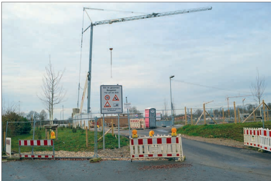
Noch bis Mitte 2022 wird der Fußweg zum Alten Angerbach von der Hermann-Spillecke-Straße aus voraussichtlich gesperrt sein.

Vor kurzem hat die Wohnungsbaugesellschaft die letzten der 32 Baugrundstücke