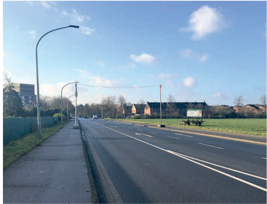
Ohne Wellen und Dellen: Ein neuer Belag sorgt auf der vielbefahrenen Uerdinger Straße jetzt für eine erhebliche Lärmreduzierung.

Den Dank vieler Bürgerinnen und Bürger sowie den eigenen hat der CDU-Ortsverband Mündelheim/Ehingen/Serm an die Mitarbeiterinnen und Mitarbeiter des Bezirksamtes Süd und Straßen.NRW weiter gegeben: Alle freuen sich sehr über die Erneuerung des Straßenbelags. sam