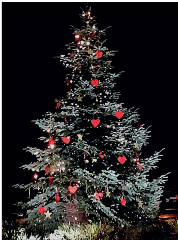
Er steht, trotz Wind und Wetter und erfreut die Herzen aller, die ihn sehen: Der Weihnachtsbaum in Angermund auf dem Kreisverkehr.