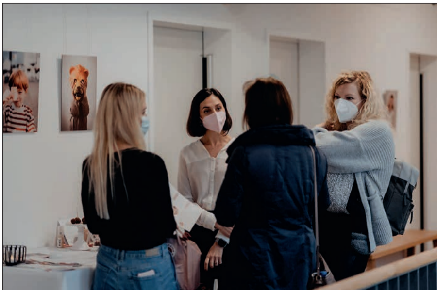
Viele Gespräche konnten auf der 1. Babymesse im Kiwifalter geführt werden.