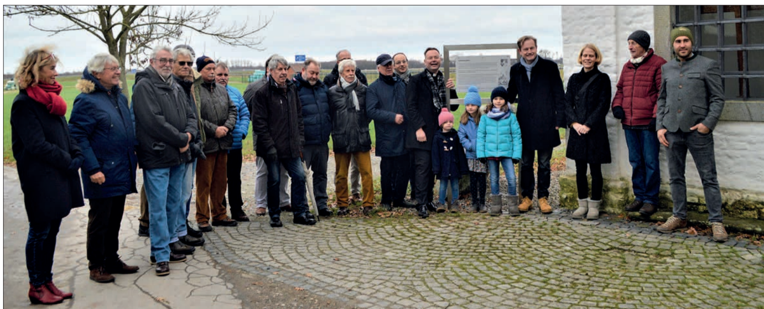
Vertreter mehrerer Vereine, unter anderem auch der Schützenbruderschaft Angermund, waren zur Enthüllung des neuen Schildes an der Hubertuskapelle gekommen. Es war zwar sehr kalt, aber immerhin trocken.

Wiedererkennung hervor, der nun städteübergreifend gelte. Der dazugehörige Wanderführer sei derzeit vergriffen, werde aber neu aufgelegt. Bei einer Erbsensuppe auf dem Sonnenhof klang die Veranstaltung im kleinen Rahmen aus. sam