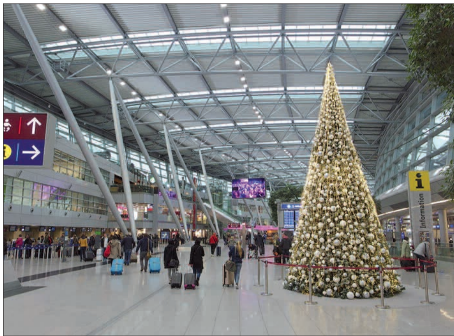
Der Weihnachtsbaum mitten auf der Abflugebene im Flughafenterminal strahlt bis in den Januar hinein.

Ankunftsebene hat ebenfalls an allen Tagen geöffnet. Es gibt kreative und auch hohen Ansprüchen genügende Geschenkideen für sie, ihn & Kids, mit tollen Rabatten (mehr unter www.enjoydus.com ). Beim Kauf eines der Angebote bis 24. Dezember gibt es einen Düsseldorfer Minibutterstollen der Qualitätsbäckerei Terbuyken als Geschenk dazu. Auf Wunsch wird das Geschenk weihnachtlich verpackt. An der Weihnachtsfotobox im Weihnachtsshop auf der Abflugebene kann man sich seine individuelle Postkarte erstellen lassen, gleich zum Losschicken oder auch als Erinnerung zum Mitnehmen. Beim Kauf eines der Angebote gibt es das Porto geschenkt. Insgesamt bieten sich im Terminal rund 100 Shops, Bars und Restaurants an, von Starbucks auf der Galerie mit Ausblick auf das Treiben in der Abflughalle, bis zur gemütlichen Ecke auf der Ankunftsebene. In 40 Reisebüros auf den beiden oberen Ebenen lässt sich noch ein Last-Minute-