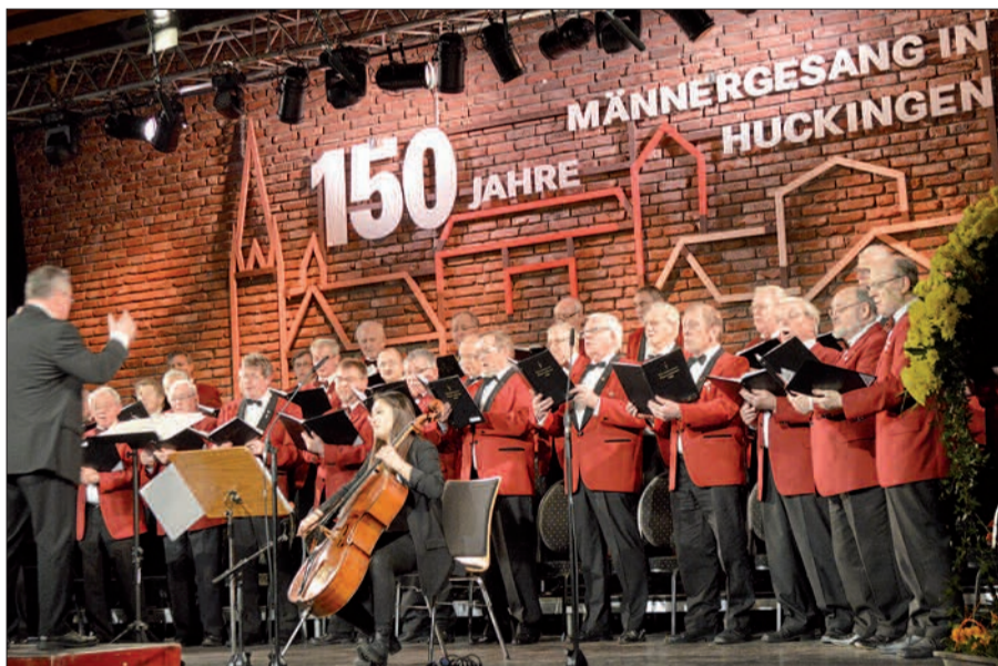
Vor zwei Jahren feierte der MGV Erholung Huckingen sein 150-jähriges Bestehen mit einem festlichen Konzert - nun ist der Chor letztmalig am 23. Dezember zu hören. Er löst sich zum Jahresende auf.