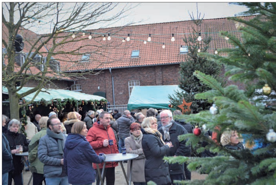
Traditionell treffen sich am dritten Adventswochenende Besucher aus nah und fern zum beliebten Huckinger Weihnachtsmarkt.

16.30 Uhr lädt der Chor "kukacor" die Besucher zum Mitsingen der Weihnachtslieder ein, am Sonntag ist um 15 Uhr das "Wanheimer Hörnercorps" zu hören. Nach dem Osterfeuer, dem Tanz in den Mai und das Schützen- und Volksfest ist der Weihnachtsmarkt für dieses Jahr die letzte Veranstaltung für die Bürger. Der Weihnachtsmarkt ist seit Beginn auch ein Treffpunkt für alle Bürger und auch ehemalige Huckinger, die gerne hierhin kommen, um alte Freunde und Nachbarn zu treffen. Der Reinerlös des diesjährigen Weihnachtsmarktes kommt wieder dem Hospiz St. Raphael am Malteser Krankenhaus St. Anna in Huckingen zugute. sam