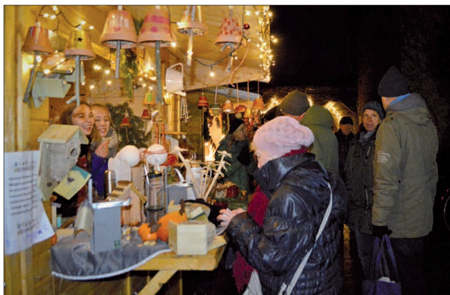
Trotz seiner jungen Geschichte hat sich der Weihnachtsmarkt am Zwiebelturm in Rahm schon zu einem beliebten Treffpunkt entwickelt.

Geschichte vor. Anschließend hängen die Mädchen und Jungen den selbst gebastelten Schmuck am großen Tannenbaum an der Kirche auf. sam