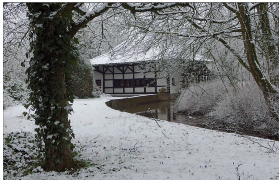
Weißer Weihnacht ist im Rheinland eher selten. Wenn aber Schnee fällt, verzaubert er das Land wie hier an der Kalkumer Wassermühle im Dezember 2017.

Ein ereignisreiches Jahr geht dem Ende zu. Die Weihnachtsfeiertage und der Jahreswechsel sind wieder Gelegenheit, in der alltäglichen Geschäftigkeit und Hektik innezuhalten, mal zur Ruhe zu kommen, dankbar zu sein für das Erreichte. Wir sollten in diesen Tagen Muße und Erholung finden, uns den Herausforderungen des Neuen Jahres gestärkt und mit frischer Tatkraft zu stellen. Das Team der NORDBOTE dankt allen Lesern und Inserenten für das Vertrauen und die Treue, die ihm auch in diesem Jahr wieder entgegengebracht wurden. Wir sind dankbar, liebe Leserinnen, Leser und Inserenten, dass wir als kleines Team mit Ihrer Unterstüt-