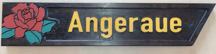
Neue Holzschilder für Angermund wird es 2019 geben. Sie sind auch Eiche, dunkelbraun gebeizt und die Rose ist nun links angebracht.