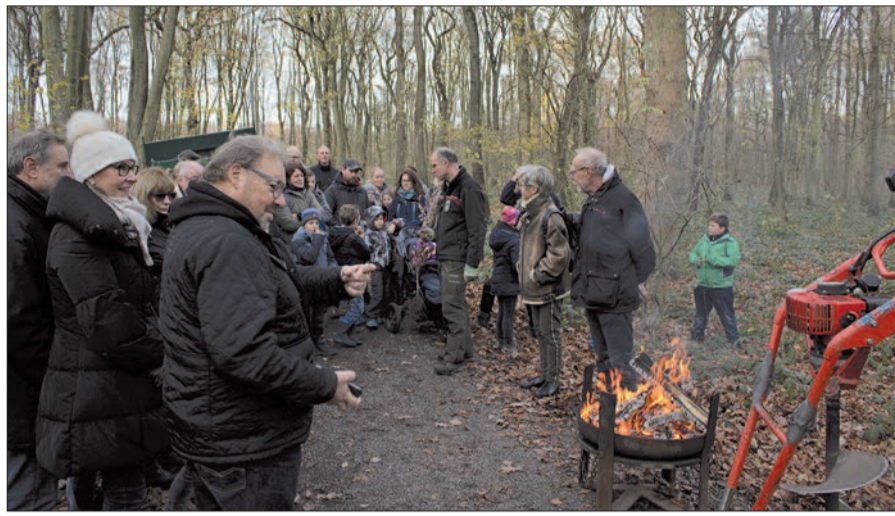
28 Mädchen und Jungen waren in Begleitung gekommen, um mit dem Stadtförster und Vertretern des CDU-Ortsvereins viel über das Zusammenspiel zwischen Wild, Wald und Natur zu begreifen.

Mit Hilfe von Förster Jeschke durften sie mittels „Baumfuchs“ Pflanzlöcher in den Waldboden bohren und anschließend die jungen Pflanzen unter fachgerechter Anleitung einsetzen. Der Experte erläuterte auch die besondere Artenvielfalt der Tiere und Pflanzen in diesem Waldgebiet und das Zusammenspiel zwischen Wild, Wald und Natur. Am Ende dieser interessanten Pflanzaktion durften sich alle Beteiligten am Grill- und Getränkestand stärken.