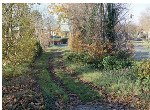
Wer vermutet schon mitten im Verkehrsknoten Niederrheinstraße/Alte Landstraße einen so idyllischen, unbefestigten Weg? Es gibt nichts daran zu beanstanden. Es ist der Reitweg von Lohausen zum Kalkumer Wald, der hier über den sehr belebten, überlasteten Verkehrsknoten geführt wird. Text u. Foto: H.S.

ße (Irmerstraße bis Am Hain), Heiderweg (Heiderpatt bis Baggerloch), Josef Brodman-Straße, Köhlstraße, Neusser Weg (Bereich ohne Bebauung). Die vorliegende Zustandsbewertung gibt keine Auskunft über das Vorhandensein und den Zustand von Bürgersteigen. Auch über Radwege ist nichts aus der Vorlage für die Bezirksvertretung 5 zu entnehmen. Man vermisst in dieser Bewertung außerdem das Wittgatt als nördliche Ausfahrt aus Wittlaer-Bockum zur Duisburger Landstraße und B 8n. Das Wittgatt führt durch Wasserschutzgebiet und hat als Wirtschaftsweg zwar eine ordentliche Asphaltdecke, ist aber für