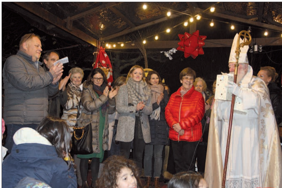
Schließlich sind alle Schenkenden auf der Bühne des Weihnachtsdorfs vereint. Über 200 Geschenke sind für die Bewohner des Altenstammhauses zusammen gekommen.