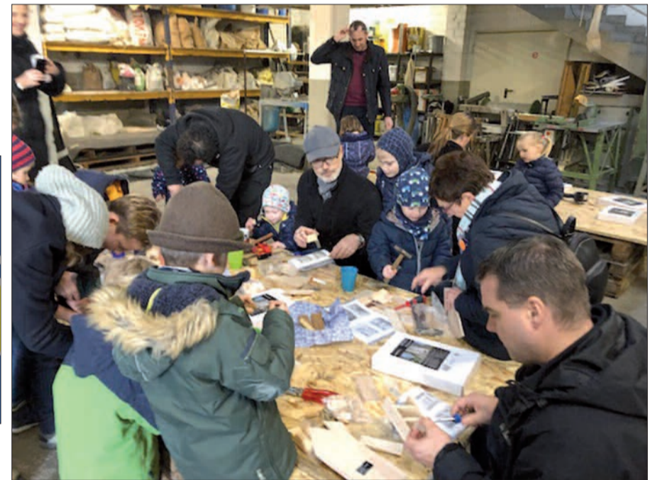
Emsig und konzentriert waren Groß und Klein beim Zusammenbau der Insektenhotels dabei.

Kinder und Natur und Tiere – das passt zusammen wie Sonne, Mond und Sterne. In der Kita Angeraue haben sich die Kinder mit „Artenvielfalt in der Stadt“ befasst. Von der Raupe bis zum Schmetterling haben sie alles unter die Lupe genommen und genau erfasst. Auch die Bienen fanden die Kinder spannend. Und haben längst gelernt, dass die Bienen bis zu 80 Prozent der Pflanzen und Bäume bestäuben, weil sie den Nektar daraus zur Ernährung brauchen. Das ist der Kreislauf des Lebens: Bienen brau- chen Pflanzen und Bäume, um Nektar zu sammeln, und die Bäume brauchen die Bienen, um ihre Pollen zu verbreiten und sich zu vermehren. In den vergangenen Jahren ist der Bestand an Bienen drastisch zurückgegangen. Und nachdem Kinder und Eltern einmal für das Thema brannten, hat der Förderverein der städtischen Kita notwendige Materialien und alles, was es braucht, um Bausätze für Insektenhotels zu kaufen, beschafft. Allianz-Versicherung Angermund hat das Projekt unterstützt Michaela Zgorecki von der Allianz-Versicherung in Angermund hat das Projekt maßgeblich mit einer Spende unterstützt. Diese Spende hat es ermöglicht, dass alle interessierten Eltern und Kinder der Kita sich die Bausätze anschaffen konnten. Ab sofort haben also viele kleine und große Leute ihre Insektenhotels im Garten. Erst vor wenigen Tagen haben sich alle bei Martin Schilling Bedachungen in Großbaum getroffen, um in gemütlicher Runde die Hotels zusammenzusetzen.