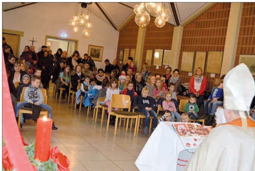
Mit dem ersten Weihnachtsmarkt am Rahmer Zwiebelturm hat die örtliche Schützenbruderschaft ein schönes Fest für die Gemeinschaft geschaffen – viele, viele Kinder lauschten im Gemeindefest, wie der Nikolaus vorlas (Bericht S. 9).