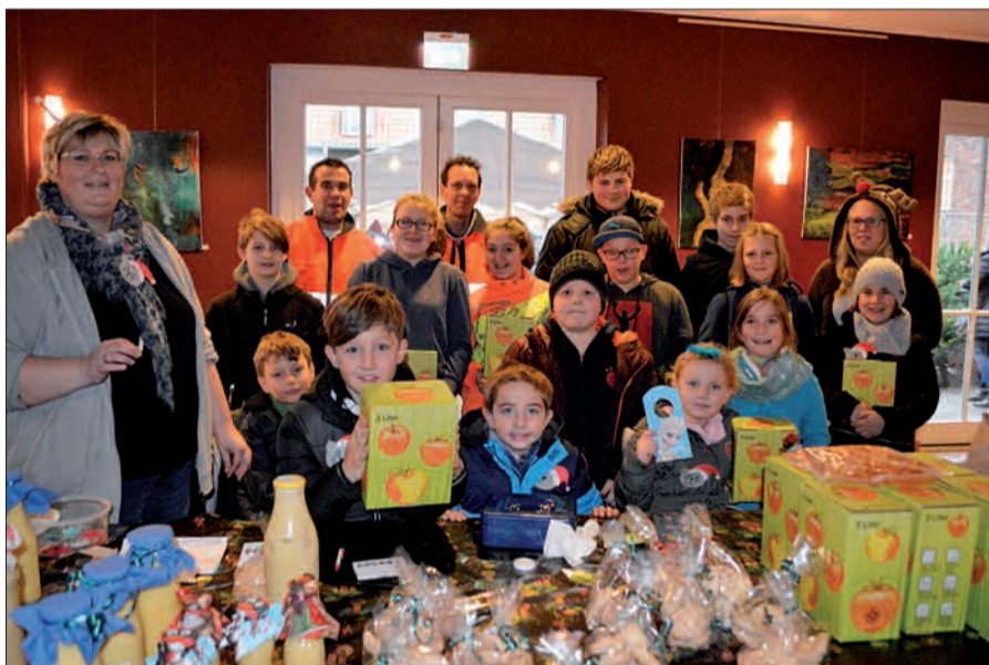
Viele Schülerschützen hatten im Herbst auf den städtischen Obstwiesen Äpfel gesammelt, um sie anschließend zu Saft zu verarbeiten. Er wurde für einen guten Zweck verkauft.