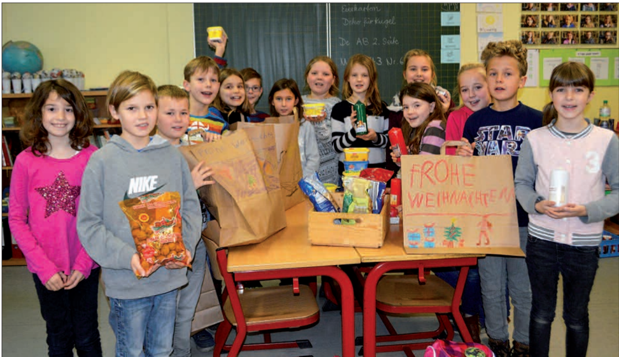
Viertklässler packten - wie alle anderen Kinder der Rahmer Grundschule - eifrig Tüten, die sie zuvor hübsch verziert hatten. „Frohe Weihnachten“ wünschen sie auch den Menschen, denen es nicht so gut geht.