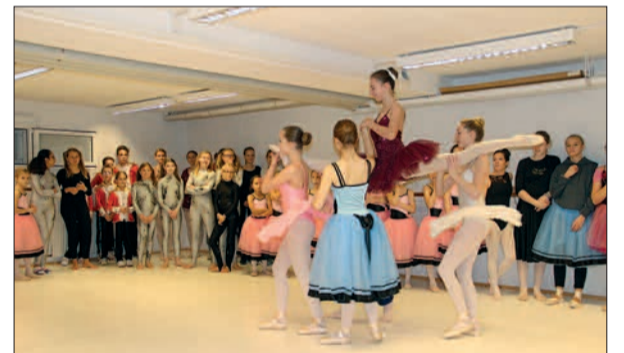
Mitten in den Proben tanzen die ELEVINNEN von Ballett & Bewegung unermüdlich, damit jeder Schritt, jede Bewegung sitzt. Übermorgen, am vierten Advent, ist die Premiere in der Rheinoper in Düsseldorf.