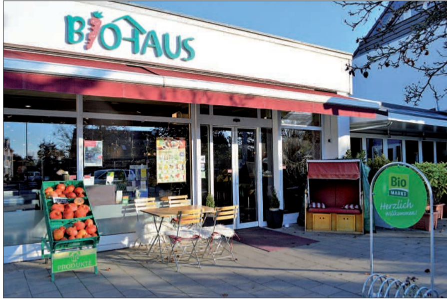
Das „Biohaus Lohausen“ ist am Kreisverkehr nicht mehr weg zu denken und gehört fest zur örtlichen Einkaufsgemeinschaft.

Das „Biohaus Lohausen“ der Lyding GmbH befindet sich an der Niederrheinstraße 71 in 40474 Düsseldorf-Lohausen. Es ist montags bis freitags von 8 bis 20 Uhr sowie samstags von 8 bis 18 Uhr geöffnet und unter der Rufnummer 0211/98483601 zu erreichen. Weitere Informationen findet man im Internet unter www.biohaus-muelheim.de