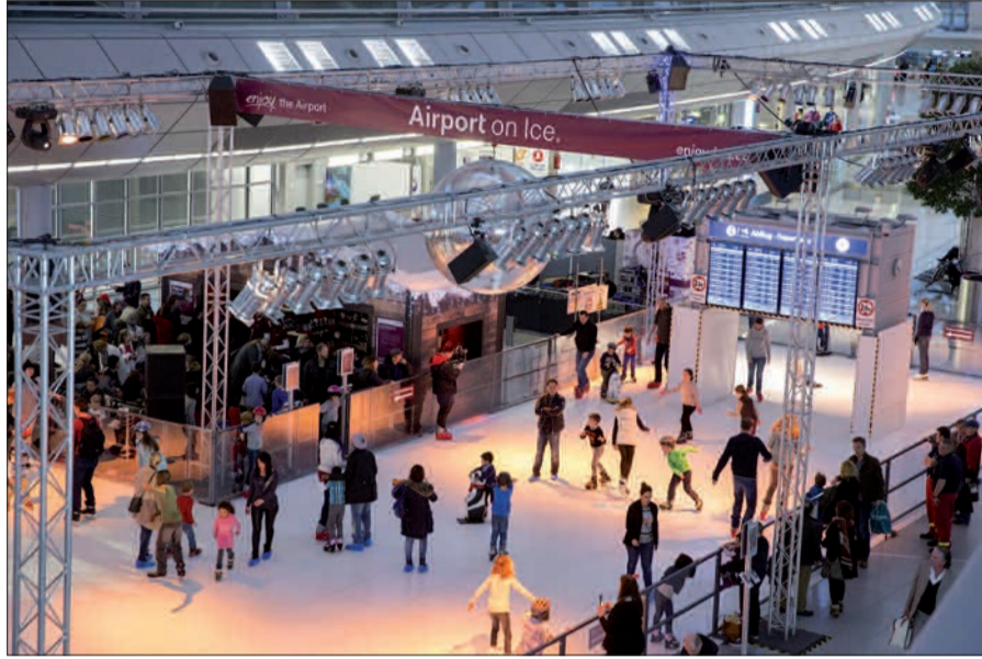
Schlittschuhlauf im Flughafen-Terminal.

Szewczenko waren auch schon da. Während der Woche ist auf der 350 qm großen Fläche eine 120 m lange Modelleisenbahn aufgebaut. Deren Ladung verrät viele tolle Geschenkideen und Angebote aus den 60 Restaurants und Shops im Terminal. Ein Weihnachtsmarktbummel besonderer Art, trocken, überdacht im weihnachtlichen Terminal und ohne Parkprobleme. Ab einem Einkauf in Höhe von € 10,- gibt's eine Parkpauschale von € 5,- von 10 bis 20 Uhr (nicht auf P 11, 12, Maritim-Parkhaus und am Fernbahnhof, Einfahrt-Ticket bei der Park-Service-Zentrale im EG Parkhaus 3 umtauschen, nicht möglich bei Einfahrt mit EC-, Kredit- oder Parkkarte). H.S.