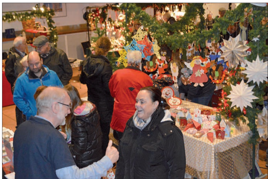
Im Warmen konnten die Besucher des Huckinger Weihnachtsmarktes im Steinhof gemütlich nach hübschen Dekorationen sowie Geschenken für Weihnachten suchen. Verschiedene Huckinger Vereine waren mit Ständen präsent.

Die St. Sebastianus Schützenbruderschaft Huckingen stellt die Weichen für die Zukunft und richtet ihr Schützenfest neu aus. In einer außerordentlichen Mitgliederversammlung, zu der fast 100 Mitglieder erschienen waren, wurde der Ablauf des Schützen- und Volksfestes ab 2016 neu festgelegt. Das Schützen- und Volksfest wird ab nächstem Jahr nicht mehr von samstags bis montags, sondern von freitags bis sonntags gefeiert.