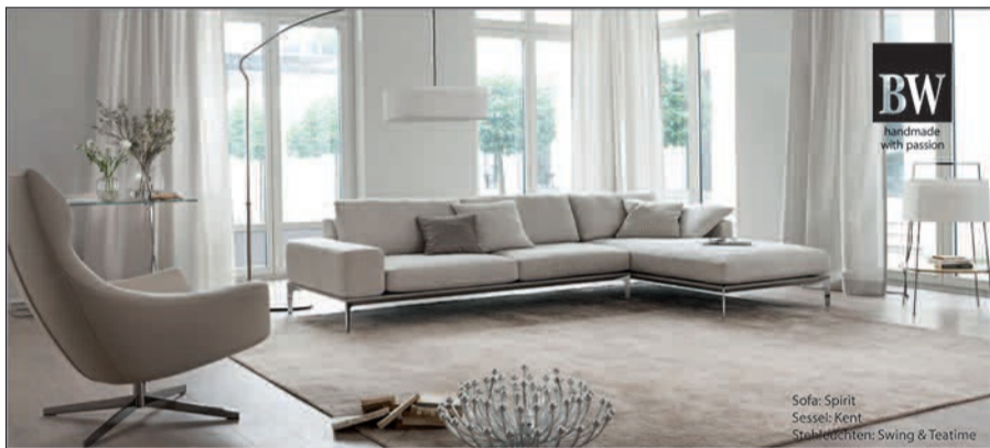
Sofa: Spirit Sessel: Kent Strahlentisch: Swing & Teatime