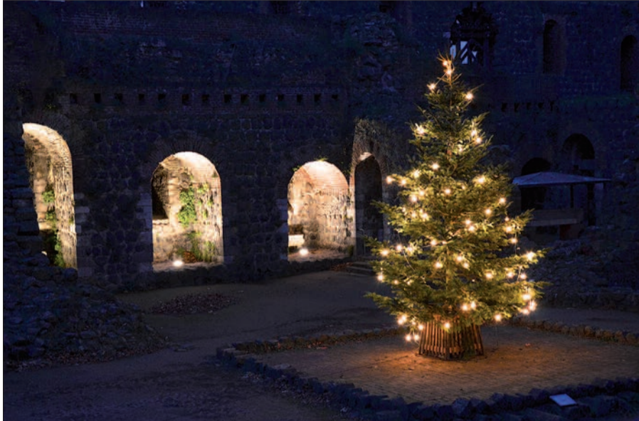
Hübsch beleuchtet ist der Tannenbaum in der Kaiserpfalz, den der Förderverein Kaiserswerth e.V. gestiftet hat. Alle Jahre wieder hoffentlich!

Endlich ist es uns nach Jahren wieder gelungen, einen wunderschönen Weihnachtsbaum mitten in der Kaiserpfalz aufzustellen. Aus diesem Grunde trafen sich am vergangenen Sonntag zahlreiche Mitglieder und Freunde des Förderverein Kaiserpfalz Kaiserswerth e.V. mit ihren Familien zum gemeinsamen Adventsliedersingen auf dem Gelände der Burgruine. Bei Glühwein war im Anschluss außerdem Gelegenheit zum vorweihnachtlichen Beisammensein.