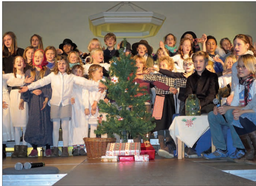
Mit viel „Wir-Gefühl“ und großem Engagement unter allen Mitwirkenden brachte die Kantorei Kaiserswerth am 3. Adventssonntag das Kinder-Musical „Die sonderbare (Weihnachts)nacht“ in der ev. Stadtkirche auf die Bühne.