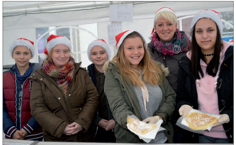
Die Rahmer Jungschützen unterstützten den Weihnachtsmarkt mit frisch gebackenen Waffeln und selbst gebrannten Mandeln.

abschüssig und werde ohne Ampel von vielen Kindern als Schulweg genutzt. Nicht nachvollziehen können die örtlichen Lärm- und Verkehrsexperten, warum es innerhalb des Stadtgebiets eine Ungleichbehandlung gebe, denn auf der Nord-Süd-Achse sei das Tempo durchgängig eingeschränkt. Weihnachtsmarkt Auch in diesem Jahr war der Weihnachtsmarkt des Bürgervers Großbaum-Rahm gut besucht. Neben Kunsthandwerkern beteiligten sich auch mehrere Vereine am Gelingen des Marktes. So backten die Rahmer Jungschützen beispielsweise wieder zahlreiche Waffeln und verwöhnten die Marktbesucher mit selbst gebackenen Mandeln. Leckere Apfelmose von österreichischen Streuobstwiesen schenkten die Mitglieder des Rahmer Traktor-Clubs aus. Die Pfadfinder küm-