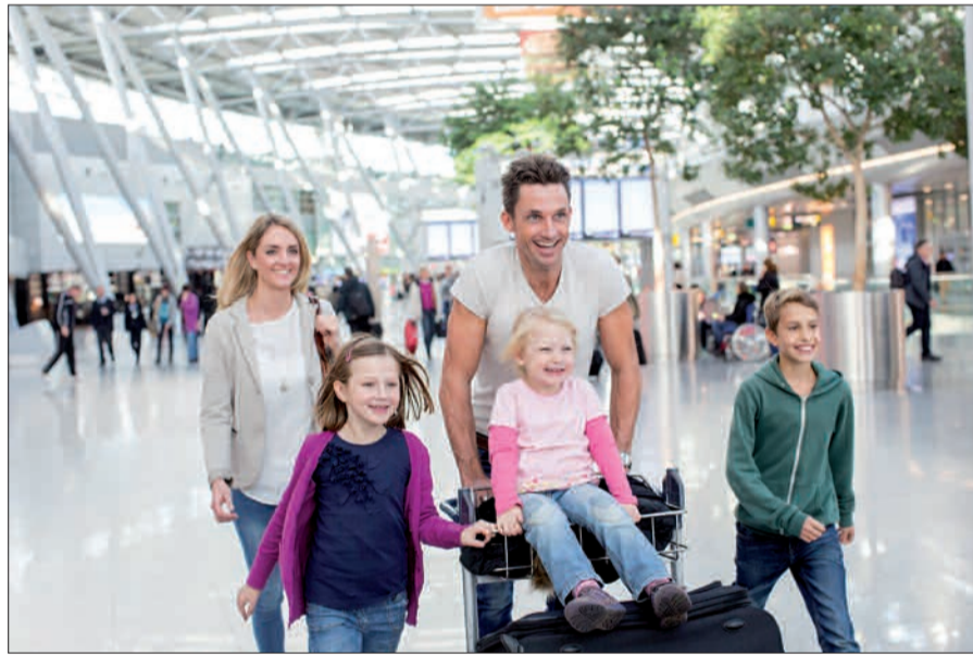
Flughafen und Luftverkehr sind inzwischen längst akzeptiertes und häufig genutztes Verkehrsmittel wie Eisenbahn und Kraftfahrzeug, trotz der damit verbundenen Emissionen.

bilen Gesellschaft dazu gehört, als Bürger auch mit einer gewissen Lärmbelastung durch Verkehrsmittel umzugehen, beantworten insgesamt 73 % mit ja, noch 65 % mit ja, wenn sie sich durch Fluglärm gestört fühlen. Persönlich gestört durch Fluglärm fühlen sich 16 % der Bürger sehr stark oder stark, aber auch 31 % durch Straßenlärm, 14 % durch Eisenbahnlärm, 13 % durch Lärm aus der Nachbarschaft und 12 % von Lärm durch Industrie und Gewerbe. Auf Gemeinden bezogen sind in dieser Statistik Ratings, Kaarst und Meerbusch Ausreißer mit 33, 34 bzw. 44 % stark oder sehr stark vom Fluglärm gestörter Bürger.