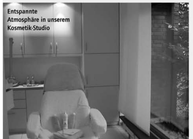
Entspannte Atmosphäre in unserem Kosmetik-Studio

Parfümerie Platen Klemensviertel – Am Kreuzberg 6 40489 Düsseldorf-Kaiserswerth Tel.: 0211 / 600 99 10 Mail: info@parfuemerie-platen.de Web : www.parfuemerie-platen.de