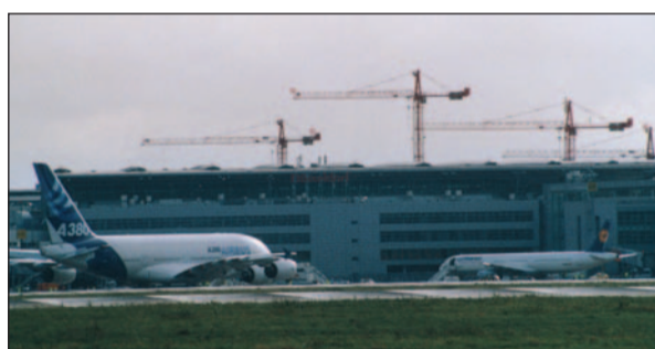
Ziel der neugierigen Technik-Fans am 13. Nov.: Der Airbus A 380 von Zeppenheim aus gesehen (mit Teleobjektiv). Ein Goliath unter den heutigen Verkehrsflugzeugen.

und alle Wohnstrassen von Lohausen bis Zeppenheim, vom Ansturm auf den Flughafen gar nicht zu reden. Den Flugbetrieb selbst aber ließen sie unbehelligt, kein Fluggast verpasste die pünktlichen Flieger (aber mancher Fan