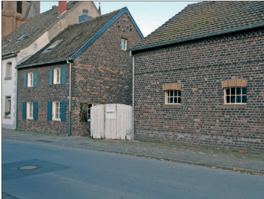
Im Schatten des Huckinger Doms St. Peter und Paul liegt der mehr als 200 Jahre alte Maßhoff-Hof an der Raiffeisenstraße, der seit Anno 1983 die Heimat von „quadrat“ ist.