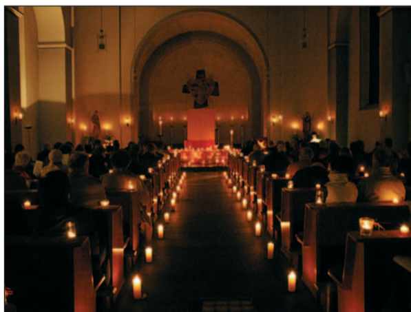
Warme Farben sowie das Kerzenlicht schafften bei dem zweiten ökumenischen Gottesdienst im Zeichen der Taizé-Gebete eine besinnliche Atmosphäre in der Herz-Jesu Kirche in Serm.

Unter dem Motto „Bei Gott bin ich geborgen“ fand am Sonntag, den 12. November in der Kirche Herz-Jesu in Serm der zweite ökumenische Gottesdienst im Zeichen der Taizé-Gebete statt. Das Schlüsselwort von Taizé ist Versöhnung. Zuerst natürlich mit Gott und mit sich selbst. Das aber bedarf der Stille – in erster Linie einer