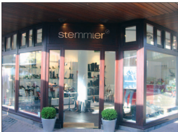
Eine Augenweide schon von außen ist Stemmler Shoes im Kaiserswerther Klemensviertel.