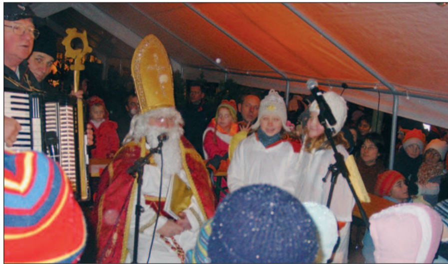
Kinderaugen leuchten, wenn der Nikolaus endlich da ist. Fotos & Text: G. Schreckenberg

Nikolausmarkt in Angermund 2. Dezember, Graf-Engelbert-Straße, 13-21 Uhr 16 Uhr Lesung Ute Nicolas (Bürgerhaus) 17 Uhr Der Nikolaus kommt 15 & 19 Uhr Adventliches Konzert in der St. Agnes Kirche mit Johannes Kohlhaus & Mitgliedern der Clara-Schumann-Musikschule