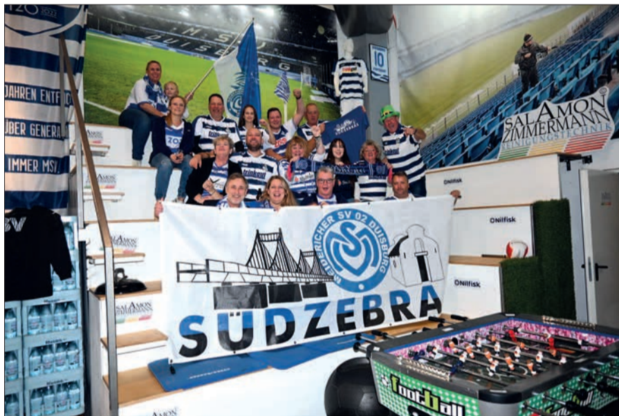
Viele Mitglieder der Südzebras unterhielten sich noch lange nach der Fotoaufnahme vor der neun Meter hohen MSV-Kulisse.