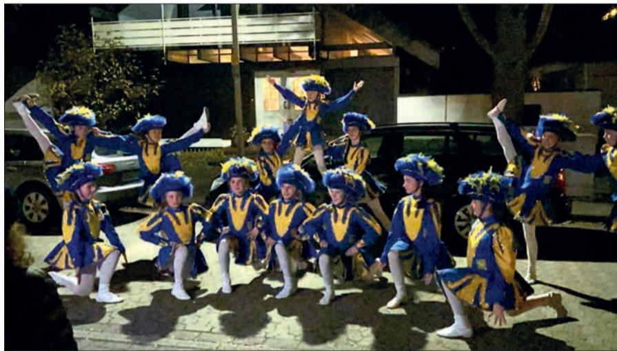
Die Angersternchen der Karnevalsgesellschaft „De 11 Pille“, die bei ihrem nächtlichen Auftritt als Dankeschön ihren diesjährigen Gardetanz aufführten.