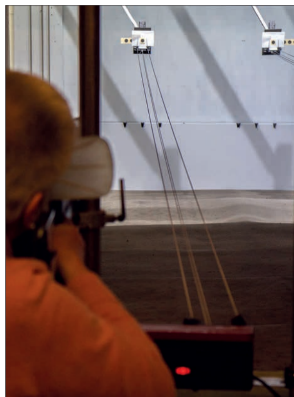
Wer zielt am besten beim Nikolausschießen? Ein Kandidat am Luftgewehrschießstand in Angermund.

Am Dienstag, 5. Dezember, startet die St. Sebastianus Bruderschaft Angermund wieder ihr beliebtes Nikolausschießen für Jedermann im Schützenhaus, Freiheits-hagen 33. Von 19 bis 22 Uhr können sich dann „die Profis“ des Vereins mit allen „Möchtegern“ duellieren. Im Vordergrund steht allerdings das gemütliche Beisammensein. Als Trostpreis wird jeder Schütze mit einem kleinen Nikolausgeschenk wieder nach Hause gehen können. Die Schützenbruderschaft freut sich, viele Teilnehmer und Teilnehmerinnen – insbesondere auch Nicht-Schützenmitglieder – begrüßen zu dürfen. VJ