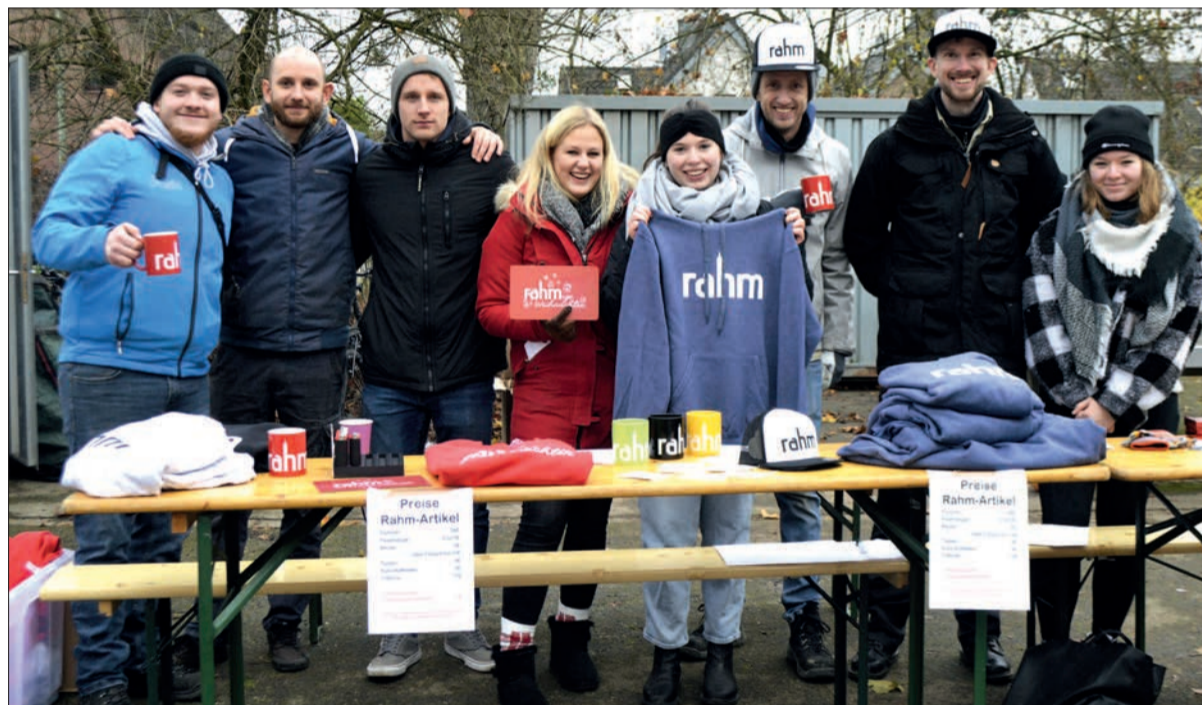
Die Rahmer Pfadfinder kümmern sich nicht nur um den Abtransport der Weihnachtsbäume, sie verkaufen auch schöne Rahm-Artikel.

Zur großen Weihnachtsbaum-Aktion laden der Förderverein der Grundschule Rahm und die Pfadfinderschaft Rahm am Samstag, 16. Dezember, auf den Schulhof der Grundschule Rahm, Am Knappert, ein. Dort können zwischen 10 und 14 Uhr frisch geschlagene und unbehandelte Nordmannentannen aus dem Sauerland gekauft werden. Die Preise liegen in diesem Jahr bei 40 Euro für Tannen zwischen 1,50 und 2 Meter sowie bei 50 Euro für Bäume zwischen 2 und 2,50 Meter. Auf Wunsch werden die Tannen nach Hause geliefert – darum kümmern sich die Rahmer Pfadfinder. Die Lieferpreise betragen 4 Euro für Rahm und 6 Euro für Angermund sowie Großbaum. Wie in den vergangenen