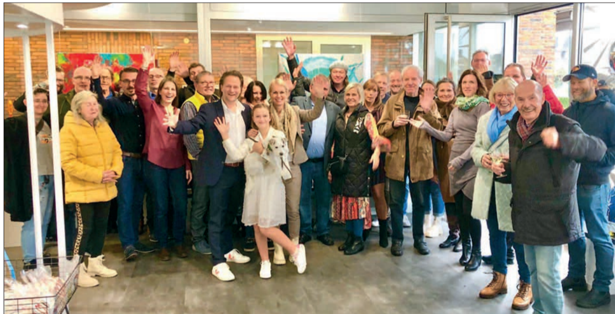
Gern kamen die Angermunder*innen am 4. November zur Eröffnung von Erdmann Art + Events.

der verkauft hat, ist eine schöne Zugabe. Nun läuft der Geschäftsbetrieb bei Erdmann Art + Events. GS