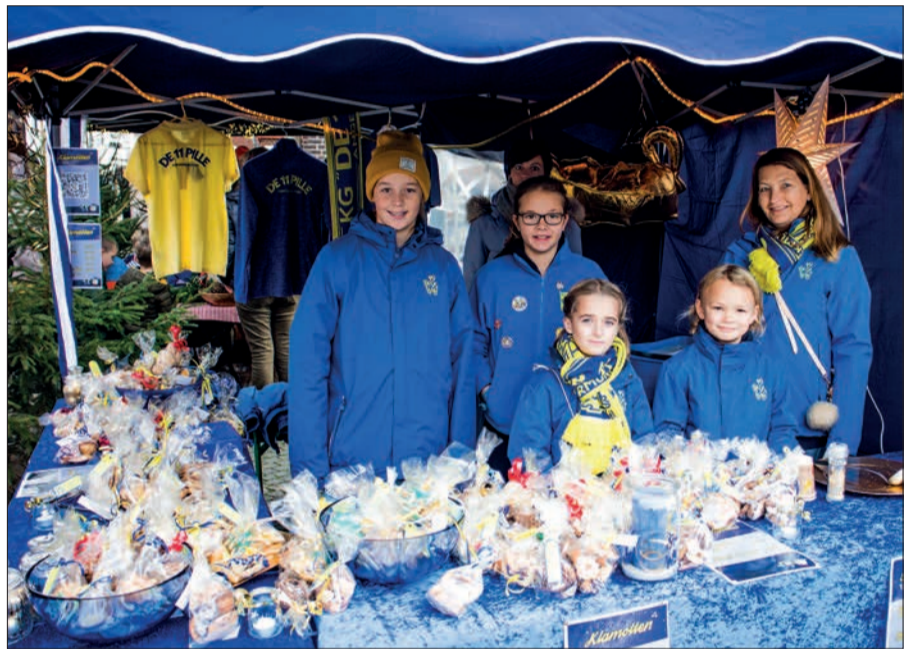
Auch die Karnevalisten von „De 11 Pille“ aus Angermund werden natürlich wieder in ihrem Karnevalsoutfit erscheinen und viel Selbstgebackenes anbieten. Darüber hinaus kann man aber auch noch viele (teilweise sehr wärmende) Accessoires in den Farben des Vereins erwerben.

seinem goldenen Buch vorlesen und am Ende wie immer „milde Gaben“ verteilen. Weihnachtslieder sind wie im letzten Jahr vor der St. Agnes Kirche von den Kindern der „Singpause“ der Gemeinschaftsschule Friedrich-von-Spee gegen 14.00 Uhr und gegen 17.30 Uhr von Jennifer Isen-