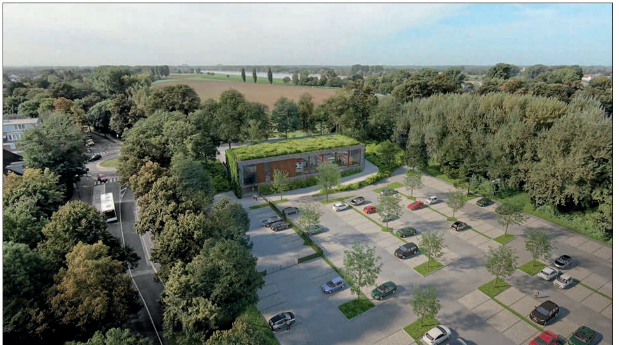
So soll die neue Feuerwache Kaiserswerth auf dem Dreiecksparkplatz aussehen.

Modernste Technik An moderner Technik und Nachhaltigkeit bei den verwendeten Bausubstanzen