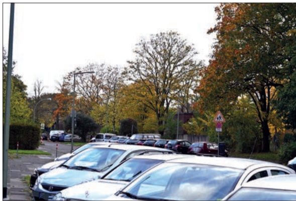
An der Albert-Schweitzer-Grundschule in Huckingen soll bald die Einbahnstraßenregelung probeweise umgesetzt werden.

der Wohneinheiten von ursprünglich 250 auf 300 erhöht worden. Statt Hochparkhaus sollen alle Parkplätze für Mieter und Gäste in einer Tiefgarage angelegt werden, auch Ladestation für E-Mobilität - bis auf wenige Ausnahmen vor kleineren Gewerbeeinheiten und der Kita. Das Wohngebiet soll weitgehend frei von motorisiertem Verkehr bleiben. Manual Gatzweiler vom Planungsamt der Stadt erklärte, dass sich die Verwaltung darum bemühen werde, die stillgelegte Buslinie zu aktivieren. Bei Politikern und Anwohnern wurde die große Sorge vor (weiterer) Parkplatznot deutlich. sam