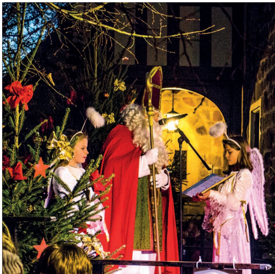
Der Nikolaus begleitet von zwei Engelchen bei seiner Ansprache.