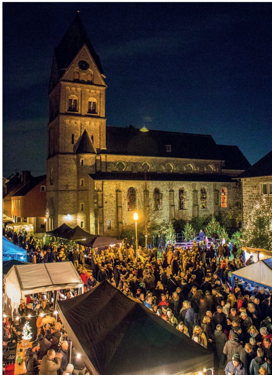
Die Stimmung ist wie immer auf dem Angermunder Nikolausmarkt ausgezeichnet.