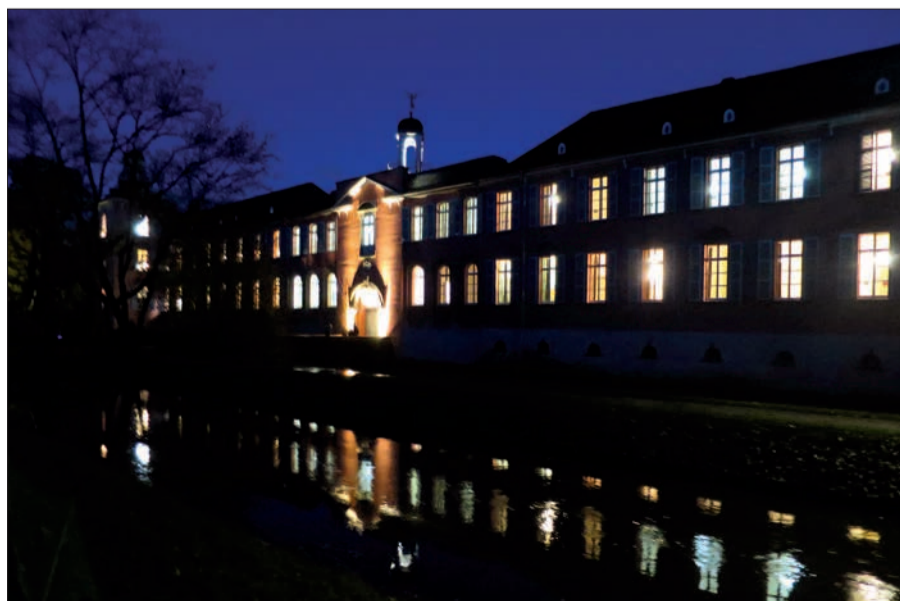
Das zum St. Martins-Abend hell erleuchtete Kalkumer Schloss.