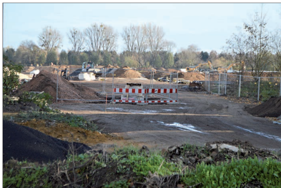
Im Neubaugebiet am Alten Angerbach in Huckingen läuft die Erschließung auf Hochtouren. Alle Straßen sollen nach Frauennamen benannt werden.