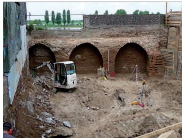
Die freigelegte Rückseite der Hochwasserschutzmauer bei Bauarbeiten 2009 am Mühlenturm. So dürfte sie auch im jetzt sanierungsbedürftigen Bereich aussehen. Archivfoto: H.S.

Seit Jahren wird in Kaiserswerth die Hochwasserschutzmauer entlang der Rheinuferpromenade beobachtet und immer wieder vermessen. Zwischen Rheintor und Mühlenturm neigt sich die Oberkante der 2,5 bis 4 Meter hohen Ziegelmauer jährlich 1 cm in Richtung Rhein. Eine oberhalb stehende Blutbuche soll mitverursachend sein. Schon 2019 waren Risse in der Mauer mit Zement verschmiert worden. Laut Stadtentwässerungsbetrieb sind dringend Sicherungsmaßnahmen erforderlich. Dies sei auch eine Auflage der Bezirksregierung. Als provisorische Maßnahme soll eine Stahlkonstruktion vor die Mauer gesetzt und mit 15 m langen Bodenschutzmastern landseitig befestigt werden. Baubeginn könnte noch im Dezember sein. Es wird eine Bauzeit von zwei Monaten veranschlagt und Gesamtkosten von 2 Mio Euro. Eine dauerhafte Lösung, mit einer Betonwand hinter der Ziegelmauer, bedarf eines aufwendigen Planfeststellungsverfahrens, so der Stadtentwässerungsbetrieb. Es sei dann die gesamte Kaiserswerther Ufermauer bis zu Basilika einer Betrachtung zu unterziehen. Dabei stünde möglicherweise auch die Buche zu Disposition. H.S.