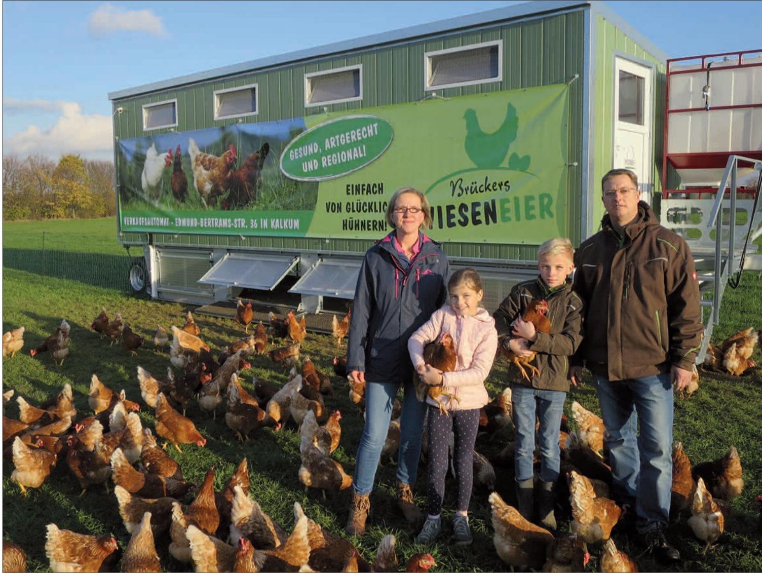
Gesunde Eier von glücklichen Hühnern. Brückers Hühnern auf den Zeppenheimer Wiesen geht es so gut, dass sie mit der Familie Freundschaft geschlossen haben.

und regionaler geht es nicht! Ein Stück weiter an der Edmund-Bertram-Straße am „Zeppenheimer Dreieck“ gibt es übrigens ab Anfang Dezember bei Manfred Filitz wieder frische Weihnachtsbäume aus dem Sauerland. H.S.