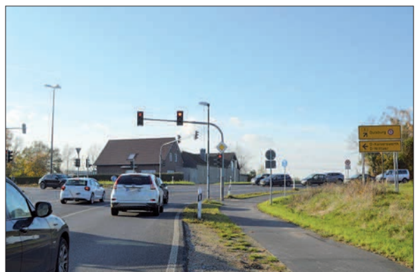
Nach dem Rückbau der alten B 8 soll die Hauptrichtung des Verkehrs nach Wittlaer fließen.

Hauptverkehrsrichtung nach Wittlaer führen. Die Ausschreibungen für den Rückbau laufen im Moment. Hinterlandt rechnet mit einer relativ kurzen Bauzeit – bis Ende 2021 sollte das Projekt dann ganz abgeschlossen sein.