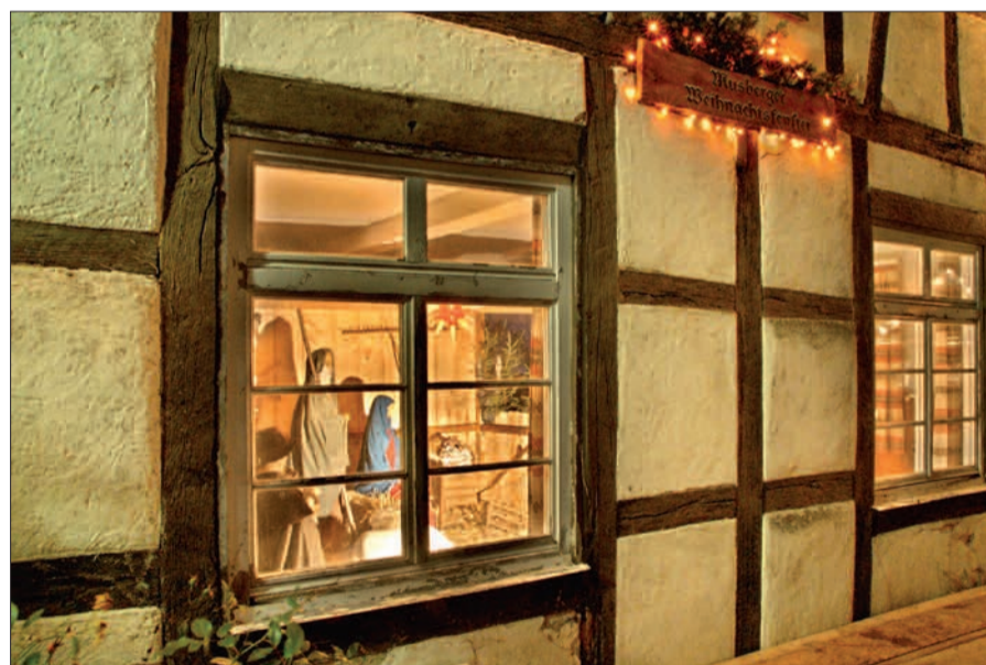
Hübsch geschmückte Fenster während der Adventszeit verkünden die Ankunft.