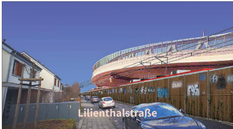
Ein Tunnel statt einer Hochbrücke für die U81 über Wohngebiete im Stockum (Visualisierung Heimat- und Bürgerverein Lohausen/Stockum) würde eine Hochbrücke im Flughafengelände (statt streckenweiser Tieflage und Tunnel der bisherigen Planung) mehr Sinn machen und mehr Akzeptanz finden.