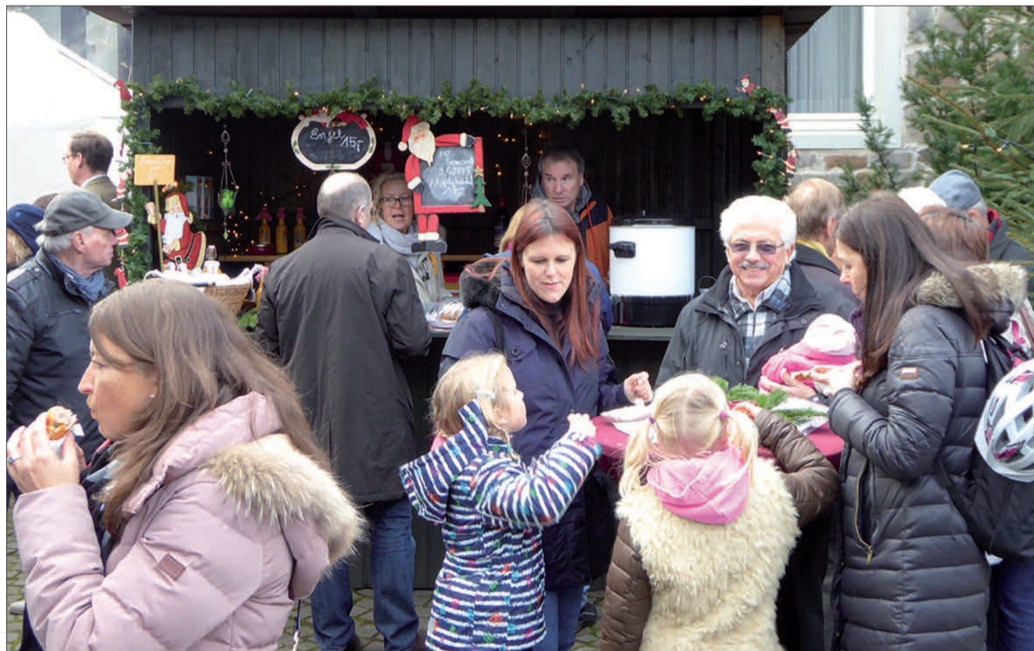
Was waren das für schöne Zeiten, als der Basar in Angermund einfach gemütlicher Treffpunkt für Angermunder und Anrainer war, die für den guten Zweck gekauft und gespeist haben. Die Aktionen laufen trotz Corona weiter.

„Natürlich möchten wir sie auch in diesem Jahr nicht im Stich lassen“, betont die engagierte Angermunderin. Deshalb ruft sie alle auf, trotz Corona zu spenden, damit diese Einrichtungen weiterhin arbeiten können. Die Kontonummer für Spenden: KG St. Agnes, Stadtparkasse Düsseldorf, DE 92 3005 0110 0078 0008 17/Verwendungszweck Basar 1900003001. G.S.