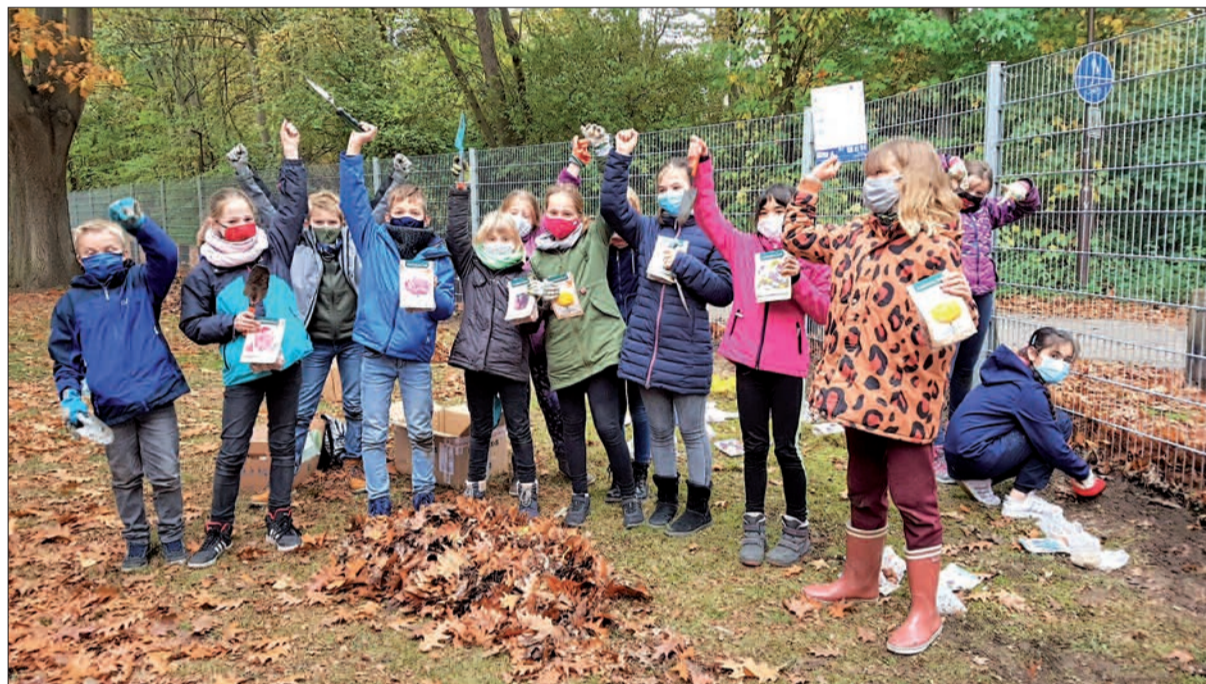
Viele helfende Hände vergruben zahlreiche Blumenzwiebeln auf dem MMG-Schulgelände. Im nächsten Jahr soll es hier sehr bunt werden – ein wichtiger Lebensraum für Insekten.

Narzissen- und Hyazinthenzwiebeln vergraben. Möglich geworden war die Pflanzaktion nicht zuletzt durch großzügige Blumenzwiebelspenden der Schulgemeinschaft.