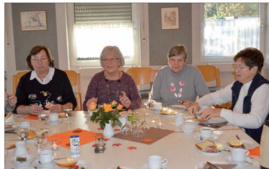
In geselliger Runde mundet es besser. Eingeladen sind alle Frauen aus dem Duisburger Süden.

Gerade jetzt in der Zeit der Weihnachtsmärkte haben die Trickdiebe Hochkonjunktur, so Schäfer. Meistens arbeiten sie zu zweit. Die Opfer werden angesprochen und abgelenkt. Jedoch: „Der beste Trickdieb ist nur so gut, wie sein Arm lang ist“, berichtet der Experte. Sein Rat: Eventuelle Täter auf Distanz bringen und energisch reden. Auch ein Schriallarm, den es in ver-