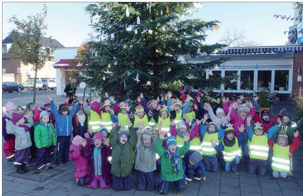
Stolz präsentierten sich Kinder zweier Lohauer Kindergärten vor der Lohauer Weihnachtstanne mit dem von ihnen gebastelten Baumschmuck.