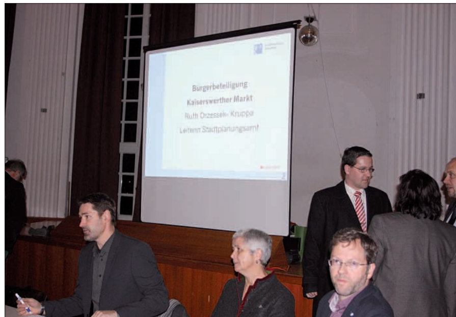
Der Verkehr am Kaiserswerther Markt war Hauptanliegen aller Menschen, die in die Aula geströmt waren, um der Bürgerbeteiligung beizuwohnen.