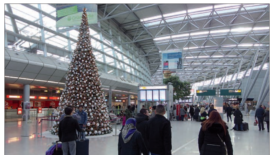
Festlich-Weihnachtliche Stimmung im Terminal.

für Kinder aller Altersklassen, Fahrten mit dem DUS-Express durchs Terminal, Pilotenschein erwerben mit den Mini-Tretflugzeugen, Basteln für Advents- oder Christbaumschmuck, Hüpfburg, Kinderschminken, Legoland, alles ist im Angebot. Dazu noch Flughafenrundfahrten, Führungen durch das Sheraton-Hotel, Gewinnen bei der Airport-Rally oder im Reisemarkt mit „Sie buchen, wir zahlen“. Geparkt wird für € 5,- pauschal von 10-20 Uhr (nicht auf P 11 und 12, Ticket an der Event-Info oder Parkservicezentrale im Parkhaus 3 bis 20 Uhr umtauschen).