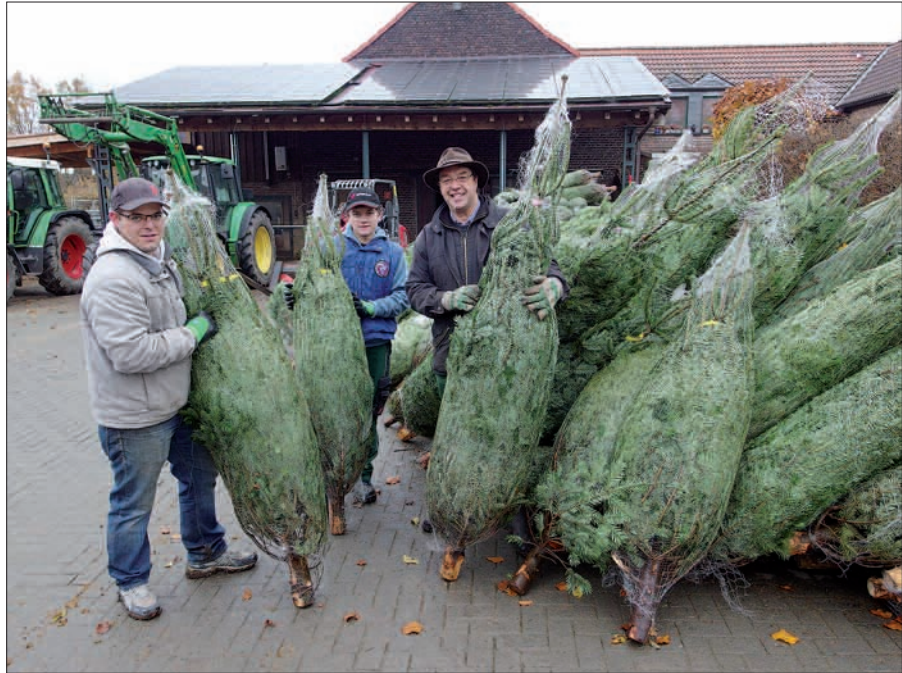
Berge von gut gewachsenen Nordmann-Tannen stapeln sich vor Weihnachten auf dem Hof vom Reitstall Hoffmann zum Verkauf.