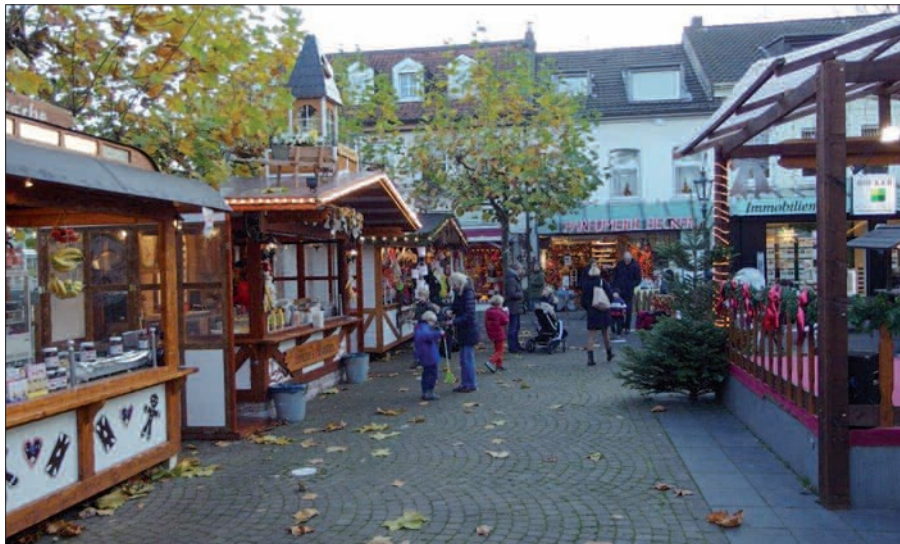
Der Weihnachtsmarkt Kaiserswerth ist die gemütliche Alternative für junge Familien und alle Anrainer und als Treffpunkt genial.