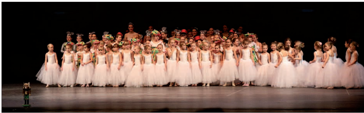
Bezaubernde kleine Elevelinen tanzten zum Klassiker, dem Nussknacker, in der Rheinoper Düsseldorf.