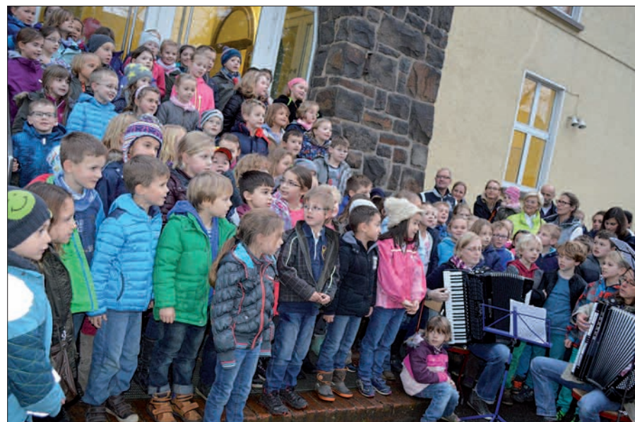
Wo sonst die Kinder lernen, spielen und singen – wie hier bei der Laternenausstellung, kann man sich auf die Suche nach dem schönsten Weihnachtsbaum in Rahm machen.

Zu einer guten Tradition hat sich die Zusammenarbeit zwischen FuF und den Rahmer Pfadfindern entwickelt: Auf Wunsch sorgen die Pfadfinder dafür, dass die Bäume gegen einen geringen Aufpreis nach Hause gebracht werden.