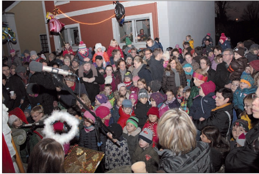
Menschenströme, große und kleine, junge und alte, füllten die Graf-Engelbert-Straße in Angermund am Samstag vor dem 1. Advent zum traditionellen Nikolausmarkt, und alle kamen ohne Gedränge ans Ziel. Den Nikolaus freute es.

schoben sich gemütlich, es gab kein Gedränge, nur gute Stimmung, Zeit für einen Plausch, zum Schauen, Bummeln und Kaufen. Ein wenig stiefmütterlich besucht war der Sternchenmarkt im Bürgerhaus-Garten. Aber der dort servierte Kinderpunsch erfreute sich doch großer Beliebtheit. Die St. Agnes Kirche war nachmittags gut besucht, der Chor „Colours of Singing“ hat wie stets für eine wunderbare vorweihnachtliche Stimmung bei seinem Konzert gesorgt. Die Hausmacherstände mit Marmelade, Glühwein, Crêpes, Reibekuchen, Grünkohl und Feuerzangenbowle waren alle bestens besucht. Gegen 20 Uhr lichteten sich die Besucherreihen, und ein hübscher Nikolausmarkt in Angermund ging allmählich zu Ende. G.S.