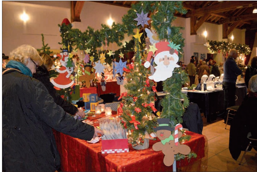
Bei jedem Wetter kann man gemütlich im Steinhof stöbern.