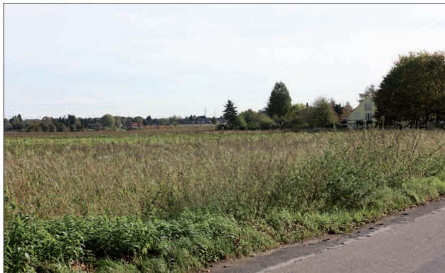
Das hat Seltenheitswert! Seit 20 Jahren ist keine Bauvoranfrage zweimal geheim abgestimmt und zweimal mehrheitlich abgelehnt worden. Die Fraktionen wollen wohl ein Exempel statuieren.