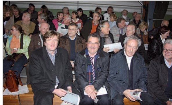
Mehr als 500 Menschen haben die Halle bei der Frühzeitigen Bürgerbeteiligung zum Rhein Ruhr Express der Deutschen Bahn gefüllt. Viele haben große Sorgen, wie ihr Ort durch Gleisbau und Lärmschutzwand verhandelt werden wird. Und das Schreckensszenario beginnt erst. Im kommenden Jahr geht es mit der Planung weiter. Der NORDBOTE bleibt aktuell am Thema.

Sorgenvolle Gesichter, wohin man auch sah. Besonders betroffen sind alle Anwohner direkt an der Bahn. Sie könnten ihre Gärten verlieren, vor eine hohe Mauer blicken. Gut, die DB will einen so genannten Finanzausgleich zahlen. Aber wer zahlt für die verminderte Lebensqualität? Für verringerte Grundstückswerte? „Angermund ist dann nicht mehr attraktiv“, rief ein aufgebracht Bürger. Über Kosten und Baubeginn war sich die DB nicht einig. Mitte 2015 sollen die Planfeststellungsunterlagen eingereicht werden, das dauert etwa 2-5 Jahre. Erst dann beginnen die Bauvorbereitungen. G.S.