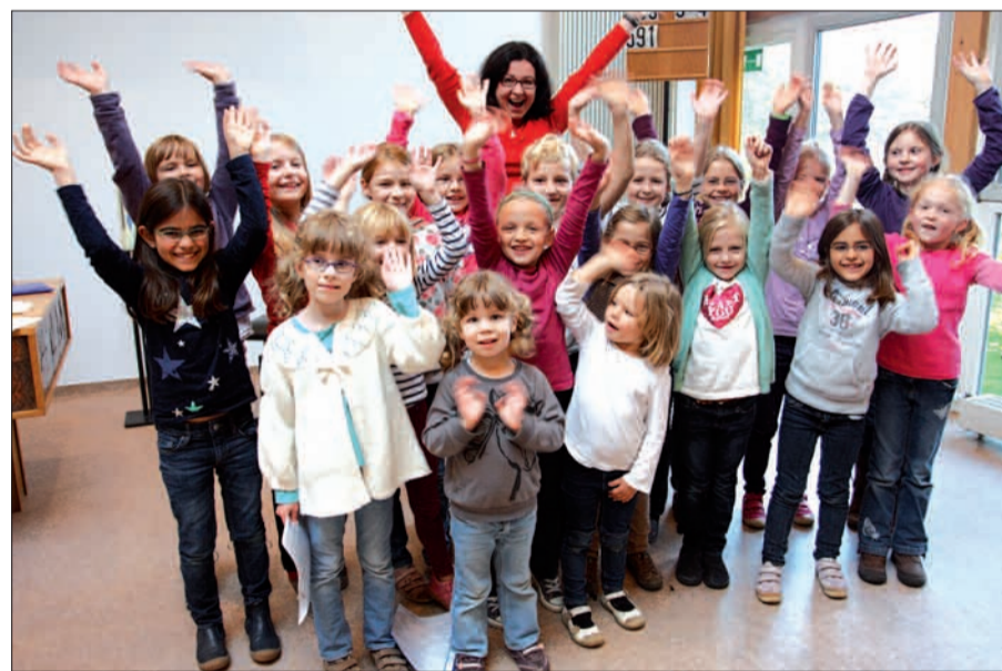
Der erst im Herbst gegründete Kinderchor wird mit dem Gospelchor gemeinsam um 16 Uhr auftreten.