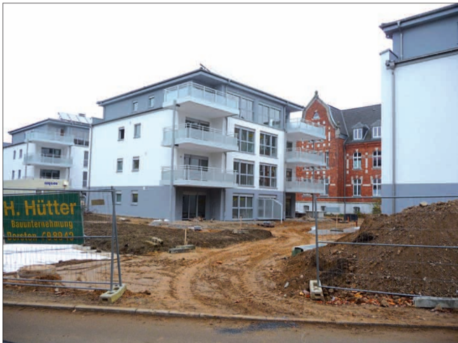
Fünf viergeschossige (einschließlich Staffelgeschoss) „Campushäuser“ westlich des Dreiflügelhauses an der Einbrunger Straße sind fertig gestellt und werden zur Zeit bezogen.

Gartenhofhäuser im nördlichen Teil des Plangebietes sollen Altbauten ersetzen und dienen der Unterbringung von verhaltensauffälligen Kindern und Jugendlichen. Mit zukünftig 96 Plätzen werden es weniger als bisher sein. Die Graf-Recke-Stiftung sieht vor, in Zukunft den Sportplatz, und die Turnhalle auch Vereinen und Anwohnern zugänglich zu machen. Südlich der Einbrunger Straße sind weitere Einzel-, Doppel- und Reihenhäuser geplant, außerdem Verwaltungs- und Veranstaltungsräume, anstatt der bisherigen Werkstätten. Die weitere Bearbeitung des Bebauungsplans kann noch 2 ½ Jahre dauern. Die Umsetzung kann dann natürlich auch nur nach und nach erfolgen. Vorrangig ist nach Aussage der Graf-Recke-Stiftung der Ersatz der Altbauten durch die erwähnten Gartenhofhäuser im nördlichen Teil des Plangebietes. Südlich der Einbrunger Straße können Neubauten erst erfolgen, wenn die derzeitigen Werkstätten verlagert sind. H.S.