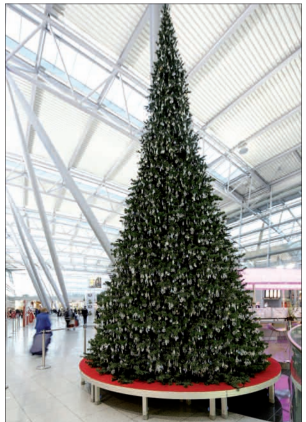
Der Super-Christbaum im Terminal.

an. Die Adventskalender-„Türchen“ sind bis zu 4,9 m hoch, 4,4 m breit und 1,6 m tief. Dahinter verbirgt sich jeweils eine weitere Weihnachtsgeschenk-Idee, die in den Airport-Arkaden zum halben Preis erworben werden kann – solange der Vorrat reicht. Neugierige können sich auf einem Flyer oder unter www.erlebnisflughafen.com über die Schnäppchen vorab informieren. Ganzjährig kann man mit der Value-Card auf dem Flughafen Punkte sammeln, in der Adventszeit vierfach. Ein Adventsbesuch auf dem Flughafen und durch die Airport-Arkaden ist ein märchenhafter Weihnachtsmarktbummel „First Class“! H.S.