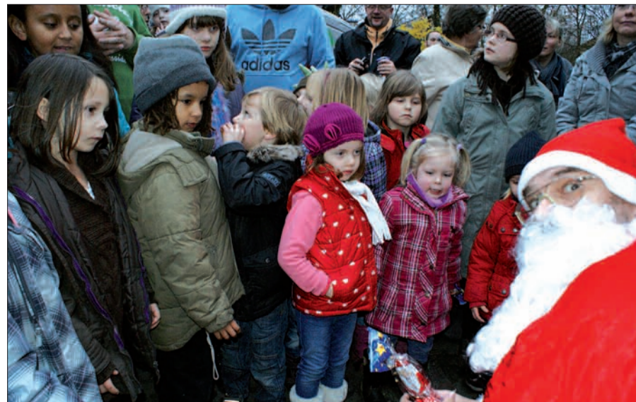
Auch in diesem Jahr wird der Nikolaus vor der katholischen Kirche in Ungelsheim erwartet. Gegen 15 Uhr möchte er die Kinder beschenken. Der Markt ist nächsten Samstag von 12 bis 19 Uhr geöffnet.

Die Versorgung ist über die Vereine, Kirchen und Kindergärten sichergestellt. Für Kinder gibt es eine Bastelaktion, bei der aus Holz Lebkuchenschmuck hergestellt wird. Gegen 15 Uhr wird der Nikolaus für die Mädchen und Jungen eine Überraschung bringen, und die Mundharmonikagruppe St. Stephanus wird einige Lieder spielen. sam