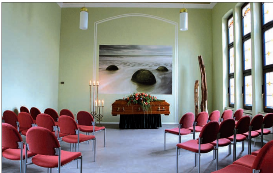
Familie Scheuten richtet jede Trauerfeier ganz individuell aus.

habergeführten Unternehmens, ist dabei Verpflichtung und Herausforderung zugleich für Familie Scheuten und ihre Mitarbeiter. Auch weiterhin werden Abschieds- und Trauerfeiern in den Kapellen auf den Friedhöfen ausgerichtet, mit anschließenden Beisetzungen aus oder in Kirchen- und Gemeindehäusern. Auf Wunsch genauso individuell, wie in den eigenen Kapellen – für jeden Geldbeutel. Jederzeit ist man im Haus Scheuten auch zu unverbindlichen Beratungs- und Vorsorgegesprächen bereit. Eine telefonische Kontaktaufnahme ist möglich unter 0203/782207 (im Trauerfall 24 Stunden am Tag) oder per E-Mail: Bestattungshaus-Scheuten@t-online.de. Unter „www.bestattungshaus-scheuten.de“ kann man sich auch im Internet informieren.