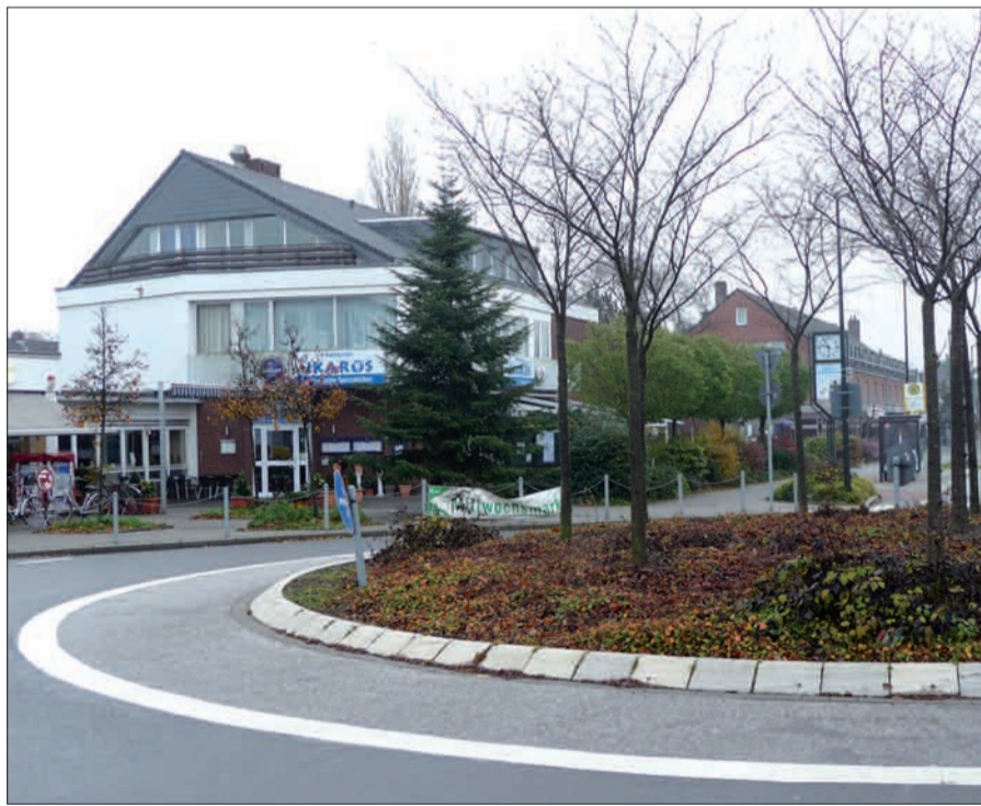
Der Lohausener Verkehrskeisel wird derzeit verschönt durch einen Weihnachtsbaum.

Angermund macht mit seinen Verkehrskreiseln seinem Titel „Rosenstadt“ alle Ehre, zumindest den ganzen Sommer über. Hier waren und sind Sponsoren und engagierte Bürger am Werk. Auch der Wittlaerer Kreisel kann sich sehen lassen, ohne großzüliges Sponsoring ging es natürlich auch dort nicht. Die Gestaltung des Lohausener Kreisels war nach Kenntnis des NORDBO-TEN für das Gartenamt die teuerste Fläche, obwohl die jungen Leute von der Jugendberufshilfe ganz in der Nähe das günstigere hätten machen können. Die Gesetze ließen und lassen es aber nicht zu. Es sieht dort ganz ordentlich aus, bedauert wird nur, dass die japanischen Kirschbäume nur kurzzeitig im Frühjahr blühen. Ob sich zwischen den Orten ein Wettbewerb entwickelt, wer den schönsten Verkehrskreisel hat? H.S.