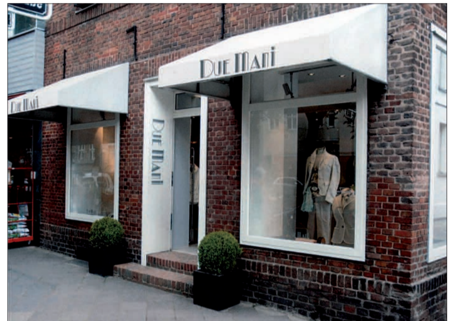
Der Hingucker am Markt ist DUE MANI seit fast 30 Jahren. Das soll so bleiben.