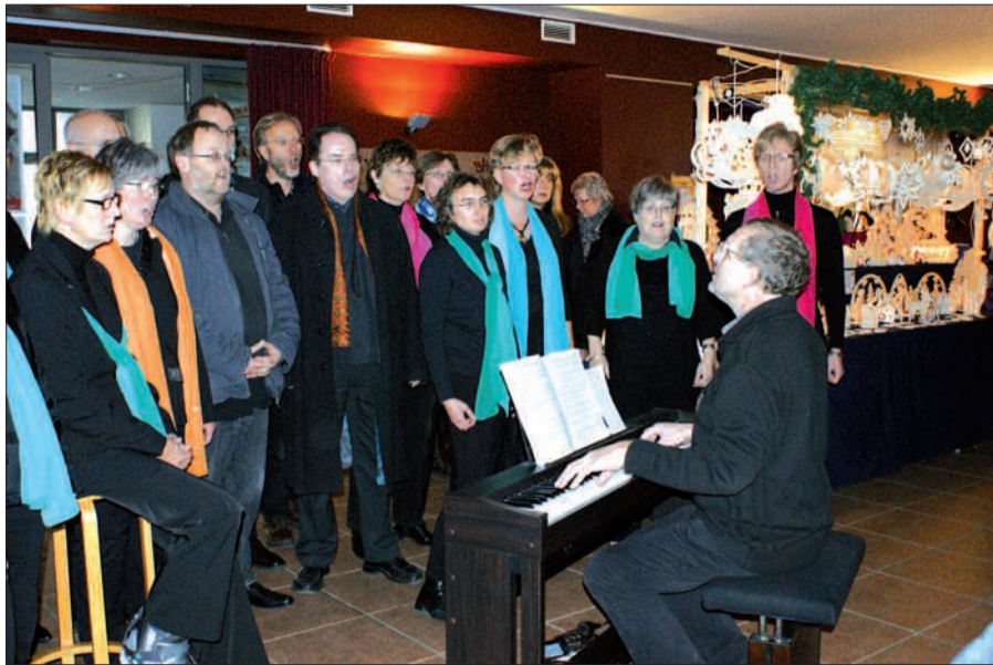
Wie im vergangenen Jahr möchte der Huckinger Gospelchor „Kreuz & Quer“ die Besucher mit weihnachtlichen Liedern erfreuen.