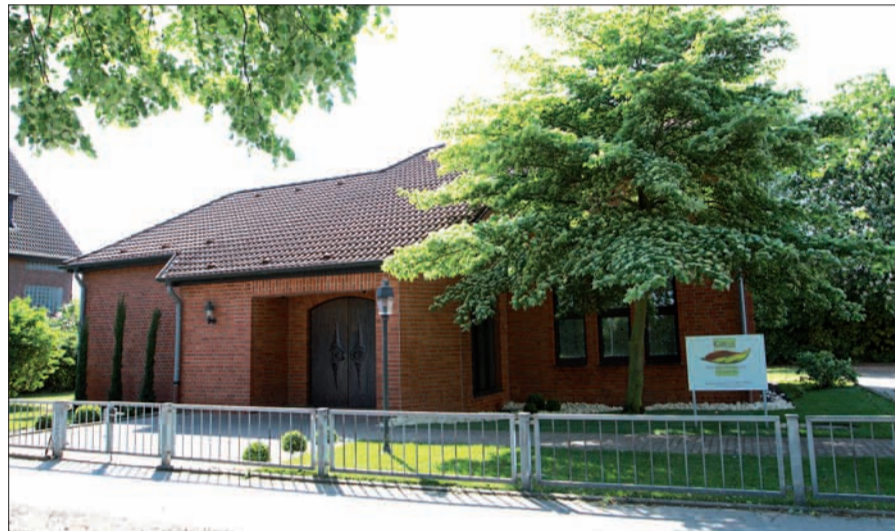
Seit dem vergangenen Jahr steht für ganz persönliche Abschiedsfeiern die stilvolle Kapelle an der Angermunder Straße in Rahm zur Verfügung.

Mitarbeitern sind seit ein- bis zwei Jahren auch die Bürger im Düsseldorfer Norden aufmerksam geworden und wissen, die einfühlsame Qualitätsarbeit zu schätzen. Hierzu trägt auch die neue, in 2011 eröffnete und sehr stilvoll gestaltete „Kapelle Bestattungshaus Scheuten“ an der Angermunder Straße 100 in Rahm bei. Die freistehende Kapelle bietet Familien eine relativ einmalige Möglichkeit für individuelle Trauerfeiern und auch vorherige „Abschiednahmen“ ohne stressigen Zeitdruck. Inspiriert von dieser Idee einer eigenen Kapelle wurden Vater und Tochter durch Studienbesuche im europäischen Ausland und in den USA. Scheuten griff die Idee