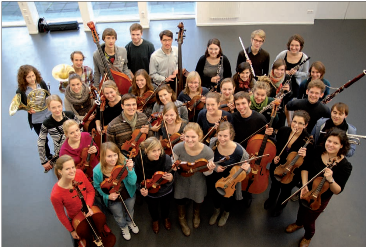
Ein herrliches Konzert dürfte die Gäste in der Aula des Theodor-Fliedner-Gymnasium am 16. Dezember erwarten. Spenden für das Orchester sind willkommen!

Abend Dirigent sein wird, ist gespannt: „Nachdem wir mit unserem Orchester in Kaiserswerth zweimal mit wachsender Zuschauerzahl aufgetreten sind, sind wir zuversichtlich, dass das Konzert am 16. Dezember ein voller Erfolg wird.“ G.S.