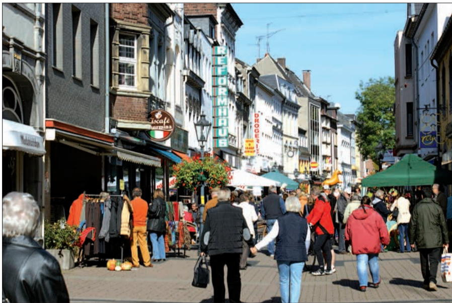
Die Uerdinger Straßen werden an diesem Wochenende weihnachtlich geschmückt sein. Beim traditionellen Nikolausmarkt ist der Sonntag verkaufsoffen.

wegen des zu erwartenden Besucherandrangs „Park and Ride“. Parkmöglichkeiten bestehen an der Uerdinger Halle/Berufskolleg Uerdingen an der „Alten Krefelder Straße“. Von dort geht es mit der Straßenbahnlinie 043 als Kurzstrecke bis zur Haltestelle „Am Röttgen“. Weitere Hinweise auf www.uerdingerkaufmannsbund.de .