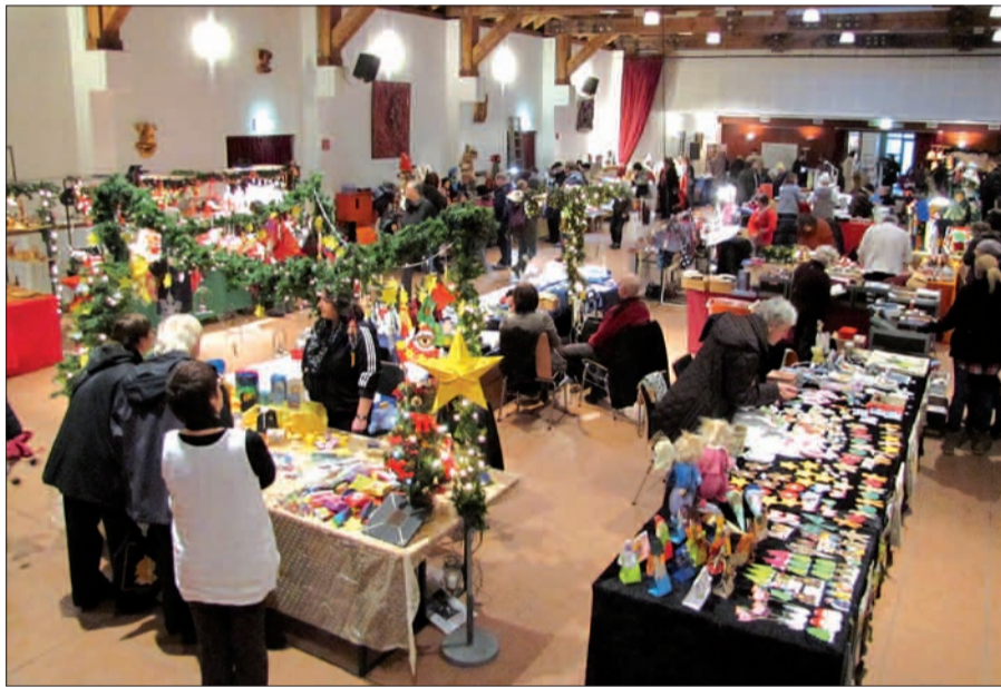
Nach dem verkaufsoffenen Sonntag (9. Dezember) in Huckingen haben die Bürger auch beim Weihnachtsmarkt am 15. und 16. Dezember im Steinhof die Möglichkeit, gemütlich zu bummeln.

Zum Huckinger Weihnachtsmarkt gehören natürlich auch Glühwein, heißer Kakao, Bratwürste, Hamburger, Champions, Reibekuchen und ähnliches. Entsprechende Verkaufsstände sind auch im Innenhof des Steinhofs zu finden. In der großen Festhalle wartet das „Steinhof-Café“ mit Kaffee, Kuchen und Waffeln auf die Weihnachtsmarktbesucher. In der Halle steht auch das Gros der weihnachtlichen Verkaufsstände, weitere warten im „Raum Böckum“ auf die Besucher.