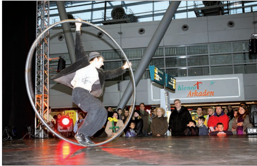
Akrobatik und viel mehr bietet der Airlebnisssonntag am 1. Advent auf dem Flughafen.

Dampfzug-Nachbildung fährt die Kinder durchs Terminal, reitbare Plüschtiere, eine Hüpfburg und Bastelstationen sorgen zusätzlich dafür, dass die Begeisterung bei den Kleinen nicht nachlässt. Wer an diesem Tag im Reiseumarkt (Ebene 2 und 3) einen Urlaub bucht, kann mit etwas Glück dahingehend gewinnen, dass ihm die Reise bezahlt wird. Weitere Aktionen versprechen attraktive Preise, auch eine Flugreise ist schon mal dabei. Der Eintritt auf die Besucherterrasse ist ermäßigt, ebenso das Parken (€ 5,- für sechs Stunden pauschal, nicht auf P 11 und 12, Parkticket am Infoschalter umtauschen). Flughafenrundfahrten sind kostenlos (Personalausweis erforderlich). Natürlich ist der Flughafen weihnachtlich großartig geschmückt. Nicht nur ein