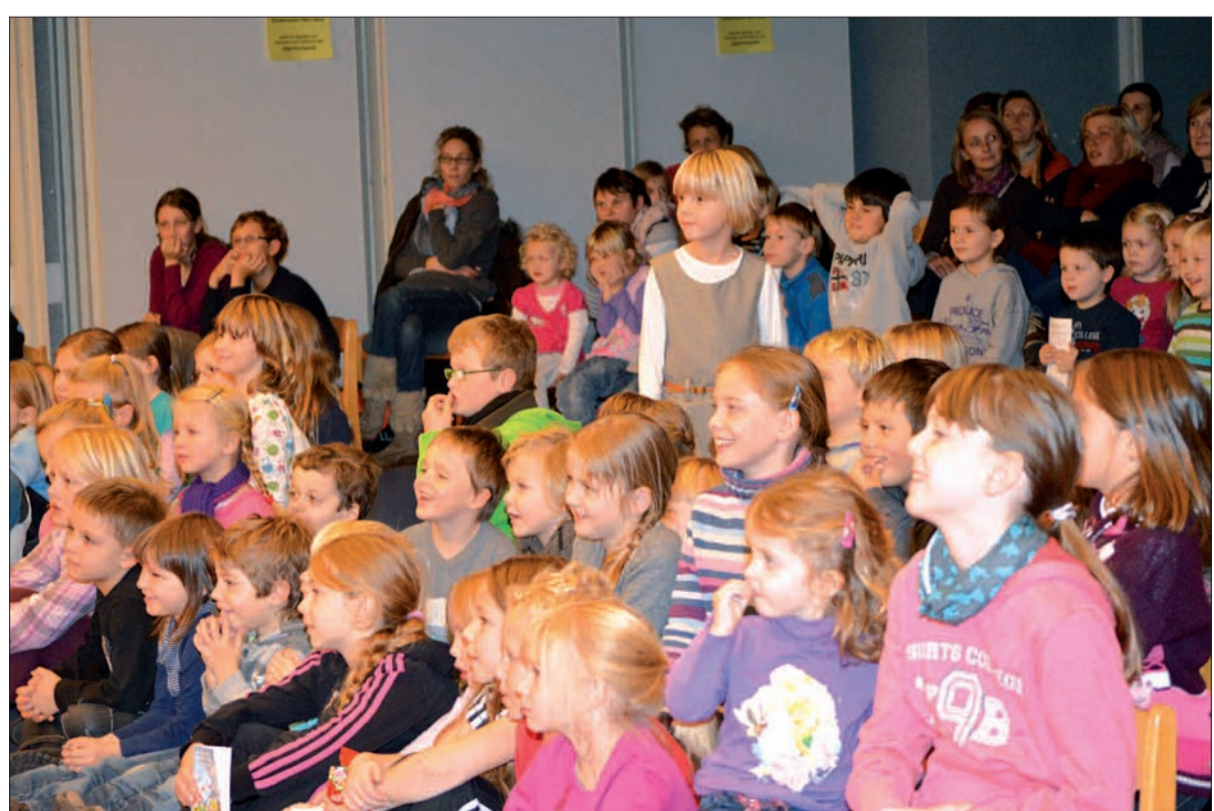
Mehr als 140 Mädchen und Jungen freuten sich über das Engagement der Jägerkompanie. Sie organisiert seit 2007 die Reihe „Kultur für Kinder“.