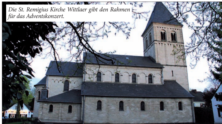
Die St. Remigius Kirche Wittlaer gibt den Rahmen für das Adventskonzert.