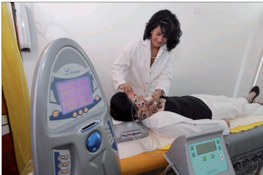
Wohlthuende Gesichtsbildung zur Faltenreduktion und Straffung der Gesichtshaut in der docbeauty Lounge