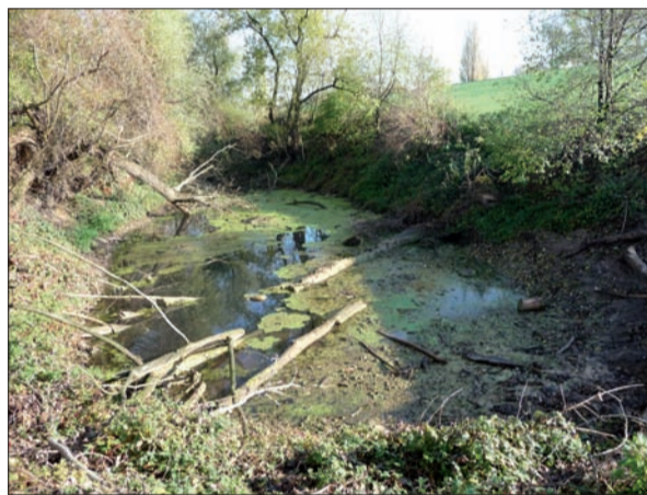
Ein Teich unmittelbar vor dem Deich nördlich von Kaiserswerth. Im Hintergrund das schon frische, grüne Gras auf dem neuen Deich.

etwas gelitten. Ist es der letzte Rest des Fleets, des Rheinarms, der einst das Werth vom festen Rheinufer trennte? Der Rest eines früheren Hafens? Oder eine frühere Sand- und Lehmgrube? Jedenfalls ist es ein Stück urtümlicher Landschaft, fast wie ein Stückchen Urwald. H.S.