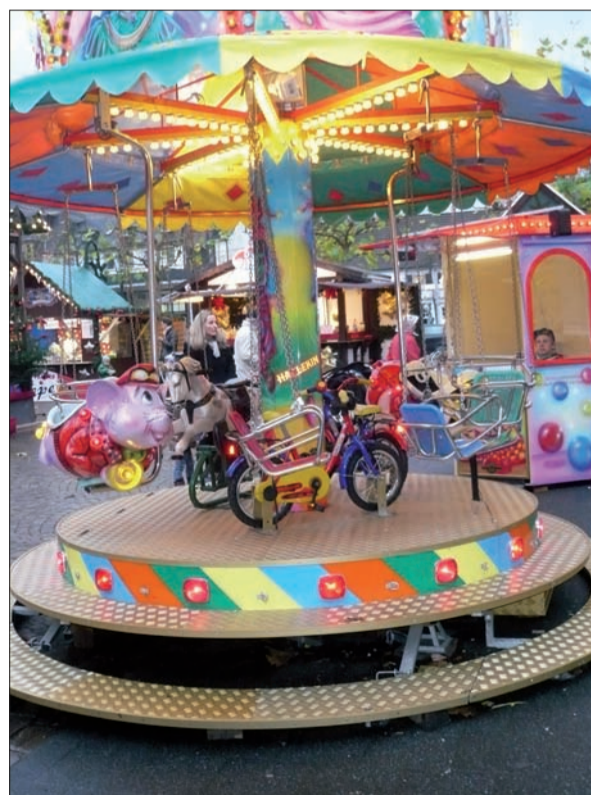
Das Karussell wartet noch auf den Kinderansturm.

Weitere Informationen erhalten Sie hier: IMZ – Am Mühlenturm 1 – 40489 Düsseldorf – Tel.: 0211 54 21 79 0