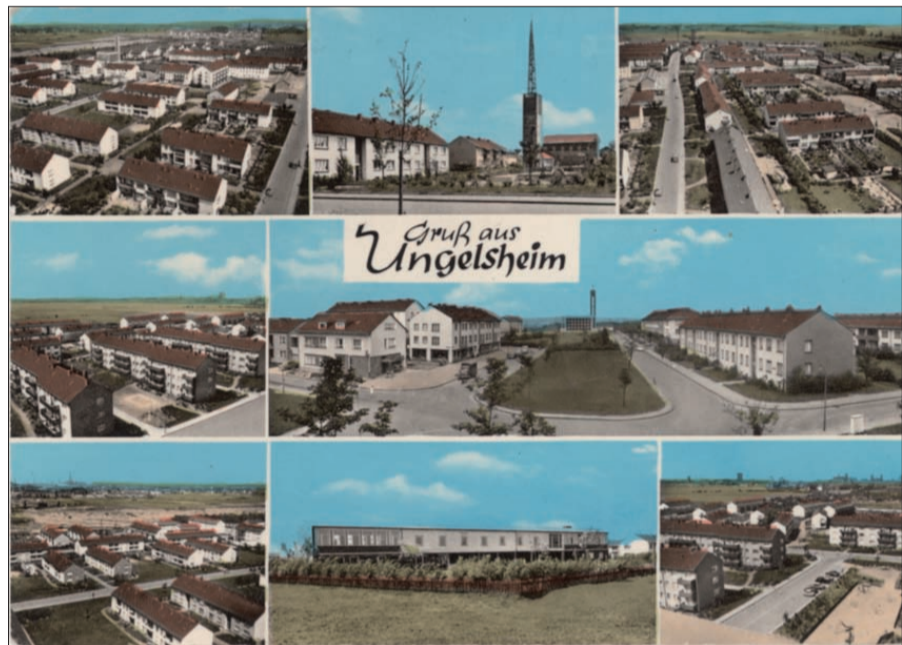
Das noch junge Ungelsheim in den 60er Jahren des vergangenen Jahrhunderts.