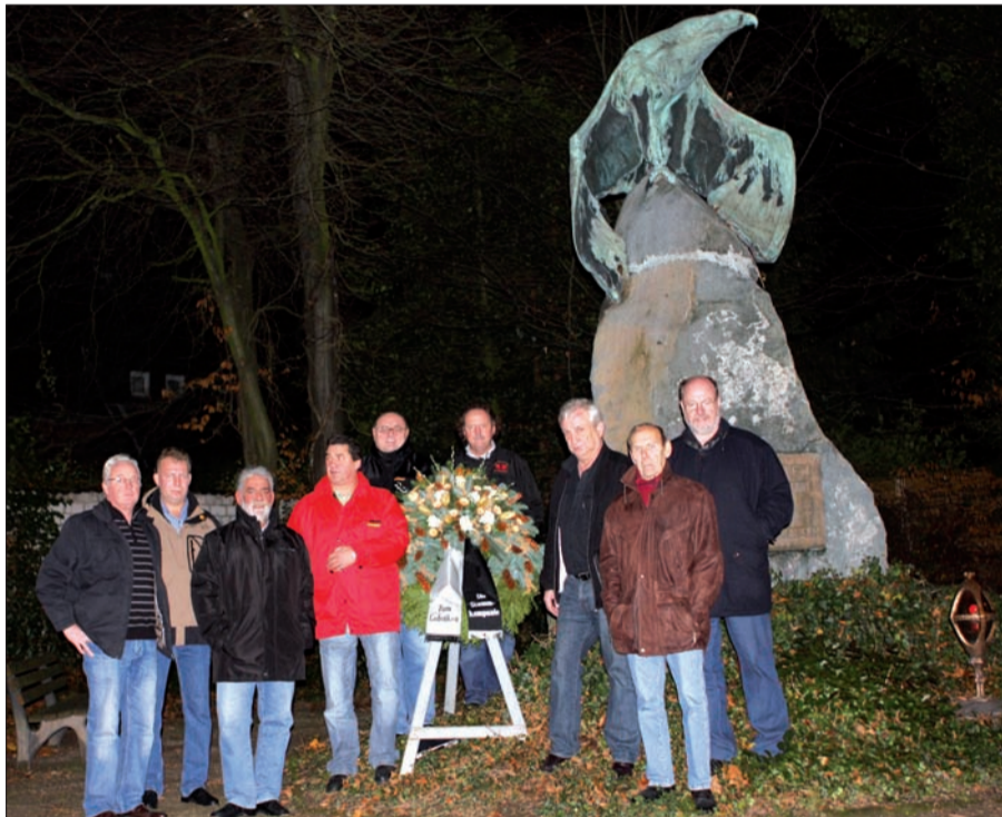
Am Abend des 27. November 2009 legten Mitglieder der Stammkompanie am Kriegerdenkmal gegenüber der katholischen Kirche in Lohausen einen Kranz nieder. Sie halten damit das Gedenken an die in den Weltkriegen gefallenen Lohausener. Seit 1999, dem Jahr ihres 150-jährigen Bestehens, hat die Stammkompanie die Patenschaft für dieses Denkmal übernommen und kümmert sich seither um dessen Erhalt und Pflege.