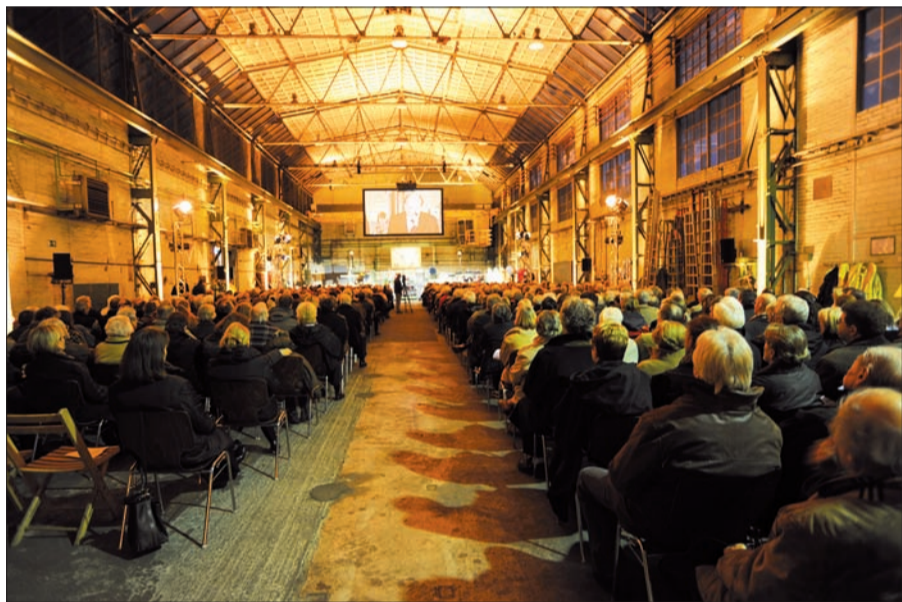
Ökumenischer Gottesdienst zum Barbaratag im ehemaligen Gebäude des Elektrobetriebes auf dem Gelände der Hüttenwerke Krupp Mannesmann 2008.

hilfe in Guayaquil, Ecuador unterstützt. Der ökumenische Gottesdienst findet am 6. Dezember um 16.30 Uhr im ehemaligen Gebäude des Elektrobetriebes auf dem Werksgelände der HKM statt. Der Zugang ist über das Tor 1 an der Ehinger Straße. Nach dem Gottesdienst besteht die Möglichkeit, bei einem Glas alkoholfreien Glühwein und Weihnachtsgebäck das ein oder andere Gespräch mit Freunden und Kollegen zu führen. Text u. Foto: H.M.