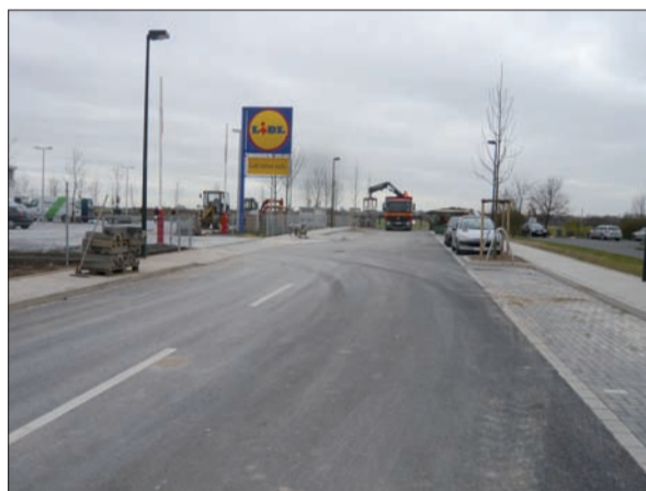
Schon in drei Tagen eröffnet hier Lidl. Die knapp 100 Meter lange Straße wird nach dem Willen der CDU-Fraktion Pfarrer-Holl-Weg genannt.

% Einladung zum Nikolaus-Verkauf % Sonntag 6. Dez. 09 13.00 -18.00 Uhr