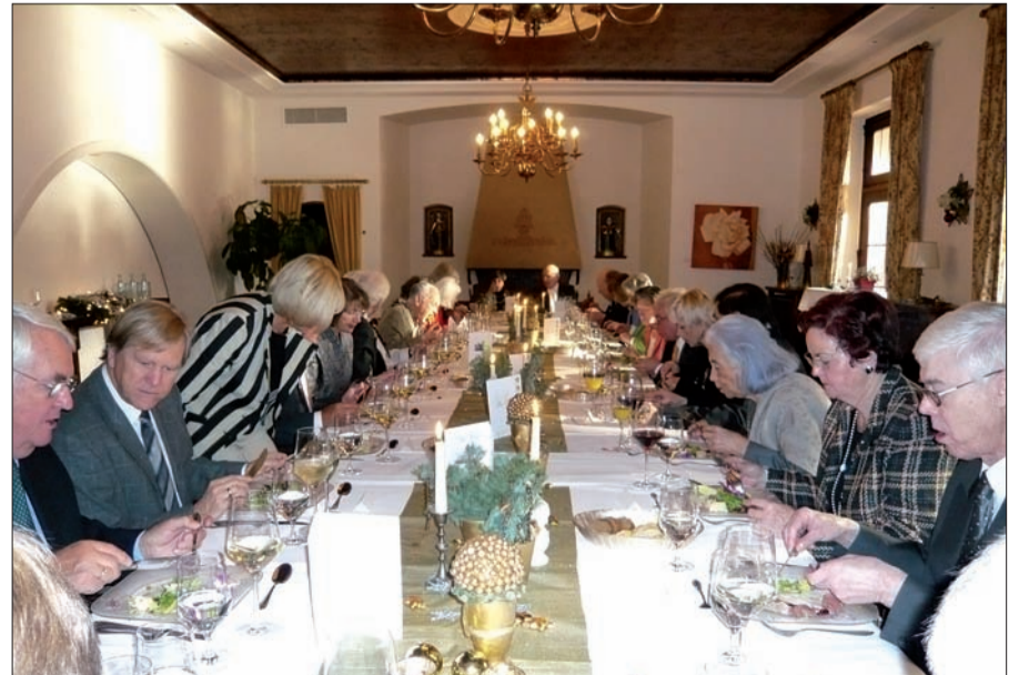
Festlicher geht es nicht: Die herrliche Geburtstagstafel im Hotel Haus Litzbrück.

Wir digitalisieren Ihre Filme auf DVD! Normal-8- und Super-8-Filme, Hi-8- u. 8-mm-Videos, VHS-, VHS-C- und Betamax-Videos GW Satztechnik GmbH Tel. 02152/55 28 86 www.gw-satztechnik.de