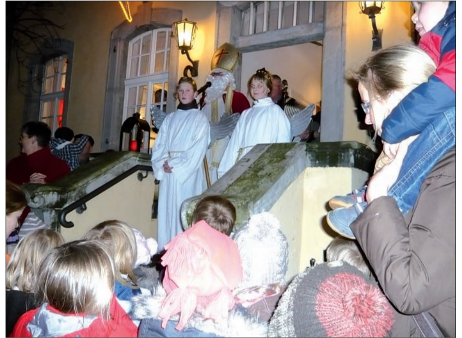
Der Nikolaus war flankiert von zwei hübschen Engelchen, die Kinder drängelten sich schon um Viertel vor fünf vor dem Bürgerhaus.