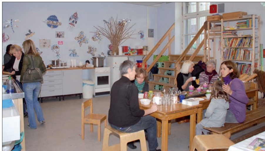
Die neue Küche – viel Platz zum gemeinsamen Kochen und Essen.

Programm und mehr unter www.krea-duesseldorf.de . Text u. Fotos: Sylvia Winkel