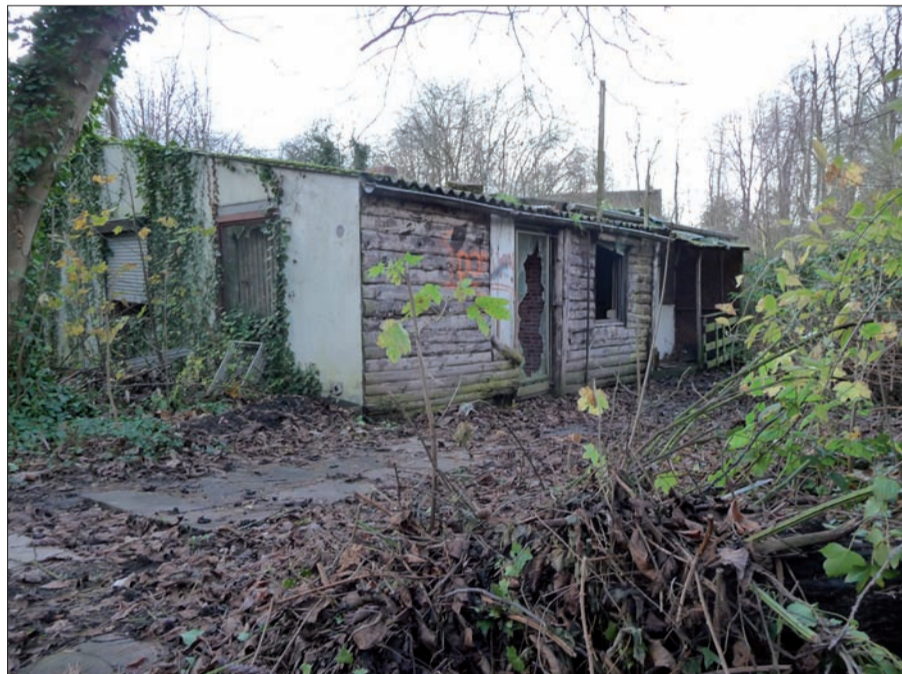
Eines der endlich zum Abbruch vorgesehenen „Gebäude“ im verwilderten Kaiserswerther Wallgraben.

den, die den ehemals dort fließenden Kittelbach säumten, kommen dann auch mehr zur Geltung. Mit den Arbeiten soll baldmöglichst begonnen werden, die Auftragserteilung steht kurz bevor. Das dürfte auch die Besucher des Schützenfestes im August freuen, denn mindestens in 2010 soll das Kaiserswerther Schützenfest wieder auf diesem Parkplatz an St. Swibert stattfinden.