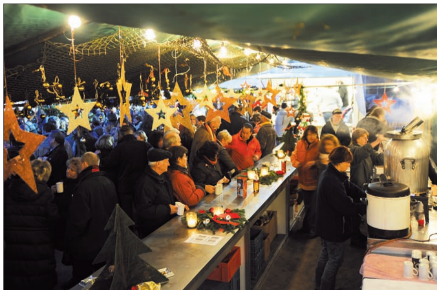
Auch in diesem Jahr laden die Huckinger Schützen wieder zum Weihnachtsmarkt im Steinhof ein.

weinstände sowie der Verkauf von schlagfrischen Tannenbäumen auf die Besucher. Der Reinerlös des Weihnachtsmarktes ist wie schon in all den Vorjahren für das Waisenhaus in Aracuja (Brasilien) bestimmt, zu dem Karmeliter-Pater Dr. Theo Sengers vom Malteser St. Anna-Krankenhaus den Kontakt hält.