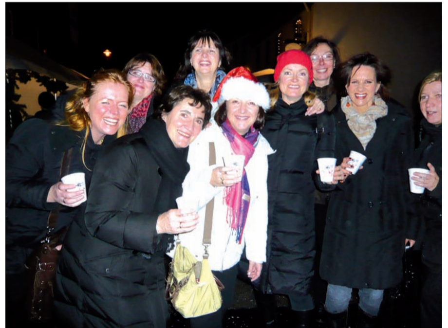
Colours of Singing – nach dem supertollen Konzert entspannte sich der Gospelchor bei einem Glühwein.