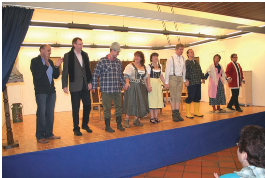
Die Serm Laienspielgruppe beim Schlussapplaus ihrer diesjährigen Komödie „So ein Irrsinn“.