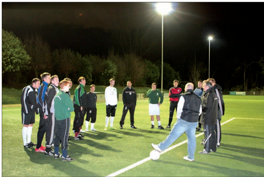
Ungewohnt andächtig lauscht die 1. Mannschaft des LSV der Traineransprache