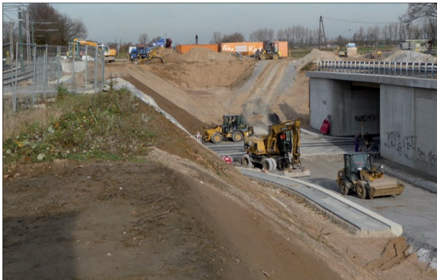
Das Verbindungsbauwerk Froschenteich ist nur ein Vorgeschmack auf den Beton, der im Düsseldorf-Norden noch verbaut wird. Ein großes Autobahnkreuz keine 2 km weiter nördlich steht noch bevor. Text u. Foto: H.S.