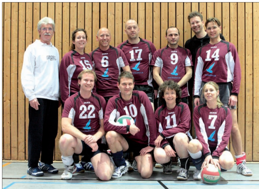
Das Volleyballteam des KSV

in der Sporthalle des Theodor Fliedner Gymnasiums zum Training. Coach Pommerenke würde sich über erfahrene, ambitionierte Volleyballer/innen, die das Team verstärken können, freuen. Die nächste große Aufgabe für die Kaiserswerther Truppe ist übrigens das Pokalspiel gegen TUS 1895 Düsseldorf aus der A-Gruppe. Sicherlich eine harte Nuss, allerdings hatte der KSV am 26.11. ja schon seinen schwachen Tag für 2009. Also, auf geht's, da geht was! U. Spaethe