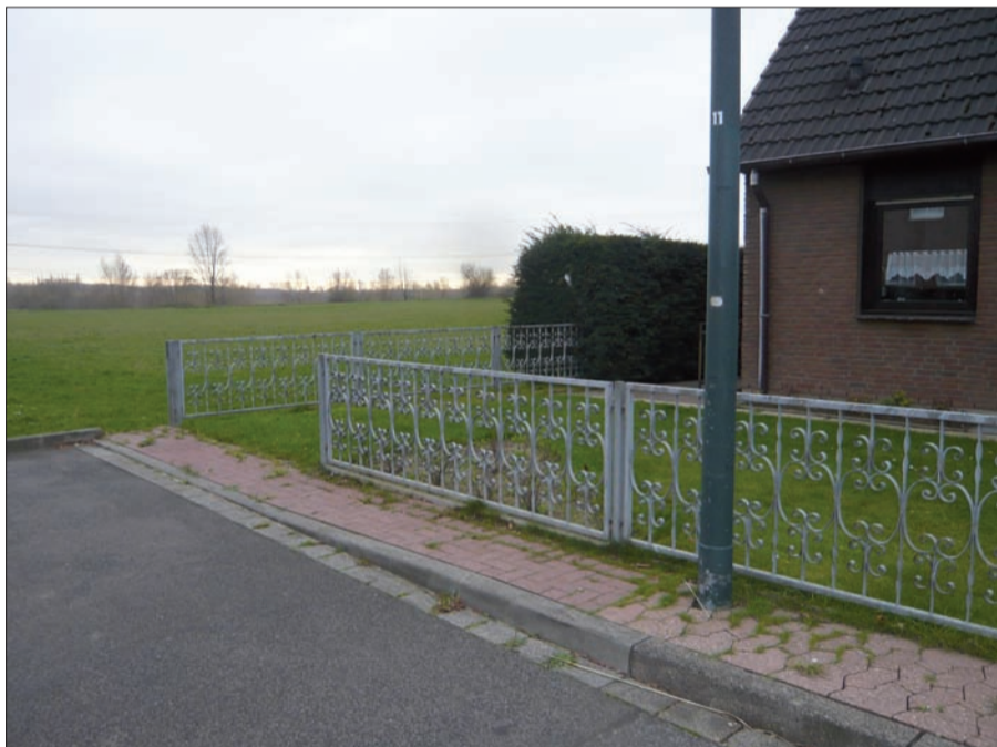
Hier endet der Fliederweg – noch. Schon bald soll die Straße um 7 EFH wachsen – zulasten des freien Feldes, versteht sich. Wo bleibt auf lange Sicht der ländliche Charme? Unter Baggern vergraben.