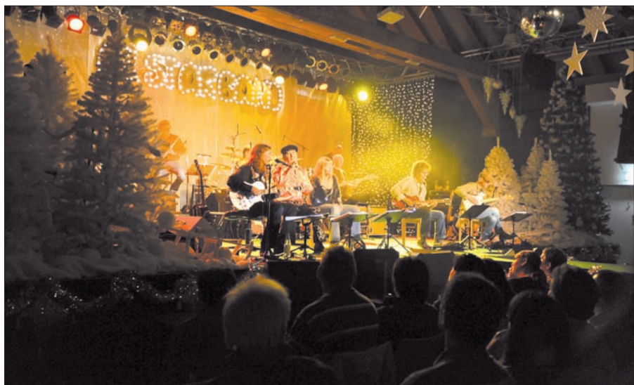
Zum zweiten Mal gibt es eine vorweihnachtliche Party mit der All Star Band im Steinhof. Der Auftakt war bereits am Freitag, dem 27. November.