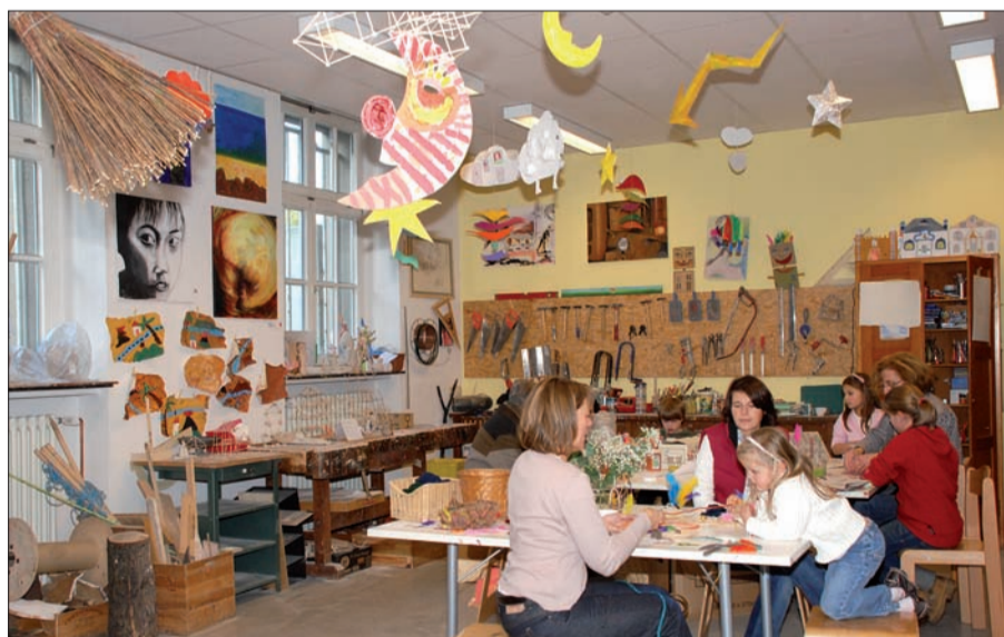
Der Werkraum – Ausstattung und kreative Atmosphäre regen zum schöpferischen Arbeiten an.