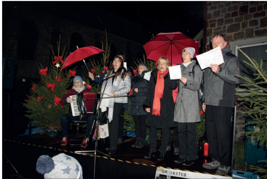
Auch auf diesem Nikolausmarkt in Angermund wird es Gelegenheit zum Singen geben. Auf einer kleinen Fläche vor der St. Agnes Kirche ist Raum dafür vorgesehen.

Angermunder Str. 23 · 40489 Düsseldorf-Angermund www.zahnarztpraxis-beurich.com · e-mail: info@dr-bb.de tel: 0203 - 7 38 77 - 0 · fax: 0203 - 7 38 77 - 17