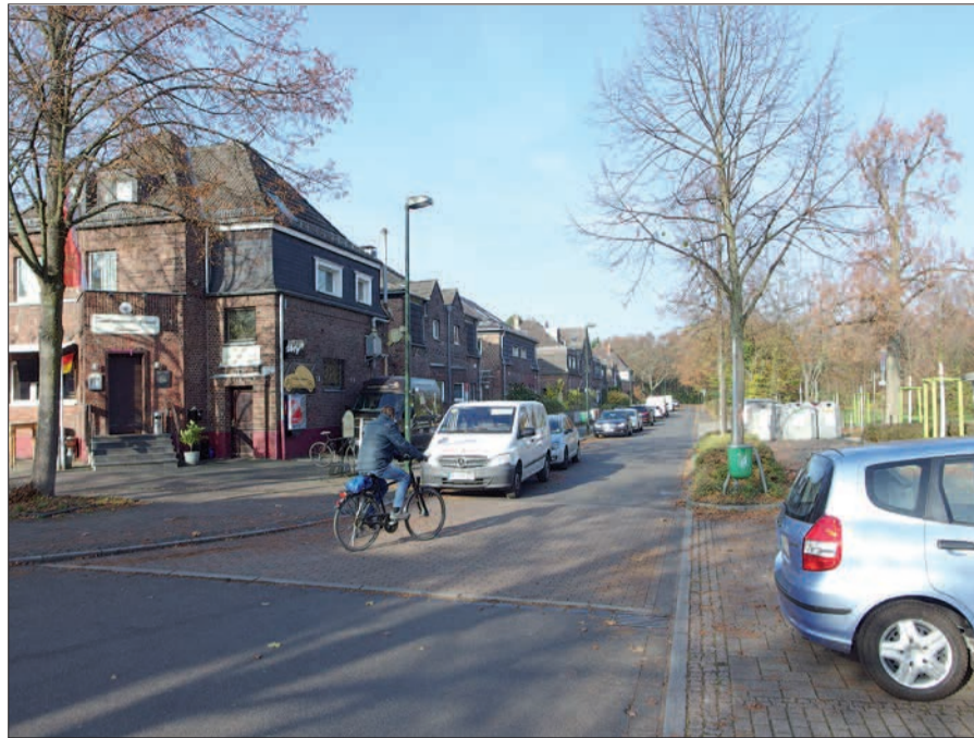
Die Umkehrung der Einbahnstraßenregelung, jetzt Richtung Heidestieg/Spielberger Weg/Niederrheinstraße, ermöglicht zügiges Verlassen der Alten Flughafenstraße ohne Wendemanöver. Das Foto wurde kurz nach der Umstellung aufgenommen, so dass die Fahrzeuge noch verkehrt parken.

straße her eine Stichstraße in Richtung Spielberger Weg, aber nur, um weitere Gewerbegrundstücke in zweiter Reihe hinter der Niederrheinstraße zu erschließen. Eine Fortführung dieser Straße bis zum Spielberger Weg ist zumindest vorerst nicht vorgesehen. Das Amt für Management hat diesen Antrag der Bezirksvertretung 5 abgelehnt mit der Begründung, mehr Verkehr auf dem Spielberger Weg als ruhige Wohnstraße (!) sei nicht erwünscht. Der wirkliche Grund dürfte aber sein, dass dann die Verlegung eines aufwendigen Regenwasserkanals notwendig wäre. H.S.