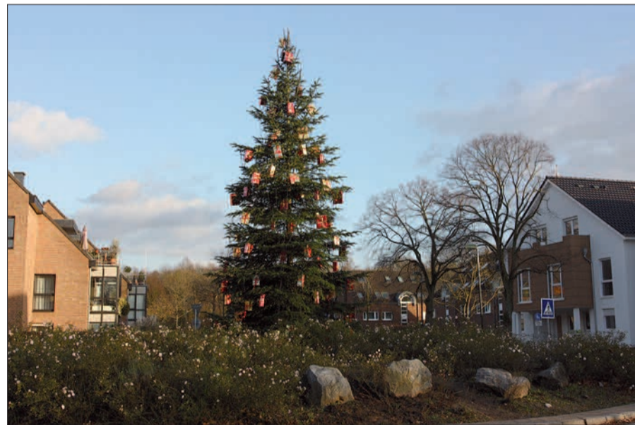
Der Tannenbaum am Kreisverkehr ist das Entrée zum Nikolausmarkt in Angermund.