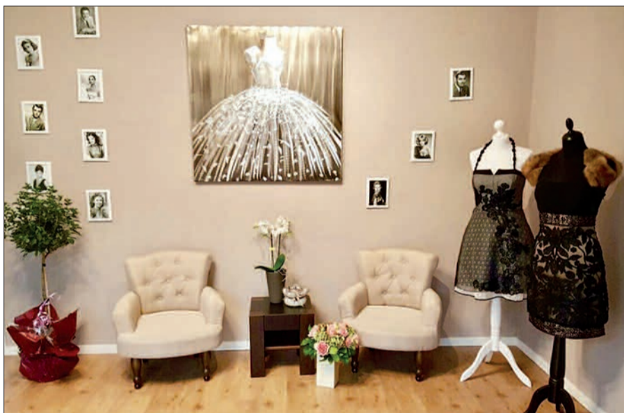
In ihrem neuen Schneider-Atelier direkt neben Hotzenplotz ist die Modelistin mit geballtem Know-how nun ansässig.