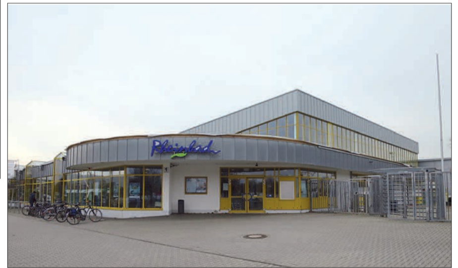
Der Eingang zum Rheinbad (nördlich der Esprit-Arena).

Wasserfläche außen, Sprungtürmen 1 und 3 m, Erlebnisbecken mit Breitrutsche, Planschbecken und Kinderspielplatz und großer Liegewiese. Mehr, zum Beispiel über Schwimmkurse, unter www.baeder-duesseldorf.de H.S.