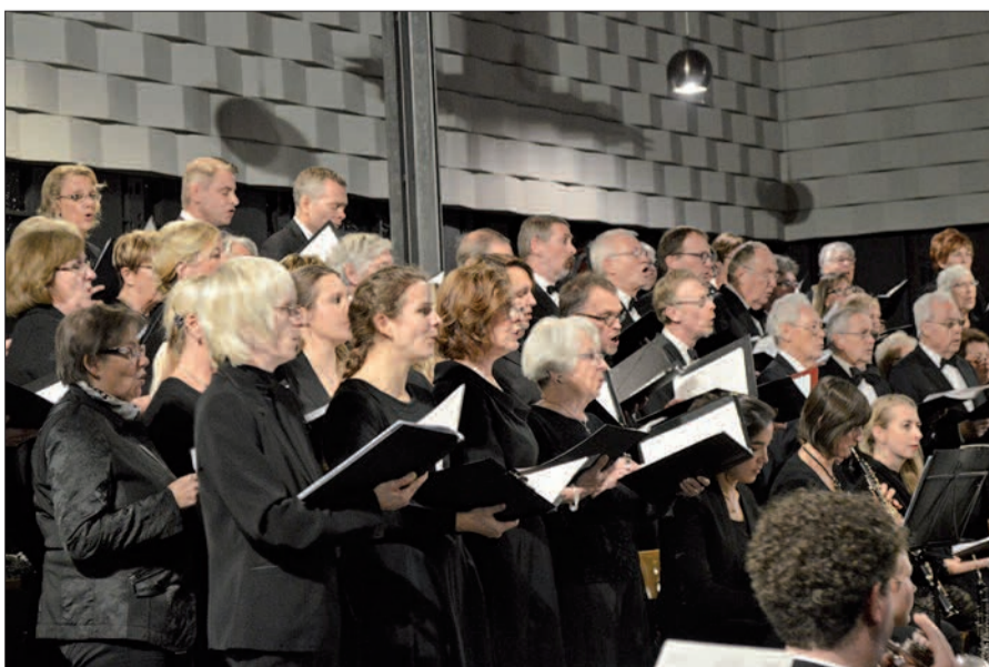
Die Kantorei Großbaum-Rahm erfreute mit ihrer Interpretation von Mozarts Krönungsmesse.