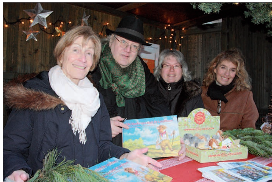
Und gemütlicher Treffpunkt für Angermunder und Nachbarn.