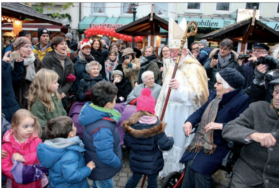
Viele strahlende Kinderaugen, ein paar alte Menschen, die ihre Freude an dem Zauber auf dem Weihnachtsmarkt haben und der Nikolaus mitten drin, das ist das Weihnachtsdorf in Kaiserswerth.

kleinen Bühne mittendrin ist wie jedes Jahr ein buntes Programm geplant. Nicht nur am Kindertag, der jeden Mittwoch mit Karussellfahrt, Kasperletheater für alle und 1 Crêpe mit Zucker und Kinderpunsch lockt (alles für jeweils nur 1 Euro, von 15-18 Uhr). Auch die vielen Chöre aus Kaiserswerth und Umgebung singen und treten hier auf, es gibt Live-Musik und viel mehr. Bis der Weihnachtsmarkt am 23.12. schließt, werden sich viele wieder an Currywurst, Crêpes, Glühwein, den Reibekuchen und gemütlichem Beisammensein erfreut haben. G.S.