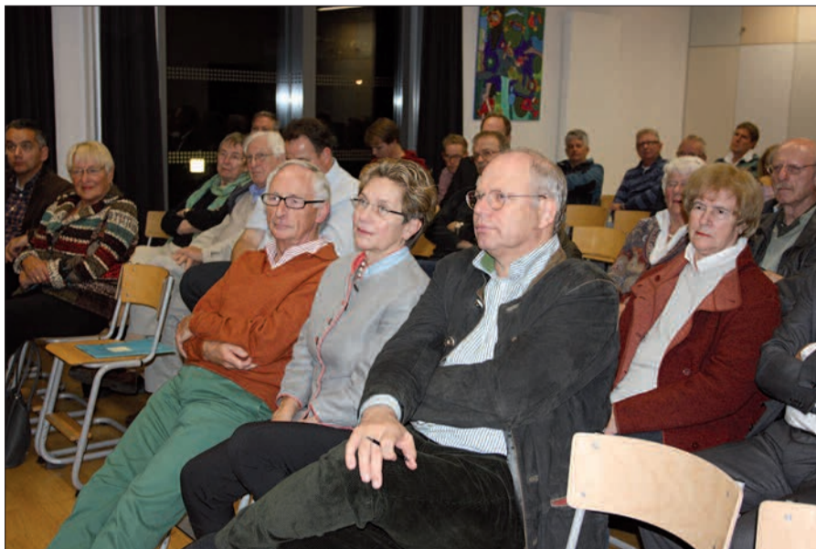
Etwa 50 interessierte Bürgerinnen und Bürger waren zur Fragestunde in die Franz-Vaahsen Grundschule gekommen.