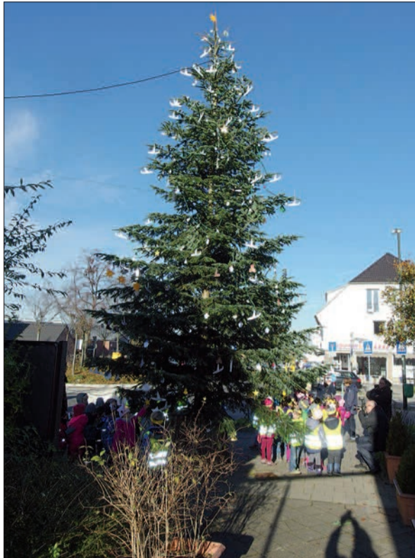
Der vom Flughafen gesponserte Weihnachtsbaum am Verkehrskreisel wird auch in diesem Jahr wieder mit Hilfe von Lohauer Kindergartenkindern geschmückt und noch vor dem „Advent im Dorf“ stehen.

chen Liedern gibt es ein wärmendes Getränk und ein Bethlehemlicht zum Mitnehmen. Ziel und Zweck dieses Treffens ist, ohne Geschäftigkeit und Konsumorientierung auf den eigentlichen Sinn und Anlass der Adventszeit aufmerksam zu machen. Mit anderen Worten: In Lohausen ist es auch ohne Weihnachtsmarkt lebenswert. H.S.