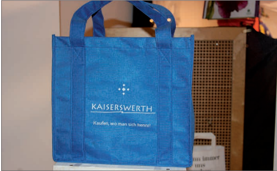
Die blaue Tasche als Symbol für die Stärkung des lokalen Handels in Kaiserswerth ist Programm.

Was wäre, wenn es in Kaiserswerth keinen lebendigen Einzelhandel mehr gebe? Was wäre, wenn nach und nach die hübschen Geschäfte mit dem bunten Portfolio an ausgesuchten Waren verschwänden und nur noch online bestellte Waren in's Haus kämen? Das Stadtbild wäre eintönig, dunkel, verödet. Dagegen stemmen sich die Mitglieder der Kaiserswerther Werbegemeinschaft seit langem, und nun noch mehr als sonst. Die blaue Tasche, 100% aus recyceltem Material, leuchtend blau und überaus praktisch, ist ein Give-away der meisten Einzelhändler vor Ort, die ganz klar damit werben: „Kaufen, wo man sich kennt“. In den nächsten Tagen werden die Taschen an die Kunden verschenkt. Denken und handeln Sie doch bitte ganz lokal. Alles, was es in der City von Düsseldorf gibt, finden die Kunden auch in Kaiserswerth, nur hübscher und persönlicher. Zwei große Parkplätze und ein Parkhaus warten auf viele Besucher und Kunden. Werbegemeinschaft sucht