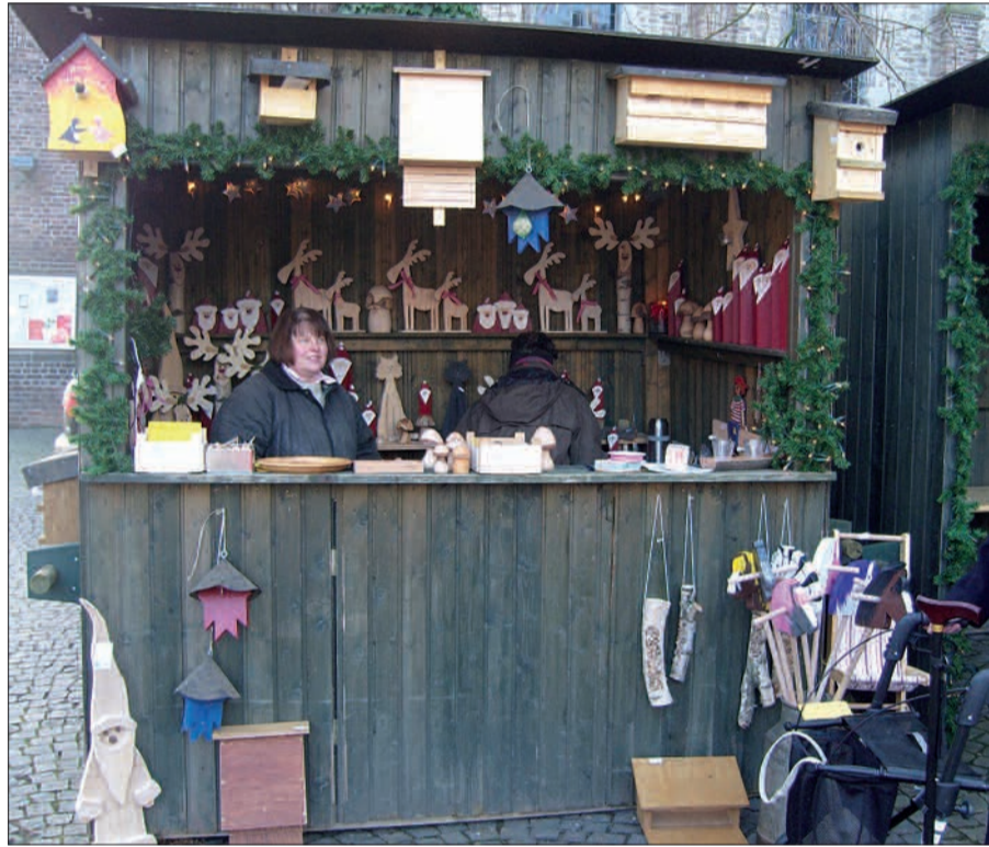
Immer aktiv für Menschen in Not sind die fleißigen Helferinnen des Adventsbasars.

chen bietet Trödel und Second-Hand Artikel an. Für das leibliche Wohl werden Kaffee und Kuchen, Waffeln, Eintopf, Grillwürstchen, Pommes, Reibekuchen, Matjes, Brathering und Getränke angeboten. Der Erlös wird vollständig sozialen Projekten gespendet.