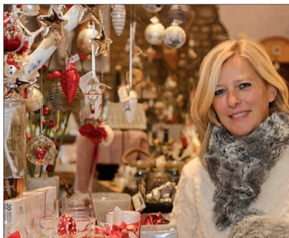
Am Sonntag, 29. November, kann man bei Yoh-Art Home & Garden wieder nach Lust und Laune shoppen. Die Sandmühle in Huckingen ist von 13 bis 18 Uhr geöffnet.