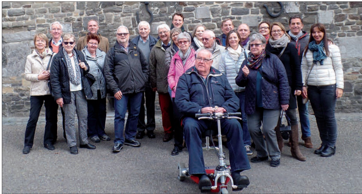
Die Kaiserswerther Reisegruppe vor der „Onze Lieve Vrouwebasiliek“ (12. Jahrh.) in Maastricht.

Gleich nach der Ankunft der Kaiserswerther begann eine Stadtführung am Elisabethbrunnen, in dessen heißem, schwefelhaltigem Wasser zwar schon die Römer badeten, aber auch Karl der Große. Überall im Stadtgebiet werden Geschichte und der große Kaiser lebendig, aber auch an den Printenbäckereien konnte man nicht vorbeigehen, ohne zu naschen. Die gibt es ja aber auch nur, weil sie als Wegzehrung für Pilger zum Schrein des Kaisers erfunden wurden. Am Nachmittag stand mit einer Führung durch den Dom und die Schatzkammer der große Kaiser erst recht im Mittelpunkt, unter anderem waren sein Thron aus Marmor, ein vergoldetes Kopf- und Armreliquiar und sein antiker Marmorsarkophag zu be-