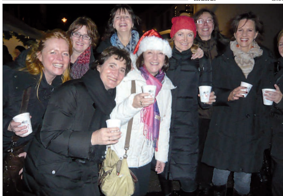
Gut gelaunt und bestens aufgelegt waren die Sängerinnen vom Gospelchor „Colours of Singing“ nach ihrem furiosen Konzert in St. Agnes. Wie schade, dass sie nicht mehr dabei sind!