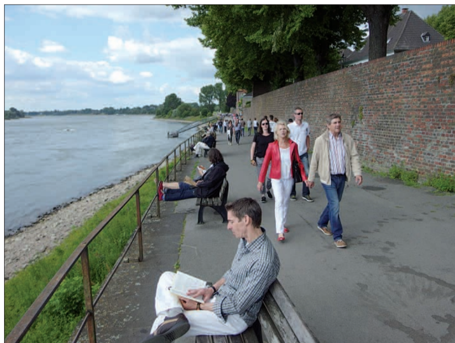
Das Geländer der Rheinuferpromenade in Kaiserswerth soll erneuert werden, möglicherweise soll auch noch die Promenade an der Engstelle Klever Turm erweitert werden.

Programms“ für die nächsten Jahre stehen auf der Tagesordnung. Die vorliegende Liste beinhaltet bislang 68 zu realisierende Bänke im Stadtbezirk 5. Des Weiteren geht es um die Aufnahme auswärtiger Kinder in städtischen Schulen und die Freigabe verkaufsoffener Sonntagnachmittage in 2015. Anfragen beziehen sich auf die Straßenbeleuchtung Angeraue und Alte Gasse (neues, weißes Licht), das Bebauungsplanverfahren Wasserwerksweg, Wohncontainer für Asylbewerber auf dem Städtischen Grundstück „Zur Lindung“ in Angermund, evtl. weitere Kanalbaumaßnahmen/Anschluss weiterer Wohnbereiche in Angermund und die Verlegung der Lohauer St.-Martin-Mantelteilung vom Lantz'schen Park auf den Schützenplatz. Anträge stellen die Fraktionen auf Instandsetzung des Wanderweges entlang des Schwarzbachs, über den der NORD-BOTE in einer der letzten Ausgaben berichtete. Er ist Eigentum der Stadt und somit nicht in Gefahr. Sowohl die CDU-, als auch die SPD-Fraktion stellen Anträge zur Verwendung des „Kö-Pavillions“ in Kaiserswerth, evtl. zur Ausstellung des hier gefundenen Plattbodenschiffs. Ein WLAN-Ausbau wird beantragt. Die Verwaltung informiert, dass für eine von der Bezirksvertretung beantragte Entlastung des Nordsterns keine realisierbaren Möglichkeiten bestehen. Für die Lantz'sche Villa soll per