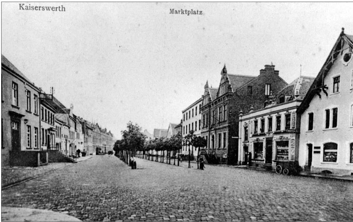
Der Kaiserswerther Markt vor rund 100 Jahren in barriere- und autofreiem Zustand (Quelle: Zeitgenössische Ansichtskarte).

Nachdem in den vergangenen Jahren im Rahmen der „Entwicklungskonzepte Kaiserswerth“ die historische, ehemalige Reichsstadt um vieles verschönt und aufgebessert wurde, es sei hier nur auf den Klemensplatz, den Grünzug im ehemaligen Festungsgraben und die Bastion St. Suitbertus verwiesen, wartet der Kaiserswerther Markt noch auf eine Verschönerung. Die Fliednerstraße ist bis zum Jahresende noch in Arbeit. Dass auch auf dem Kaiserswerther Markt eine Notwendigkeit für eine Umgestaltung oder Aufbesserung gesehen wird, belegen die teils emotionalen Diskussionen zum Thema und das anhaltende Siechtum der „rotblühenden Kastanien“ auf dem Mittelstreifen. Die Bezirksvertretung hatte wiederholt entsprechende Anträge an die Verwaltung gestellt. Jetzt soll es endlich mit Bürgerbeteiligung an die Planung gehen. Gesucht werden Ideen der Bürger für eine Umgestaltung. Der Auftakt für diese Bürgerbeteiligung ist eine Informationsveranstaltung am Montag, den 24. November um 18 Uhr in der Aula der Kaiserswerther