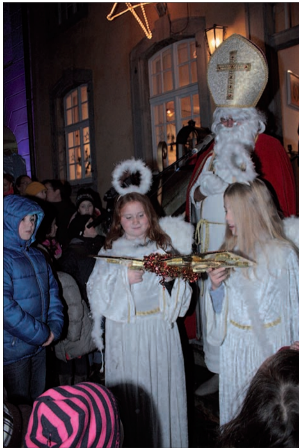
Der Nikolaus und seine beiden Engelchen erscheinen beim Nikolausmarkt zweimal.