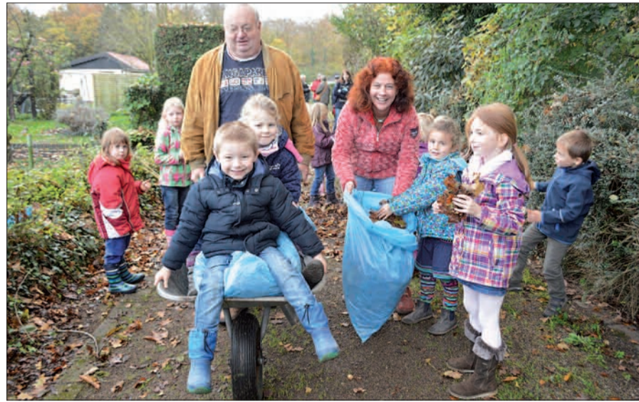
sam Tolle Gartenarbeit: Laub sammeln und Schubkarre fahren.