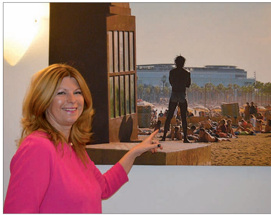
Ob Barcelona, Paris, Rom oder gar die Bahamas - die meist großflächigen Fotografien ziehen die Betrachter schnell in ihren Bann.