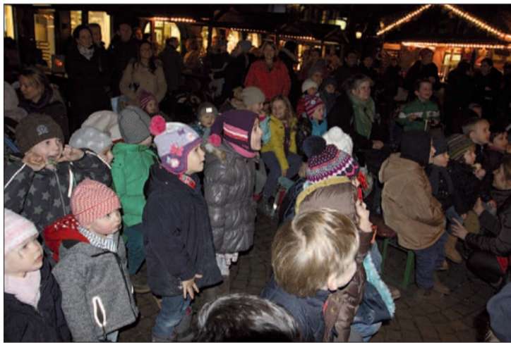
Jede Woche gibt es einen Kindertag auf dem Weihnachtsmarkt in Kaiserswerth.