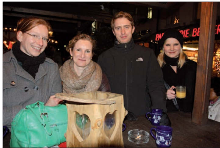
Auch für „große“ Leute gibt es hübsche Dinge zum Entdecken und Verweilen.