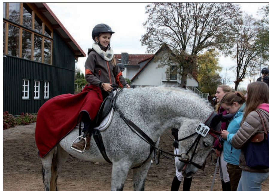
Liebevoll gesattelt und mit einer warmen Pferddecke versehen, bereiten sich die Teilnehmer auf das Turnier vor.