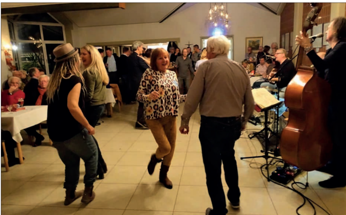
Das Hilfswerk des Lions-Club-Duisburg lädt wieder nach Rahm ein: Für einen guten Zweck kann man essen und trinken sowie gute Gespräche führen – und auch mal ein Tänzchen wagen.

Karten gibt es ausschließlich an der Abendkasse: Erwachsene zahlen 10 Euro, Jugendliche 4 Euro. Die Mit-