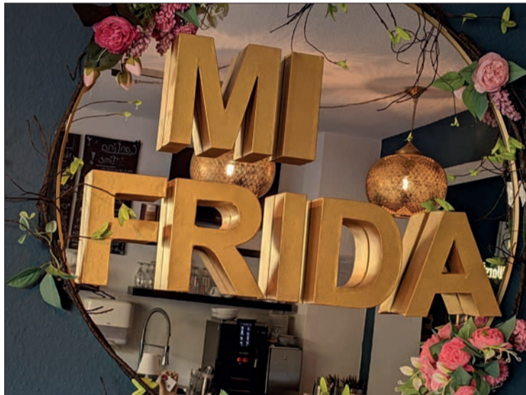
Der Name Mi Frida ist hier im hübschen Restaurant Programm.

kreiert, das den Novembertag eindeutig verschönert (20 Euro pro Person). Auch für die Kinder gibt es extra Speisen (15 Euro pro Kind). „Da ich gern plane und es nicht mag, Essen zu verschwenden, bitte ich um Reservierung, am liebsten telefonisch unter 0173/56 23 217“. Mi Frida, Angermunder Straße 5, 40489 Düsseldorf, Telefon 0173/56 23 217 www.mi-frida-bistro.ea-tup.com Geöffnet Mittwoch & Donnerstag von 10 Uhr bis 19 Uhr, Freitag & Samstag 12 Uhr bis 21 Uhr, Sonntag 12 Uhr bis 19 Uhr Essen zum Abholen und für private Veranstaltungen