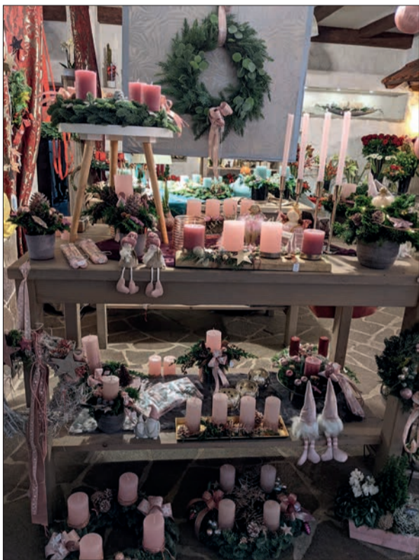
Bereits am Sonntag, 30. Oktober, beginnt bei „Rosen Ruland“ der Adventverkauf.

Weitere Infos findet man im Internet: www.rosen-ruland.de