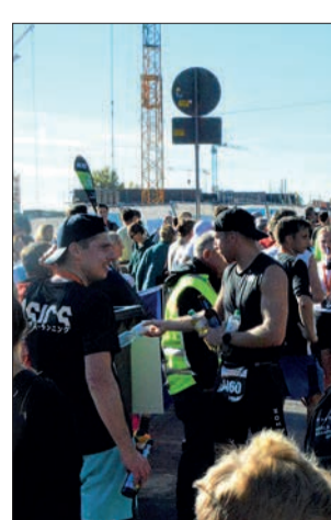
Der Zieleinlauf des fünften Rhein-City-Runs verlief in diesem Jahr erstmals parallel zum Edeka-Center Angerbogen – die Teilnehmenden wurden hier mit großem Applaus empfangen.

1.600 Aktive hatten sich für den Halbmarathon angemeldet. Ob alleine oder in kleinen beziehungsweise großen Laufgruppen: Alle freuten sich, nach zweijähriger Corona-Pause endlich wieder diese außergewöhnliche Laufstrecke bestreiten zu können. Angefeuert von mehreren Musikgruppen unterwegs führte der Weg bis ins Neubaugebiet „Am Alten Angerbach“. Parallel zum Edeka-Center verlief die Zielgerade, die in diesem Jahr wirklich eine war. Der Beifall der zahlreichen Zuschauerinnen und Zuschauer tat allen gut.