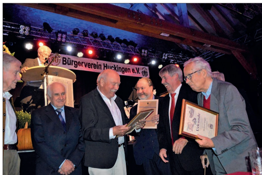
Mitglieder des aktuellen Vorstands überreichten den anwesenden Gründungsmitgliedern ihre Urkunde.