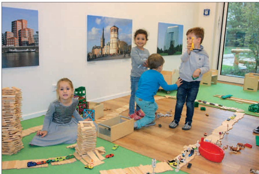
Bauen nach Herzenslust auf viel Raum können die Kinder im neuen Bauraum.

len nachmittags noch länger bleiben möchte. Ein großes Kompliment gibt es