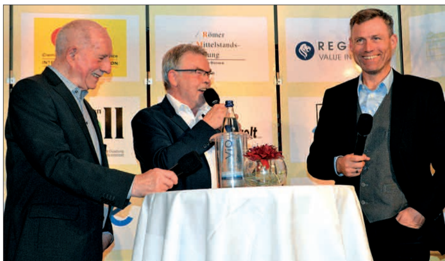
Noch einmal ließ Werner Hansch (links) die Gäste beim Landhaustreff miterleben, wie Ingo Anderbrügge (rechts) das erste Tor im Elfmeterschießen 1997 gegen Inter Mailand verwandelte – auch zur Freude von Manni Breuckmann.