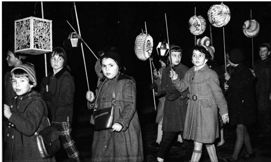
Wunderschöne Kindheitserinnerung an den Martinszug 1960.

Martinsfest ist ein Fest, das durch den Umzug alle Menschen einer Gemeinde zusammenbringt, die Kinder, die in der Dunkelheit mit ihren selbstgebastelten Fackeln stolz dem ganzen „Dorf“ ihre Werke präsentieren, mit Licht die Dunkelheit erhellen, die kleinen Kinder, die damit schon Teil der Gemeinschaft werden, wobei die Disziplin mancher begleitender Eltern oft zu wünschen übrig lässt, die Neuankömmlinge, vielleicht anderen Glaubens, und die älteren Menschen, die gerne an eigene frohe Kindertage im Martinszug zurückdenken (so wie ich, erste links, siehe Foto). Eine Reduzierung des Festes auf eine Präsentation auf dem Schulhof passt nicht zum Brauchtum des Martinsfestes voller Symbolik, in dem schon zeitmäßig der größte Teil des Rituals im Umzug besteht! Auch das Vorhaben, wenn ich es richtig verstanden habe, nur eine halbe Tüte auszugeben, widerspricht