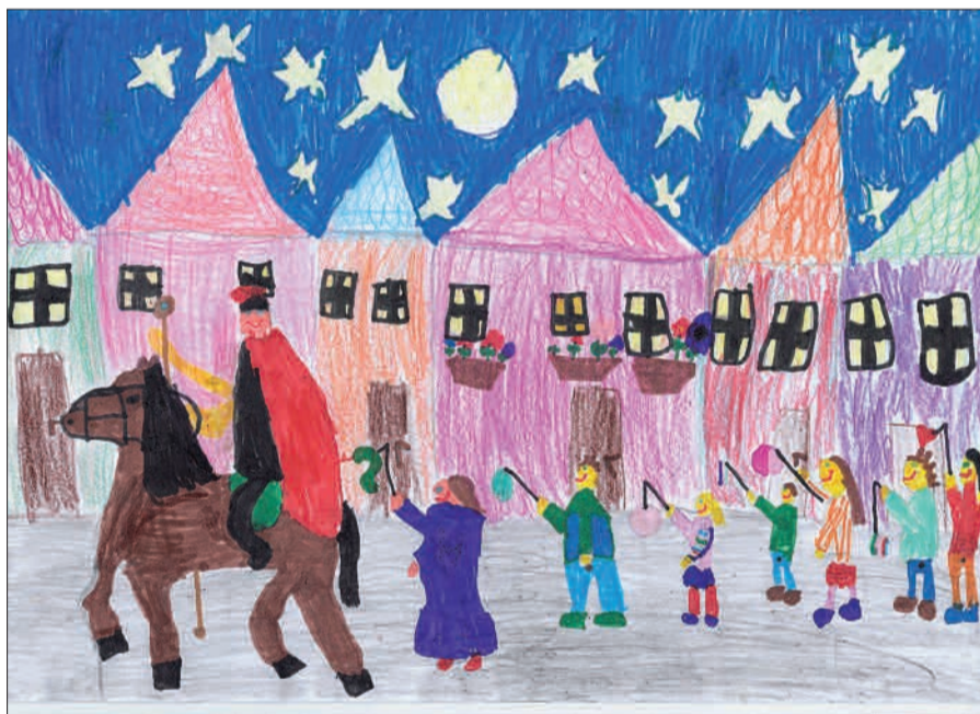
Dieses Bild hat beim Malwettbewerb in der Kaiserswerther Grundschule den 1. Preis gemacht