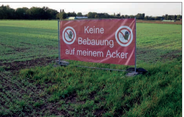
Protestplakat auf dem Teil des Planungsgebiets nördlich Kalkumer Schlossallee, welches nach bisherigen Aussagen von Politik und Verwaltung Frei-, Grün- und Sportfläche bleiben soll.