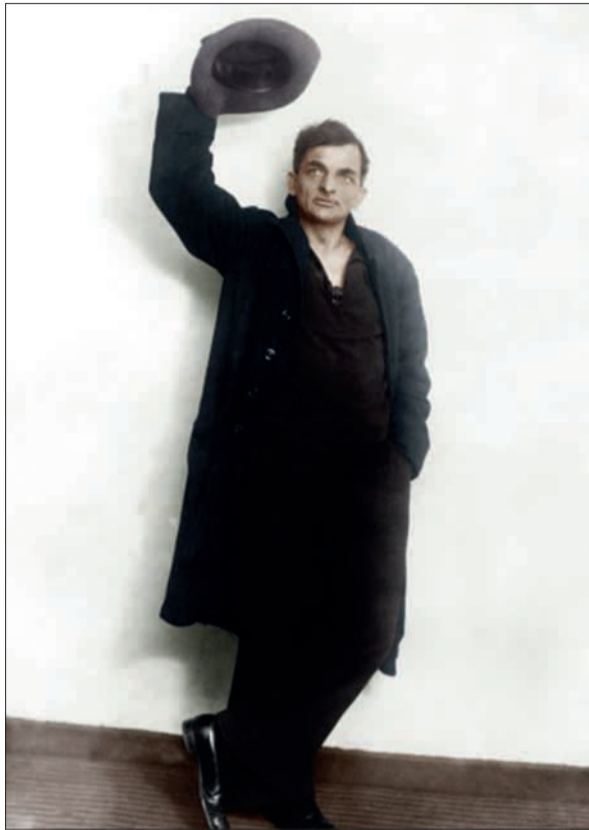
Joachim Ringelnatz in Pose.