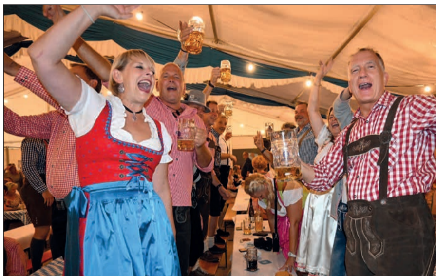
Passend zum weiß-blau geschmückten Zelt kamen auch die Gäste in zünftiger Tracht: In Lederhosen und Dirndl feierten sie ausgelassen.