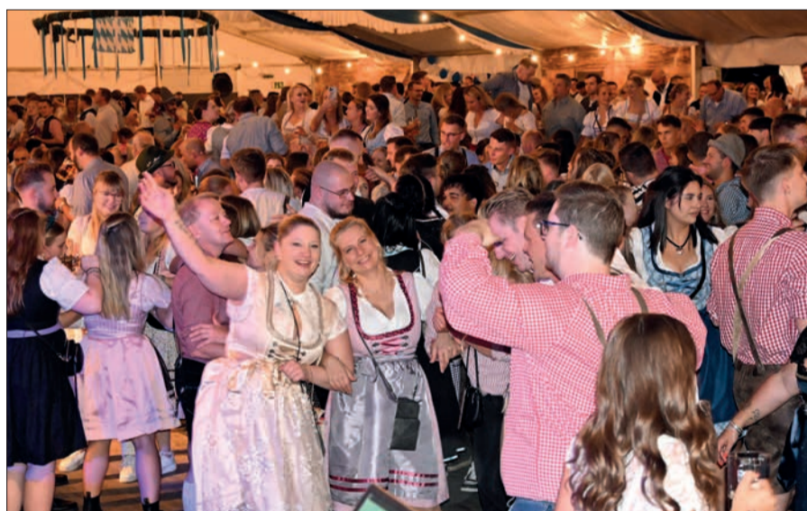
Die Band „BayernMafia“ ließ es musikalisch im Festzelt krachen - sehr zur Freude der knapp 3.000 Besucher, die schnell die Tanzfläche in Beschlag nahmen.