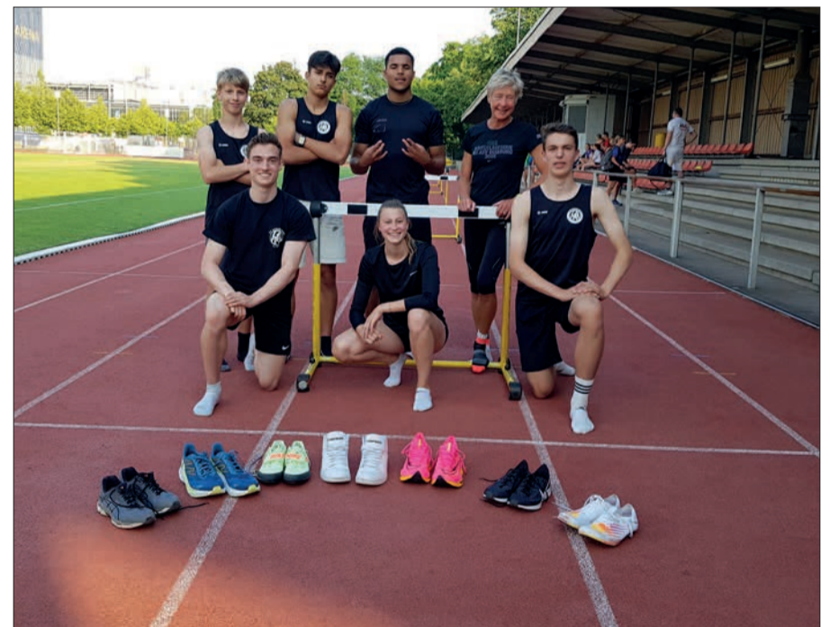
Nicht nur die Leichtathleten machen im TVA Furore. Auch andere Abteilungen konnten in den vergangenen Monaten tolle sportliche Erfolge einfahren.

Mehr Infos über die sportlichen Erfolge beim TVA folgen in der nächsten Ausgabe am 29. Oktober. GS