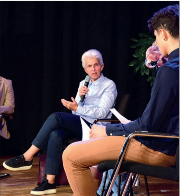
Die FDP-Politikerin Marie-Agnes Strack-Zimmermann sprach in der MMG-Aula mit Schülerinnen und Schülern über aktuelle politische Themen.

die Kommunikation mit die Marie-Agnes Strack-Zimmermann als Vorbild dienen dem politisch aktiven Schülern und Schülern, für