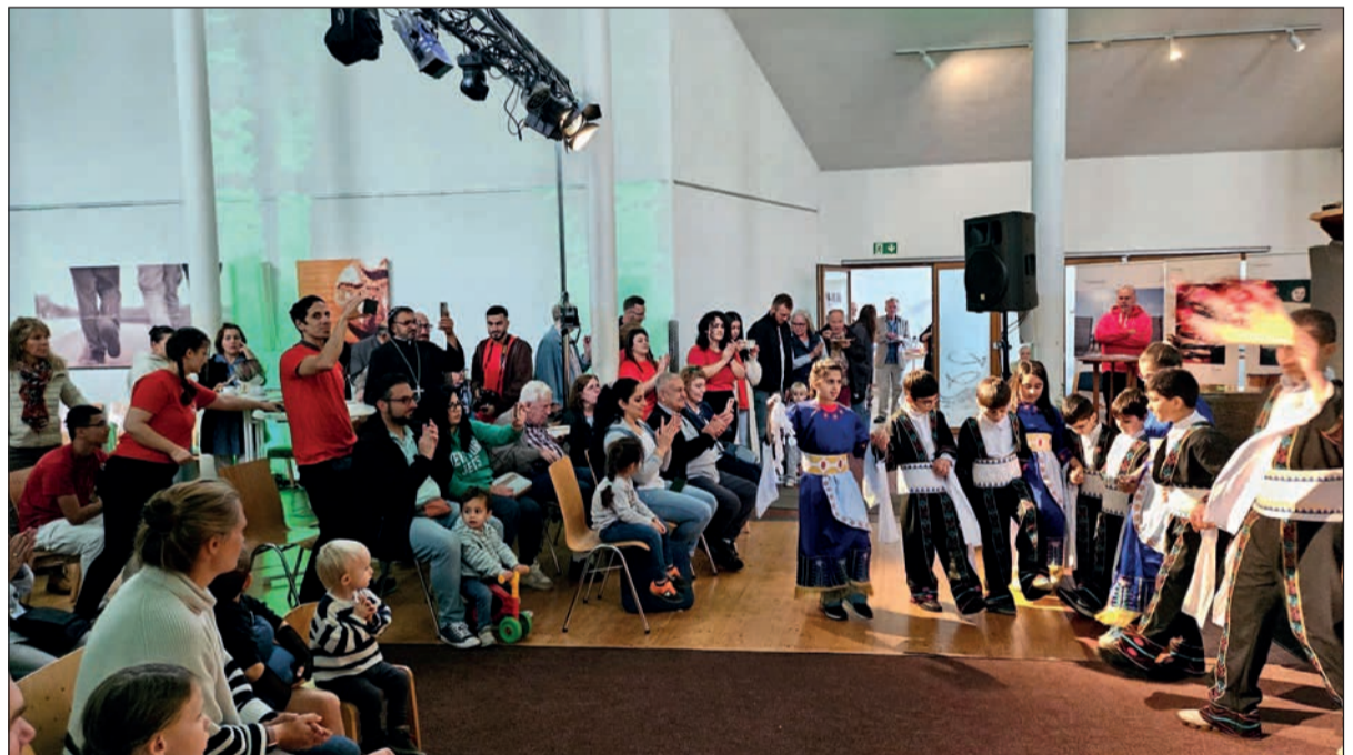
Viele Gruppen haben sich an dem Programm des Festwochenendes in Ungelshem beteiligt.

fasst der Pfarrer zusammen und erinnert mit Dank „an alle, die durch ihren ehrenamtlichen Einsatz oder durch Kuchenspenden zum Erfolg des Festes beigetragen haben, aber auch an die Teams unserer Kitas und an unsere Kirchenmusikerin.“ sam