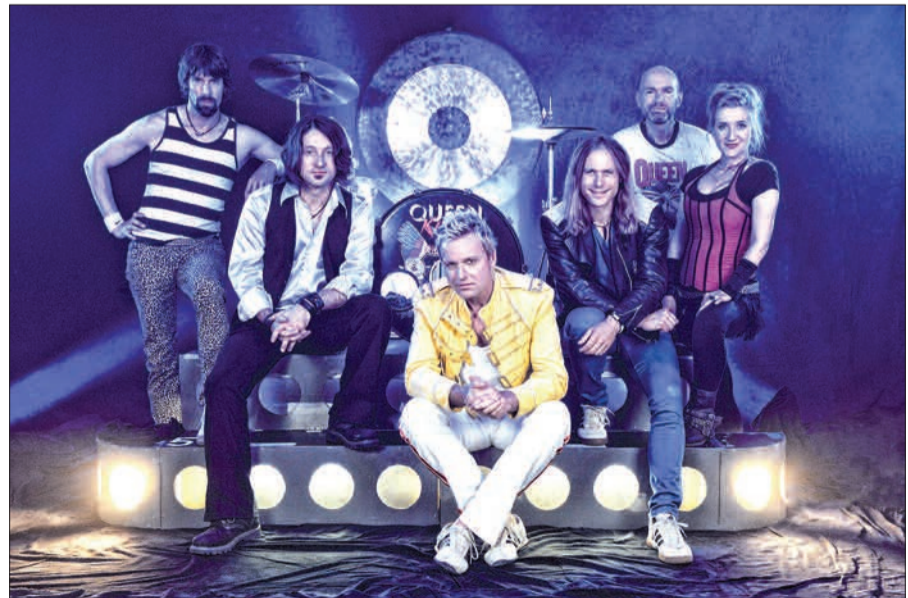
„Queen Kings“, die führende Queen-Tribute Band Deutschlands, trägt mit ihren Songs sicherlich zum Gelingen des Abends bei. Karten sind in der Geschäftsstelle des Steinhofs und unter der Rufnummer 0203/72999984 erhältlich, und über die Homepage: www.steinhof-duisburg.de

immer ehrenamtlich. Die Förderung durch zahlreiche Sponsoren, darunter auch die Sparkasse Duisburg, trage hoffentlich dazu bei, einen Spendenbetrag zu erzielen, der viel bewirken kann. Zu dem Konzert werden ebenfalls vom DRK Duisburg betreute Flüchtlinge eingeladen. Der Einlass erfolgt ab 18 Uhr. Karten kosten im Vorverkauf 19 Euro. Text: sam