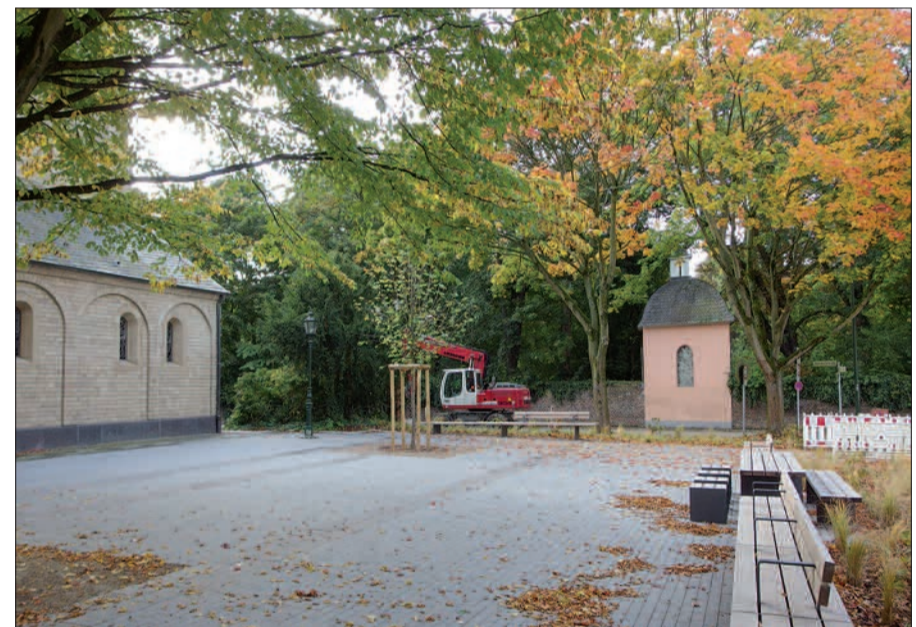
Der neue Kalkumer Dorfplatz noch ohne Mittelpunkt oder Blickfang. Im Hintergrund die Gedenkstätte für Ferdinand Lassalle im Gartenhaus des Schlosses.

Die Wiederherstellung von Edmund-Bertrams-Straße und der Oberdorfstraße nach den Kanalarbeiten ist jetzt so gut wie abgeschlossen. Über 5 Jahre wurde die Geduld der Kalkumer strapaziert, wobei nicht zuletzt die Umleitung der Buslinie 760 um das Dorf herum und die sehr dürftigen Ersatz-Haltestellen an der Zeppenheimer Straße belastend waren. Der NORDBOTE konnte allerdings von der Rheinbahn noch keine Information darüber erhalten, wann der Bus wieder auf der Strecke durchs Dorf fährt. Die Brücke über den Schwarzbach soll auch noch erneuert werden. Im Haushaltsplan-Entwurf 2016 sind dafür nochmals € 160 000,- ausgewiesen. Vorher wird mit Sicherheit nicht damit begonnen. Für den von der Bezirksvertretung beantragten Umbau des Zeppenheimer Dreiecks liegen noch keine Pläne vor. Der Dorfplatz Kalkum ist bereits fertig mit soliden Tischen und Bänken. Es fehlt noch ein Mittelpunkt oder Blickfang bzw. ein „Dekorationsstück“. Dafür werden Sponsoren gesucht. Ursprünglich war dafür die historische, mechanische Kirchenuhr vorgesehen, aus Kostengründen wurde davon Abstand genommen. Mit diesem Platz bekommt Kalkum einen ansehnlichen Mittelpunkt. Außerdem wird die Kirche von Norden und von der erneuerten Bushaltestelle her barrierefrei erreichbar. Früher stand ungefähr auf dieser Fläche der „Bollinger Hof“, der Kalkumer Dorfgasthof, vor und in dem die Schützenfeste stattfanden. H.S.