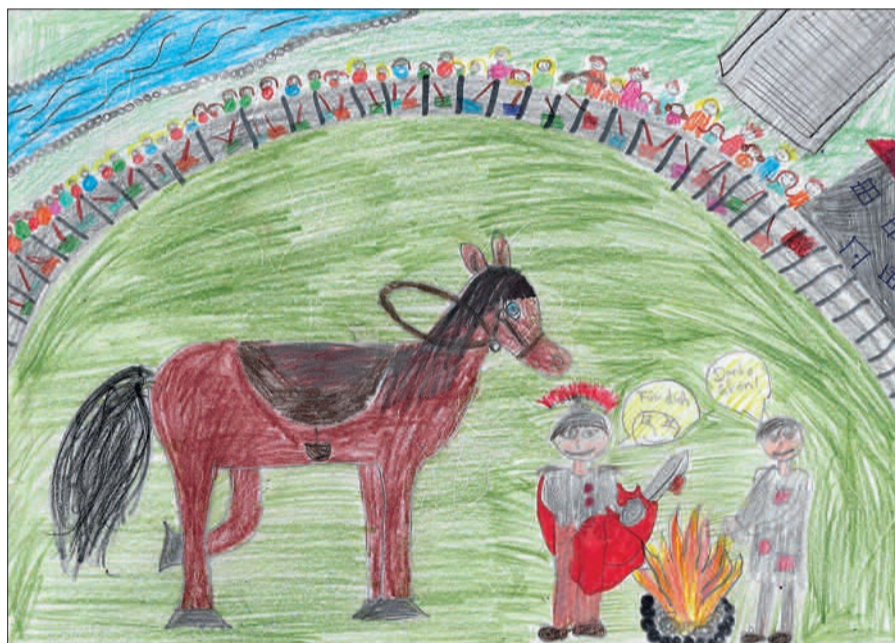
Den 1. Preis des Laternenwettbewerbs, ausgeschrieben von der St. Sebastianus Bruderschaft Kaiserswerth, gewann Hristina aus Klasse 4 M-A.

und konnte stolze 100 Euro für die Klassenkasse verbuchen und schließlich Emi auf Platz drei aus Klasse 4 b, der mit seinem Entwurf 50 Euro für die Kasse beisteuern konnte. Am 10. November können alle Großen und Kleinen die Laternen bestaunen, wenn der Zug um 17 Uhr auf der Fliederstraße vor der Grundschule startet. Die Mantelteilung findet im Park unterhalb der Klemsbrücke statt. Die Martinstützen werden im Anschluss an die Mantelteilung ausgegeben. G.S.