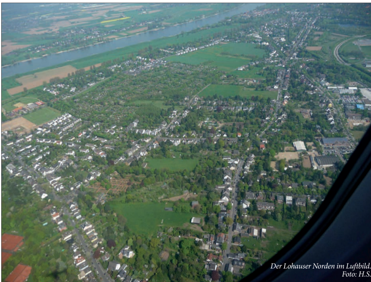
Der Lohausener Norden im Luftbild.

So sieht ein Fluggast beim Start auf Lohausen (nördlicher Teil): Viel Grün, große Freiflächen und aufgelockerte Bauweise. Auf der rechten Bildhälfte oben ist deutlich der „Morgens Stern“ zu erkennen, mit den sternförmig zusammenlaufenden Straßen. „Morgen“ ist zwar ein Flächenmaß, stand früher aber auch für ein Stück (bewirtschaftetes) Land. Die früher häufig genutzte Bezeichnung für diese Straßenkreuzung bedeutet also „Straßenkreuzung an einem Stück Land“. Schon in fränkischer Zeit ab (6. Jahrh. n. Chr.) kreuzten sich hier Straßen und Wege. Bis nach Kriegsende stand dort ein Gasthof mit Saal, der sich ebenfalls „Morgens Stern“ nannte. Östlich (rechts) des Morgens Sterns sollen im Mittelalter die Galgen des Kreuzberger Femegerichts gestanden haben.