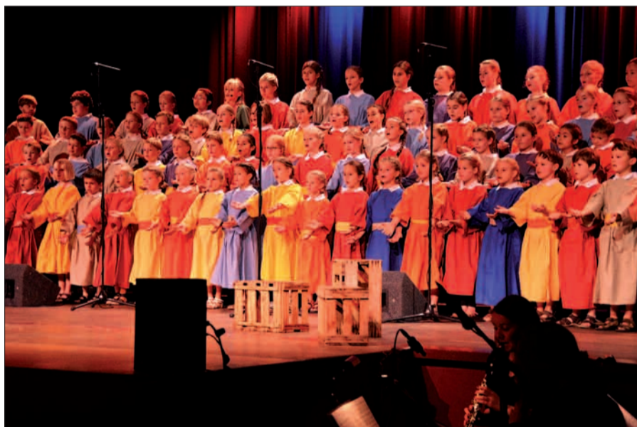
Geballte Stimmkraft der jungen Sängerinnen und Sänger vom Remigius Chor aus Wittlaer kommt hier zum Einsatz.