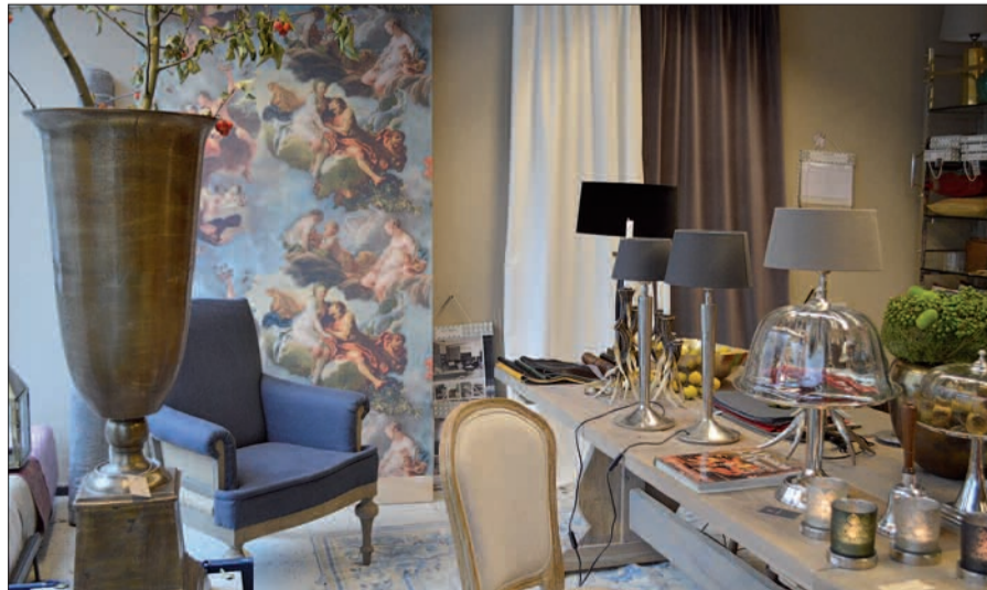
Bei einem Gang durch die Ladenlokale in Kaiserswerth und Huckingen bekommt man viele Anregungen für stilvolles Wohnen.