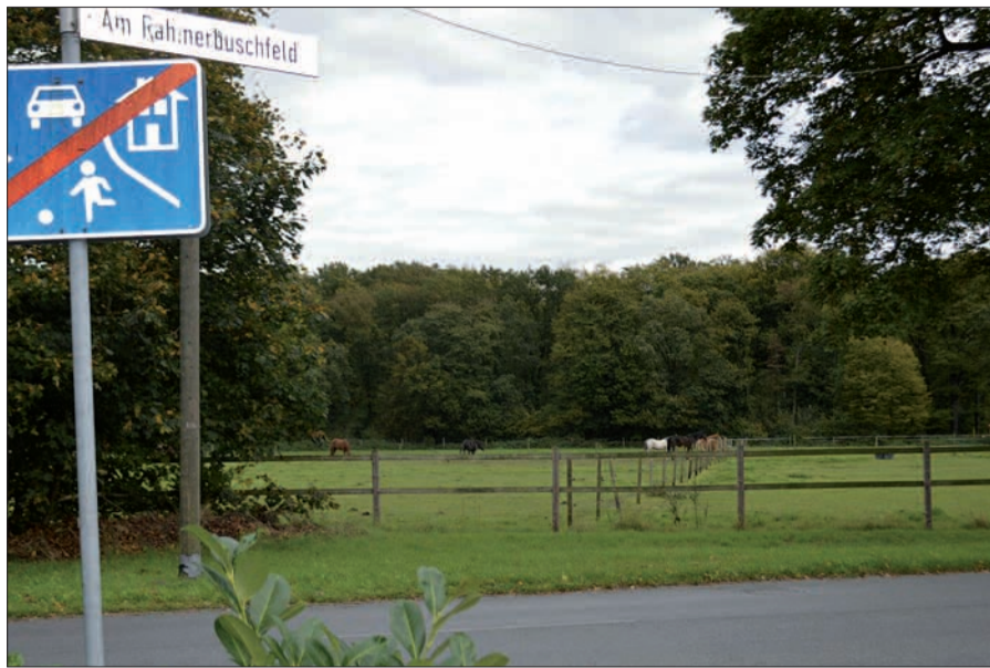
Statt grasender Pferde sollen laut Vorschlag für „Duisburg 2027“ Wohnungen im Rahmerbuschfeld bis zur Waldgrenze in Rahm entstehen.

am Rahmer See stünden viele alte Bäume mit besonderem Wert. Beschlussvorlage Laut der Beschlussvorlage der Verwaltung soll das bisherige Gewerbegebiet an der Beckerfelder Straße zugunsten von Wohnbebauung am dortigen See aufgegeben werden. Der auszuweisende Streifen zwischen dem Rahmer Sportplatz und dem Hinterland an der Angermunder Straße soll nun bis zum Waldrand gehen. Neu ist weiterhin eine Fläche, mit der Rahm-West verdoppelt werden könnte, südlich von der B 288. Auch in anderen Stadtgebieten waren die Planer aktiv. So soll in Serm zusätzlich zu den Freiflächen nördlich der Straße Am Lindentor, der restlichen Fläche zwischen Dorfstraße und An der Bastei auch das Neubaugebiet Am Kollert nach Osten hin ausgeweitet werden, bis zur B 288. Ebenfalls ist ein Streifen südlich An der Bastei im Plan. In Huckingen gibt es keine Veränderungen. Folgende neue Wohngebiete sind vorgesehen: der Bereich der ehemaligen Förderschule an der Albert-Schweitzer-Straße, hinter dem „Geisterbahnhof“ und östlich der Stadtbahn-Haltestelle „Kesselsberg“. Auch die Planungen für Mündelheim bleiben unverändert. Neue Häuser sollen am östlichen Ortsrand südlich der B 288 entstehen. sam