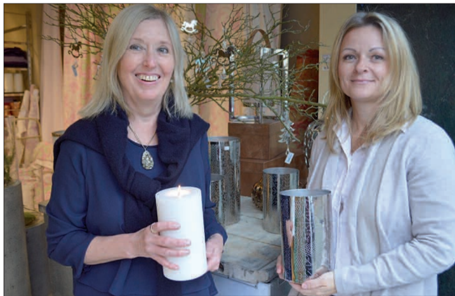
Geschulte Mitarbeiter beraten gerne die Kunden. Aber man darf auch einfach nur reinkommen, um zu stöbern und anzufassen.

Rat und Tat zur Seite.“ Zum weiteren Leistungsspektrum gehören neben individuellen Fensterdekorationen, Nähatelier und Polsterarbeiten auch hochwertige Malerarbeiten, Lichtplanung, Leuchten, Möbel für den Innen- und Außenbereich, Kunstobjekte und Styling. Die Showrooms in Duisburg und Düsseldorf werden häufig neu dekoriert, um den Besuchern neue Impulse zu geben. In Kürze wird eine große und interessante Adventsausstellung zu sehen sein. „Philipp Frauenheim Interieurs“ findet man sowohl an der Düsseldorfer Landstraße 284 in 47259 Duisburg-Huckingen und am Kaiserswerther Markt 28 in 40489 Düsseldorf-Kaiserswerth. Die Ladenöffnungszeiten in Huckingen ist dienstags bis freitags von 10 bis 18 Uhr und samstags von 10 bis 14 Uhr. In Kaiserswerth öffnet Philipp Frauenheim sein Geschäft montags bis freitags von 10 bis 18.30 Uhr und an Samstagen von 10 bis 18 Uhr. Weitere Infos findet man im Internet unter www.philipp-frauenheim.com .