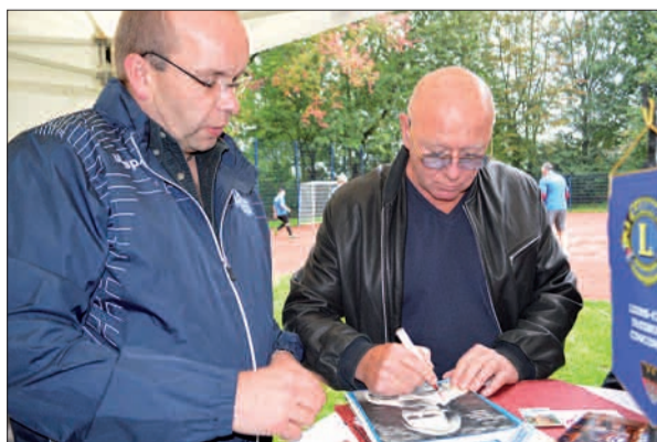
MSV-Legende Rudi Seliger gab zahlreiche Autogramme.

die der Lions-Club jährlich verkauft. Neben zwei Toren wurde der gesamte Bodenbereich mit einer neuen Deckschicht versehen und die Ballfangzäune erneuert. Der Bereich unter den Streetballständern wurde neu gepflastert und sechs Bänke zum Ausruhen nach dem Sport aufgestellt. Ein spannendes Spiel schloss sich an die Eröffnung an. Es wird nicht das letzte auf dieser Anlage gewesen sein. sam