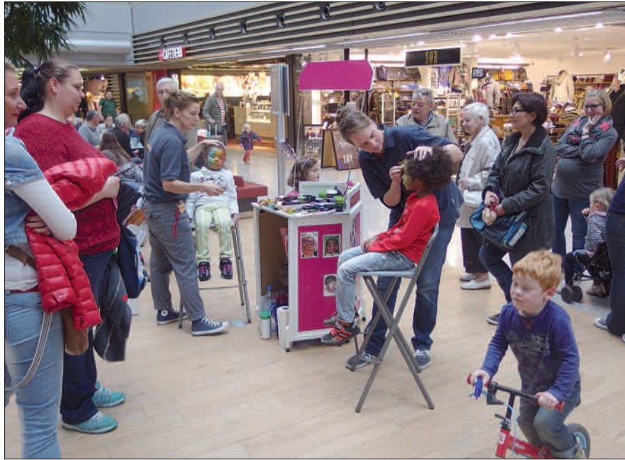
Beim Verwandeln in eine Fee, ein Lieblings- oder Fantasietier bringen Mädchen sehr viel Freude auf.

Wer unbeschwert von seinen „Kids“ Sonntags-Shopping und die günstigen „Gastro-Spezials“ in den Airport-Arkaden genießen möchte, findet seine Kleinen in der ebenfalls kostenlosen Kinderbetreuung gut aufgehoben (2 – 11 Jahre). Parken