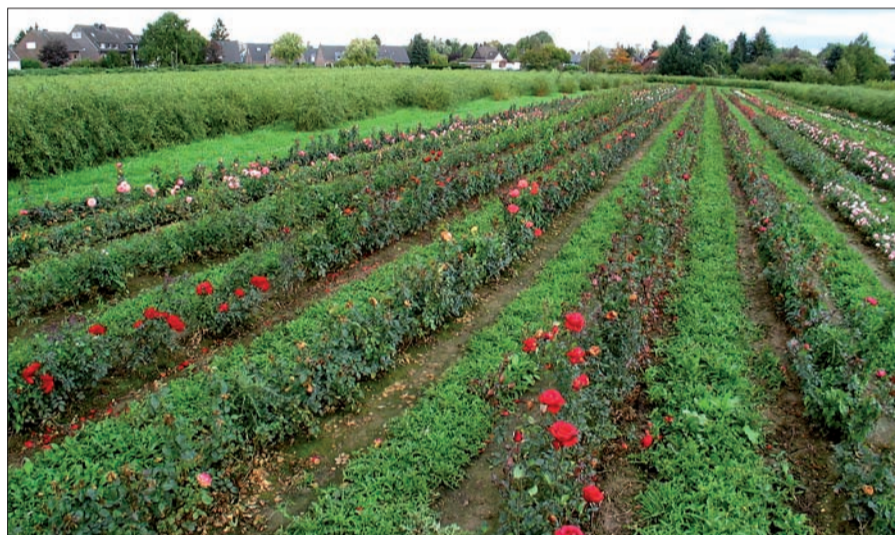
Wenn „Duisburg 2027“ so verwirklicht wird, wie es die Planer jetzt vorschlagen, könnten hier in einigen Jahren Häuser statt Rosen stehen.