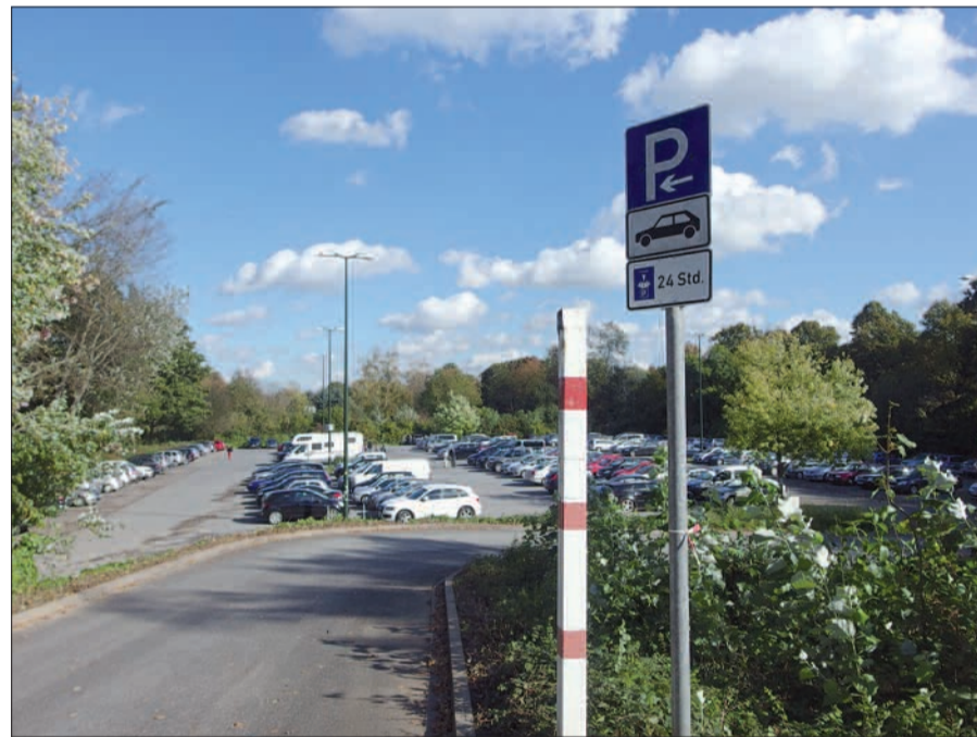
Auf dem Parkplatz An St. Swibert/Niederrheinstraße (ehemaliger Sportplatz) ist eine Parkscheibenregelung eingeführt worden.