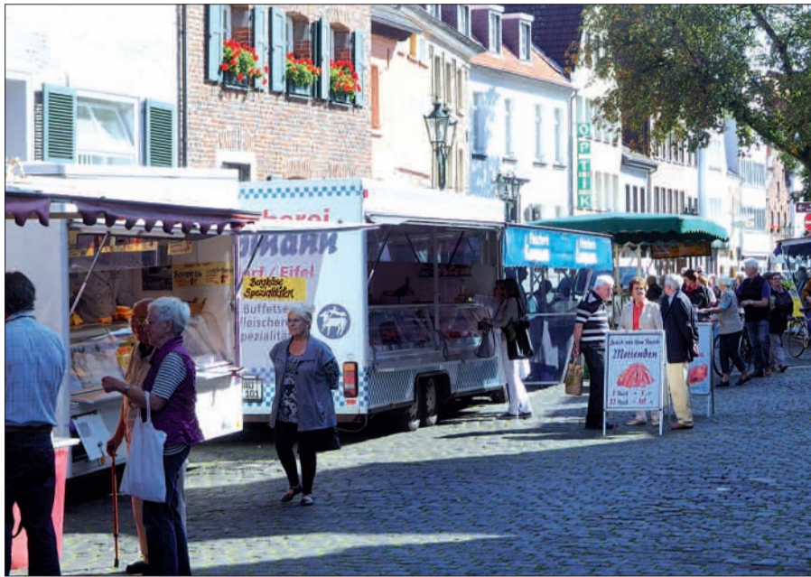
Wochenmarkt mit knackfrischen Produkten, vielen netten Leuten und den Rheinblick gibt es gratis als Sahnhaube obendrauf – damit kann der Kaiserswerther Markt seit kurzem immer mittwochs punkten.

dieser Straßenabschnitt mit seiner leichten Wölbung mit dem „Schiffchen“ und dem Haus Nr. 7 im Mittelpunkt eines Halbkreises deutlich höher liegt als der daran anschließende innere Ortsteil. Bei Hochwasser behielt man auf dem „Goldenen Bödemken“ länger trockene Füße, ehe man auf die Hochwassertreppen vor den Häusern steigen musste.