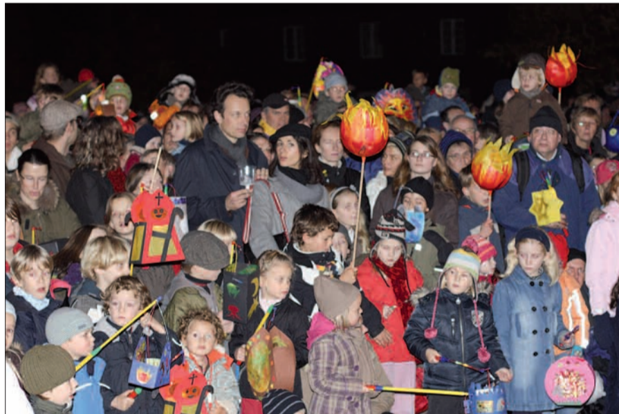
Leuchtende Kinderaugen bei der Mantelteilung im Kalkumer Schlosshof.

Kalkum: Am Samstag, 8. November bis 17 Uhr stellt sich der Martinszug auf der Unterdorfstraße in Höhe Haus Nr. 1 (Ortseingang von Einbrungen kommend) auf. Die Kanalbauarbeiten behindern den Umzug durch das historische Dorf nicht mehr. Im Innenhof des Schlosses findet die Martinsfeier mit Tütenausgabe statt. Die dafür gesammelten Spenden reichen nicht nur für prall gefüllte Tüten, sondern auch noch für die örtliche KiTa und weitere karitative Einrichtungen. Die weit über 100jährige Tradition des Kalkumer Martinszuges