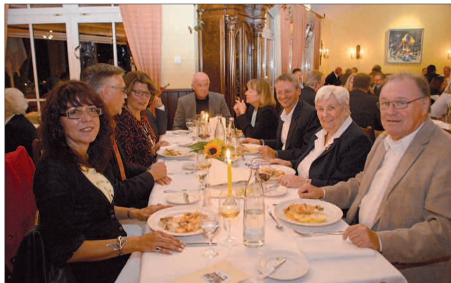
Die etwa 100 Gäste ließen es sich schmecken. Kurzweiliger Talk und Kabarett verkürzten die „Wartezeiten“.