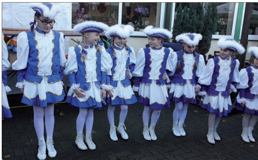
Schon am 9.11. wecken die Angermunder Karnevalisten den Hoppeditz. Gleiche Welle, aber nicht gleiche Stelle, denn diesmal findet die Party im Garten des Angerkrugs statt.

Das ganze Spektakel soll bei hoffentlich trockener Witterung im Garten des Angerkrugs über die Bühne gehen.