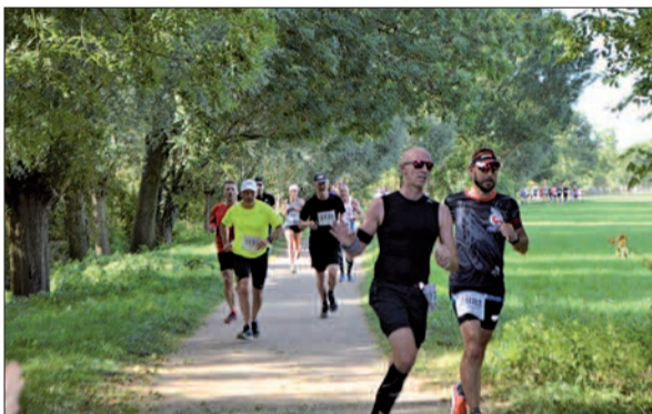
Nach der langen Strecke am Rhein führte der Halbmarathon über Duisburger Felder und Wiesen – durch herrliche Landschaften.