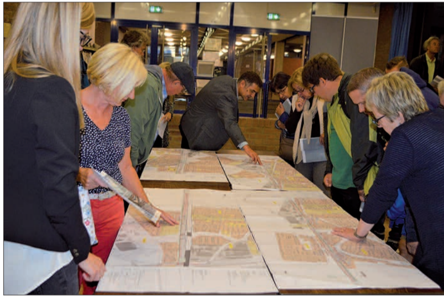
Interessierte Bürger schauten sich genau die Pläne an, die DB-Mitarbeiter mitgebracht hatten.