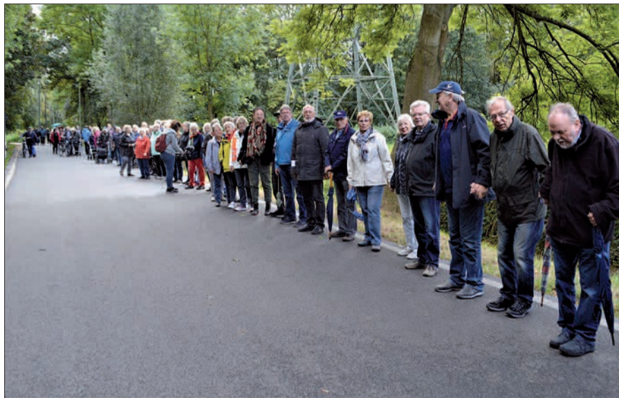
Mehr als 100 Bürger beteiligten sich an einer Menschenkette zwischen Ungelshheim und Hüttenheim. Sie befürchten massive Nachteile durch den neuen Fahrplan für Busse und Bahnen.

Kurz vor dem Aktionstag hatte die Stadt Duisburg gemeinsam mit der DVG in ei-