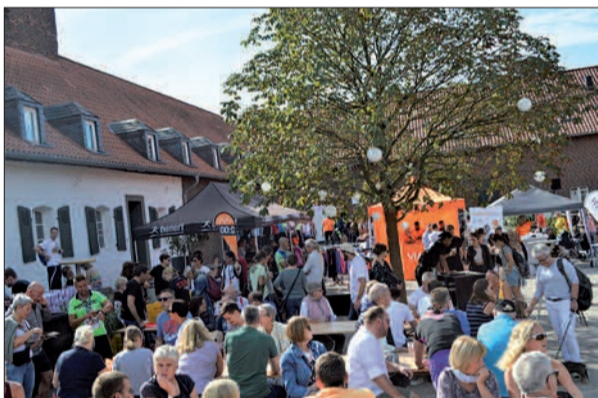
Im Innenhof des Steinhofs klang der Rhein City Run gemütlich aus.