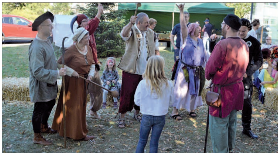
Bei einem Mitmachtheater zum „Rattenfänger von Hameln“ kam am evangelischen Gemeindefest in Ungelsheim keine Langeweile auf.

Auch der gesellige Austausch kam - ebenso wie das