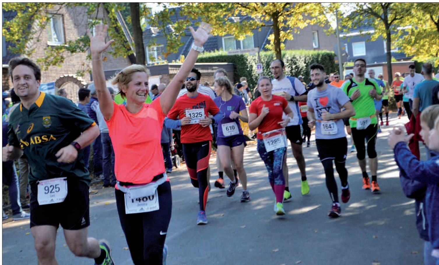
Hoffentlich spielt das Wetter am 14. Oktober wieder mit - dann werden sicherlich wieder viele Besucher im Zielbereich am Steinhof in Huckingen die Läufer für den Endspurt anfeuern.