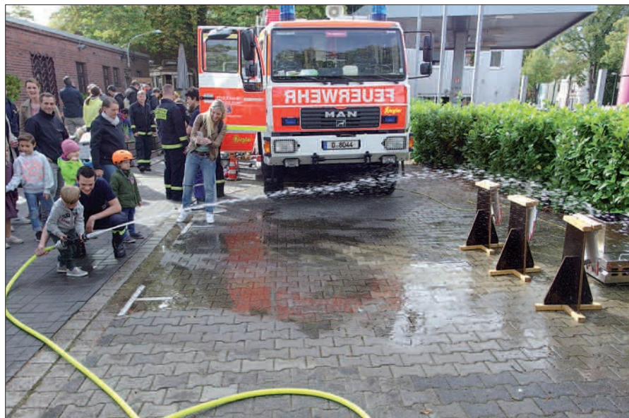
Kleiner Feuerwehrmann mit der Spritze im Einsatz.