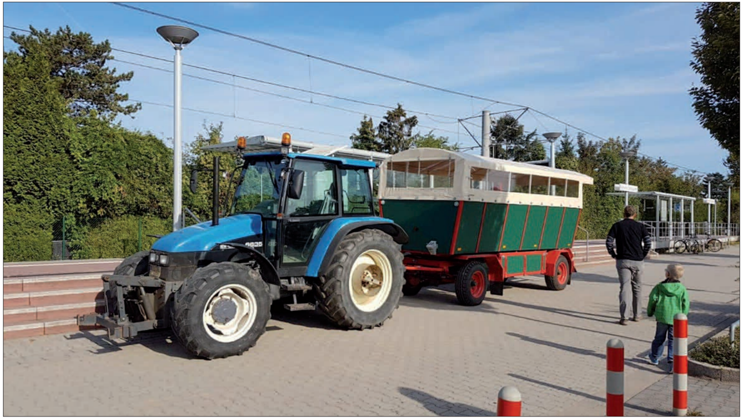
Erfüllung von Kinderträumen - Planwagen fahren.