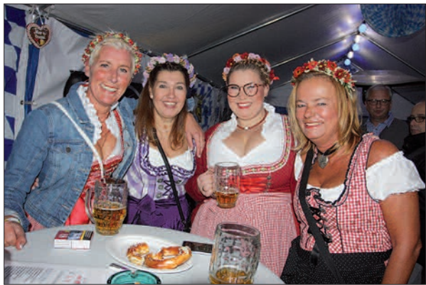
Vier gut gelaunte Damen in Dirndl auf dem Oktoberfest in Angermund.

noch. Bis in die späten Abendstunden wurde gefeiert, getanzt und vor allem viel gelacht. Ein voller Erfolg für das nunmehr 10. Oktoberfest auf dem Mühlenhof in Angermund. G.S.