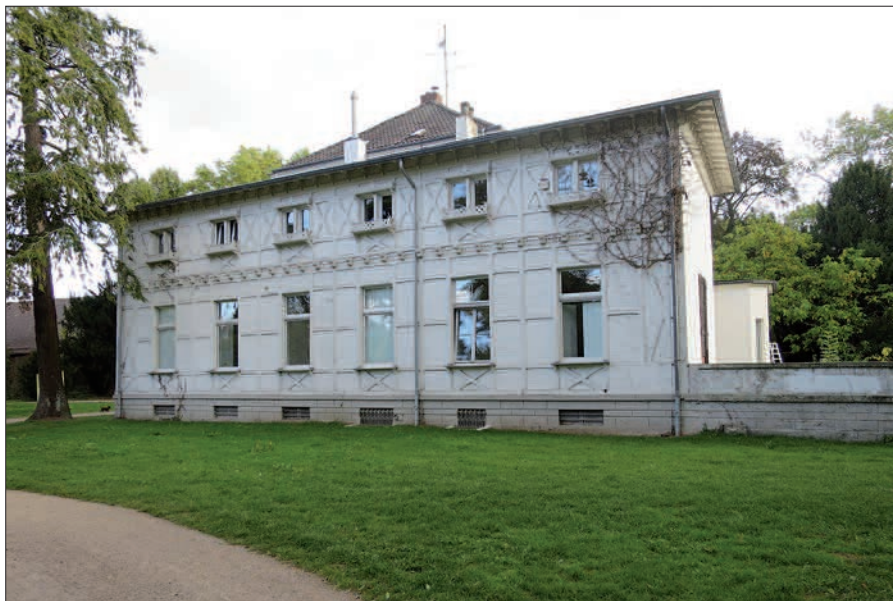
H.S. Die Nordseite lässt das stattliche Ausmaß der Villa im Lantz`schen Park erkennen. Foto: H.S.

Die Villa ließ Heinrich Balthasar Lantz anstelle einer Wasserburg zu Beginn des 19. Jahrhunderts errichten. Er war 1798 in seine Heimatstadt Düsseldorf zurückgekehrt und wurde Stadtverordneter, nachdem er im Kolonialhandel auf Mauritius zu Vermögen gekommen war. Die Wasserburg war ein Rittersitz des Freiherren Ferdinand von Calcum, gen. Lohausen gewesen. Nur noch Fundamentreste sind davon im Keller der Villa vorhanden.