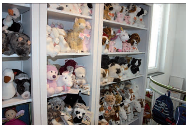
Kuscheltier-Stelldichein beim Hotzenplotz: für die Kleinsten in waschbarer Mikrofaser von Herzend.