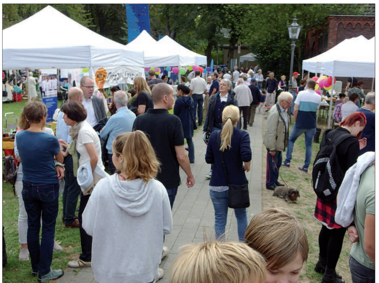
An rund 30 Ständen gab es ausführliche Infos aus erster Hand über die verschiedenen Geschäftsbereiche der Kaiserswerther Diakonie, die Arbeit und die unterschiedlichsten Angebote im sozialen und pädagogischen Bereich. Entsprechend groß war der Andrang interessierter Besucher.