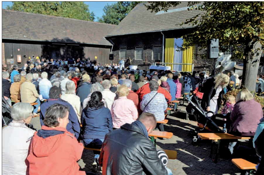
Fast 500 Christen waren nach Huckingen gekommen, um gemeinsam Gott für die vielen Erntegaben auf dem Altar zu danken.