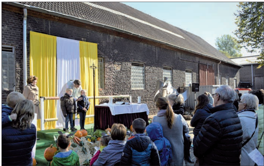
Mädchen und Jungen des Kindergartens St. Peter und Paul trugen unter anderem die Fürbitten vor.