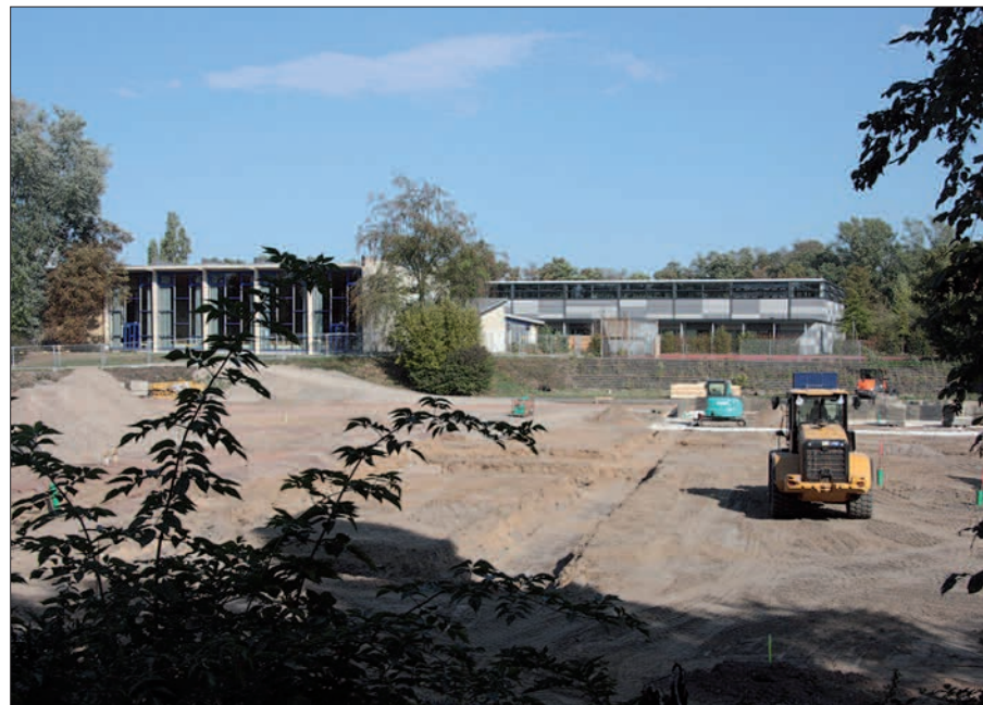
In vollem Gang sind die Bauarbeiten für die Realschule Golzheim auf der Koetschaustraße.

Der Neubau für eine vierzügige Realschule mit Sporthalle ist in vollem Gang. Im so genannten Totalunternehmerverfahren wird dieser Bau errichtet, das heißt: ein genauer Plan wurde im Vorfeld erstellt, europaweit vorgeschrieben, und die Gesamtkosten aller Leistungen wurden im Paket abgefragt. Alle Unterlagen wurden dann von Architekten auf ihre Effektivität hin bewertet. Das wirtschaftlichste Angebot hat gewonnen. Die Gesamtkosten für die Ausstattung der Schulräume sind übersichtlich, am meisten wird in die Fachräume investiert. Im Frühjahr 2020 soll der Bau fertig sein.