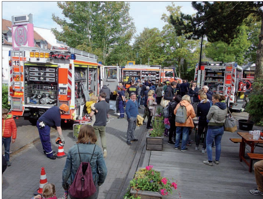
Eindrucksvolle Fahrzeugschau mit Offenlegung von Technik und Arbeitsgerät.

chefin“ Helga Stulgies (zuständige Dezernentin). Auch etliche Politiker wurden gesichtet, einerseits, um dem ehrenamtlichen Dienst der Feuerwehrmänner ihre Anerkennung zu zollen, andererseits vielleicht auch, um an deren Ansehen in der Bevölkerung teilzuhaben. Allerdings gibt es immer noch keine Lösung für die inzwischen viel zu kleine Kaiserswerther Feuerwache an der Friedrich-von-Spee-Straße. Die Pläne für einen Ausbau waren bereits bis zur Baugenehmigung fertig, wurden jetzt aber erst mal wegen zu hoher Kosten bzw. wegen Kostensteigerung verworfen. Die Zu- bzw. Ausfahrten zu diesem Standort sind auch nicht optimal. Jetzt wird ein neuer, günstiger Standort gesucht. Im Gespräch ist die Ecke An St. Swibert/Niederrheinstraße am Verkehrskreisel. Mit Fahrzeugen und technischen Gerät ist die Kaiserswerther Feuerwehr gut ausgestattet. Davon konnten sich die Gäste der Jubiläumsfeier eindrucksvoll überzeugen. Die 34 Feuerwehrleute, darunter 3 Frauen, unter Leitung von Löschgruppenführer Brandoberinspektor Herbert Goldbrunner, zeigten und erläuterten mit sichtbarem Stolz ihre Ausrüstung. Mit einer 15köpfigen Jugendfeuerwehr, darunter 3 Mädchen, gibt es auch Nachwuchs aus den eigenen Reihen. H.S.