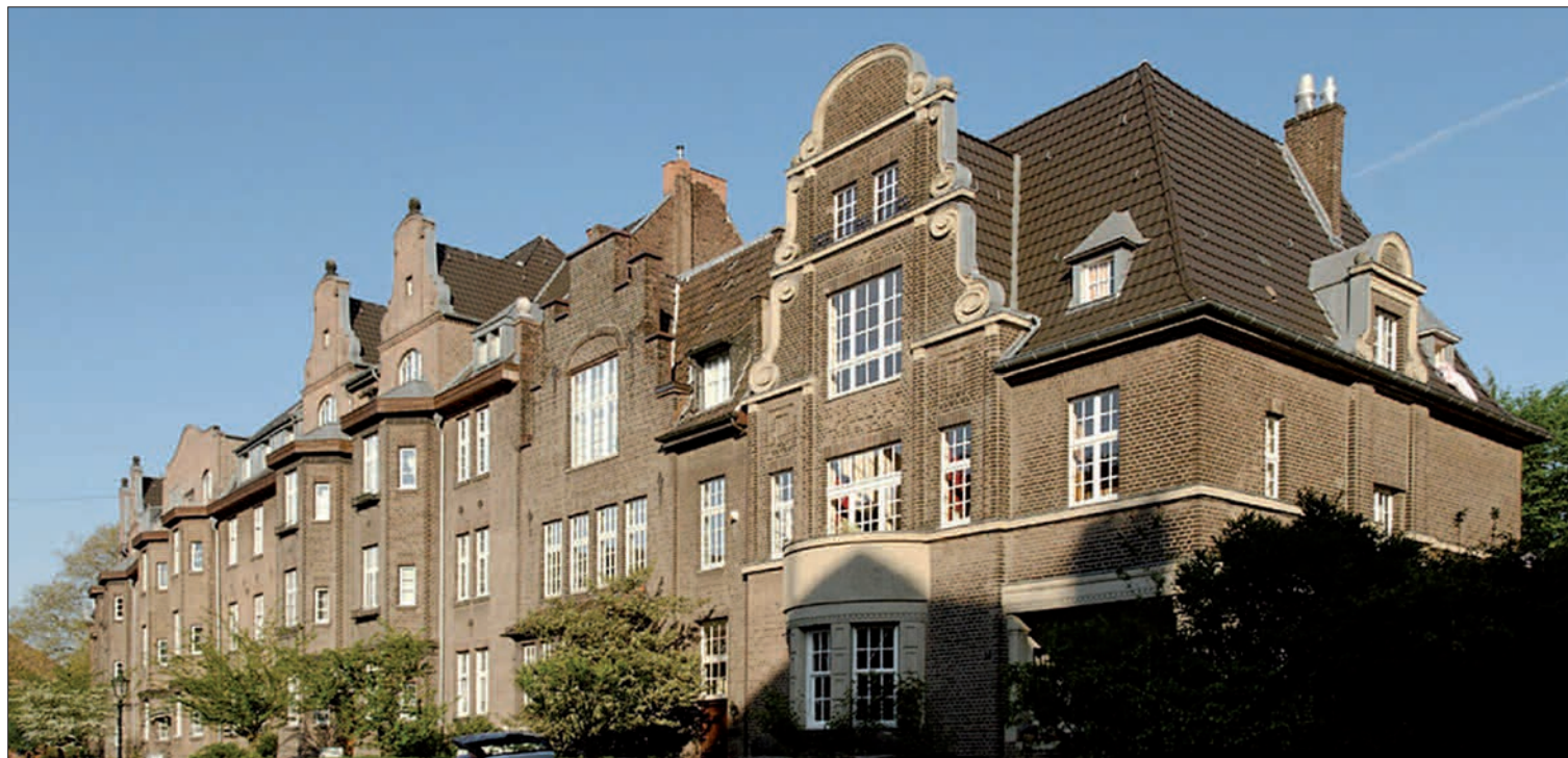
Sitz von PMP am Binnenwasser 5.