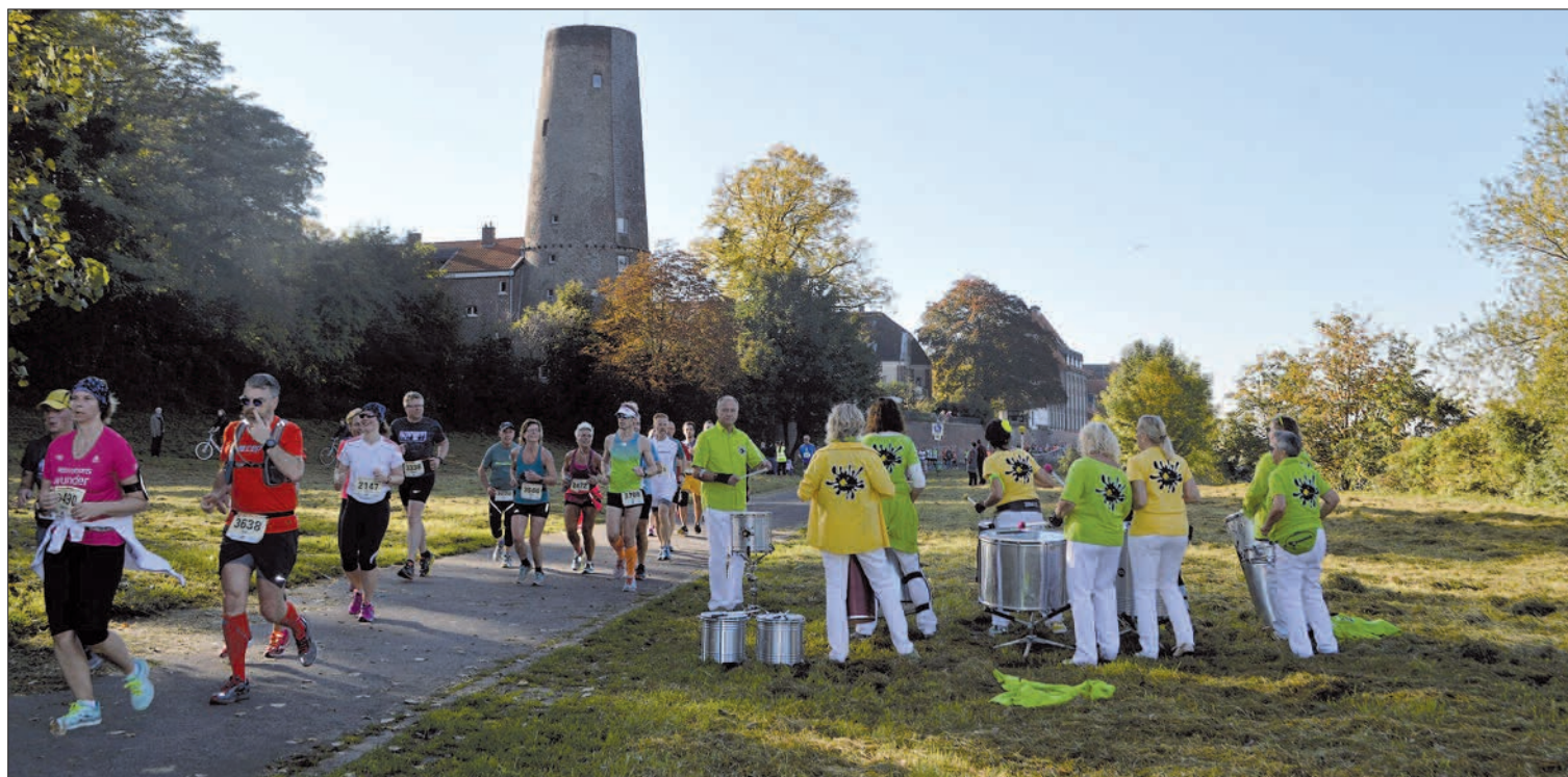
Lange laufen die Sportler am Rhein entlang und können den Ausblick genießen. In Kaiserswerth wird wieder ein Samba-Gruppe für den richtigen (Lauf-) Rhythmus sorgen.

Mit dem Lauf unterstützen die Veranstalter Bunert Marketing GmbH in Kooperation mit Oberem Sport Service GmbH sowie Stadt-sportbund Duisburg die Duisburger Hilfsorganisation I.S.A.R. Germany, welche ehrenamtlich unter dem Dach der Vereinten Nationen (UN) bei Naturkatastrophen als Such- und Rettungsteam sofort in die betroffenen Regionen reist.