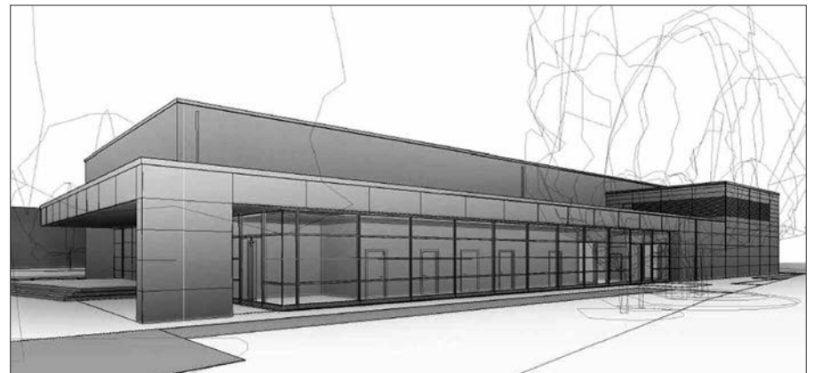
So soll sie laut Animation aussehen, die neue 2-fach Sporthalle in Wittlaer, die eine echte Bereicherung sein wird, und zwar nicht nur für die Franz-Vaahsen-Gemeinschaftsgrundschule, sondern auch für den Ort und alle Vereine.

sich früher im Musiksaal getroffen haben, weil keine andere Räumlichkeit zur Verfügung stand.“ Wir sind Franz Das Leitbild der Grundschule ist klar: „Wir sind Franz“, heißt es. Dass eine Schüler Vollversammlung aber vorher nie möglich war, weil es hier einfach nicht genug Raum gab, war schade. „Selbst unsere Einschulungsfeier mussten wir an zwei Tagen durchführen, aus Platznot“, räumt der Schulleiter ein. Auch die Theater AG freut sich auf die neue Bühne. „Wenn alles gut geht, können wir nach den Sommerferien 2019 in der Halle an den Start gehen“, freut sich Dr. von der Gathen. Und noch ein Bonus gibt's hinzu: wo früher nur ein Turm zum Klettern stand, der im Zug der Bauarbeiten abgebaut werden musste, wird nun ein 4-fach-Burghof errichtet. G.S.