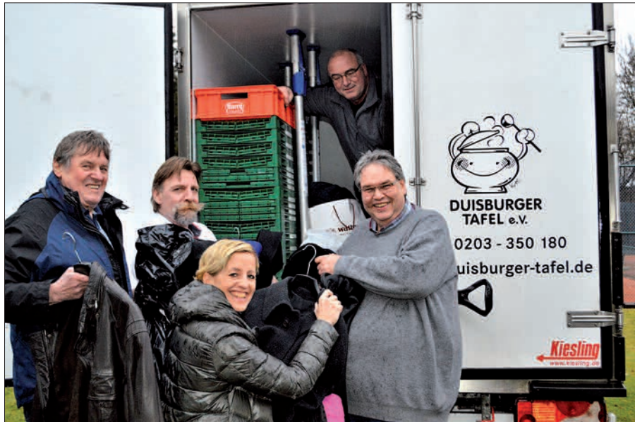
Zum dritten Mal in Folge sammeln die Rahmer Tennisspieler warme Kleidung für Obdachlose und Bedürftige. Sie werden im Tennisclub gelagert, bis sie von der Duisburger Tafel – wie in den Vorjahren - abgeholt werden.