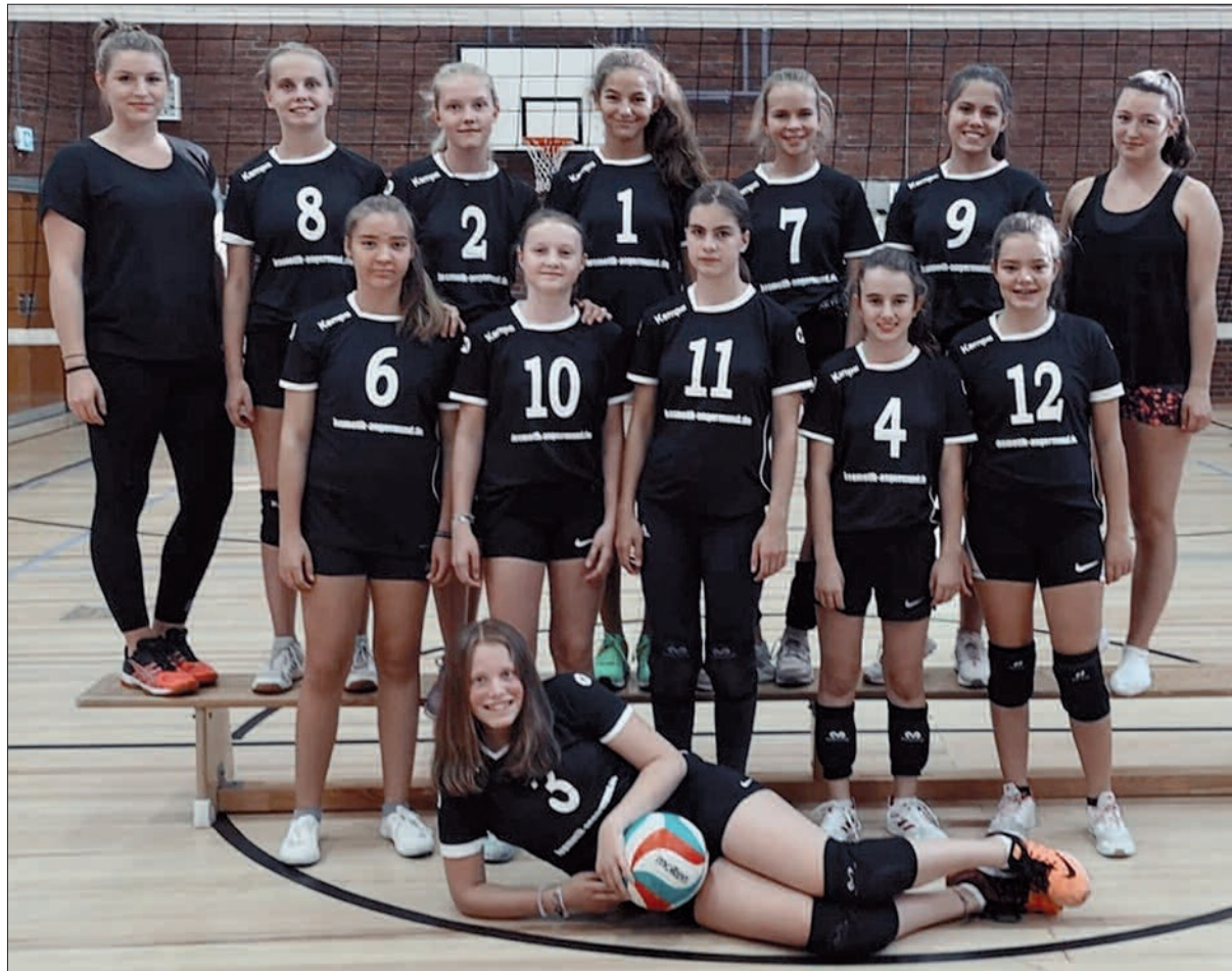
Nun sind sie U18, die Volleyballerinnen des TVA.

gezeigt, was in ihnen steckt und werden sicher für eine Altersklasse höher. Doch Kenner sind sicher: Die Mädchen haben längst schon gut sein. G.S.