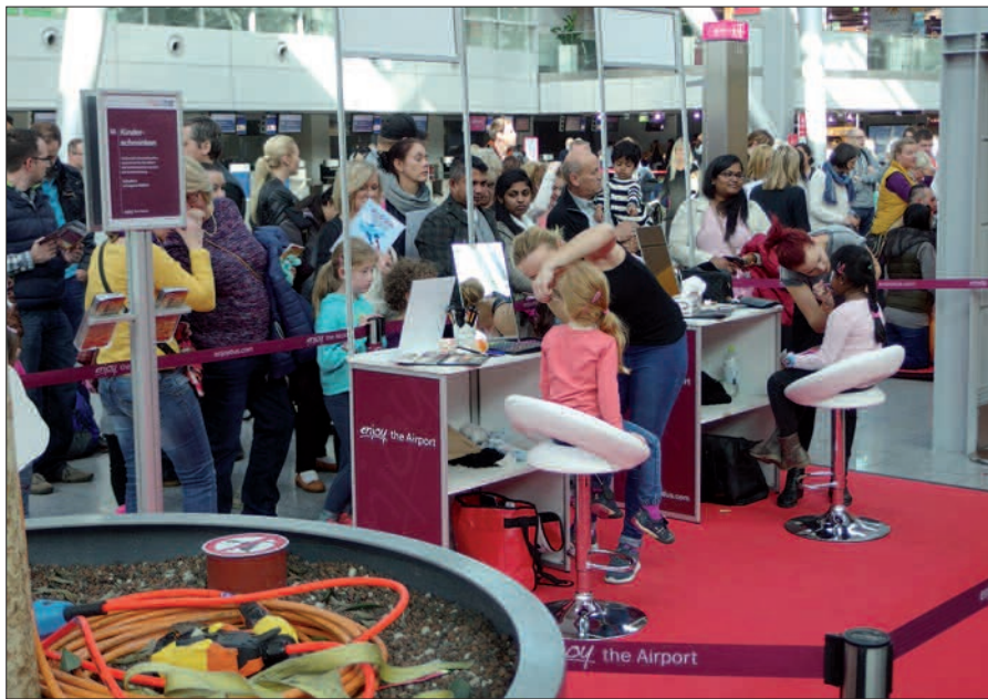
Der Schmink-Salon ist eine besonders von Mädchen gefragte Einrichtung bei den Airlebnis-sonntagen auf dem Flughafen.

Während des Schoppens und Genießens in 60 Shops und Restaurants, dem Bummel durch den Reisemarkt oder solange man mit den