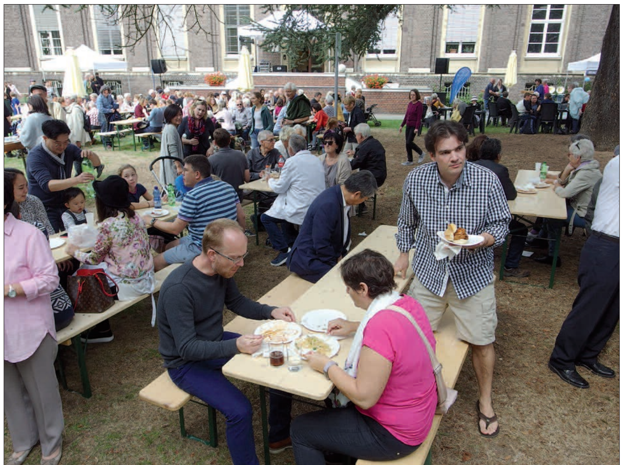
Die internationale Küche war lecker und sehr gefragt.

Die unterschiedlichen Arbeitsgebiete und Geschäftsbereiche des Kaiserswerther Diakoniewerkes mit einem vielseitigen Angebot von sozialen, gesundheitlichen, pädagogischen und anderen Leistungen kann man kaum besser und angenehmer kennenlernen als auf den Diakonie-Jahresfesten. Das 182. Jahresfest am 9. September fiel in diesem Jahr in Kaiserswerth zusammen mit dem Kartoffelfest, dem BÜ- und Kunsthandwerk-ermarkt, gleichzeitig auch verkaufsoffener Sonntag und „Tag des offenen Denkmals“. Dennoch oder auch vielleicht gerade deswegen und dazu noch bei herrlichem Wetter drängelten sich auf der Festwiese neben der Diakonie-Buchhandlung an der Alten Landstraße besonders viele Besucher durch die Info-, Aktions- und Imbissstände. Es gab viele Mitmach- und Unterhaltungsangebote, insbesondere für Familien und Kinder. Es fehlten weder Kletterwand noch Bastel- und Malangebote, es gab noch vieles andere mehr. Eine eigene Feuerwehr hat das Diakoniewerk zwar noch nicht, die freiwillige Feuerwehr zeigte und erklärte ihre Technik und Ausrüstung. Kaffee und Kuchen, und das internationale kulinarische Angebot wurde gern und mit Appetit angenommen. An rund 30 Ständen waren Gespräche mit Mitarbeitern des Diakoniewerks möglich. Auch Oberbürgermeister Thomas Geisel beehrte das Fest mit seinem Besuch und seinen Begrüßungsworten. Für die musikalische Unterhaltung sorgte die „Sozial-Service-Band“ von Mitarbeitern und ein Chor der vier Kindergärten des Diakoniewerkes. H.S.