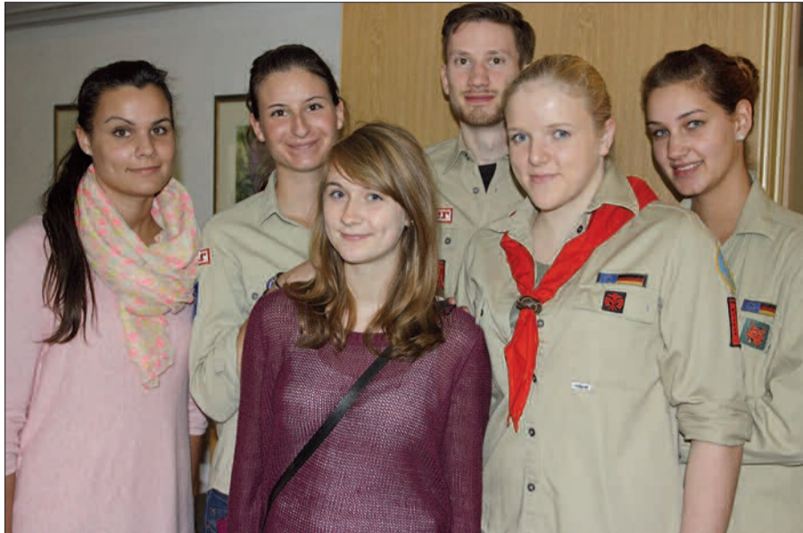
Das charmante Pfadfinderinnenteam von St. Hubertus ist immer zur Stelle, wenn man sie braucht.