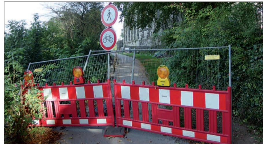
H.S. Gesperrter Leinpfad vor der Kaiserpfalz.

Schon etliche Wochen zieht sich der Austausch des Geländers der Uferpromenade in Kaiserswerth hin. Nur gelegentlich sieht man jemanden an der Baustelle arbeiten. Die Absperrung an der Promenade selbst hat die Qualität eines Löwengangs, Löcher für die Pfosten des Geländers sind schon lange gebohrt, aber vom neuen Geländer ist noch nichts zu sehen. Der Leinpfad vor der Kaiserpfalz ist auch abgesperrt. Schöne Spazier- und Promenadengänge im herrlichen Altweibersommer sind sehr beeinträchtigt.