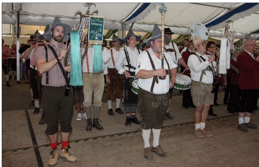
In Serm ging die Post ab. Zuerst haben die Musikanten von den St. Sebastianern das Oktoberfest offiziell eröffnet.