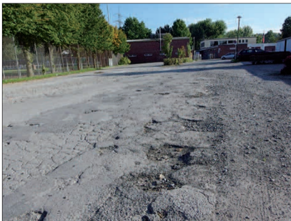
Der Freiheitshagen ist keine vorzeigbare Zufahrt für Sportler und Gäste zu den Angermunder Sportanlagen.

gen Zustand. Bezirksverwaltungsstellenleiter Karl-Josef Eisel erläuterte, dass „Flickarbeiten“ aus Mitteln allgemeiner Instandhaltung möglich sind, auch wenn kein spezieller Haushaltstitel vorhanden ist. Interfraktionell beantragte die Bezirksvertretung dennoch die Aufnahme einer Haushaltsposition in 2016, den Freiheitshagen in einen akzeptablen Zustand zu versetzen, der so lange anhält, bis nach der terminlich unbestimmten Kanalverlegung eine endgültige Herstellung erfolgt. H.S.