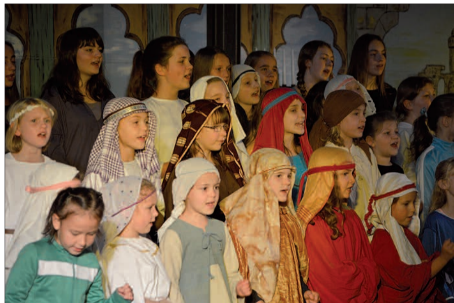
Mehr als 60 Mädchen und Jungen der Kinder- und Jugendchöre der evangelischen Kirchengemeinde Großenbaum-Rahm erzählten musikalisch „Die Reise nach Jerusalem“.