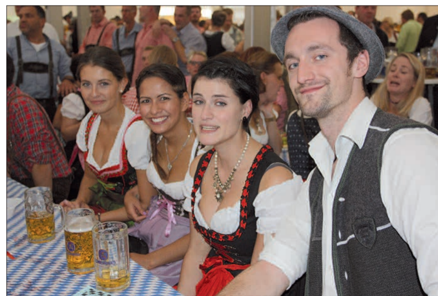
Eine Augenweide waren die Besucherinnen und Besucher des Oktoberfestes in Serm.