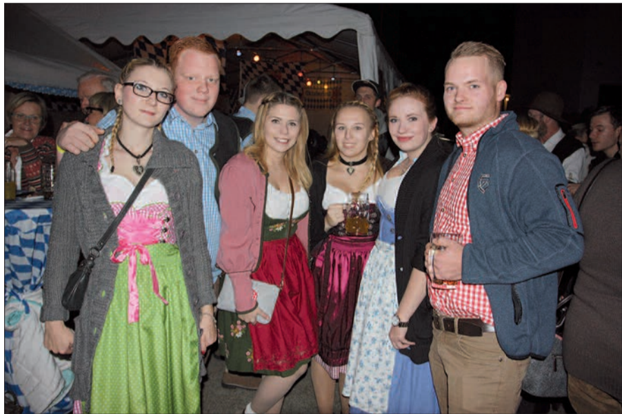
Ganz im Trachtenlook unterwegs war diese junge Truppe auf dem Mühlenhof in Angermund.

gab's all you can eat, und die halbe Maß Bier kostete 3,60 Euro. Einige Herren wurden in rot-karierten Hemden und Lederhosen gesichtet, einige Damen, vor allem die jüngeren, in feschen Dirndl'n. Die Musikgruppe Stein spielte Blasmusik, und den älteren Herrschaften gefiel es. Ab 21.30 Uhr legte DJ Otto Becker auf. Musik, das steht fest, spielte hier nicht die Hauptrolle, eher das Beisammensein im Oktober. G.S.