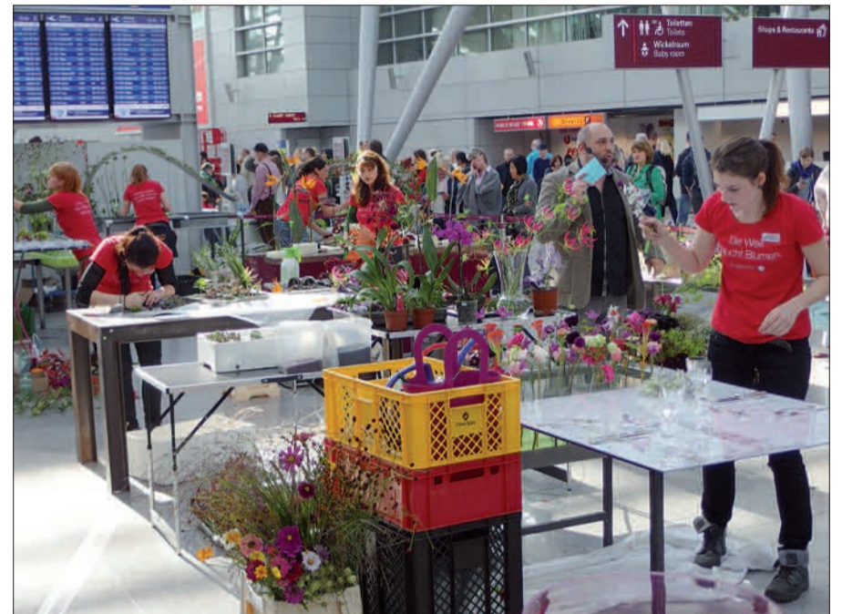
Kreative Floristinnen schufen dekorative Kunstwerke im Terminal.

ohne „events“. Aber alle 100 Shops, Bars und Restaurants haben geöffnet und laden ein. Es gibt eine Kinderbetreuung (2-11 Jahre) und auch das „Parkspezial“, pauschal für € 5,-, gilt von 10 bis 20 Uhr, aber nicht auf P 11 und 12 sowie im Maritim-Parkhaus und auf dem Parkplatz am IC-Bahnhof. Tauschen Sie Ihr Parkticket an der Info bzw. in der Parkzentrale im EG Parkhaus 3 um. Nicht einlösbar bei Einfahrt mit EC-, Kredit- oder Parkkarten. H.S.