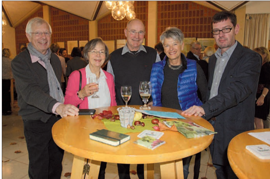
Die Gäste genossen das köstliche Buffet, die Jazzmusik und das Miteinander.

Sieben Düsseldorfener haben sich mit ihrer Band „Jolly Jazz Orchestra“ einen Namen gemacht, und zwar auch jenseits des Rheins. Eine Auswahl schwungvoller Stücke geben sie am 25. Oktober zum Besten, wenn das Lions Hilfswerk Duisburg e.V. wie alle Jahre zum Erntedank in das Rahmer St. Hubertus Pfarrheim lädt.