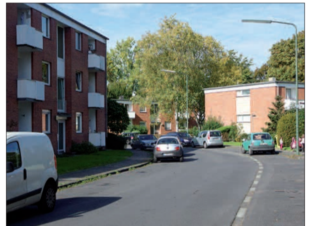
Das ehemalige Rheinbahn-Wohnquartier an der Verweyenstraße soll umfassend erneuert werden.

lichkeit und einer Jury vorzustellen, jeweils in der Kulturkirche, Kaiserswerther Markt 32. Abschließend wird es ein Bebauungsplanverfahren geben. H.S.