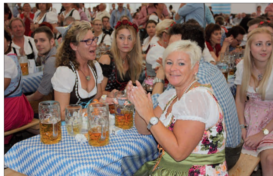
Der Gute-Laune Faktor war bei allen Gästen, 3.000 an der Zahl, von Anfang an garantiert.