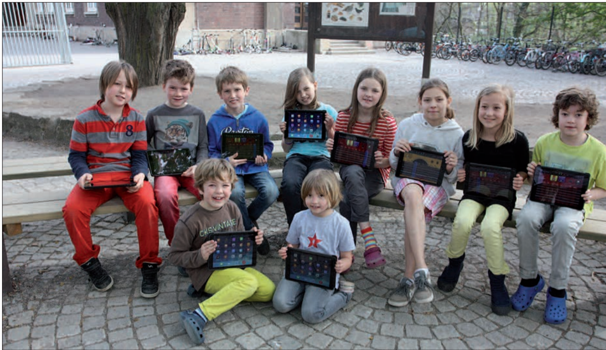
Hier auf dem Schulhof der Gemeinschaftsgrundschule Kaiserswerth soll laut Idee von Architekturstudenten eine Sporthalle entstehen.

Querdenken ist angesagt Nun haben Studenten der