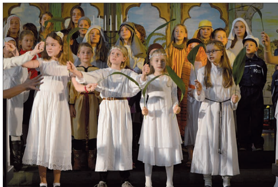
Mit bunten Kostümen gestalteten die jungen Sängerinnen und Sänger das Musical sehr intensiv und verdeutlichten das Geschehen durch Gesten.