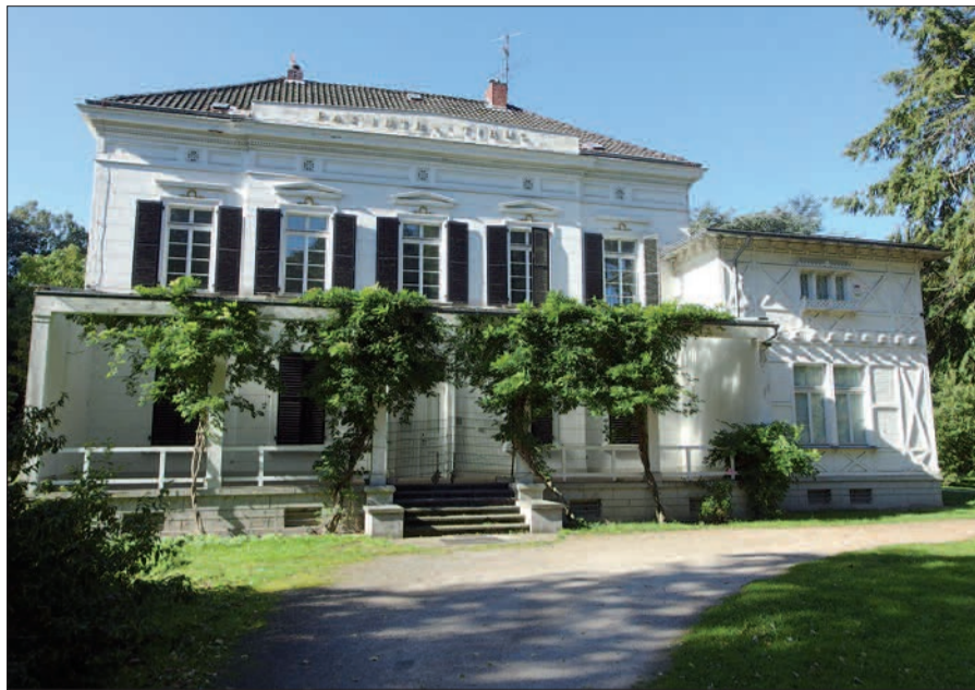
Villa Lantz (Frontseite).

mit Sondergenehmigungen. Überlegungen, was hinsichtlich Erhaltung, Instandhaltung und Nutzung geschieht, wenn diese Ausschreibung nicht zum Erfolg führt, gäbe es nicht. Seit 10 Jahren ist die denkmalgeschützte Villa Lantz ungenutzt, zwar gut „behütet“ vom Heimat- und Bürgerverein Lohausen/Stockum e.V. und der Jugendberufshilfe. Aber dennoch verfällt sie mehr und mehr. Fachleute meinen, dass ein ungenutztes Gebäude zehnmal schneller bzw. mehr Instandhaltungsaufwand erfordert als ein genutztes Gebäude. H.S.