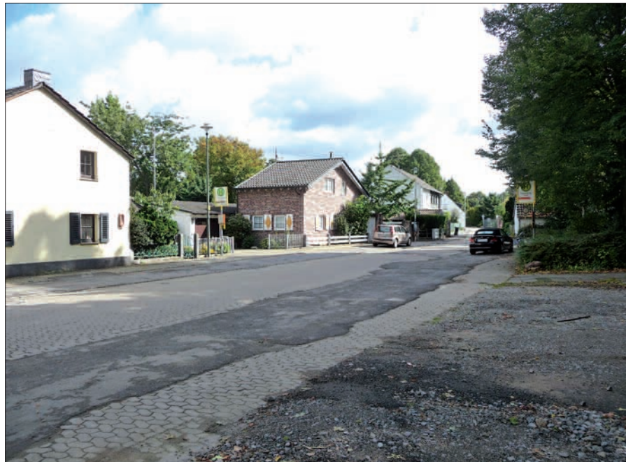
Aktueller Zustand des zukünftigen Kalkumer Dorfplatzes.

aufnehmen. Es ist mit rund 8 Monaten Bauzeit für die Kanäle zu rechnen. Die anschließende Wiederherstellung der Straße wird wohl ein halbes Jahr in Anspruch nehmen. Verzögerung aus nicht vorhersehbaren Gründen, wie zum Beispiel starker Wintereinbruch, muss man gegebenenfalls hinzu rechnen. Nach wie vor ist im Gespräch, ganz unabhängig vom Kanalbau, die Brücke der Edmund-Bertram-Straße über den Schwarzbach zu erneuern. Termine dafür gibt es noch nicht. Der Kanal wird unter dem Schwarzbach hindurchgepresst und berührt den Brückenbau nicht. Der Kanalbau endet rund 10 m südlich der Schwarzbachbrücke. Eine weitere erfreuliche Nachricht ist, dass der vom Kulturkreis Kalkum im vergangenen Jahr initiierte Dorfplatz zwischen Edmund-Bertram-Straße, Oberdorfstraße und Kirche