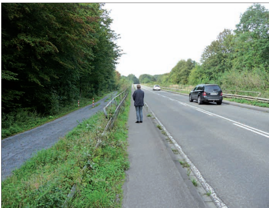
Wer nicht als Ausflügler auf land- und forstwirtschaftlichen Wegen radelt, sondern als Pendler oder für Besorgungen den kürzesten Weg sucht, findet im Düsseldorfer Norden teils miserable Radwege vor. Hier der gefährlich schmale Übergang über die Eisenbahntrasse im Zuge der Kalkumer Schlossallee, der einzige direkte Weg nach Ratingen.

men fallen in den Zuständigkeitsbereich von StraßenNRW. Die Landeshauptstadt hat keinen Einfluss auf die Umsetzung der von ihr beantragten Maßnahmen. H.S.