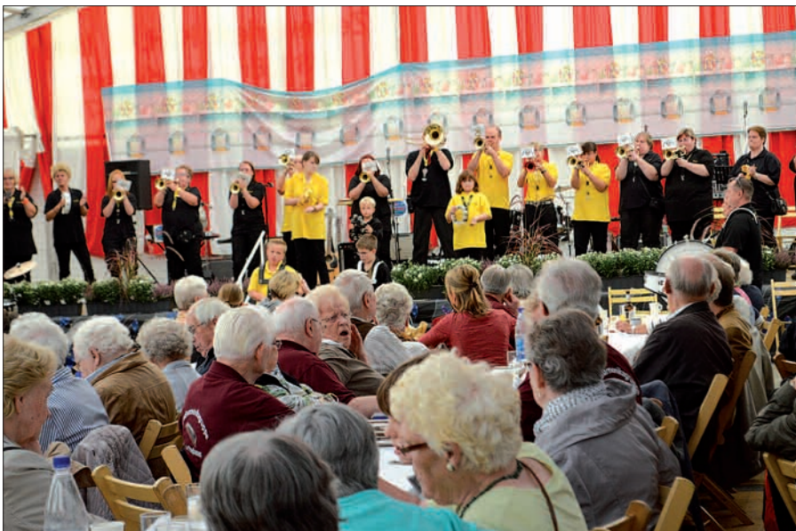
Nicht nur die Ruhrpott Guggis sorgten beim Fest „60 Jahre Ungelsheim“ für Stimmung. Das Festzelt war ein Treffpunkt für jung und alt.

Duisburger Philharmonikern waren unter anderem auch der Shantychor Uerdingen, die Mundharmonikagruppe und die Ruhrpott Guggis zu hören. Die Frauen der katholischen Kirchengemeinde nahmen in ihrem Theaterstück die aktuellen Begebenheiten im Ort humorvoll unter die Lupe. So ging es um Schlaglöcher, XXL-Bad, Schulsituation und Busverbindungen. Mit der Band „All Generations“ klang das Fest aus. sam