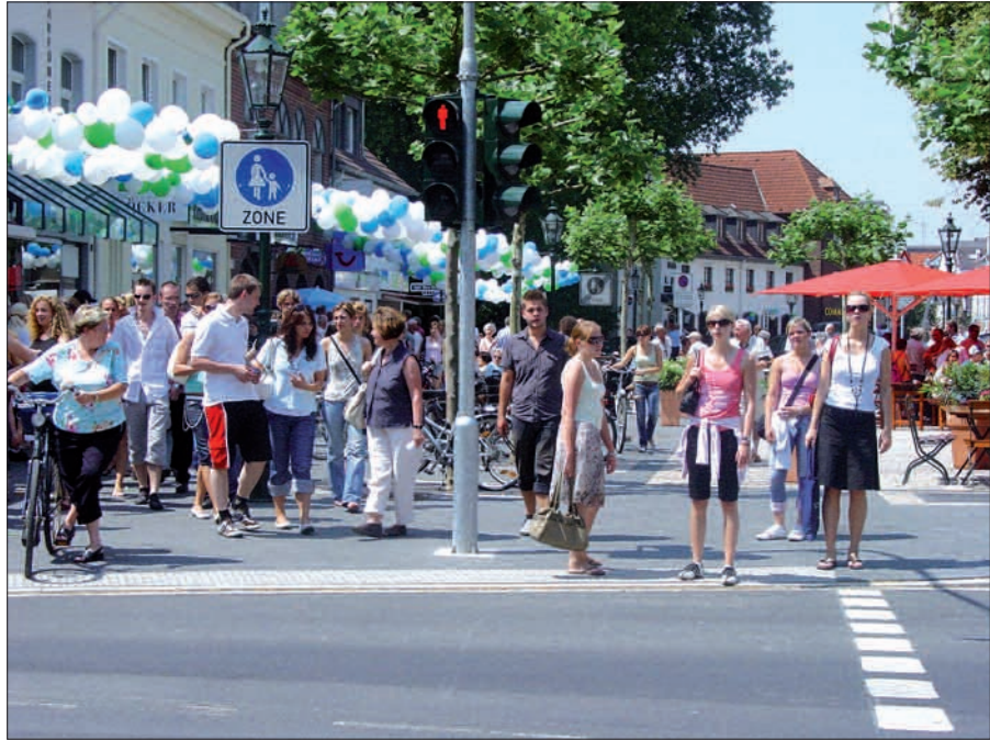
So schön kann Kaiserswerth aussehen, wenn es belebt ist. Die Kunden tragen auch Verantwortung für den Bestand eines lebendigen Einzelhandels vor Ort.

an Waren und Dienstleistungen vor der Haustüre. Somit werden nicht zuletzt Arbeitsplätze, Mehreinnahmen durch Steuern und letztlich die Lebensqualität aller Bürger/innen gestärkt. Alles sehr einleuchtend, oder? Also global denken, lokal kaufen. Lass den Klick in deiner Stadt. Auch die meisten hier ansässigen Geschäfte haben eine Homepage. G.S.