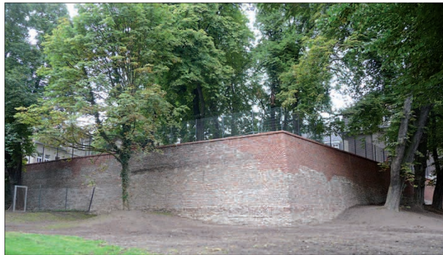
Ein völlig neues, beeindruckendes Blickerlebnis in Kaiserswerth: Die südöstliche Ecke der Bastion St. Suitbertus.