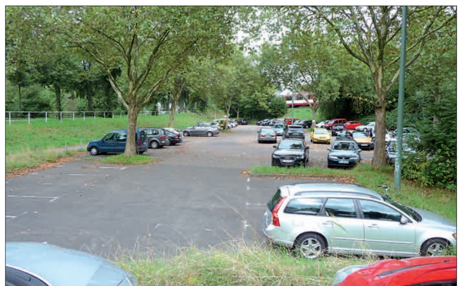
Ein Lebensmittel-Supermarkt auf dem nördlichen Teil des Dreiecksparkplatzes soll das Geschäftszentrum in Kaiserswerth erweitern und stärken gegen die Konkurrenz in Huckingen, Angermund, Ratingen und Lohausen, die Kundschaft in Kaiserswerth halten.

auch die abgebildeten, kostenfreien Parkplätze erhalten bleiben, die sich dann allerdings überdacht unter dem Supermarkt befinden. Der NORDBOTE bleibt dran und wird über die weiteren Schritte berichten.