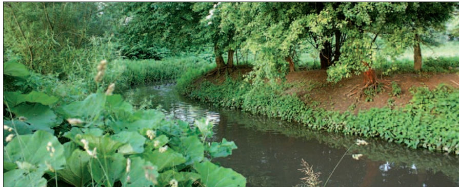
Was für ein idyllischer Anblick die Anger doch ist. Würde sie nur nicht so oft nach heftigen Regenfällen überlaufen und die Keller vieler Angermunder fluten.