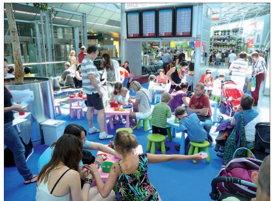
Während der Airlebnissonntage ist es auf dem Flughafen für die Kleinen angenehmer als in der Kindertagesstätte, denn sie können mit ihren Eltern oder Großeltern zusammen Basteln und Malen. Text u. Foto: H.S.

Plüschtieren bis zum Toben auf einer riesigen Hüpfburg und vieles andere mehr. Es ist ein Rundum-Angebot für Groß und Klein mit Spiel, Spaß, Unterhaltung, Shoppen, Schlemmen oder Fastfood in allen Preisklassen, preiswertes Parken auf jeden Fall (€ 5,- pauschal), und wer Glück hat, geht aus einem Spiel mit einem Gewinn nach Hause. Mögen Herbststürme und rheinischer Dauerregen kommen, im Terminal ist man zumindest an diesen Airlebnissontagen bestens, trocken und warm aufgehoben. H.S.