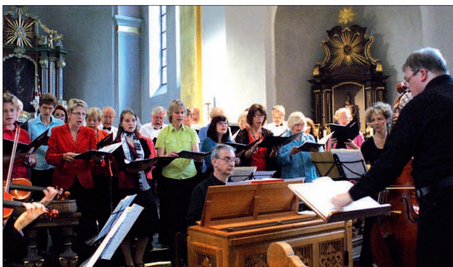
Nach fünf „Sommerabenden mit Musik“ lädt die Chorgemeinschaft Cantemus zu einem „Herbstabend mit Musik“ ein.