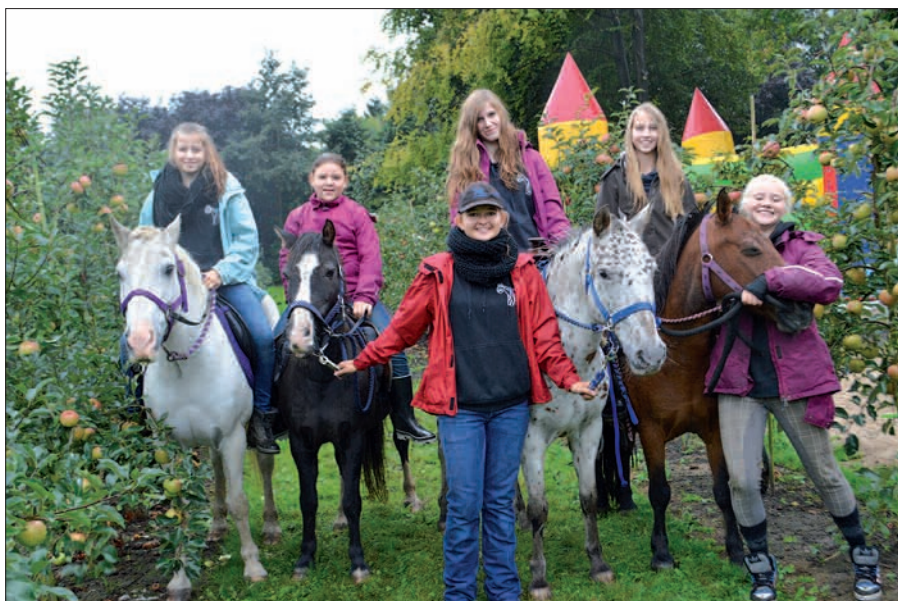
Mitten durch die Apfelplantage konnten die Kleinen auf den Rücken der Pferde reiten und einen Blick von oben auf das Obst erhaschen.