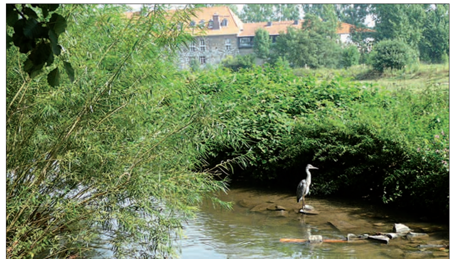
Ob dieser Reiher Erfolg haben wird beim Fischfang in der Anger in Höhe der Kellerei in Angermund?