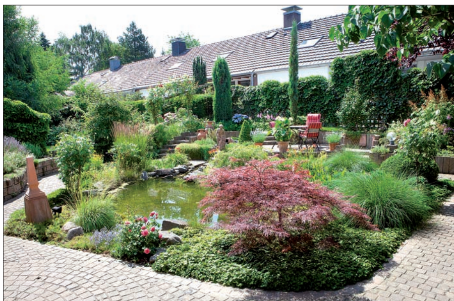
Eine umfangreiche Fotomappe hält der Landschaftsarchitekt für Kunden bereit, die Anregungen suchen.

mer 0203/785453. Weitere unter www.baakes-gartengestaltung.de . Infos findet man im Internet