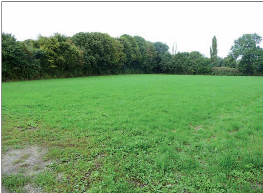
Diese von Bebauung bedrohte Wiese im Landschaftsschutzgebiet in Einbrungen bleibt zunächst grün und unbebaut.

den planungsrechtlichen Vorschriften des Baugesetzbuches (BauGB) nicht gegeben ist“. Die obere Bauaufsichtsbehörde meint jedoch, dass die Stadtbahntrasse U 79 die westliche Grenze der Bebauung zum Außenbereich sein könnte, wenn der Landschaftsplan entsprechend geändert würde. Als nördliche Grenze zur Schwarzbachau käme aber allenfalls die gleiche Bautiefe wie bei den Nachbargrundstücken in Frage. Die Stadtverwaltung teilt zusätzlich mit, dass der Bauherr die Bauvorfrage zwischenzeitlich zurückgezogen hat. H.S.