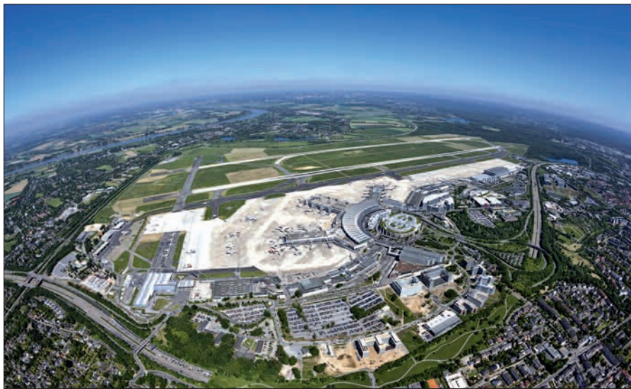
Der Flughafen in Lohausen ist eine unabdingbare Infrastruktur der Landeshauptstadt. Ohne Wachstum auf dem Flughafen wird sich auch die Stadt nicht entwickeln können.

über flexibler zu gestalten. Über dieses Vorhaben informiert die Flughafen Düsseldorf GmbH in einer öffentlichen Veranstaltung in der Jona-Kirche in Lohausen, Niederrheinstraße 128, am Donnerstag, 10. Oktober 2013 um 18 Uhr. Dabei sind Fragen aller Art zum jetzigen und zukünftigen Flugbetrieb erlaubt und erwünscht. Die beiden Chefs (Geschäftsführer) selbst werden anwesend sein. H.S.