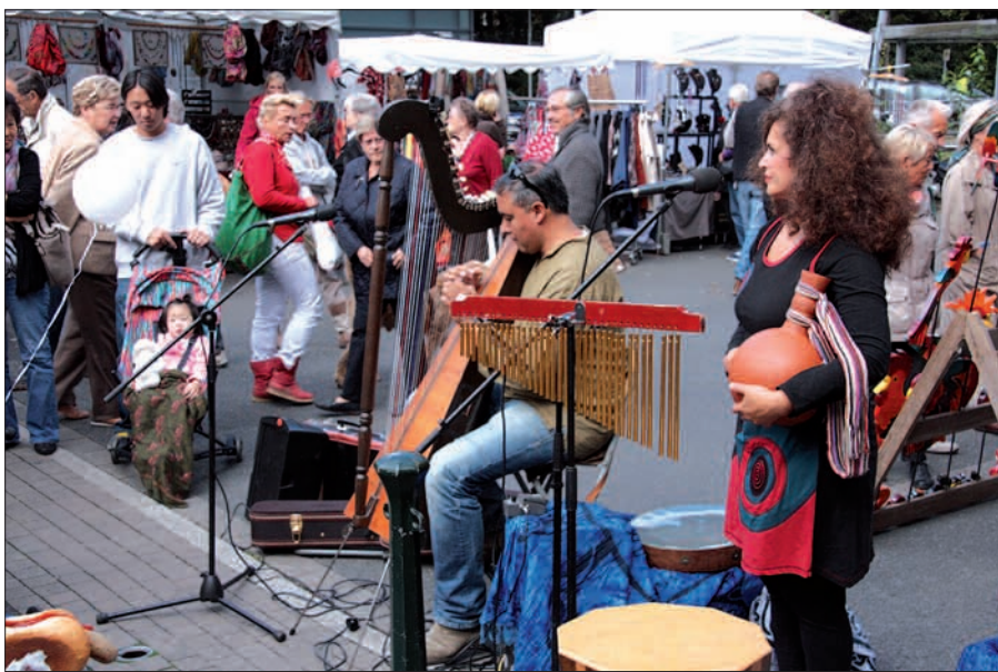
Kunsth Handwerk und Kartoffeln gingen an diesem September Wochenende eine schmackhafte und schöne Symbiose ein.

ressierte Bücherfreund nur vorstellen konnte. Die überschaubare Menge an Besuchern gab hier allen die Möglichkeit, in Ruhe und ohne Drängelei zu schmökern, gleichgültig, ob in alten oder neuen Büchern, in Zeitschriften, Zeitungen, Postern und Comics. Genutzt wurde auch die Chan-