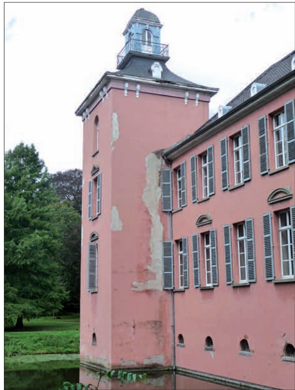
Am Südwestturm des Kalkumer Schlosses ist besonders anschaulich, wie seit Jahren das vom Dach direkt über die Fassade laufende Regenwasser Schäden verursacht.