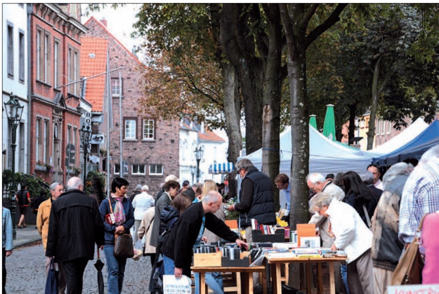
Bibliophil ging es beim 6. Kaiserswerther Büchermarkt zu. Glücklicherweise bei trockenem Wetter – Bücher mögen keinen Regen!

Büchermarkt Der Büchermarkt bot alles, was sich der literarisch inte-