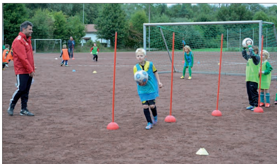
Die ehrenamtlichen DFB-Coaches hatten viele Tipps im Gepäck, um beispielsweise die Links-/Rechtskoordination der F-Jugendspieler zu fördern.