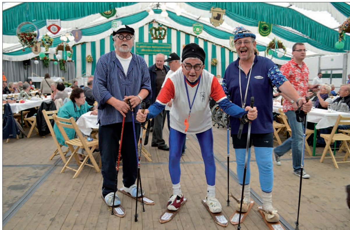
Viel Mühe hatten sich die Mündelheimer Bürger mit ihren Klumpen gegeben, um auf originelle Art und Weise im Festzelt tanzen zu können.