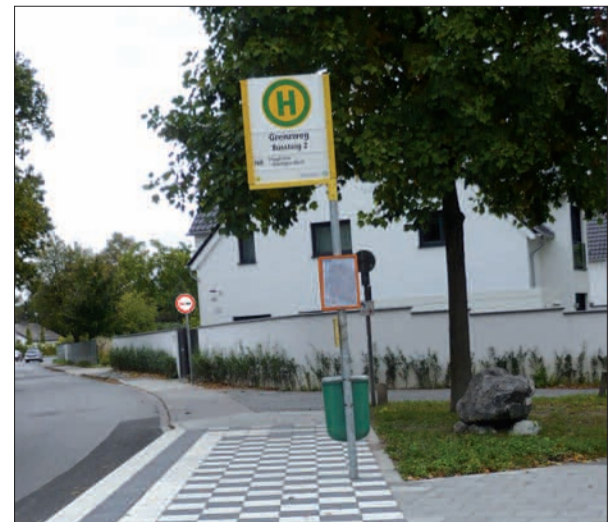
Auf engstem Raum steht die neue Haltestelle am Grenzweg in Wittlaer.