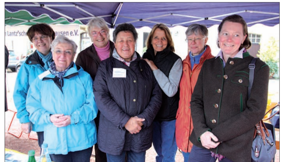
Muntere Truppe aus Stockum von der Pfarrgemeinde Heilige Familie.