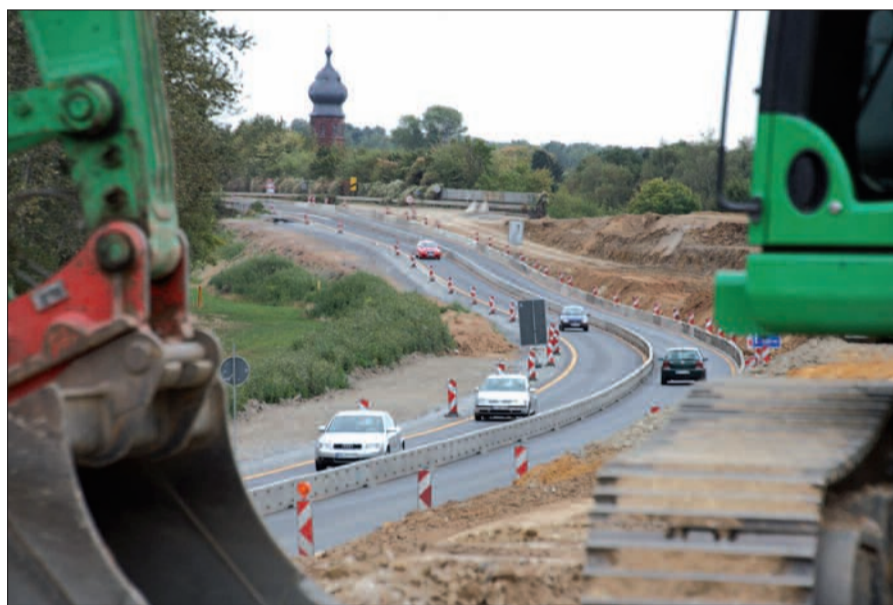
Blick über die Brückenrampe, die jetzt mit Unmassen an Erdreich unnötig lang abgeflacht wird. Fortsetzung des Textes auf Seite 2

Verwundert reibt sich insbesondere der ortskundige Autofahrer schon seit einiger Zeit die Augen, wenn er die Baustelle auf der B288 zwischen Autobahnkreuz DU-Süd und Rahm befährt. Denn ein unerklärlich hoher und langer Damm ist dort südlich der alten B288 aufgeschüttet worden. Dass die im Moment noch relativ steile Rampe zur Bahnüberführung in Rahm abgeflacht werden musste, war klar. Aber dass jetzt die Höherlegung der Trasse bereits schon einen ganzen Kilometer davor unmittelbar am Autobahnkreuz beginnt, ist unerklärlich und nicht einleuchtend.