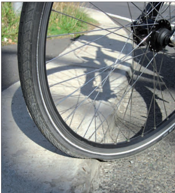
So sehen Fahrradreifen an der reifenmordenden Bordsteinkante am Froschenteich kurz hinter dem Kreisverkehr aus.

So am Froschenteich unter der U79-Brücke neben der nördlichen Abfahrt von der B8n. Hier befindet sich ein asphaltierter Weg für Fußgänger und Radfahrer gleichermaßen mit einer unerklärlich hohen und scharfen Bordsteinkante, die Radfahrer und deren Räder gefährdet. Nur mit viel Fingerspitzengefühl und ganz langsam ist dieses unnötige Hindernis zu überwinden, ohne dass Reifen und Felgen Schaden nehmen. Und wenn der Radler die Kante nicht im richtigen Winkel überfährt, droht ihm auch noch mehr Ungemach. Oder aber, er meidet diese Gefahrenstelle und fährt auf die Straße. Fragt sich nur, was gefährlicher ist.