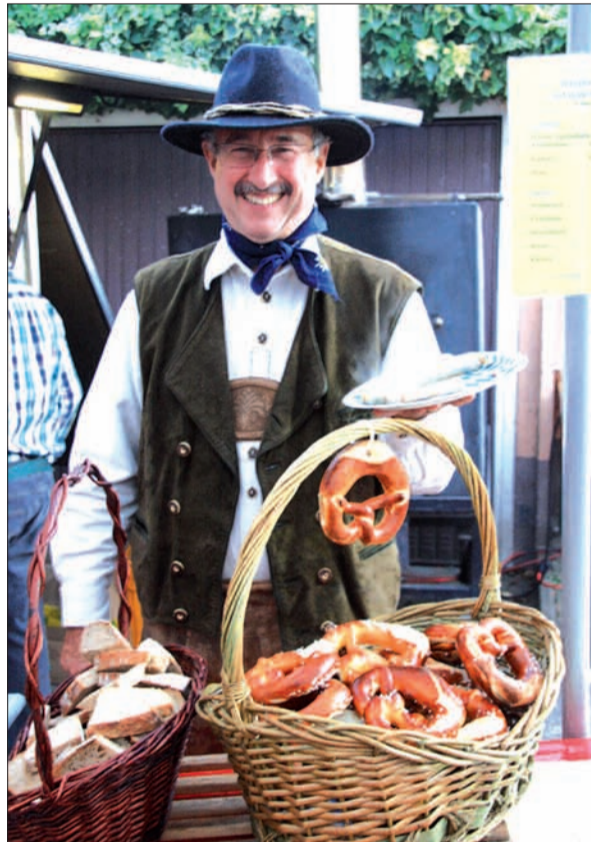
Kulinarisch war das Angebot sehr verlockend: Brezeln und Brot neben Fleischkäse und Weißwurst – ein bisschen Wies'n Atmosphäre in der Rosenstadt.