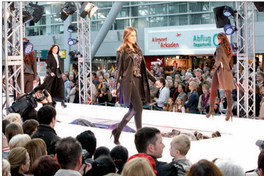
Beim „Airleibnissonntag“ am 7. Oktober steht das Flughafen-Terminal ganz im Zeichen der Mode.

dert und gestellt. Diese mutigen Models melden sich vorher an unter www.erlebnisflughafen.com . Für spontane Anmeldungen am 7. Oktober stehen nur wenige Plätze zur Verfügung. Für Kinder gibt es wie an jedem Airleibnissonntag Mitmachflächen, Hüpfburg und Kinderschminken. Kostenlose Flughafenrundfahrten, ermäßigter Eintritt auf den Zuschauerterrassen, Gewinnspiele, vergünstigtes Parken (nicht P 11 und P 12, Einfahrt-Ticket am Infoschalter umtauschen) sind für Jedermann. Auch zu diesem Airleibnissonntag von 11 bis 18 Uhr ist der Eintritt frei. H.S.