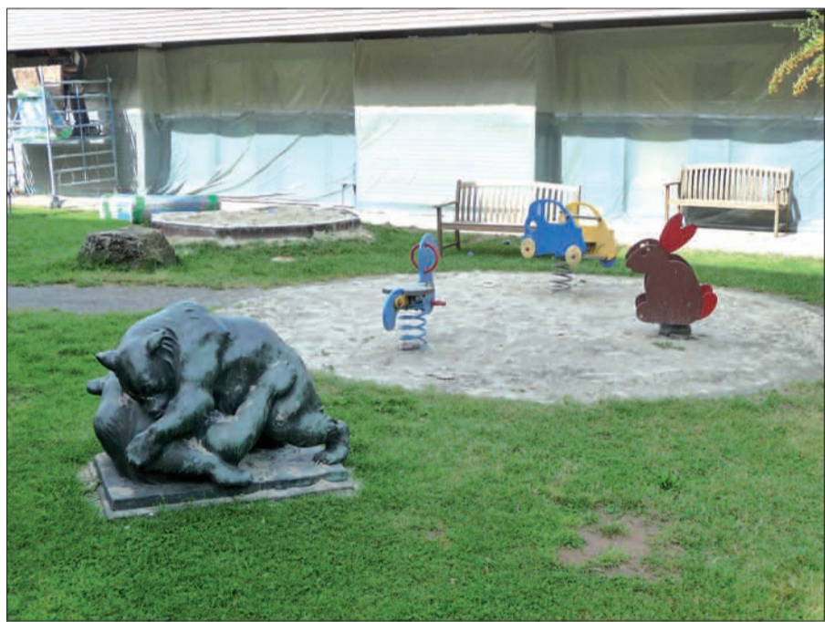
Spielplatz der Kinderklinik des Florence-Nightingale-Krankenhauses mit der Skulptur „Bärenkinder“ von Bernhard Lohf (1975).

haus versetzt worden. Das betrachten Leser des Nordboten als „Degradierung“ des Kunstwerks zum Spielgerät, denn verständlicherweise haben die Kinder die Bärenkinderskulptur in ihr Spielgeräteeensemble einbezogen. H.S.