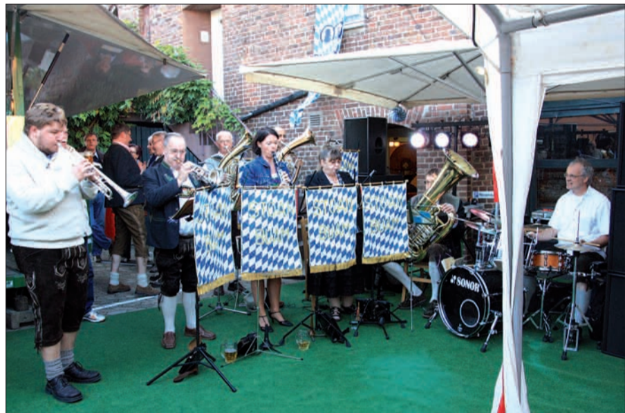
Zünftige bayrische Blasmusik und herrliches Wetter: Die Bedingungen für ein gelungenes Fest am 29. September waren geschaffen.