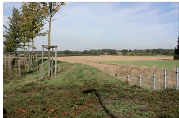
Bauland statt Ackerland: Weite Grünflächen bestimmen den Charakter des Stadtnordens und die sollen bleiben. Dafür hat sich die Bezirksvertretung 5 klar ausgesprochen.