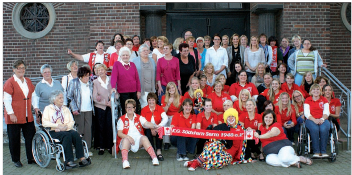
Viele Amazonen feierten das 60-jährige Bestehen dieser Gruppe am Samstag im katholischen Pfarrheim. Auch einige Gründungsmitglieder waren dabei.