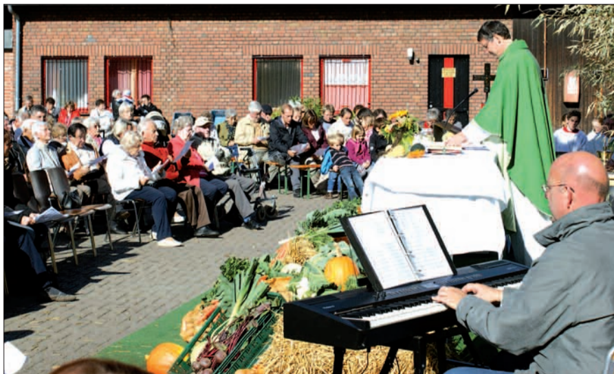
Mit vielen Liedern dankten die Christen für die gute Ernte. Der Altar war mit Erntegaben reich bestückt – nach der Messe wurden Obst und Gemüse verkauft.