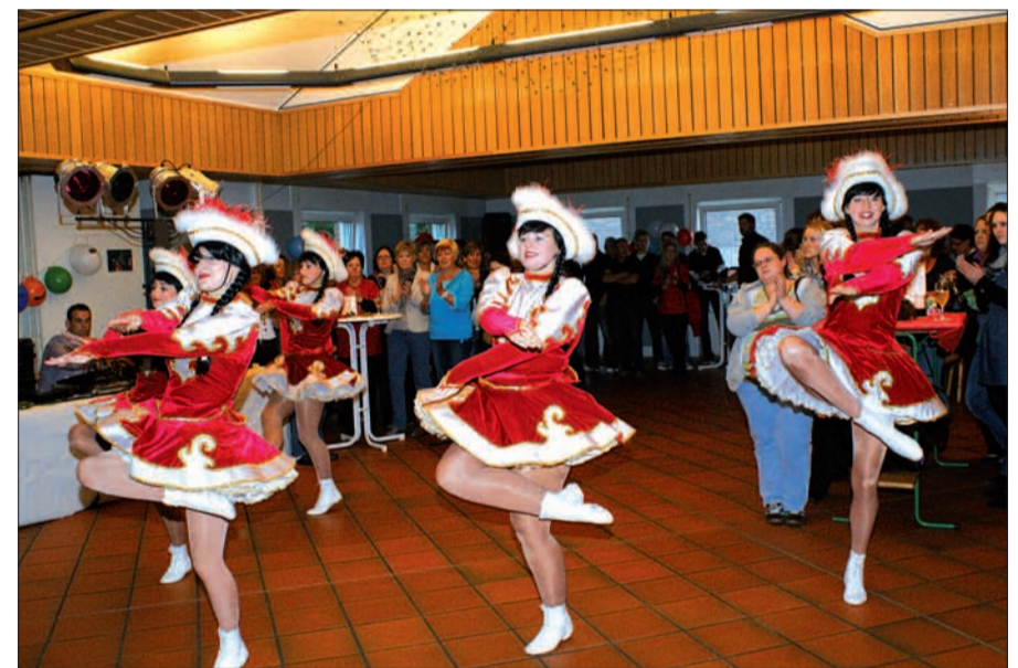
Die Tanzgarde der KG „Südstern“ stimmte mit einer Einlage die Geburtstagsgäste – unter ihnen auch einige Männer – auf einen fröhlichen Abend ein.