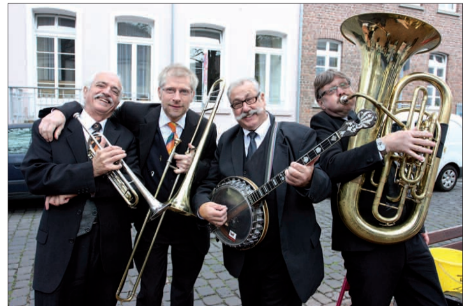
Die Jazzband „Powerkraut“, Dixientainment aus Düsseldorf sorgte für stimmungsvolle Unterhaltung.

nicht nur aller Institutionen und Einrichtungen, auch im privaten Bereich und eben nicht nur im Alter“, betonte Küsel. Eine wichtige Broschüre sei hier noch genannt, die es kostenlos über die Landeshauptstadt Düsseldorf gibt: „Leben im Alter – Wegweiser für Ältere und Junggebliebene“. Infos dazu im Kaiserswerther Rathaus unter 0211/899-3015. G.S.