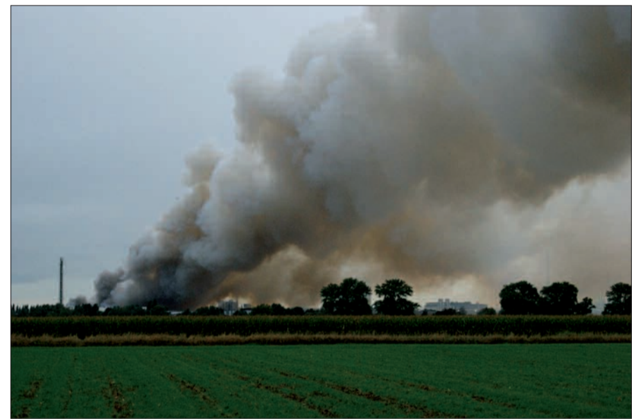
Mehrere Tage lang war die Brandwolke über dem Duisburger Süden zu sehen. Obwohl die Behörden weitgehend Entwarnung gaben, haben viele Bürger ein ungutes Gefühl.

Die Bezirksregierung teilte nach Auskunft der Stadtverwaltung mit, dass Russpartikel und Reste von verbrannter Dachpappe, die sich auch weiter vom Brandherd entfernt finden, unbedenklich eingesammelt und über den Hausmüll entsorgt werden können. Die Untersuchungen hätten ergeben, dass diese Reste keine Dioxine, Furane oder PCB enthalten. Sowohl die Bezirksregierung als auch die übrigen beteiligten Behörden würden die Situation vor Ort weiterhin genau beobachten. Die noch ausstehenden Messergebnisse werden im Internet unter www.lanuv.nrw.de veröffentlicht. Dort findet man auch die bisherigen Auswertungen der Messungen. sam