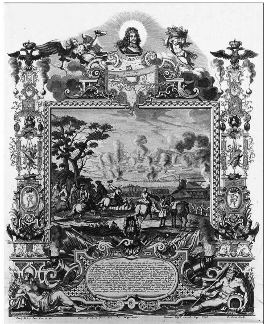
Zeitgenössisches Gedenkblatt zur Belagerung von Kaiserswerth 1702. Oben die „strahlende“ Büste des deutschen Kaisers Leopold I als Sieger.

Nach Schlachten an verschiedenen Orten in Europa (Höchstädt, Ramillies, Turin, Oudenarde, Malplaquet) endete der spanische Erbfolgekrieg mit dem Frieden von Utrecht 1713, dem sich 1714 im Frieden von Rastatt der deutsche Kaiser anschloss. Die Gebietszuordnungen und Machtverschiebungen in Europa waren schließlich anders, als sich dies die Kriegsparteien zu Beginn des Krieges vorgestellt. Philipp V. blieb aber spanischer König. Das Kurfürsten- und Erzbistum Köln erhielt Kaiserswerth zurück (1714). Kurfürst Josef Clemens hatte ins Exil fliehen müssen. Über ihn war die Reichsacht ausgesprochen, weil er die Reichsverfassung gebrochen hatte. Er war, angeblich aus Rache für das verlorene Kaiserswerth, mit Truppen verheerend ins Bergische Land eingefallen. Erst 1715 konnte er nach Köln zurückkehren.