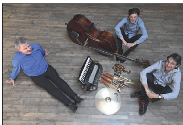
Gut eingespielt ist das Trio und wird sein Können am 3. Oktober im Schloss Heltorf zeigen. Text: G.S., Foto: Privat

Jazz-Matinee, 3. Oktober, von 11-13 Uhr im Schloss Heltorf in Angermund. G.S.