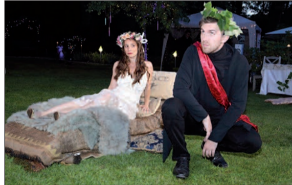
Blumenpower und Darstellungskraft im Sommernachtstraum im Treibhaus.