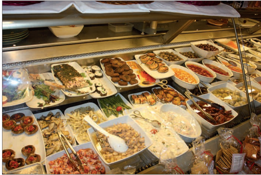
Die Frischetheke lässt keine Wünsche offen.