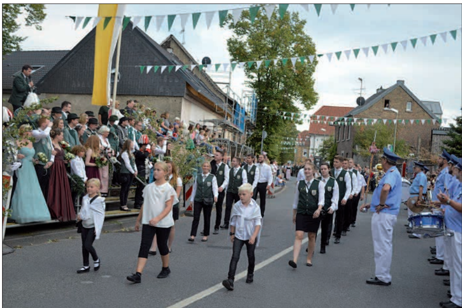
Bei der Parade am Sonntagnachmittag vor der Kirche steht in diesem Jahr der Jugendthron im Mittelpunkt. Er würde sich über zahlreiche Gäste aus nah und fern freuen.

sein. Auch der Montag steht im Zeichen der Jugend: Beim Kinderklompenball um 9.30 Uhr beschnuppern Schüler und Kindergartenkinder das Schützenfest und machen mit ihren selbstgebastelten Klompen mindestens genau so viel Krach wie die „Großen“ bei den abendlichen Tanzveranstaltungen. Nach dem Klompenball wird um 12 Uhr zu einer leckeren Erbsensuppe eingeladen, um gestärkt in den abendlichen Schlussball gehen zu können. Ab 19.30 Uhr wird dort der Ausklang des Schützenfestes eingeleitet. Der Eintritt ist zu allen Veranstaltungen frei. sam