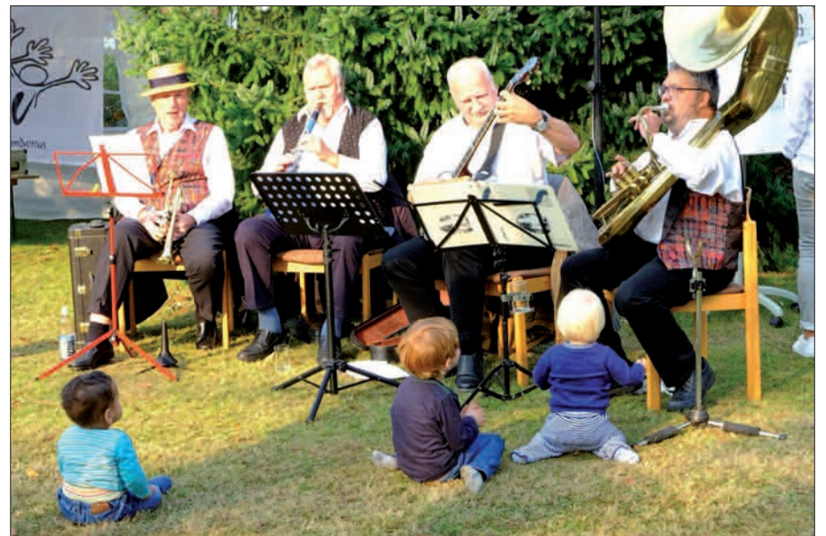
Meistens scheint die Sonne in Wittlaer, auch beim Pfarrfest.

Immer Ende Septemer feiern die Wittlaerer ihr Pfarrfest. Sie beginnen den Tag am 29. September mit einem festlichen Gottesdienst zum Patrozinium in St. Remigius um 10.30 Uhr. Dass sich eine kleine Pfarrprozession, an der der Kirchenchor und die Mitgestaltungsrunde für die heilige Messe gearbeitet haben, anschließt, ist in Wittlaer schon schöne Tradition. Wenn dann rund um das Pfarrheim am Pastorsweg das große Familienfest eröffnet wird, freuen sich nicht nur die Kleinen auf ein buntes Programm mit Spielen und Schminken und allerlei Leckereien. Eine Hüpfburg gibt es auch. Die Pausen eröfnen wieder ihren Bücherstand im Pfarrheim, draußen wird gegrillt, gelacht und hoffentlich wie stets viel miteinander geredet. Und ohne Musik geht in Wittlaer kein Fest: Der Tambourcorps wird spielen, der Kinderchor unter Leitung von Petra Verhoeven tritt auf (14 Uhr) und die Black River Jazz Band gibt Spielkostproben (17 Uhr). Dass die Hälfte des Erlöses für wohltätige Zwecke bestimmt ist, wissen fast alle. In diesem Jahr bekommt das Immersatt-Projekt in Duisburg die Zuwendung. Das Pfarrfest beginnt am 29. September und dauert von 12.16 Uhr bis etwa 18 Uhr. Infokasten Das Projekt Immersatt in Duisburg engagiert sich gegen Kinderarmut im Raum Duisburg. Es gibt regelmäßige Mahlzeiten und ein Ohr zum Zuhören gibt's auch ( www.immersatt.org ). G.S.