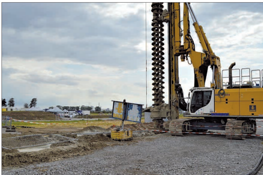
Derzeit wird die 20 Meter tiefe Dichtwand gebaut. Sie soll den Ort vor dem hochdrückenden Grundwasser schützen.

gelagert. Die relativ neue Maschine erleichtert das Füllen erheblich.“ Die Stadt arbeite eng mit dem THW zusammen. Im Ernstfall können zehn Menschen in