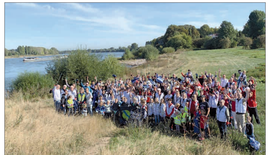
Eine Riesentruppe traf sich am 14. September zum Rhine-Clean-up.

jahr stattfindet, hat das Stadtteilforum Gesprächskreis Kaiserswerth diese Aktion koordiniert und initiiert. Was hat ein Neunjähriger am Schluss des clean ups gesagt? „Das hat richtig Spaß gemacht, aber schrecklich, was die Menschen alles wegschmeißen!“ G.S.