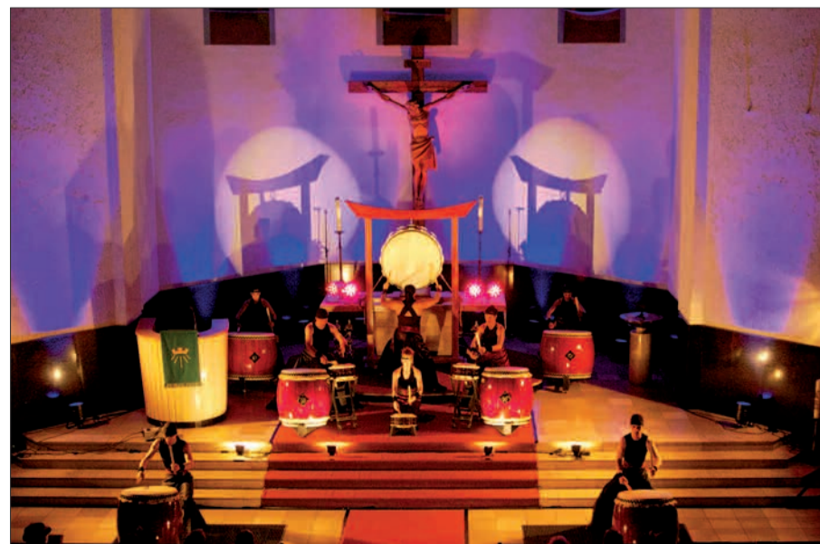
Japanische Trommler sind in Verbindung mit einer Orgel etwas ganz Besonderes und ein außergewöhnlicher Musikgenuss.

gen mit der Orgel sind wieder im Programm. Klassische Orgelkonzerte, eine Stummfilmaufführung und Veranstaltungen für Familien sowie eine Orgel-Exkursion runden das vielseitige Programm ab. Infos und Karten gibt es unter www.ido-festival.de und an allen bekannten Vorverkaufsstellen sowie an der jeweiligen Abendkasse. H.S.