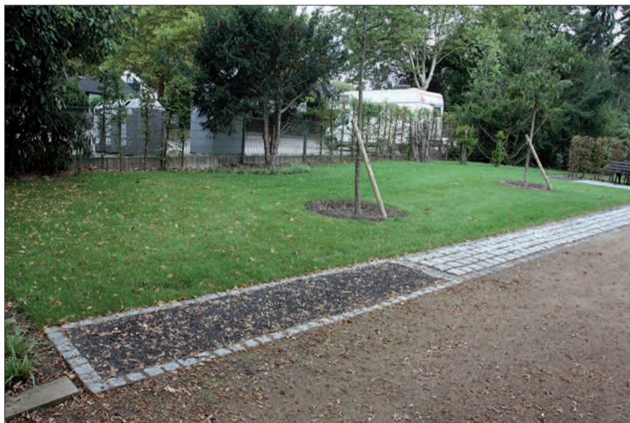
Das neue Gebiet für insgesamt 200 Urnengräber ist im westlichen Teil des Friedhofs und ragt an die Alte Gasse. Platz für Blumen und Namensgravuren gibt es auf dem gepflasterten Streifen.

gepflasterten Streifen, der die Rasenfläche einfasst, Platz für Kerzen und Grablichter bereit. Hier können auch die Namen der Verstorbenen eingraviert werden. Eine Bank lädt dazu ein, in Ruhe an diesem neu eingerichteten Streifen innezuhalten und an den Verstorbenen zu denken. Für 30 Jahre werden die Nutzungsrechte derzeit vergeben. Wer Interesse daran hat, kann sich unter der Telefonnummer 0162/1093 646 informieren. G.S.