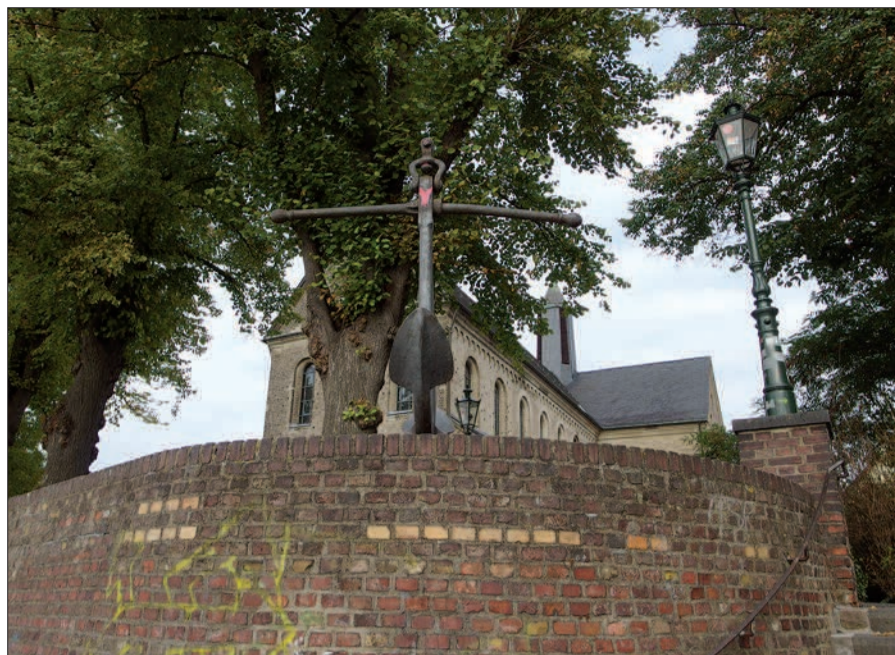
Der Anker auf der Hochwassermauer in Kaiserswerth, unmittelbar neben der St. Suitbertus Basilika, ist nicht nur ein beliebter Aussichtspunkt, sondern an sommerlichen Wochenenden auch ein nächtlicher Treffpunkt für jugendliche Gruppen.