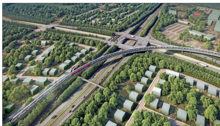
Die geplante Hochbrücke der U 81 über Lohausen, Stockum und den Nordstern.