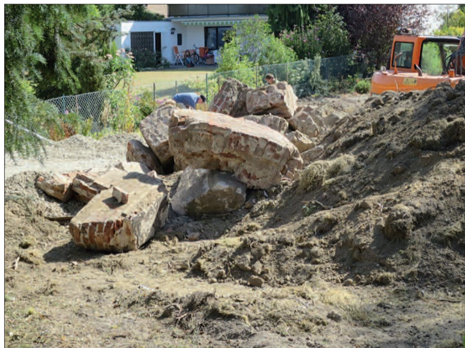
Trümmerreste des früheren Kaiserswerther Wasserturms, jetzt aufgefunden an der Egbertstraße.

serturm aber deutlich zu erkennen. Dieses Heft ist in den örtlichen Buchhandlungen erhältlich (Max Apel und Buchhandlung Lesezeit am Kaiserswerther Markt und Diakonie-Buchhandlung an der Alten Landstraße). H.S.