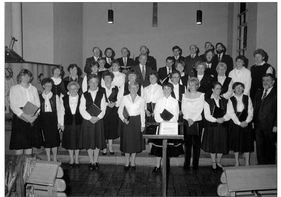
Diese Aufnahme aus dem Jahr 1983 zeigt den Chor im 25. Jahr seines Bestehens.