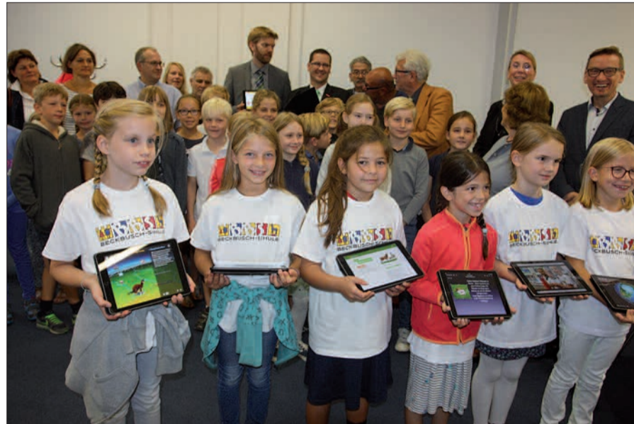
Fröhliche Kinder nehmen die iPads in Empfang, die künftig gezielt im Unterricht an den sechs Grundschulen eingesetzt werden können.

Der Altersdurchschnitt lag im Kaiserswerther Rathaus am 5. September gefühlt bei 10 Jahren, denn Kinder von sechs Grundschulen aus dem Norden kamen hierher, um ganz offiziell iPads in Empfang zu nehmen. Die Bezirksvertretung 05 hat's möglich gemacht und 90.000 Euro investiert, um die Grundschüler fit für die digitale Zukunft zu machen. Stefan Golißa begrüßte die Schulleiter aus Angermund, Lohausen, zweimal aus Stockum, aus Wittlaer und Kaiserswerth, und 180 neue iPads wechselten die Besit-