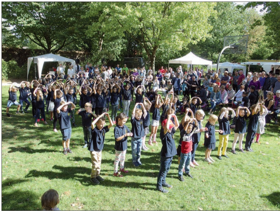
Die Kinder der Kleinen Gelben Schule zeigten Tanz- und Singspiele.

war zwar in der Nähe, aber es ist verständlich, dass er diesmal dem Jahresfest des Kaiserswerther Diakoniewerkes den Vorzug gab. Das Fest im Park verlief im Übrigen nach dem Motto „Sehen und Gesehen werden“, miteinander ins Gespräch kommen und belebt durch das vielseitige Programm, unter anderem Reiten auf Ponys und Eseln der „Ponderosa“, Judo- und Tanzvorführungen von Schülern der Tersteegen-schule, Lohauer Fahnen-schwenker und vieles andere mehr. Zur Lantz'schen Kapelle war ein kostenloser Fahrdienst eingerichtet. Dort gab es Führungen und um 14 Uhr ein Konzert mit der Pianistin Roswitha Nowak-Witteler. Gelegenheit zum Mitsingen war ebenfalls gegeben. Die Erlöse der großen Tombola fließen der Lohauer Jugendarbeit zu. Ein wunderbares Fest in einem herrlichen Park im Dorf mit Herz für Gäste, Jugendliche und Kinder! H.S.