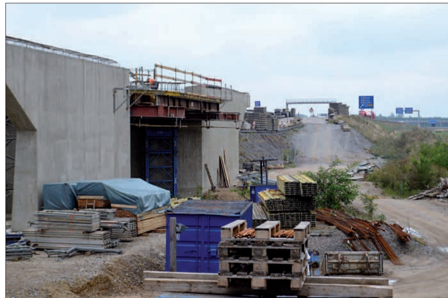
Eigentlich soll der Ausbau der B 288 zur A 524 bis Ende 2020 beendet sein. Doch die Zeit könnte knapp werden: Es darf nur „sauberes Material“ verwendet werden, das in unserer Umgebung allerdings nur schwer zu bekommen ist.