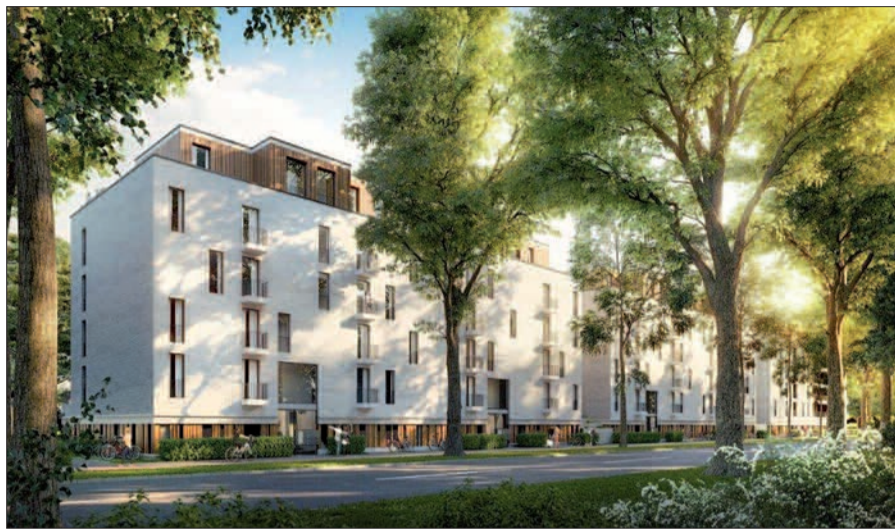
Fünf Geschosse insgesamt sollen sie hoch sein, die neuen Häuser und 18,5 Meter hoch. Der Bau in der Animation ist viergeschossig, mit Staffelgeschoss und erbaut auf einer Tiefgarage. Plan (DWG)

werden, um das für uns und für die Bewohner des Quartiers so wichtige Projekt doch noch in eine gute Zukunft führen zu können“, sagt Leonard auf Anfrage des Nordboten am 13.09.. Die DWG hatte vor fünf Jahren 75 Prozent Anteile an der Rheinbahn-Immobilien-gesellschaft erworben. Die ehemalige Siedlung rund um die Verweyenstraße gehört mit 112 Wohnungen hinzu, die nun abgerissen und nach und nach saniert werden sollen. Viele Erstmietler leben hier, fast alle wollen wohnen bleiben. Insgesamt werden im Quartier 194 Wohnungen neu errichtet, viele als geförderter und preisgedämpfter Wohnraum. Auch Eigentumswohnungen mit mehr als insgesamt 16.000 Quadratmetern sind dabei. Außen viergeschossig, innen dreigeschossig Viergeschossig plus Staffelgeschoss auf aus dem Boden ragenden Tiefgaragen, weil das Baugebiet Wasserschutzgebiet ist – das ergibt eine Höhe von 18,5 Metern und zwar gleich gegenüber vom Theodor-Flie-dner-Gymnasium. Auch aus Lärmschutzgründen hatte das Architekturbüro „Wienstroer Architekten mit