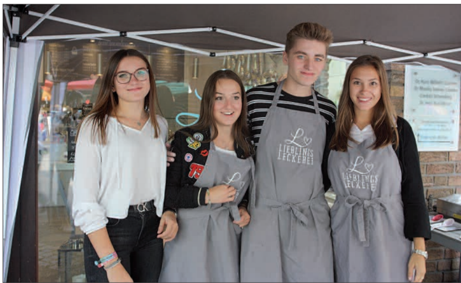
Das Frozen Joghurt Team im Klemensviertel – und das Team strahlt um die Wette.

An beiden Tagen war nicht nur der Wettergott hold – 22°, Sonne, kein Regen – auch die Gäste, die sich zwischen Handwerkermarkt (vor dem Klemensviertel), Kartoffelfest (im Klemensviertel) und auf dem Büchermarkt (Kaiserswerther Markt) tummelten, hatten die Qual der Wahl, welches Event sie zuerst besuchten. Die meisten entschieden sich einfach für alle drei und unternahmen einen ausgedehnten Bummel durch Kaiserswerth. Die Parkplätze am Ortsrand waren prall gefüllt, was immer ein gutes Zeichen ist. Die Einzelhändler freuten sich über den ersten verkaufsoffenen Sonntag des Jahres und resümierten nach dem 9. September: Es hat sich gelohnt. Sven Mackrodt von DUE MANI: „Wir konnten viele Kundinnen begrüßen, die noch nie bei uns waren und sehr von dem Sortiment und der neuen Kollektion begeistert waren. Es hat sich gelohnt!“. Auch Doris Söhn von „Das Lädchen“ war angetan: „Mein Geschäft war gut besucht, ich freue mich über so viel Resonanz“. Auch die Nachbarn von Lana, Ulrike Zegers und Beate Hömberg, feierten mit dem verkaufsoffenen Sonntag die Premiere in Kaiserswerth, denn Lana hat erst im Frühjahr eröffnet. „Doch, wir sind ganz zufrieden und hoffen, dass immer mehr Kundinnen künftig den Weg zu uns finden“. Auch Vera Fiele vom Spielwarengeschäft