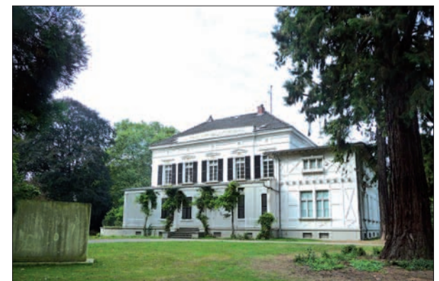
Eine schicke Villa, noch in ordentlichem Zustand, aber leider ungenutzt im Lantz'schen Park in Lohausen.

reichlicher Nachlass in städtischen Besitz ist und für den hier eine angemessene Ausstellungsmöglichkeit am Ort seines künstlerischen Schaffens hätte gegeben werden können, wird im Benrather Schloss gewürdigt und soll dort 2014 eine noch erweiterte Ausstellung erhalten. Natürlich gibt es viele, viele andere Ideen und Möglichkeiten, die Villa öffentlich, privat oder beides kombiniert zu nutzen, aber es bewegt sich seitens des städtischen Eigentümers nichts, beklagt Siegfried Küsel, Vorsitzender des Heimat- und Bürgervereins Lohausen/Stockum e.V. H.S.