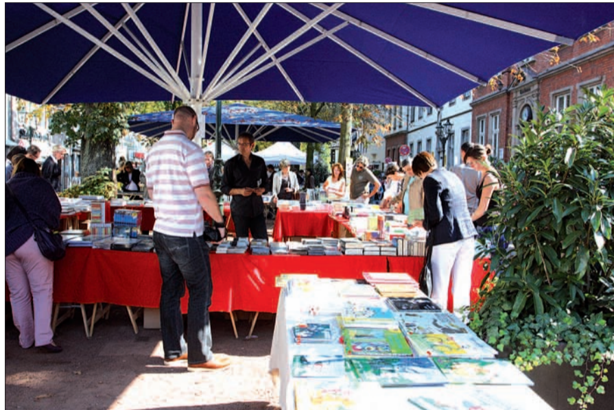
Schmökern nach Herzenslust ist auf dem 6. Büchermarkt in Kaiserswerth Programm!

Schlendern, Stöbern und Schmökern – unter dem Motto läuft der 6. Kaiserswerther Büchermarkt. G.S.