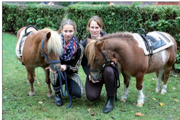
Ponyreiten stand auf dem Programm. Dabei zeigten sich die 17-jährigen Vierbeiner sehr kinderfreundlich und geduldig