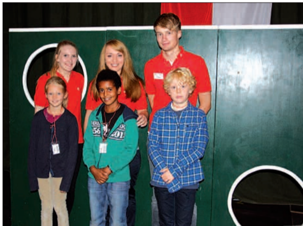
Das Team der Stadtparkasse Düsseldorf Filiale Angermund beim Torwandschießen mit den Kindern der Grundschule.