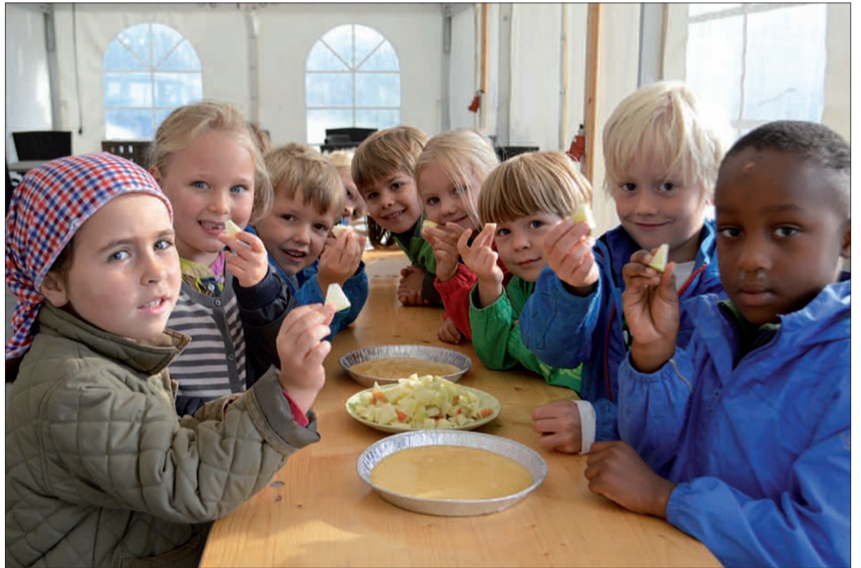
Der erste Ausflug der neuen 18 Maxikinder führte die Mädchen und Jungen des St. Remigius-Kindergartens in Wittlaer ins Apfelparadies. Alle hatten großen Spaß, selbst ihre Kuchen zu belegen.