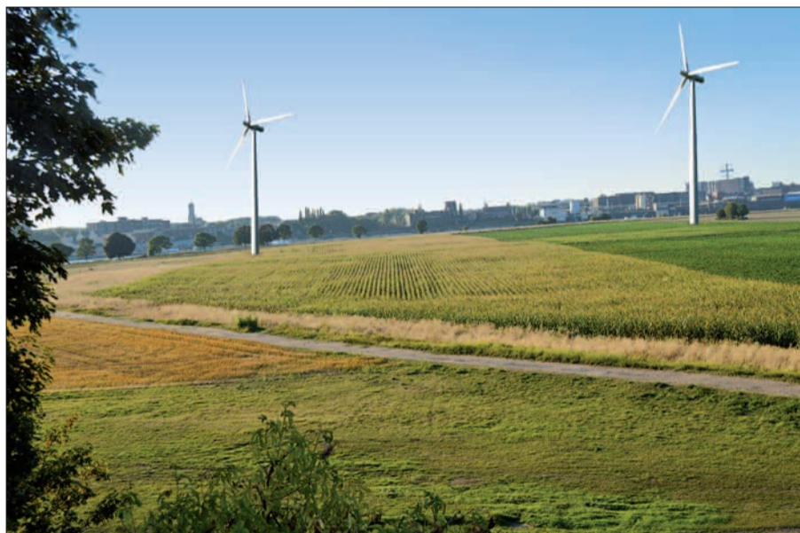
Auf diesem Überschwemmungsgebiet nördlich der B 288 bei Mündelheim überlegen Stadtwerke und RWW, zwei Windkraftanlagen zu errichten.