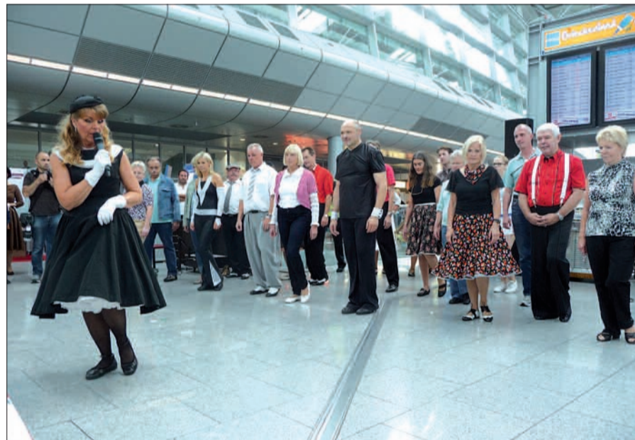
Nostalgische, kostenlose Tanzstunde auf dem Flughafen.