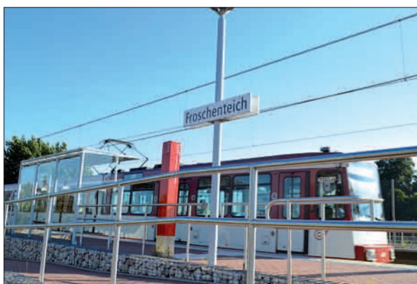
Würde die U-79 künftig nur noch bis zur Haltestelle Froschenteich fahren, hätte das gravierende Nachteile für die Bürger des Duisburger Südens.

„Aus den genannten Gründen appellieren wir drin-