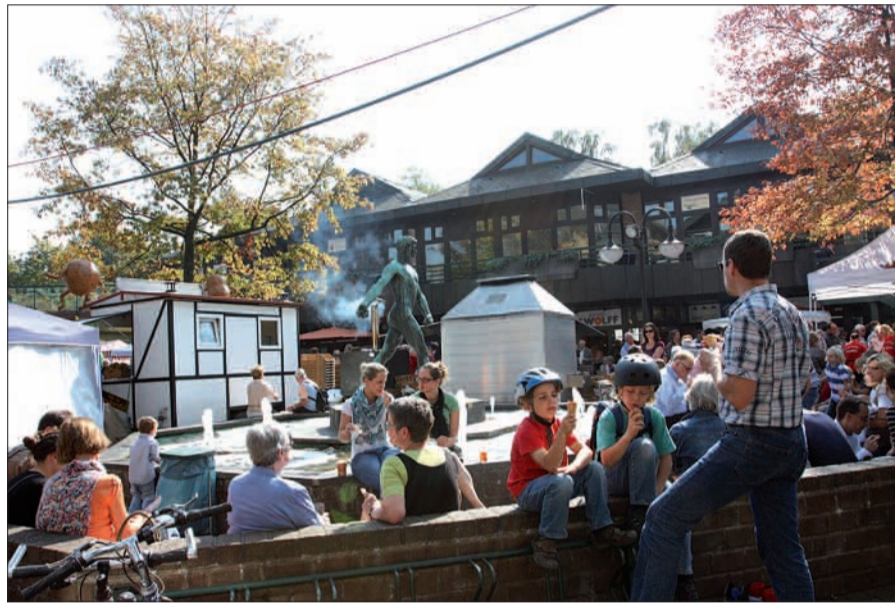
Schlemmen und shoppen und genießen: Das Kartoffelfest am 14. und 15. September ist ein voller Erfolg!

Kartoffelfest und Kunsthandwerkermarkt am 14./15.09. in Kaiserswerth rund um das Klemensviertel, Kreuzbergstraße von 10-18 Uhr, VK Sonntag von 13-18 Uhr. G.S.