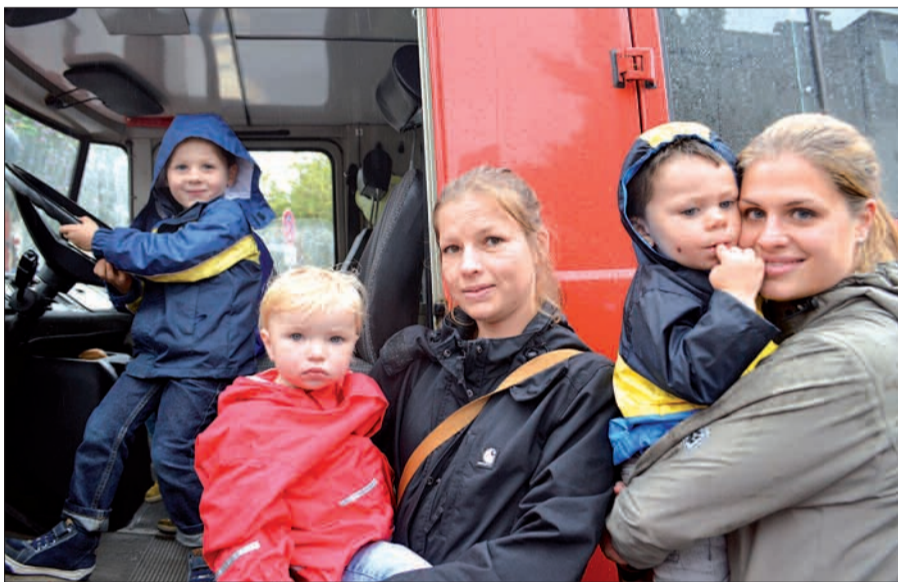
Diesen jungen Besuchern des Bauernmarktes machten die Regentropfen zu Beginn des Bauernmarktes nichts aus. Mit Elan erkundeten sie das Fahrzeug der Freiwilligen Feuerwehr Huckingen.

re Ruhrpott-Currywurst probieren oder sich mit schmackhaften Köstlichkeiten aus dem Smoker vor der „BBQ-Company“ verwöhnen lassen. Für den Getränkeverkauf sorgten die Mitglieder des Bürgervereins