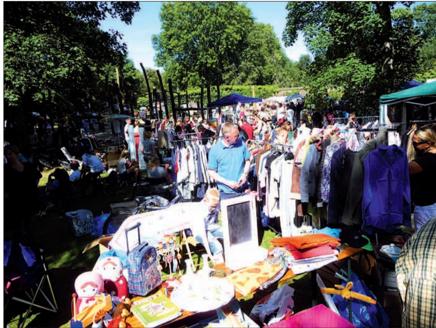
Der Trödelmarkt beim Lohausener Parkfest ist besonders attraktiv, da von privaten Anbietern geprägt.

Schule Lieder, um 14.30 Uhr gibt es eine Judo-Vorführung von Kindern derselben Schule. Ab 15.00 Uhr spielt A BODY acoustic folk und gleichzeitig beginnt eine Schnitzeljagd zur Düsseldorf Stadtgeschichte. Lohausen nimmt, zusammen mit Kaiserswerth, schon 74 Jahre an dieser Geschichte teil. Ob man das, eine Woche zuvor beim 725. Stadtjubiläum in der Stadtmitte, zu würdigen weiß? Kurfürst Jan Wellem und seine Gemahlin Anna Maria Louisa von Toscana, aus dem Hause Medici, werden jedenfalls mit Gefolge Lohausen zum Parkfest mit ihrem Besuch beehren. Man darf sie gern mit Fragen ansprechen. Um 15.30 Uhr tritt eine Tanzgruppe der Jugendfreizeitstätte „Teestube“ auf. Die Lantz'sche Kapelle ist während des Parkfestes von 11 bis 18 Uhr geöffnet. Führungen finden um 12, 14 und 16 Uhr statt. Ponyreiten für Kinder ist von 12 bis 16.30 Uhr möglich. Vereine