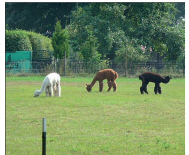
Alpakas auf Kalkumer Weide.

Schon seit Jahren machen die indische Halsbandsittiche (eine Papageienart) im Kalkumer Schlosspark mächtig Krach. Emus kann man auf einer Weide in der Nähe vom Flughafen-Tor 18 (Ende der Edmund-Bertram-Straße) bewundern. Neuerdings weiden Alpakas neben dem Krieger-Ehrenmal an der Oberdorfstraße. So vertraute, heimische Tiere wie Milchkühe, Schweine und Legehennen bekommt man im dörflichen Kalkum aber nicht mehr zu Gesicht. Die Mastrinder, die schon mal zwischen den vielen Pferden grasen, sind meist ebenfalls „Immigranten“ oder haben zumindest „Migrationshintergrund“, kommen vom schottischen Hochland. H.S.