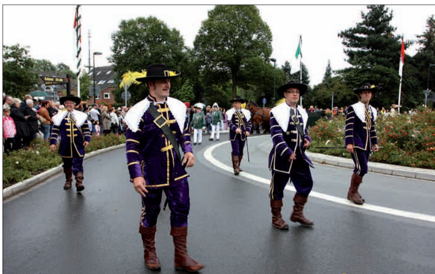
Die „enfants terribles“ der Angermunder St. Sebastianus Bruderschaft 1511 e.V. Geliebt, geschätzt, manchmal wegen ihrer Schlagfertigkeit ein wenig gefürchtet. Auf jeden Fall sind die Wallensteiner in ihren schmucken historischen Kostümen und mit ihren schneidigen Degen eine unverzichtbare Gruppe der Sebastianer. Die beste Nachricht: Inzwischen gibt es charmante weibliche Verstärkung in der Gruppe, Tendenz übrigens steigend, die gern bei der Parade mitgehen. Freuen wir uns auf das nächste Schützenfest in Angermund im September 2014!

So hatte schließlich der Protektor der Bruderschaft,