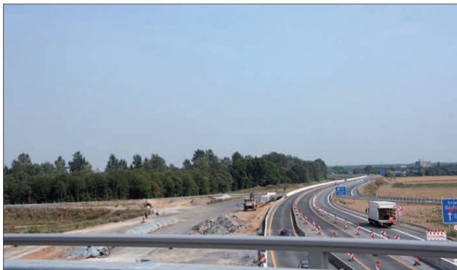
Blick von der A59 auf die neue Südtrasse in Richtung Rahm. Rechts fehlt noch immer die Lärmschutzwand!

Unerklärliche Vorgänge Für den Laien sind manche Abläufe auf dieser Baustelle unerklärlich. So z.B. die verzögerte Freigabe von Teilen des Autobahnkreuzes. Insbesondere die Rahmer und Angermunder mussten wochenlang unnötig auf die Öffnung der Abfahrt Duisburg/Richtung Rahm warten; warum? Fehlende Schilder, hat es geheißen; ein Aprilscherz? Und: man wolle die Autofahrer mit Ziel Essen wegen der gesperrten Ruhrtalbrücke nicht in eine Sackgasse führen. Das aber war per Umleitung über Froschenteich schon lange der Fall. Inzwischen wurde der Abzweig freigegeben, vielleicht, weil die Experten sich daran erinnern haben, dass es hier auch Autofahrer