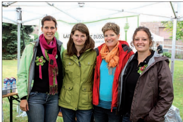
Die charmanten Damen von Ladies Circle aus Düsseldorf sind jedes Jahr dabei und sammeln stets für einen guten Zweck, etwa für das Trebe Cafe.

polsterei gardinen & dekorationen An St. Swibert 37 Tel.: 0211-43 615 726 sonnenschutz fussbodenbeläge 40489 Düsseldorf info@stilvoll-wohnen.biz