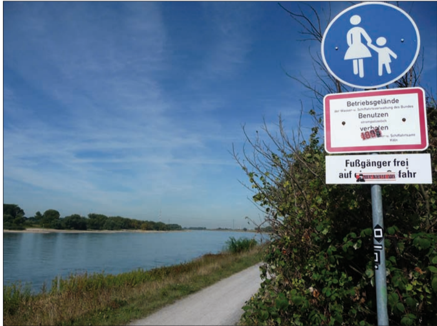
Der Leinpfad entlang des Rheins in Wittlaer-Bockum ist Betriebsgelände des Wasser- und Schifffahrtsamtes und nur für Fußgänger freigegeben.