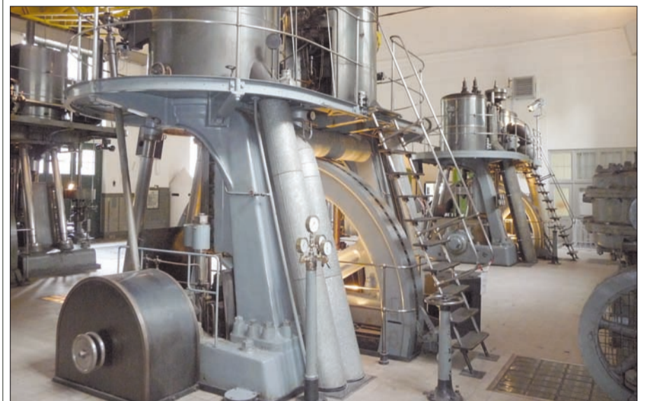
Vier große Pumpenanlagen stehen noch denkmalgeschützt im Wasserwerk Bockum.