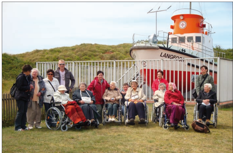
Senioren des Malteserstifts St. Hedwig mit ihren Betreuern bei einem Ausflug auf die Ostfriesische Insel Langeoog.

chen Stunden auf der Terrasse des Ferienhauses bei Kuchen und Ostfriesentee. Diese und andere Aktionen für die Senioren werden möglich durch den Förderverein, der solche Ausflüge sowie auch Veranstaltungen regelmäßig finanziell unterstützt. H.M.