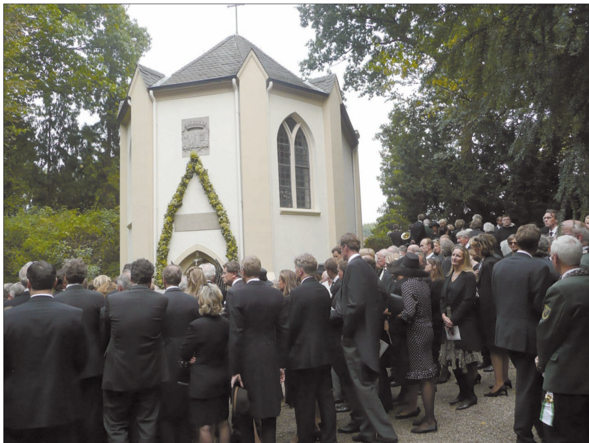
Vor der Beisetzung an der Kapelle des Angermunder Friedhofs.