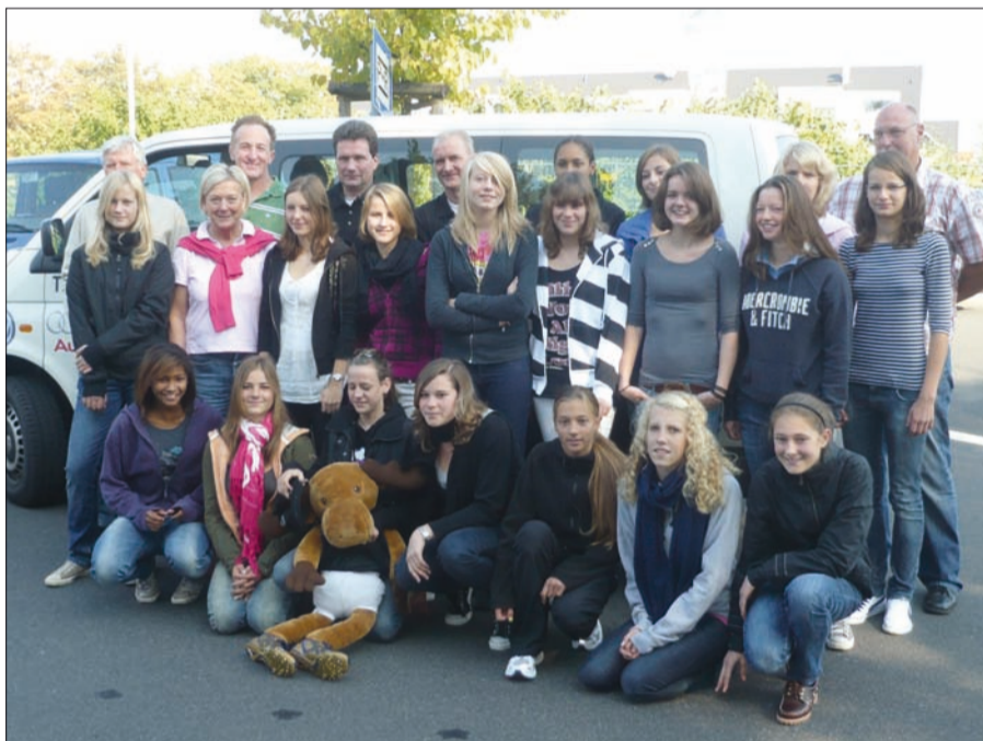
Gute Stimmung herrschte beim TVA-Team schon bei der Abfahrt nach Mannheim am 18. September auf dem Parkplatz des Wittlaerer Bahnhofs.