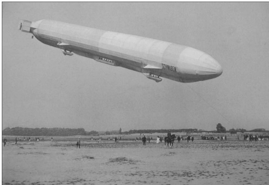
Das im Juni 1912 auf die Golzheimer Heide in Stockum einschwebende Luftschiff LZ 10 „Schwaben“.