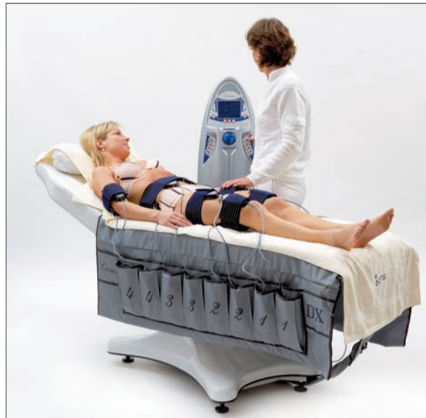
So sieht das neue Ultraschall Gerät aus, mit dem die Patienten ihr Fett wegbekommen.