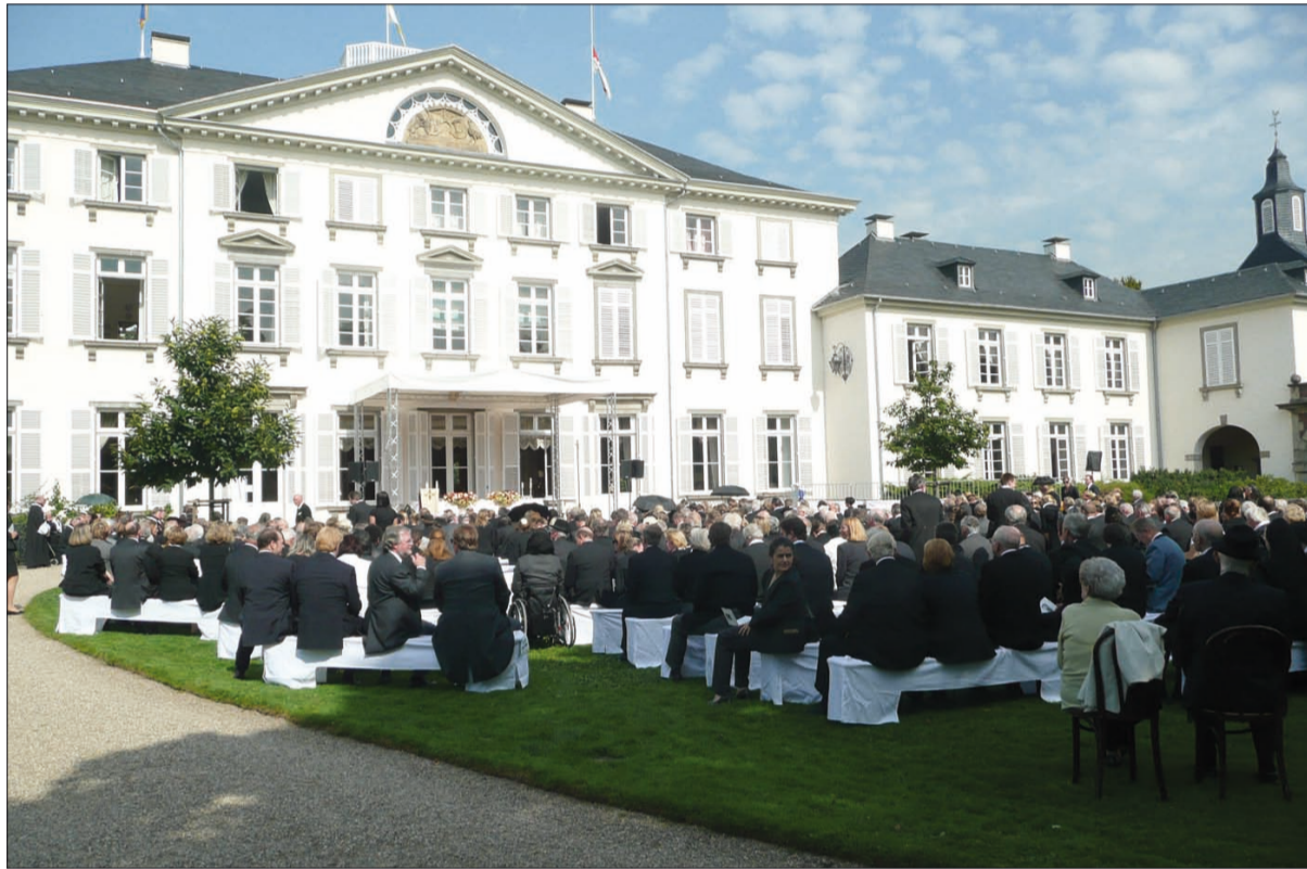
Knapp 1.000 geladene Gäste warten auf den Zeremonien-Beginn am 9. September