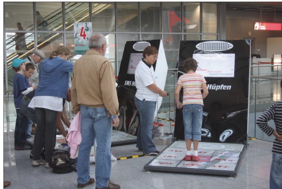
Auf dem Weg zum Trendsport? SMS-Hüpfen!

gung zu fördern. Wenn man den Spaß aller Beteiligten bei den Airport Games erlebt hat, sollten sich die Sportvereine der Region auf regen Zulauf freuen können! Ulrich Spaethe