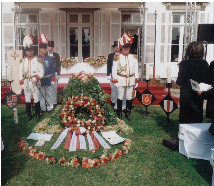
Im Innenhof des Schlosses legen bei der Trauerfeier von Maximilian Graf von Spee die St. Sebastianus Bruderschaften Rahm und Angermund einen Kranz nieder.