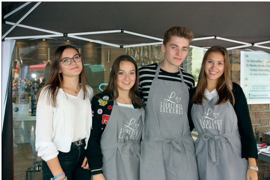
Die Vier von der Lieblingsleckerei waren vor Corona im Einsatz.