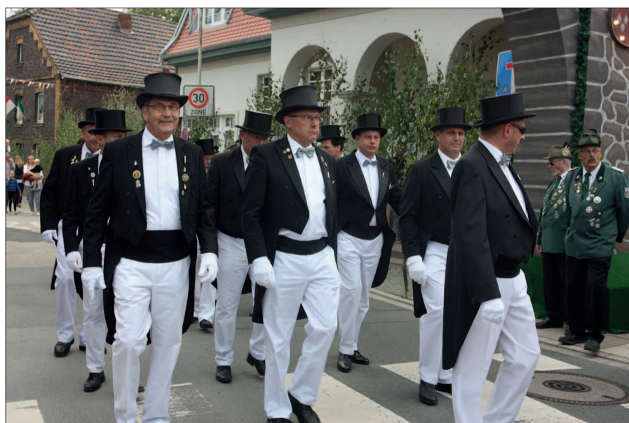
Große Freude herrscht nicht nur bei den Mitglieder*innen der Angermunder Bruderschaft, dass sie nach der langen Corona Pause endlich wieder feiern dürfen.