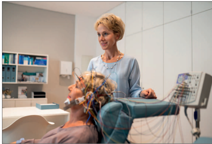
Modern ausgestattet sind auch die Untersuchungsräume.