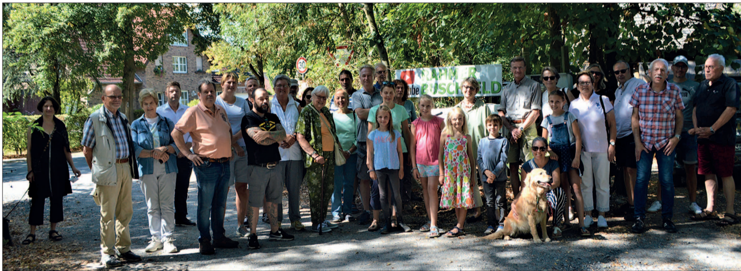
Viele Interessenten waren zum Ventenhof gekommen, um sich gemeinsam das Rahmerbuschfeld näher anzuschauen.