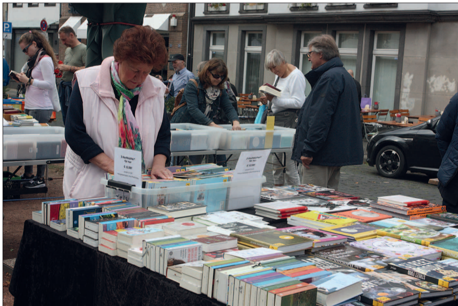
Bücher gehen IMMER.

Kaiserswerth feiert, 10./11. September von 10 Uhr an, Verkaufsoffen ist am 11. September von 13 Uhr bis 18 Uhr. G.S.