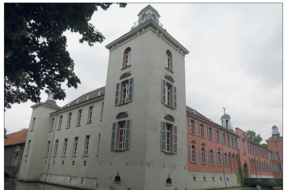
Der noch fehlende Außenanstrich der Nordfassade (links im Bild) erklärt sich durch die vom BLB unterbrochene Sanierung während des mehrjährigen Verkaufsverfahrens. Erst mit dem zweiten Käufer kam ein wirksamer Vertrag zustande.