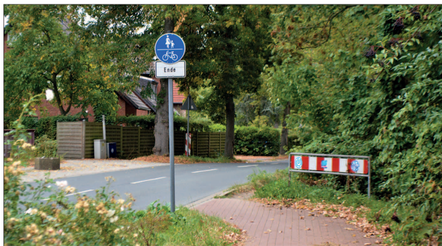
Der Radweg von Angermund nach Rahm endet auf der Straße - eine gefährliche Situation für die Radfahrerinnen und Radfahrer.