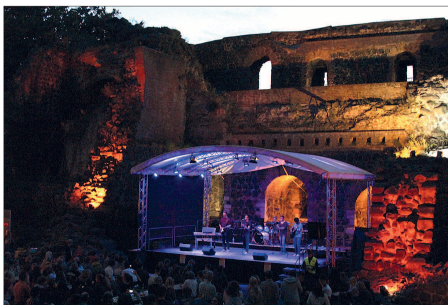
Das Kaiserpfalz open air ist eine tolle Plattform für Nachwuchsbands.