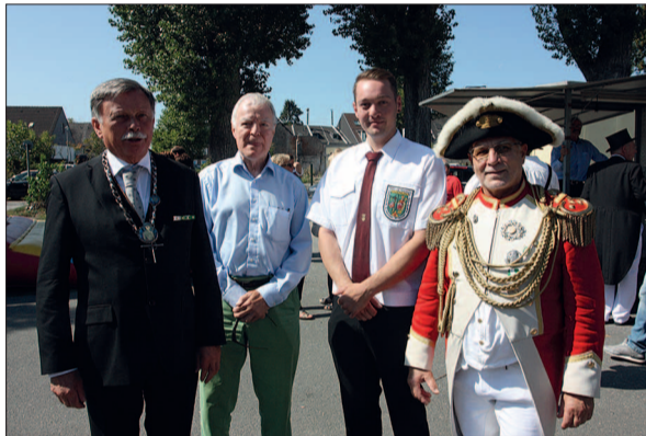
Der Auftakt zum Schützenfest ist immer schon ein Höhepunkt, auf den sich viele Angermunder*innen freuen.