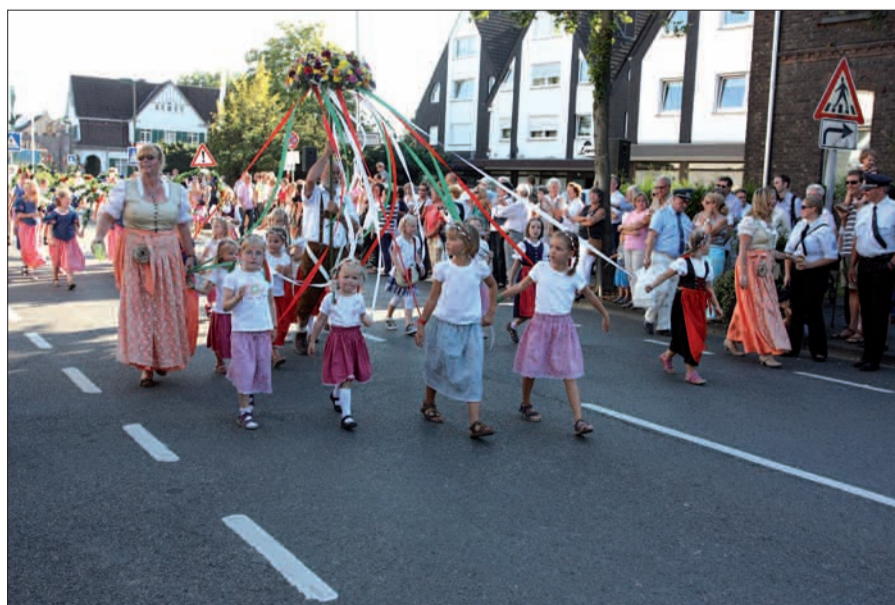
Die Königin-Beate-Gruppe sucht noch Mädchen ab 5 Jahren zur Verstärkung. Wer mitmachen möchte, kann am Mittwoch, 4. 9., zum Schützenhaus kommen.