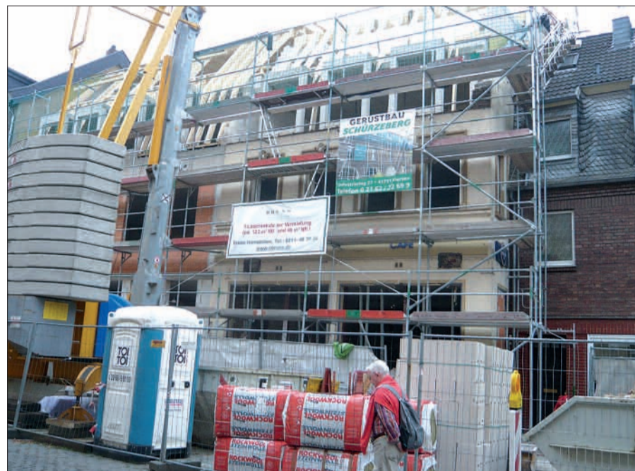
Schon eingerüstet ist der Neubau am Kaiserswerther Markt zwischen dem Lädchen und Schuh Hornscheidt. Ende dieses Jahres soll das Bauvorhaben fertig sein. Die Kaiserswerther sind gespannt, wer in das größere Ladenlokal ziehen wird.