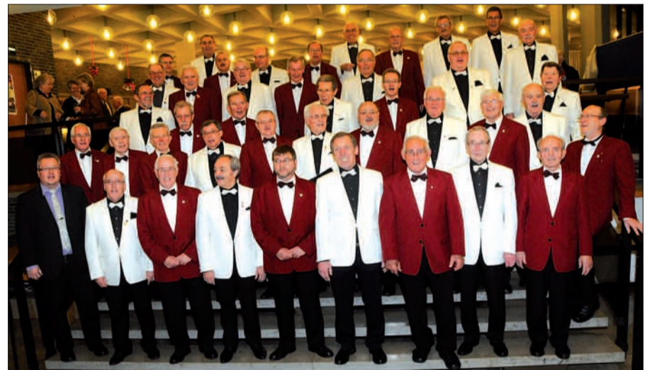
Zum Weinfest lädt die Chorgemeinschaft MGV Erholung 1866 Huckingen e.V. und MGV Walsum-Aldenrade 1906 e.V. am 14. September in den Steinhof ein.