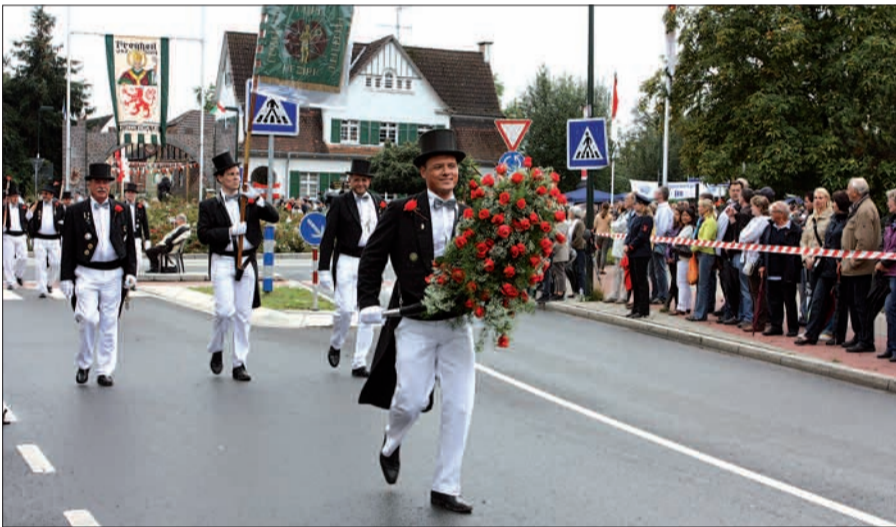
Farblich abgestimmt ist sogar das Rosenbouquet mit der Blume im Knopfloch. Die Pinguine feiern 30 Jahre Jubiläum.