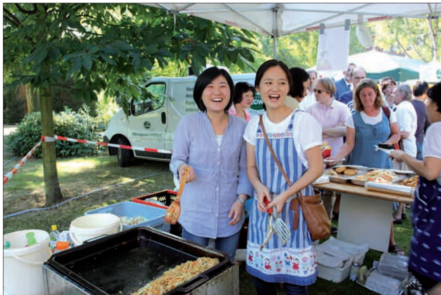
Köstlich kochen kann die koreanische Gemeinde, die stets mit einem Stand auf dem Jahresfest vertreten ist.