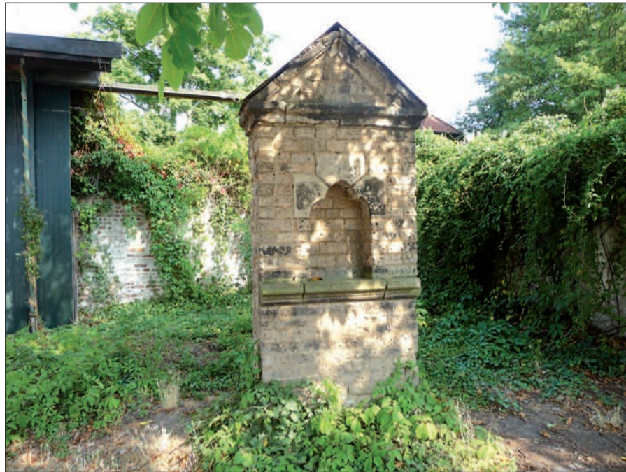
Ein weniger bekanntes, aber nicht unbedeutendes Denkmal in Kaiserswerth ist das unvollständige Heiligenbild an Stelle der ehemaligen Walburgiskirche im früheren bergischen Vorort Kreuzberg zur damals kölnischen Stadt Kaiserswerth (an der Alten Landstraße). Es lohnt sich, im Düsseldorfer Norden auf „Denkmal-Entdeckertour“ zu gehen!

stücksnutzung, zügiger und kostengünstiger Baudurchführung und dem Denkmalschutz. H.S.