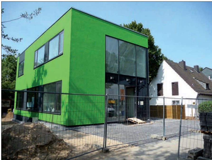
Ein farbiger Blickfang macht die Niederrheinstraße noch vielseitiger im Lohauer Dorfbild.

An der Niederrheinstraße 183 graben neuerdings auch Bagger, hier entsteht ein Gewerbeobjekt (Garagege-bäude). Der Erweiterungsbau für Aldi, an dem den Sommer über durchgearbei-tet wurde, soll bis 5. Septem-ber fertig sein. Die Haltestel-le der U 79 ist jetzt auch von der Baustelleneinrichtung freigeräumt, die Wiese wie-der hergestellt, leider ohne zusätzliche Parkplätze. Ein giftgrüner Blickfang ist an der Niederrheinstraße 102 entstanden (unser Foto). Baukörper im Kubus scheinen in Lohausen im Trend zu sein. Im Grund, ungefähr gegenüber der Kleinen Gelben Schule (KGS), die auch schon einen Flachdach-Anbau bekom-men hatte, wetteifert ein silberfarbener Kubus in der Farbe mit den unmittelbar darüber donnernden, silber-farbenen Fliegern. Dieses auffällige Bauwerk hatte schon seit einiger Zeit Auf-merksamkeit erweckt. Jetzt