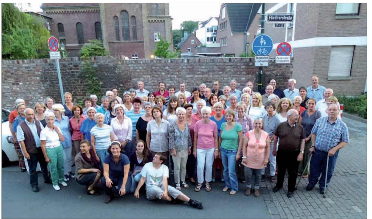
Gesungene Ökumene. Der Basilika-Chor St. Suitbertus und der Chor der Ev. Stadtkirche Kaiserswerth anlässlich einer gemeinsamen Probe.