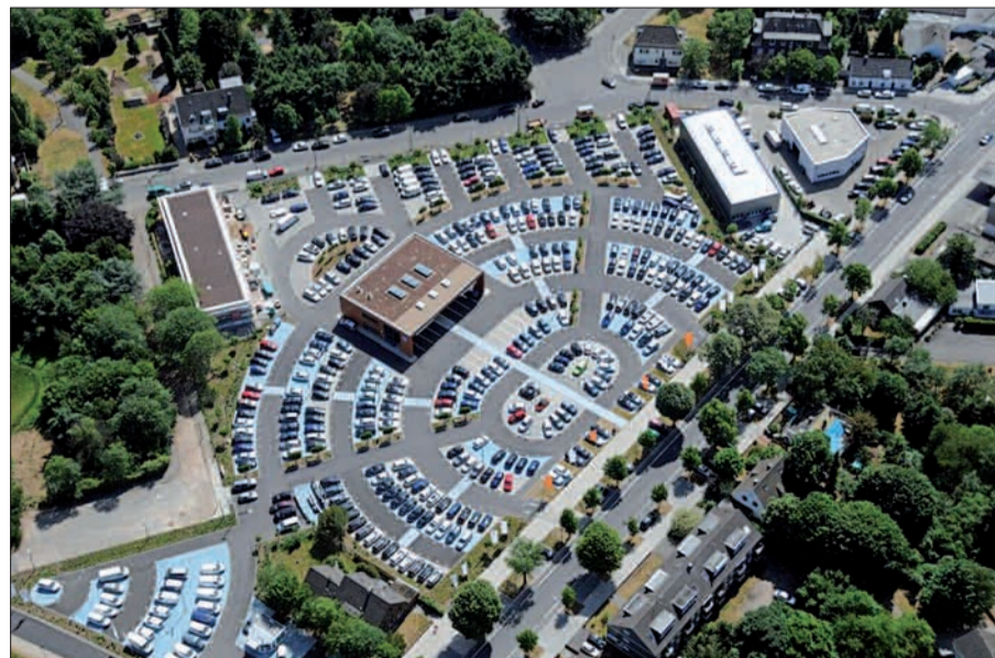
Beeindruckend ist die Fläche von Autohaus Moll in Lohausen, die vor wenigen Wochen von 17.000 auf 25.000 qm erweitert haben.

Der Auto Park, durch welchen in 2011 schon 36 neue Arbeitsplätze geschaffen wurden, wird nun durch die Erweiterung noch einmal 4 neue Mitarbeiter benötigen. Ziel für 2014 sind an diesem Standort mehr als 4.000 gebrauchte Fahrzeuge.