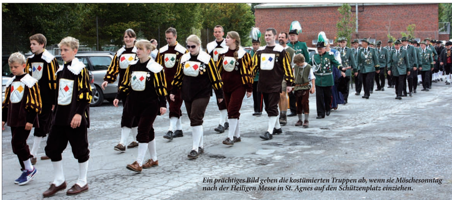
Ein prächtiges Bild geben die kostümierten Truppen ab, wenn sie Möschesonntag nach der Heiligen Messe in St. Agnes auf den Schützenplatz einziehen.

milien für den Möschesonntag begeistert werden. Die Erbsensuppe aus der Gulaschkanone jedenfalls schmeckt auch dem Nachwuchs. Ach ja, die Tombola winkt mit wertvollen Preisen. Den Überschuss übergibt der Vorstand der Bruderschaft der Aktion „Vision Teilen“, einer Initiative der Franziskaner gegen Armut und Not e.V. www.Bruderschaft-Angermund.de G.S.