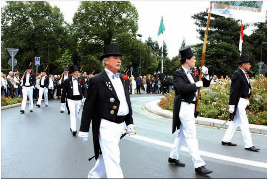
Prächtig anzuschauen sind die Pinguine der St. Sebastianus Bruderschaft Angermund 1511 e.V.