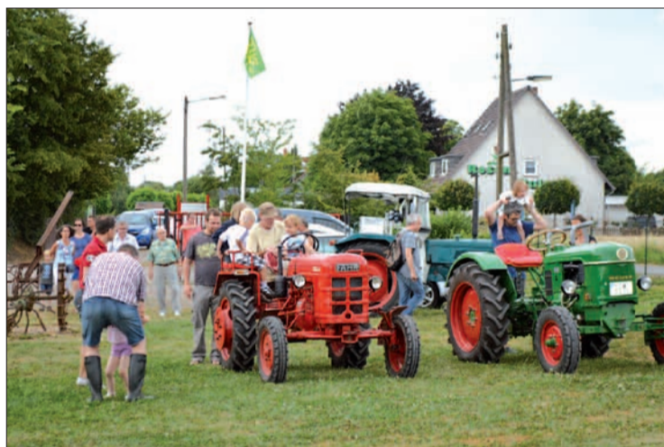
Im RTC sind mehr als 40 Mitglieder aktiv. Langfristig soll auf dem Gelände Am Grünen Weg ein Museum zum Anfassen und Ausprobieren entstehen.