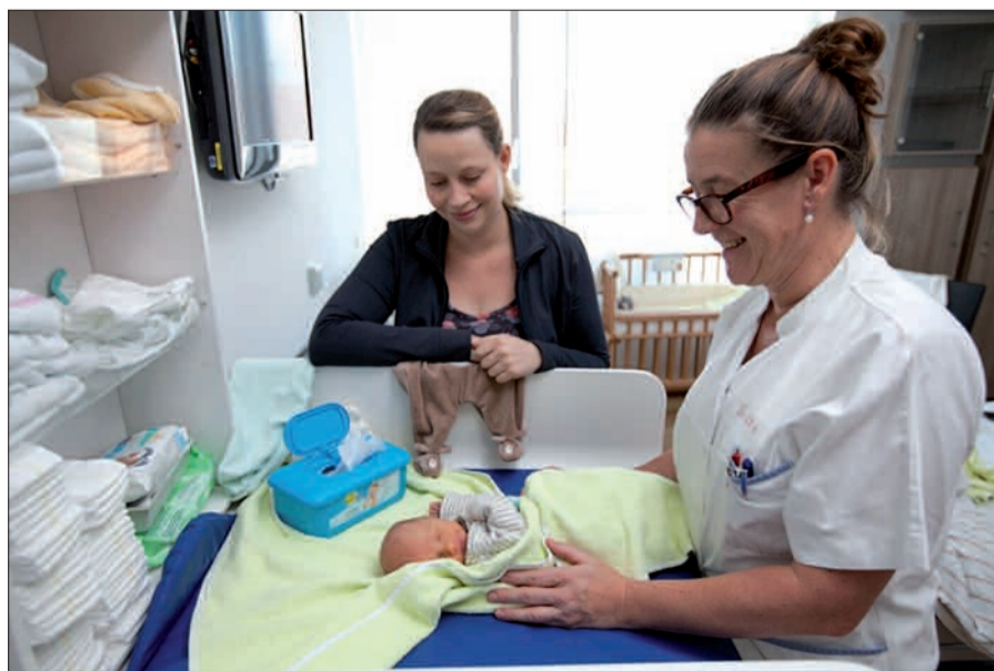
Die erste Baby Messe in Düsseldorf findet rund um das Florence-Nightingale-Krankenhaus in Kaiserswerth statt.