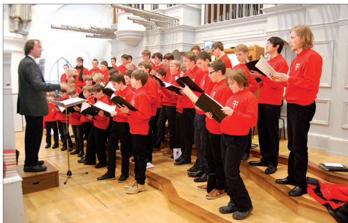
Etwa 40 Chorknaben werden schon bald die Wittlaerer Chorgemeinschaft besuchen und in einem gemeinsamen Konzert auftreten.