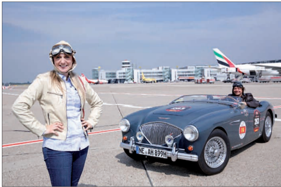
Der Airleibnissonntag am 1. September auf dem Flughafen verbindet Nostalgie mit Technik und Mode und bietet noch vieles mehr.

ehrwürdigen Fahrzeugen der 20er Jahre bis zu poppigen Youngtimern der 80er, für jeden Geschmack ist etwas dabei. Rock'n Roll-Star Peter Kraus wird höchstpersönlich erscheinen, sein Auftritt steht den fliegenden Oldtimern an Attraktivität nicht nach. Nach seiner Bühnenshow gibt's eine Autogrammstunde. „The Speedos“, die mobile Band, mischt sich mit Rock'nRoll und Evergreens unter das Publikum. Eine A-Capella-Gruppe (Peter and the Wolvettes), Jukeboxes, Tanzgruppen in schillernden, zeitgemäßen Outfits lassen vergangene Jahrzehnte wieder aufleben und machen gute Laune. Mittanzen ist ausdrücklich erlaubt, entsprechende Workshops werden angeboten. Modenschauen lassen in die 20er bis 70er Jahre zurückblicken. Wie historische Hüte gefertigt werden, ist zu beobachten, und damit es auch darunter gut aussieht, steht