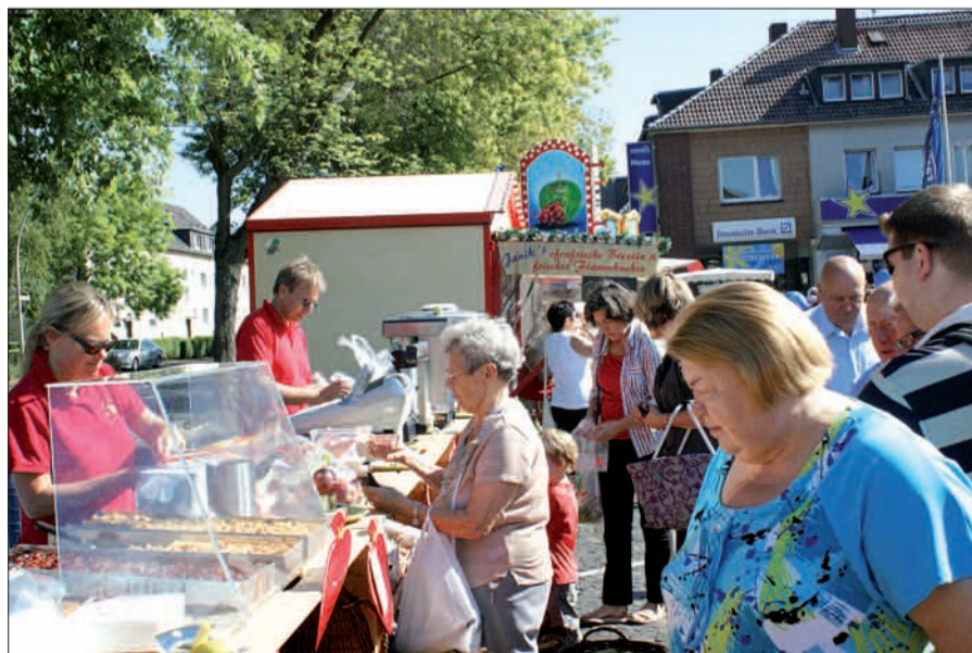
Die Werbegemeinschaft „Atrium Huckingen“ lädt am nächsten Sonntag, 8. September, von 11 bis 18 Uhr zum traditionellen Bauernmarkt ein.