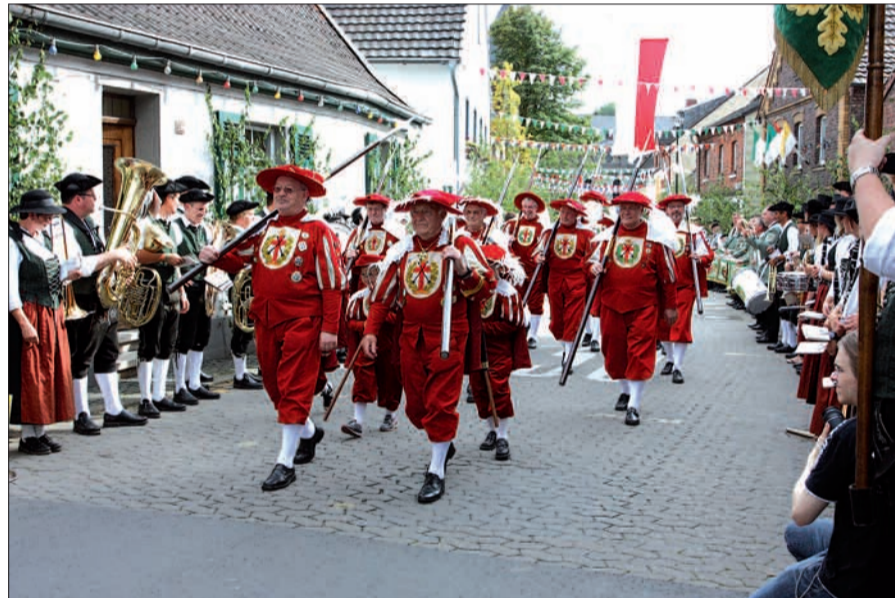
Die Stadttorwache in ihren prächtigen Kostümen beim Aufzug samstags nach dem Glockengeläut in St. Agnes.

Der NORDBOTE gratuliert der Stadttorwache zum 60-jährigen Bestehen! G.S.