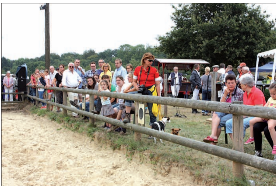
Viele Zaungäste bevölkerten die Reiterspiele auf dem Brokerhof.