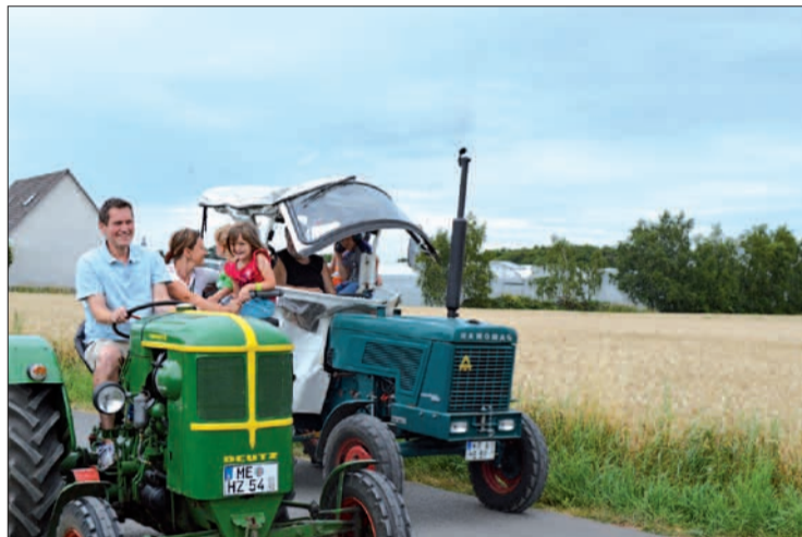
Einige Väter nutzten die Chance, selbst einmal Traktor fahren zu dürfen. Auf den Straßen rund um das Vereinsgelände herrschte Hochbetrieb.