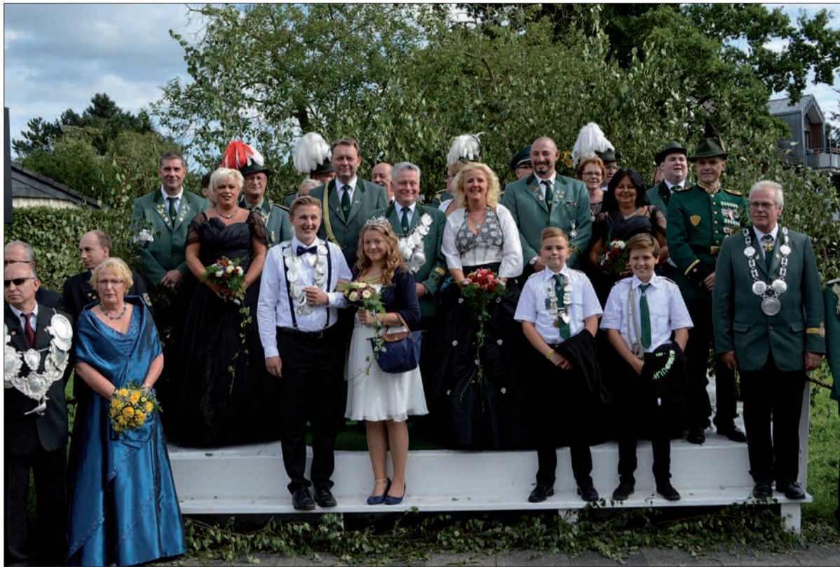
Am Knappert werden sicher wieder viele Bürger aus Rahm und Umgebung stehen, um die große Parade am Sonntag mitzuerleben. Am Freitagabend gibt es im Festzelt zwischen 19.30 und 21.30 Uhr eine "Happy Hour". Text u. Fotos: sam

Beim König treten die Schützen am Sonntag, 4. September , um 9.30 Uhr am Thelenbusch 53 an. Das Prinzenvogelschießen der Schützenjugend beginnt um 10.30 Uhr. Auch die Gäste schießen auf ihren Vogel. Erstmals dürfen sich die jüngeren Besucher auf Nekkerfs Kasperletheater freuen – die Vorstellung im Zelt beginnt um 11 Uhr. Das Tellprinzen-Vogelschießen beginnt um 12 Uhr. Zum großen Festumzug, der sich um 15 Uhr in Bewegung setzt, treten die Schützen um 14.45 Uhr „An der Huf“ an. Nach dem Gang durch