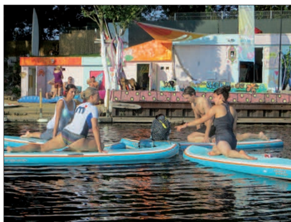
Stand Up Paddling ist ein hervorragendes Workout, da es den ganzen Körper trainiert. Die SUP-Station „Aloha“ liegt an der Sechs-Seen-Platte in Duisburg.