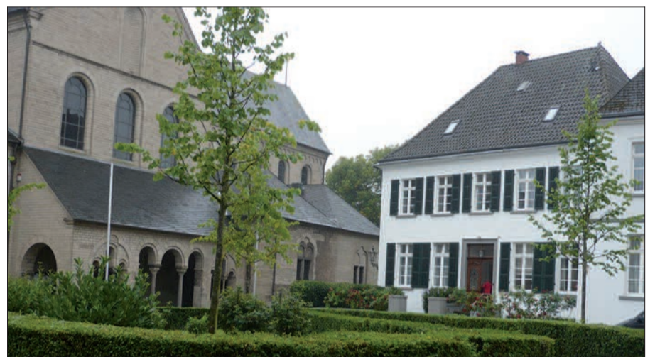
Der Suitbertus-Stiftsplatz ist der Mittelpunkt des Triduum Festes. Im Marienstift findet der Feierabend mit Gedichten und Liedern statt.