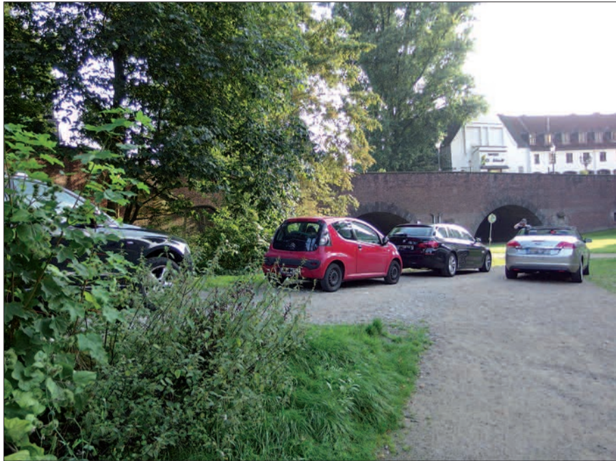
Einige findige Autofahrer haben ganz nah am Klemensplatz weitere Parkplätze für ihre „Blechkisten“ ausfindig gemacht. Kurz vor dem Taxiplatz rechts abbiegen auf die frühere Baustraße (zur Bastionsmauer/Grünanlage/Spielplatz) und schon steht man, ohne ein Verbotsschild passiert zu haben, im Wallgraben. Legal ist Parken in Grünanlagen natürlich nicht. H.S.