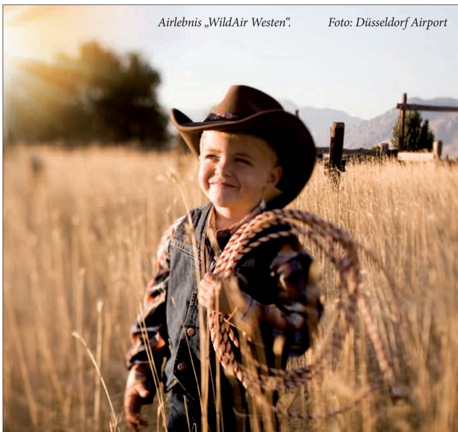
Airlebnis „WildAir Westen“.

Tauschen Sie Ihr Parkticket bis 18:00 Uhr an der Airlebnis Info. Danach in der Parkservicezentrale im Erdgeschoss von P3. Nicht einlösbar bei Einfahrt mit EC-, Kredit- oder Parkkarten!