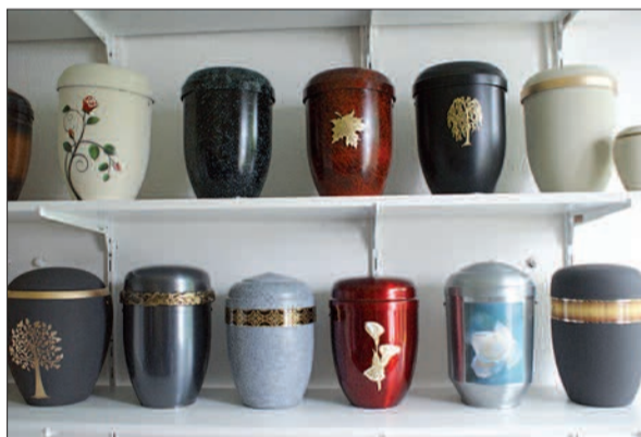
Eine große Auswahl an Urnen und Särgen können sich die Kunden im Lager anschauen und sich vor Ort ein Bild machen.

Kutzner Bestattungen GmbH, Grossenbaumer Allee 43, 47269 Duisburg-Großenbaum. Tel.: 0203/766553 0172/2129927, 0203/767183.