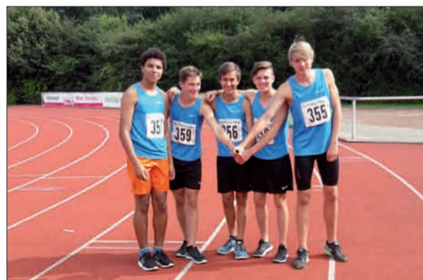
Nachwuchstalente an den Start. Hierin ist auch der Turnverein Angermund (TVA) Meister seines Fachs. Gerade erst punkteten die Läufer der Leichtathletik-Abteilung bei den Deutschen Jugendmeisterschaften in Bremen.

Man wird künftig noch viel von den Nachwuchssportlern hören, spätestens, wenn sie im September alle bei der Deutschen Teammeisterschaft in Rhede am Start waren. G.S.