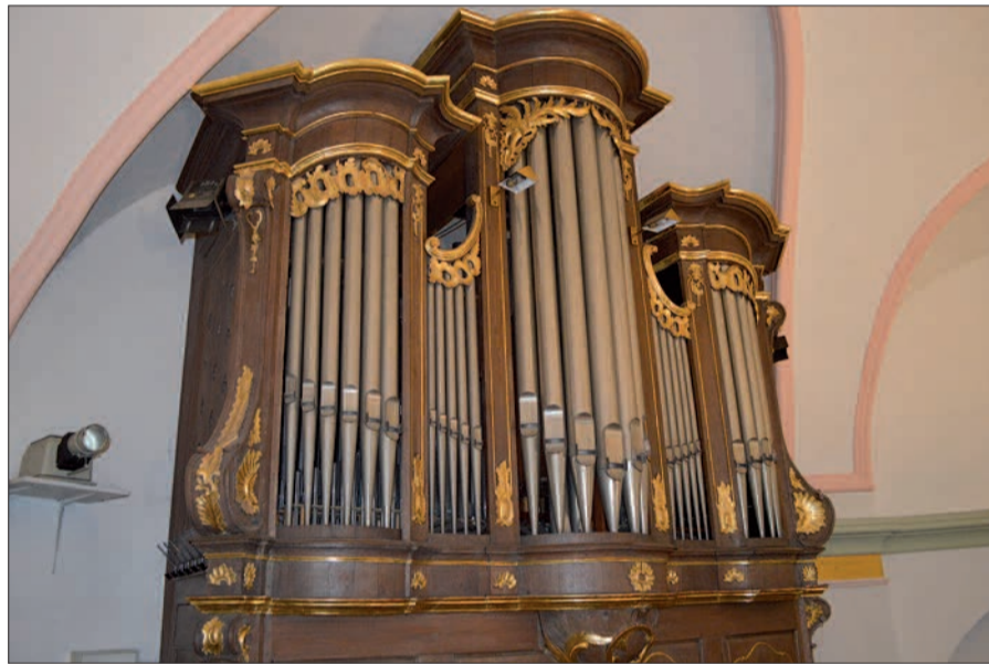
Stark sanierungsbedürftig ist die Orgel, die 35 Jahre alt ist. Alle 1292 Pfeifen werden ausgebaut und einzeln gesäubert. Auch die elektrische Anlage wird komplett saniert.

Geschenke zu Taufe, Kommunion oder Hochzeit. Zur Auswahl stehen Pfeifen zwischen drei Zentimetern und fünf Metern Höhe. Es gibt eine persönlichen Patenkunde, die Spende ist steuerlich abzugsfähig. Der Förderverein St. Hubertus e.V.