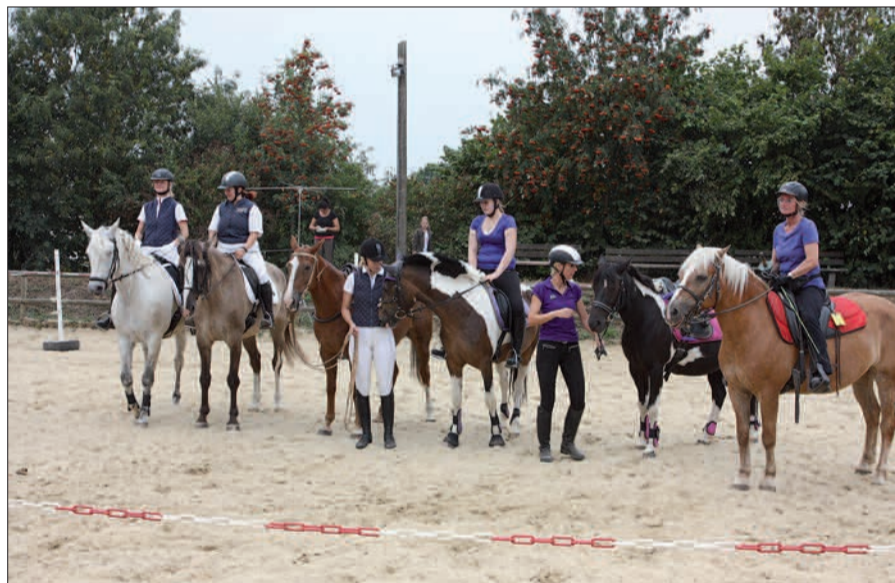
Die Kleinen Reiterspiele sind familiär, sportlich und ein hübsches Ereignis für alle Freunde des Reitsports auf dem Brokerhof in Angermund.

eröffnen. Ab 12 Uhr stehen Einzelringstechen nur für RCA Mitglieder auf dem Plan, es geht um den Walter-Krejci-Pokal. Ab 13 Uhr wird das offene Ringstechen für Jedermann ausgetragen. Armbrustschießen ab 14 Uhr um die RCA-Königswürde und ab 16 Uhr das Angerland-Ringstechen der Reitercorps von Angermund, Lintorf, Ratingen um den Martin-Schilling-Wanderpokal dürften für Spannung sorgen. Ab 17 Uhr ist Siegerehrung und anschließend gemütliches Beisammensitzen mit Essen und guten Getränken. Der Sonntag, 28.08., steht ab 11 Uhr ganz im Zeichen von verschiedenen Dressur- und Reiterwettbewerben. Die Atmosphäre auf dem Brokerhof in Angermund ist immer besonders nett, familiär, man kennt und man