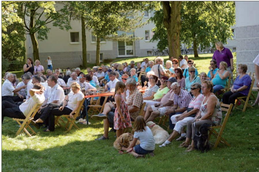
Da die Bruderschaft das Königsschießen erstmals an einem Sonntag ausrichtet, hoffen die Schützen auf noch mehr Zuschauer beim Schützen- und Heimatfest.

Mit einer neuen Struktur des Schützenfestes möchte die Huckinger St. Sebastianus Bruderschaft am letzten Augustwochenende mehr Bürger für die Gemeinschaft des Ortes gewinnen. Die Schützen feiern erstmals von Freitag bis Sonntag, 26. bis 28. August, nicht mehr von Samstag bis Montag. Der Vorstand der Schützenbruderschaft unterstreicht in der Festschrift: „Damit möchte sich die Bruderschaft noch mehr den Bürgern öffnen und hofft auf rege Teilnahme, bei den neuen Veranstaltungen an den Schützenfesttagen.“ Auch neue Zugstrecken sind geplant.