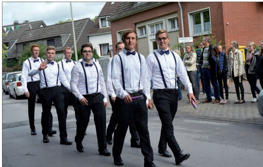
Noch nicht so lange gibt es die Walter-Schönheit-Kompanie, deren Mitglieder in ihrer schmucken Tracht den Festumzug bereichern.

Der Montag, 5. September , beginnt um 10 Uhr mit einem ökumenischen Wortgottesdienst im Zelt. Um 11 Uhr tritt die Bruderschaft