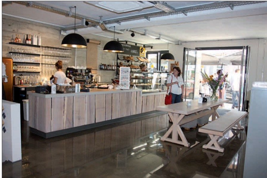
Deli & friends, Genuss zu jeder Tageszeit im neu eröffneten Bistro mitten in Kaiserswerth.