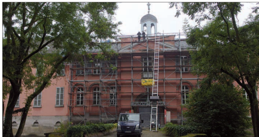
Das noch eingerüstete „Englische Tor“ mit dem Trompetenengel obenauf.

gentümer, der sich bislang zum Verkauf des Schlosses öffentlich geäußert hat) haben in der Vergangenheit bemerkt, dass sie sich eine Lockerung des Denkmalschutzes vorstellen können, um eine sinnvolle Nutzung zu ermöglichen. Bleibt zu hoffen, dass sich Denkmalbehörden und der Bau- und Liegenschaftsbetrieb NRW (BLB) bald in diese Richtung bewegen. Der Engel auf dem Englischen Tor wird jedenfalls nicht im Wege stehen. H.S.