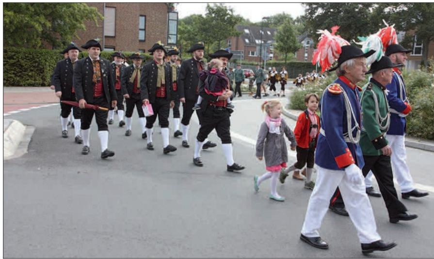
Es ist ein schöner Vorgeschmack auf das Schützenfest, wenn viele prächtig uniformierte Gruppen von der St. Agnes Kirche zum Schießstand am Freiheitshagen in Angermund ziehen und die Goldene Möscher durch die Rosenstadt tragen.

Bei den ersten Schießwettbewerben sind die Ehrengäste und Gönner der Bru-