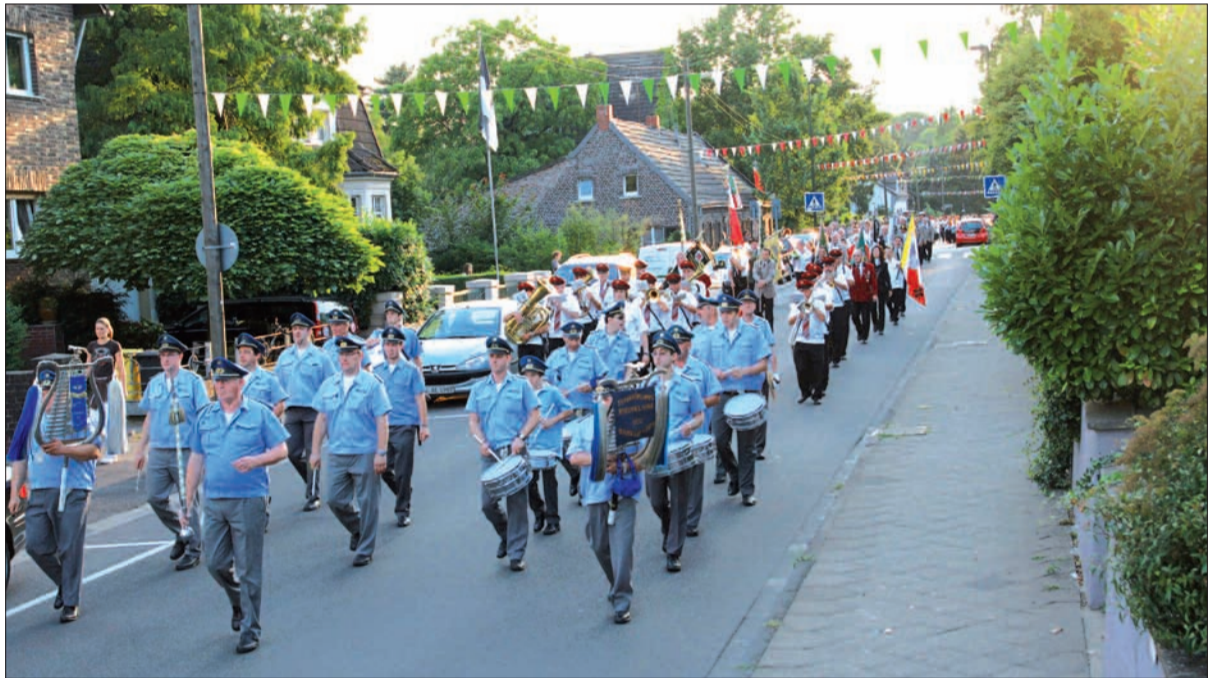
Nach der Serenade marschieren die Schützen, angeführt durch das Tambourcorps Lohausen, in der Abendsonne zum Festzelt