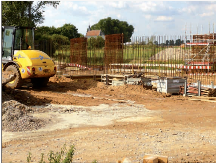
An der Größe der schon stehenden Fundamente kann man die Ausmaße der neuen Angerquerung mit dem daneben liegenden Geh-, Rad- und Reitweg nur erahnen.