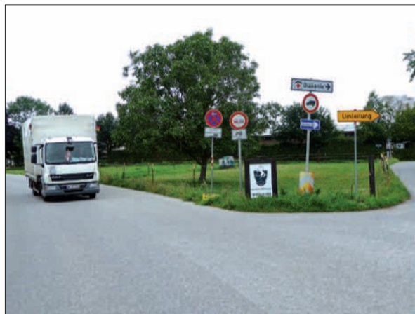
Der Verkehr auf der Zeppenheimer Straße hat in den vergangenen Jahren erheblich zugenommen. Die unübersichtliche Verkehrsführung ist aber noch auf „Vorkriegsstand“.