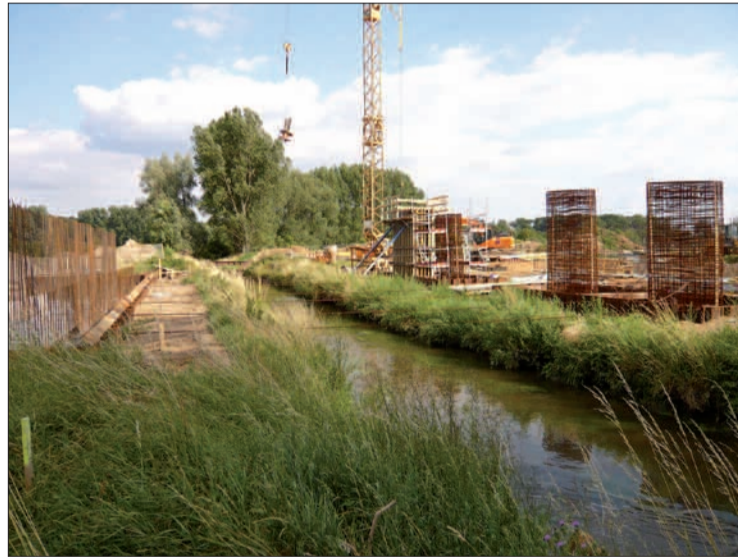
Mit dem Neubau der B 8n verändert sich auch das Landschaftsbild um die Hubertuskapelle.