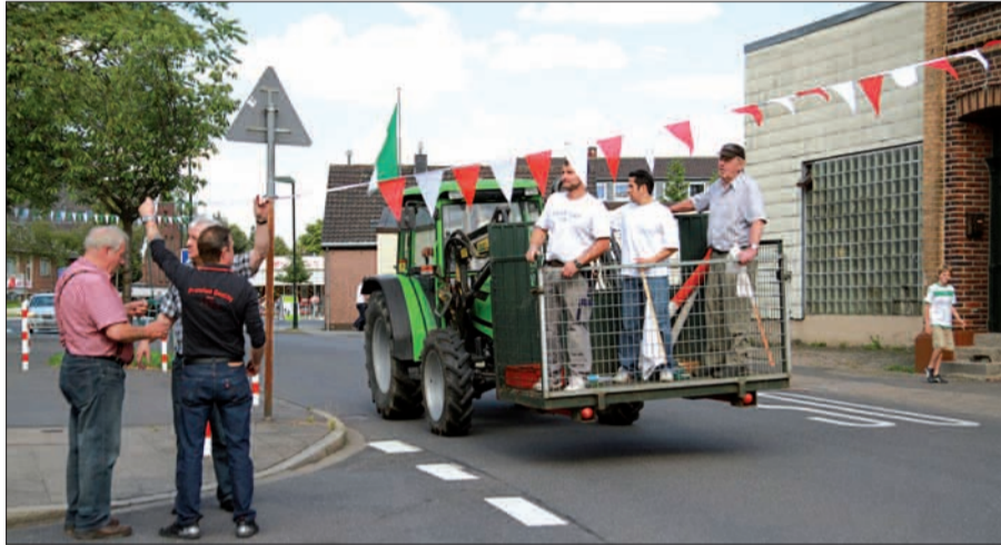
Mit schwerem Gerät unterwegs: Am Donnerstag schmückt eine Gruppe Schützen die Lohausener Dorfstraße