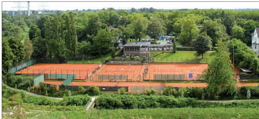
Da wo der "Neue Angerbach" wieder in das alte Angerbett nach Westen abknickt, um in den Rhein zu münden, liegt die Sportanlage des TC Duisburg-Süd.

gen durchgeführt werden. Am heutigen Freitag steht der Turniertag ab 17 Uhr unter dem Motto "White Friday". Alle Spieler und Zuschauer werden in überwiegend weißer Kleidung dem Grundgedanken des Tennissports die Ehre erweisen. Ausklingen lassen wird man den White Friday mit einer Party, zu der alle Spieler, Gäste, Zuschauer und Mitglieder eingeladen sind. Am Samstag, dem 28. August stehen dann ab 12 Uhr die Endspiele bei den Möbel Dvorak Open an. Hier wird es wieder hochklassigen Tennis Sport zu sehen geben. Die Cocktail Bar wird