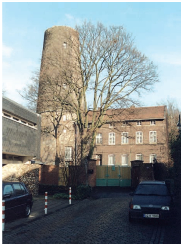
Der Kaiserswerther Mühlenturm mit östlichem Anbau („Beamtenhaus“) vor der Sanierung.