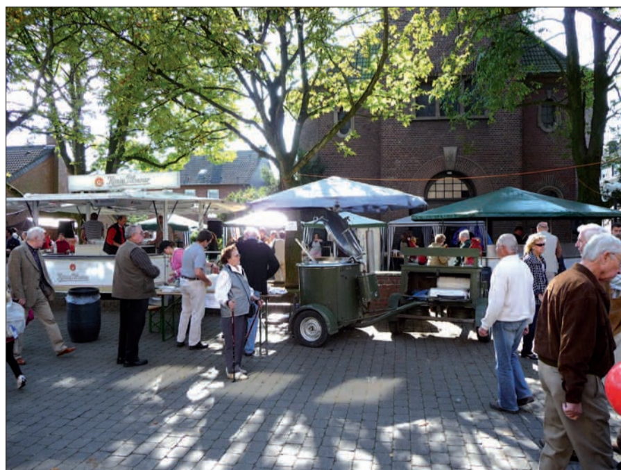
Auf dem Sermer „Kappesmarkt“ steht jetzt nicht mehr marktwirtschaftliches Gewinnstreben im Vordergrund, sondern „sehen und gesehen werden“, nachbarschaftliche Kommunikation, dörfliche Gemeinschaft und soziales Engagement. Auf diesem Foto aus 2008 steht mal grade die Gulaschkanone im Vordergrund.

Jetzt steht allerdings nicht mehr der Gemüseanbau im Vordergrund, obwohl einige Sermer Bauern immer noch erstklassiges Gemüse und beste Kartoffeln liefern. Man trifft sich in Serm, „klönt“ miteinander, natürlich gibt es „Speis und Trank“ und was an Erlösen übrig bleibt, kommt sozialen Zwecken zugute. H.S.