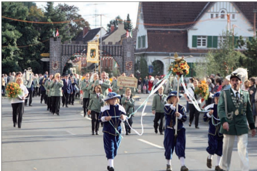
Auch bei der Festparade zum Schützenfest hat die Goldene Mösch sonntags nochmals ihren großen Auftritt.