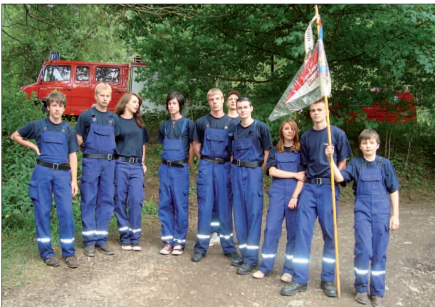
Gute Teamfähigkeit und Kameradschaft sind die Eckpfeiler der Jugendfeuerwehr Kaiserswerth.