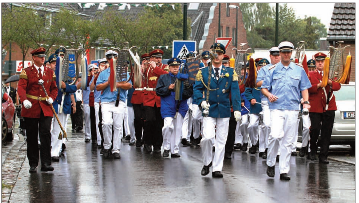
Wetterfest: Am Sonntag ziehen die Tambourcorps Lohausen, Wittlaer und Barbarossa sowie das Fanfarencorps Schwarz-Weiß im strömenden Regen vom Wachlokal zum Festplatz