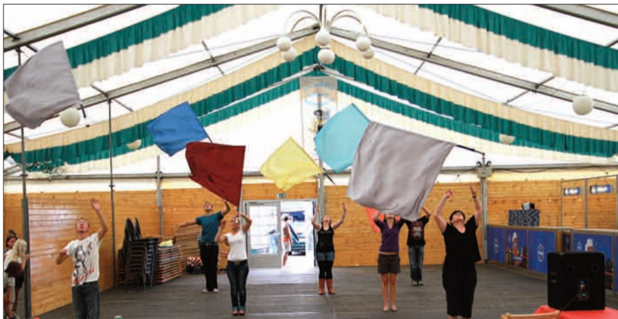
Leeres Zelt, aber voller Einsatz: die Fahنشwenker bei der Generalprobe für ihre Galashow