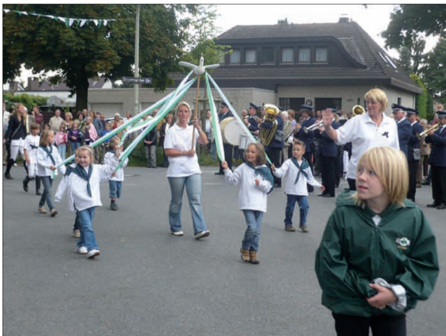
Nachwuchssorgen hat die Rahmer Bruderschaft nicht.

R&R Kosmetik MARIA GALLAND ... für Sie und Ihn !