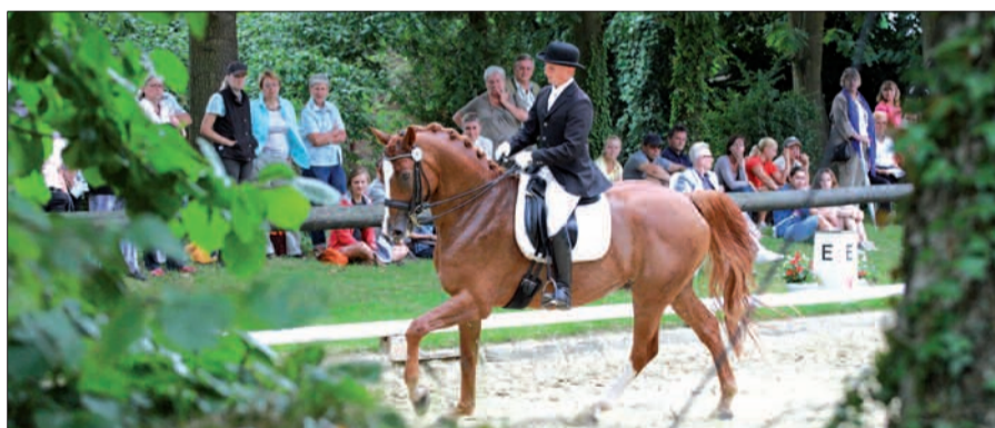
Die Dressurprüfung Klasse M** fand sonntags unter den kritischen Blicken des fachkundigen Publikums statt.