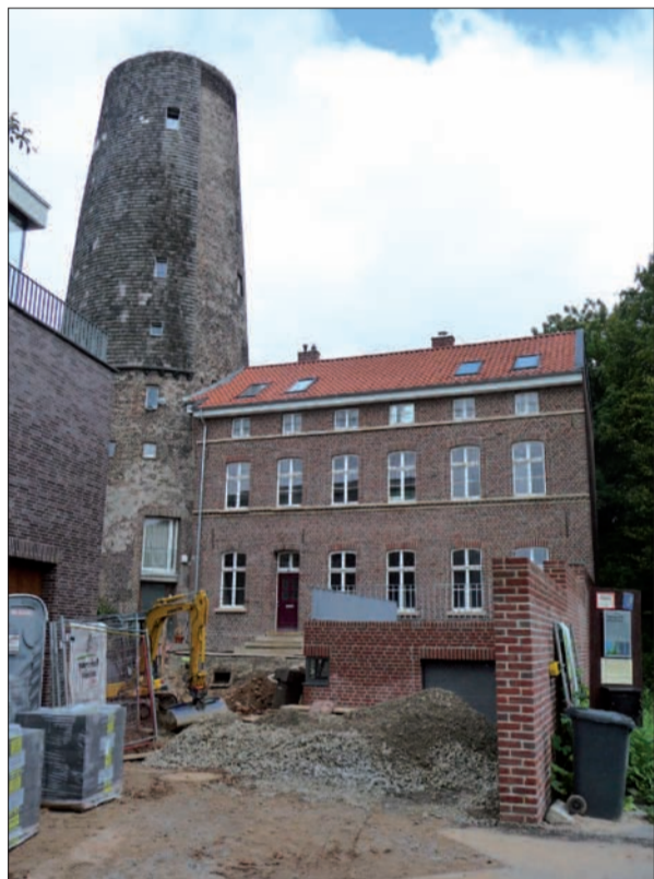
Der Mühlenturm mit saniertem östlichen Anbau und neuer, vorgebauter Garage heute.