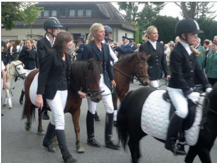
Schon beritten sind die Kleinsten beim Festumzug.

Montag, 6. September: 10 Uhr Gottesdienst für die Rahmer Schützenfamilie. Das Königsvogelschießen ab 11 Uhr wird eingerahmt vom traditionellen Erbsensuppenessen im Festzelt (12.45 Uhr) und der Proklamation der Neuen Majestäten (15 Uhr). Der Krönungsball (19 Uhr) beschließt das Fest. An allen Tagen ist der Eintritt in das Festzelt frei! Und Münchenhausen sorgt in bewährter Manier für kleine Snacks und ab 11 Uhr den Frühshoppen mit Fingerfood. G.S.