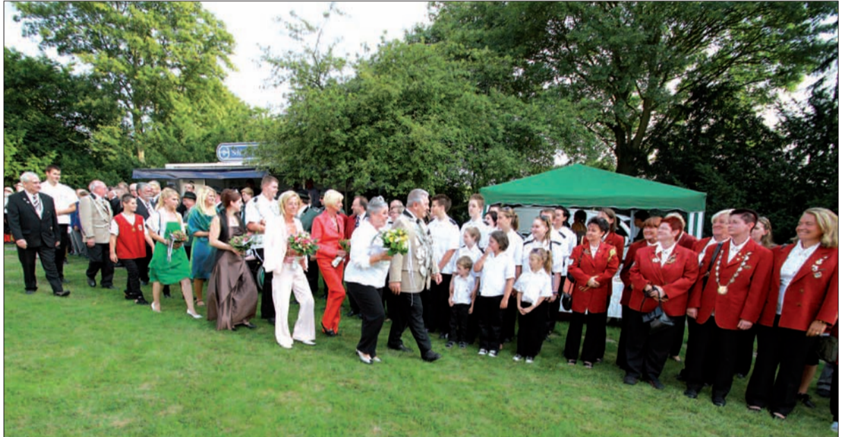
Das da noch amtierende Königs-, Kronprinzen- und Pagenkönigspaar samt Hofstaat schreiten bei der Serenade die Front der angetretenen Schützen ab