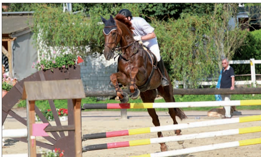
Kraftvolle Eleganz bei der Punktespringprüfung Klasse L am Samstag