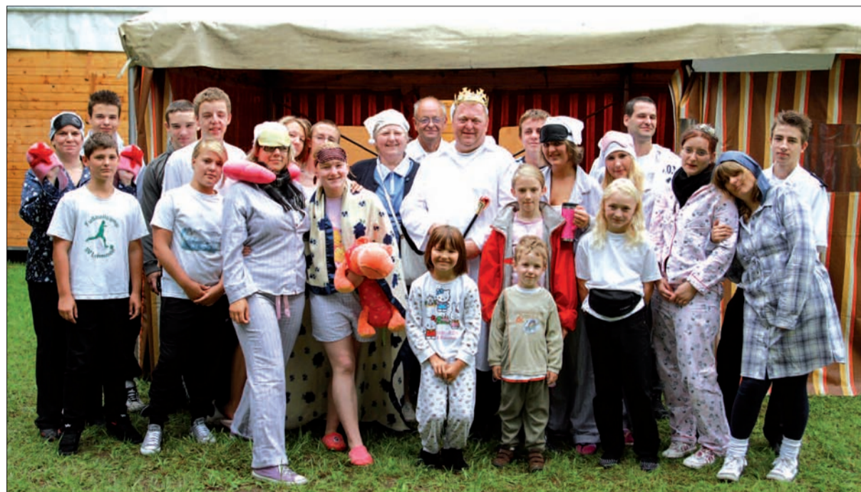
Zum gemeinsamen Frühstück trafen sich am Montag die Fahnen-schwenker und weil es noch so früh war, hatte man das Schlaf-gewand gleich anbehalten