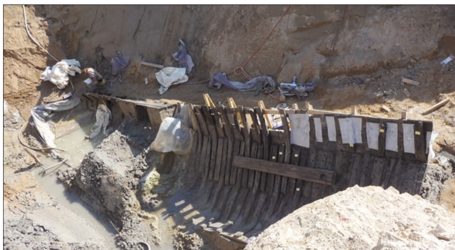
Ein aktuelles Foto des in Kaiserswerth freigelegten Plattbodenschiffes. Es liegt auf der Seite mit dem Heck nach unten geneigt. Das Bugteil ist bereits geborgen und zwischengelagert. Text u. Foto: H.S.