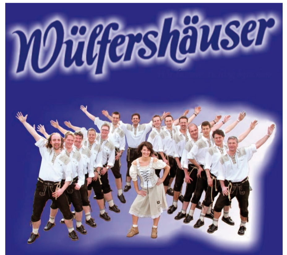
Ein Auftritt der „Wulfershäuser“ ist in jedem Fall ein Ereignis, das man sich nicht entgehen lassen sollte, denn wenn die Stimmung kocht, setzen sie zum richtigen Zeitpunkt noch einen drauf, denn eines steht fest, sie lassen's am Samstag, dem 29. August auf der Schützenparty in Huckingen richtig krachen!!!

Oktober- oder Weinfesten, bei Bierzelt- oder O p e n - A i r - Veranstaltungen beweisen. So reicht die musikalische Vielfalt von traditioneller Blasmusik über volkstümliche Stimmungshits, gefolgt von Party- und Tanzmusik vom Feinsten sowie Oldies bis hin zu aktuellen Krachern, die einfach nicht fehlen dürfen. Auch die zahlreichen Showeinlagen zählen zu den Spezialitäten der Party-Crew, wodurch sie der musikalischen Darbietung noch ein Sahnehäubchen aufsetzen.