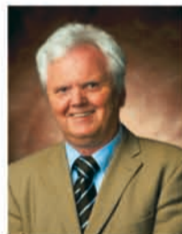
Ulrich Decker Richter am OLG