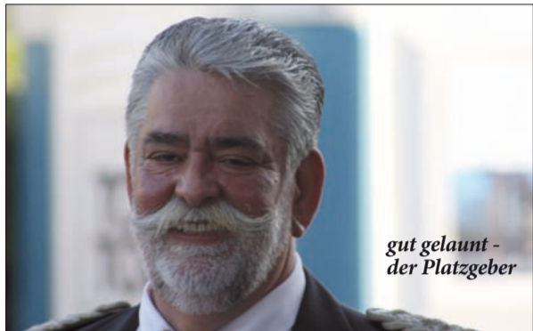
gut gelaunt - der Platzgeber