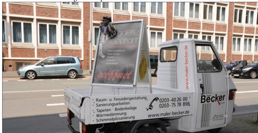
Hier auf der Gutenbergstraße 16 in Duisburg, in der galerie lelephant, hat man in drei Jahren unter Beweis gestellt, das man den differenzierten Bedürfnissen eines anspruchsvollen Marktes und der Individualität der Käufer gerecht geworden ist und auch bleiben wird.