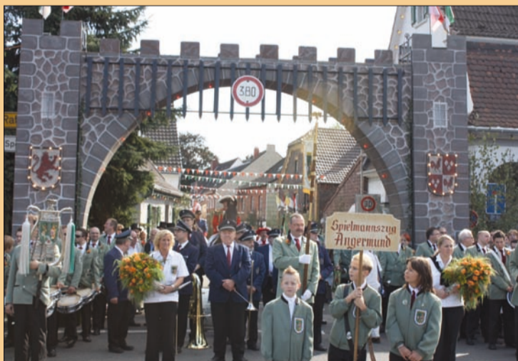
Der Festumzug am Sonntag vor der Stadt-torwache