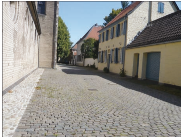
Rund um den Stiftsplatz in Kaiserswerth werden die Feierlichkeiten stattfinden. Text u. Foto: G.S.

schulinternen Gottesdiensten vorbehalten ist, öffnen seine Pforten) bis zum 4.9. erstrecken und mit einer Festmesse in der Suitbertus-Basilika um 18.30 Uhr und einem anschließenden Vortrag ihren Abschluss finden (Prälat Prof. Dr. Trippen, Religionsfreiheit und nicht-christliche Religionen). Das Suitbertus-Fest beginnt am 6.9. mit der Festmesse um 11 Uhr, mittags ist Gemeindetreff mit Eintopf und Altbiert und die Suitbertus-Vesper mit Schrein- und Lichtprozession ab 19.30 Uhr bildet den Abschluss. Die Choralschola und der Posaenorchester Kaiserswerth sorgen für die musikalische Gestaltung.