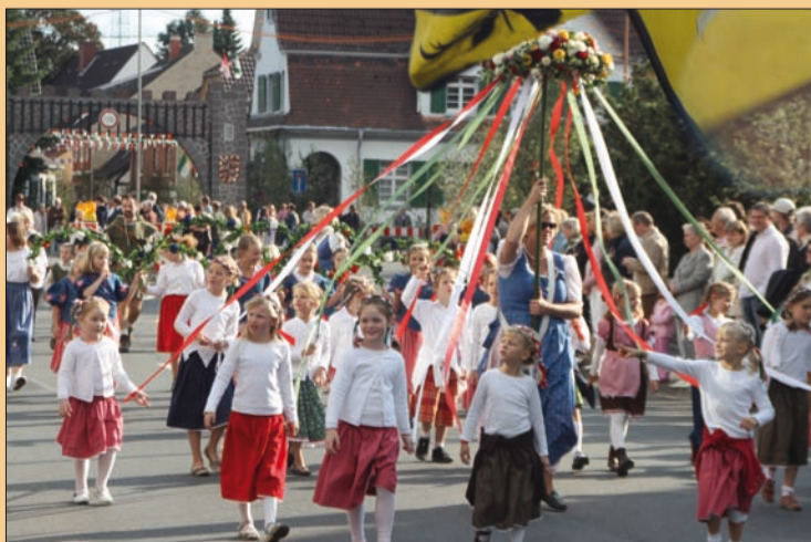
Keine Nachwuchs-sorgen in Angermund