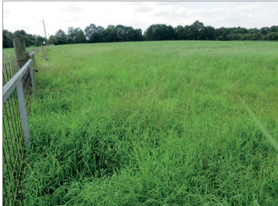
Der Himgesberg an der Alten Kalkumer Straße. Was sich 40 Meter über Meereshöhe nähert, wird in Kaiserswerth Berg genannt.

Belegschaftswohnungen, werden weniger Probleme gesehen. Im Gelände der Kaiserswerther Diakonie wären außerdem Verdichtungen und Sanierung von Leerständen möglich, bei Beibehaltung oder sogar Aufwertung des parkartigen Charakters. Ein Architektenwettbewerb läuft bereits. Allerdings ist er vertraulich. Das entspricht nicht den Vorankündigungen, die Bürger- und Anwohnerbeteiligung versprochen hatten. H.S.