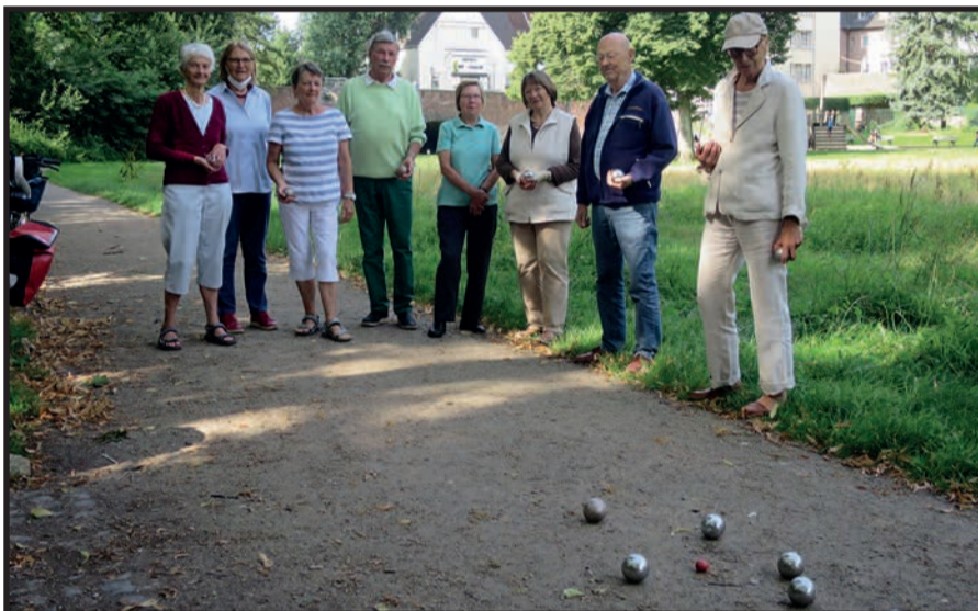
Viel Spaß haben Boule-Spieler der aktiven Kaiserswerther Nachbarschaft im Wallgraben unter der Klemensbrücke. Wünschenswert und weniger störend für Passanten wäre ein gesonderte Boule-Bahn.

Gemeinsam, nicht einsam ist der Leitgedanke der „aktiven Nachbarschaft“ in Kaiserswerth. Niemand wird ausgegrenzt, jeder kann dabei sein, gleich welchen Alters und welcher Konzeption. Man trifft sich, man lernt sich kennen, man hilft sich, man unternimmt etwas in kleinen und größeren Gruppen. Lebensfreude steigert sich gemeinsam, Schwierigkeiten meistern sich gemeinsam besser. Rund 50 Kaiserswerther sind bereits gelegentlich oder regelmäßig dabei. Gut frequentiert ist das gemeinsame Frühstück jeden 4. Montag um 10 Uhr im „Mach-mit-Cafe“ im ev. Gemeindehaus, Fliederstraße 6. Zwanglos in offener Runde setzt man sich zusammen bei einer Tasse Kaffee und