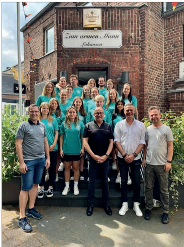
Lohausener Damenfußballerinnen mit ihren Sponsoren vor der Traditionskeipe „Zum Armen Mann“.