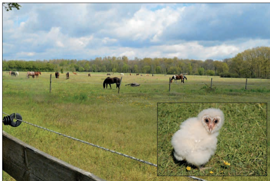
Im Rahmerbuschfeld wurde vor kurzem ein Eulen-Baby (Symbolfoto) gesichtet. Die Bürgerinitiative „Naturerhalt Rahmerbuschfeld“ freut sich über den Brutnachweis der Schleiereule dort.

nis genommen. Wir können sehr gut nachvollziehen, dass Sie Bedenken haben.“ Die BI solle sich an die Stadt wenden, die klare Anweisungen und Auflagen zu erfüllen habe. Auch Kontakt mit der EU-Kommission soll aufgenommen werden – eine Europa-Abgeordnete der Linke hat zugesagt, sich die Situation des Rahmerbuschfelds Ende August vor Ort anzuschauen. sam