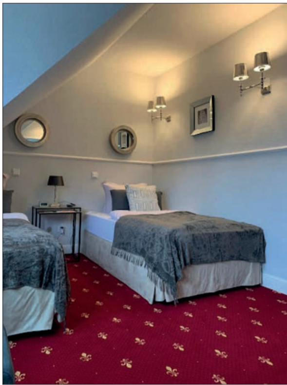
Ein Blick in die Zimmer zeigt, dass der neue Inhaber einfach einen guten Geschmack hat.

im Angebot sind. Klassiker wie Spaghetti aglio, olio e peperoncino gehören ebenso dazu wie die Pinsa, das ist eine Pizza mit besonderem Teig aus Reis- und Maismehl, die sehr lange garen muss, bevor sie in die Zubereitung kommt. Alles klingt lecker, alles gut. Auch die Gerichte mit Trüffeln und Seeteufeln und feinstem Fleisch. Diese Woche stehen gegrillter Pulpo, Kabeljau und ein italienisches Landschwein mit Gemüse auf der Karte. Da möchte man unter dem Sonnenschirm weit weg von der Straße gleich Platz nehmen und bleiben. Verlockend ist auch das Frühstücksangebot für 14,90 Euro mit allem, was das hungrige Herz begehrt. Italienischer Kaffee, Müsli, fri-