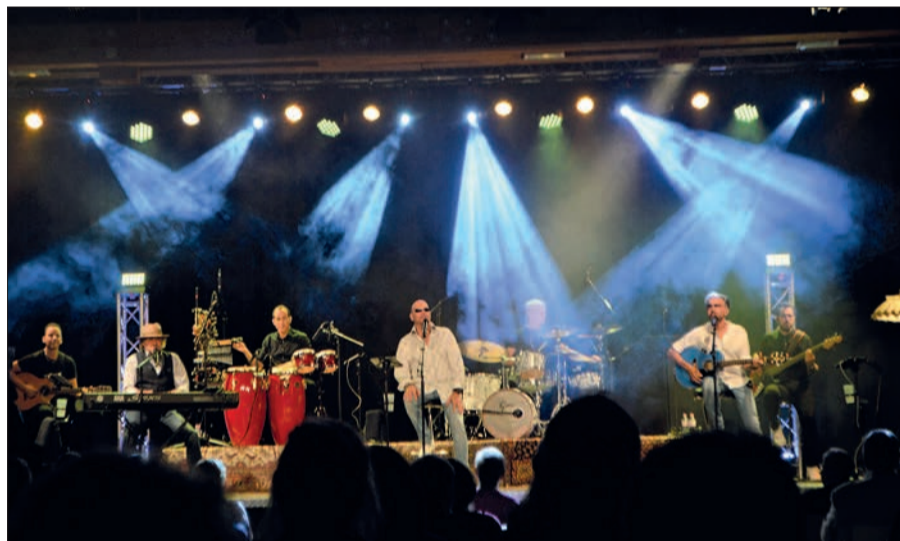
Was für ein tolles Erlebnis, mal wieder in einer Halle ein Konzert erleben zu dürfen! An zwei Abenden spielte die Bee-Gees-Tribute-Band Night Fever zum Neustart im Steinhof.

Die nächsten Termine: Ray Wilson Band (7.8.), Jürgen B. Hausmann (15.8.), The Queen Kings (21.8.), Stop-pok & Band (22.8.) und Wildes Holz (26.8.). Ein Besuch lohnt sich! sam