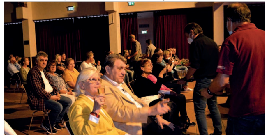
Mitglieder des Steinhofs-Vorstands verwöhnen die Gäste mit einem Freigetränk – alle freuten sich, endlich wieder Kultur live und auf engem Raum erleben zu dürfen.