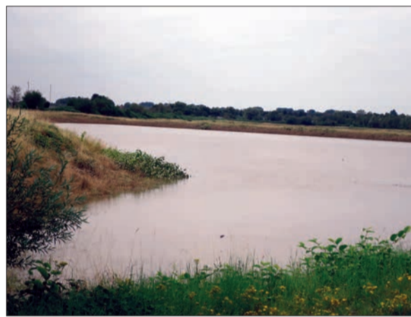
Das Hochwasserrückhaltebecken Kalkum (Teilansicht) Ende Juli 2021.

Der BRW, der für die Pflege und Instandhaltung der Bäche („Vorfluter“) hier zuständig ist, verfolgt das Ziel, durch ökologische Umgestaltung und Retentionsräume (Überflutungsflächen) die Wasserqualität zu verbessern und die Hochwassergefährdung zu verringern. Deiche können