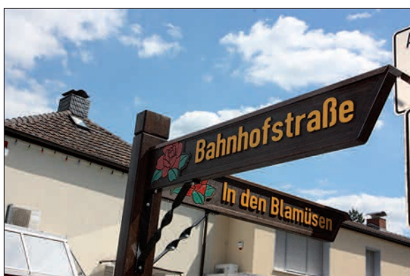
Neue Straßenschilder in Angermund mit dem Kennzeichen der Rose sind schon montiert.