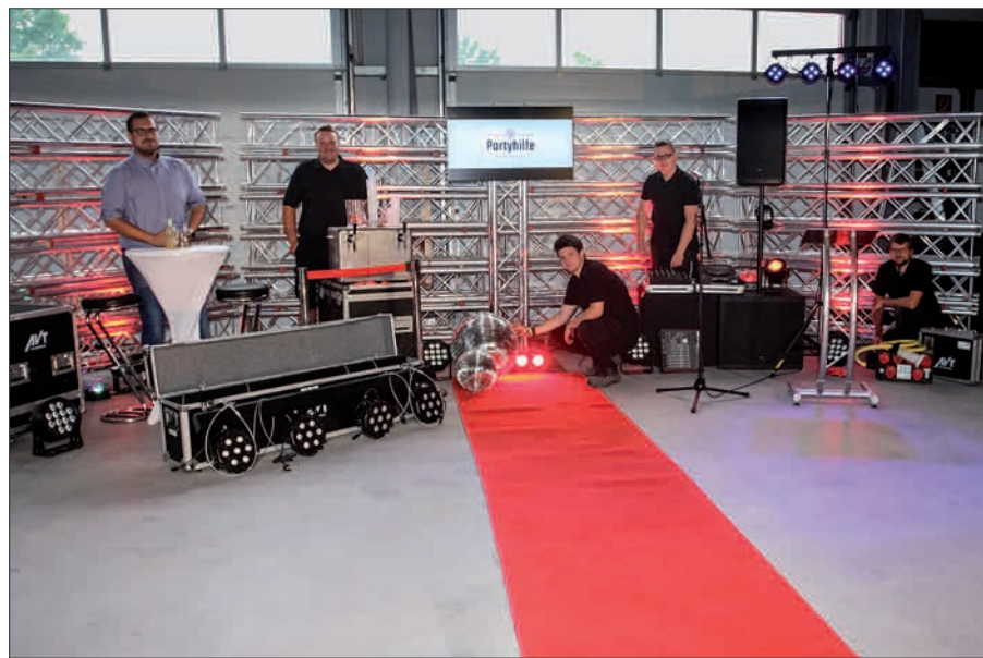
Die Halle mit der kompletten Veranstaltungstechnik überzeugt.

„Wir machen auch Kleinigkeiten. Wenn bei der Party nur einzelne Bäume angestrahlt werden sollen, kümmern wir uns gern darum. Wenn es tolle Cocktails geben soll, besorgen wir den