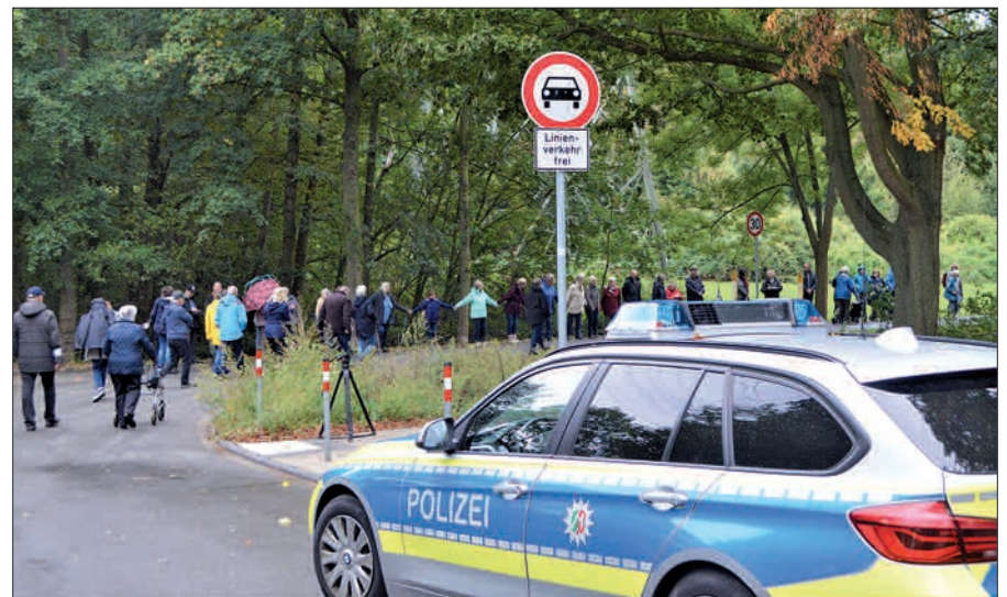
Massiven Protest gegen den neuen Fahrplan im ÖPNV hatte es im vergangenen Jahr in Ungelsheim gegeben. Aktuell sind hier noch keine Änderungen geplant.

Die Duisburger Verkehrsgesellschaft AG (DVG) verbessert die Anschlüsse zwischen den Buslinien 940 und 941 an der Haltestelle „Am Krähenhorst“ in Großenbaum. Diese Optimierung gilt ab kommenden Mittwoch, 12. August, und besteht laut DVG darin, dass die Umstiegszeiten unter den aktuellen Rahmenbedingungen optimiert wurden. Hiervon profitierten vor allem die ÖPNV-Nutzer, die von beziehungsweise nach Großenbaum/Rahm in beziehungsweise aus Richtung Sittardsberg beziehungsweise Schulzentrum Süd fahren.