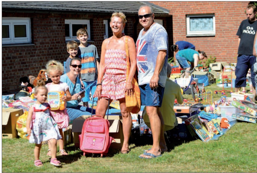
Viele Rahmer Bürger hatten die Ecken ihre Keller und Kinderzimmer ausgeräumt, um schöne Sachen für den Trödel zur Verfügung zu stellen. Mehr als 2.200 Euro sammelten Fußballer und Pfadfinder auf der Gemeindefläche ein.