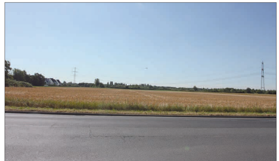
So wie hier am Ortsausgang von Angermund Richtung Kalkum und Kaiserswerth sollten viele Freiflächen möglichst unbebaut bleiben.