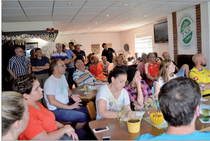
Im Tennisclubhaus informierten sich viele Mitglieder über den aktuellen Stand zum Kunstrasenplatz. Bei einer Enthaltung votierten alle Anwesenden für die Umsetzung des großen Projekts.

Um noch mehr Geld in die Kasse zu bekommen, hatte die Fußballabteilung in Zusammenarbeit mit den Rahmer Pfadfindern einen Flohmarkt auf der Gemeindefläche an St. Hubertus ausgerichtet. Bei hochsommerlichen Temperaturen harrten viele Helfer lange aus. Es hat sich gelohnt: Mehr als 2.200 Euro kamen zusammen. Ein paar Sachen sind übrig geblieben. Dazu Kleinen: „Die Kleidung haben wir der Diakoniewiese an St. Hubertus gespendet. Das Kinderspielzeug spenden wir an die umliegenden Kindergärten und an das Kinderdorf Rotdornstraße in Großenbaum. So können wir mit den Dingen, die nicht verkauft wurden, auch noch etwas Gemeinnütziges tun.“