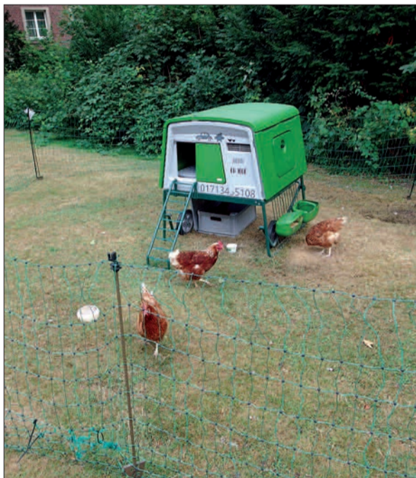
Diese Gäste aus einer Hühnerfarm in Lünen fühlen sich in Kaiserswerth sehr wohl und bedanken sich bei den Gastgebern mit frischen Eiern. Text u. Foto: H.S.

und Schulen usw., aber auch gern zu Privat, wenn dort ein geeignetes Plätzchen zur Verfügung steht. Die Hühner in Gruppen gehen gern auf Reisen und andererseits erleben Jung und Alt in den Städten, dass Eier nicht nur aus Massentierhaltung und Supermärkten kommen müssen. Ausreichend „Proviand“ (Futter) bekommen die Hühner mit, vom Ordnungs- und Veterinäramt bekommen sie ein „Visum“ (das heißt, sie sind behördlich geprüft, überwacht und genehmigt). Den Gastgebern entstehen Kosten von € 150,- für 14 Tage (Mindeststückseier einschließt. Übrigens ein ideales und auch ein besonderes Geschenk für tierliebende Gastgeber!