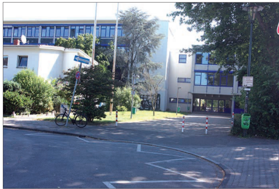
Das Max-Planck-Gymnasium in Stockum war einst ein naturwissenschaftlich und neusprachlich ausgerichtetes Jungengymnasium. Seit Beginn der 80-er Jahre des vorigen Jahrhunderts ist diese Schule gemischt.