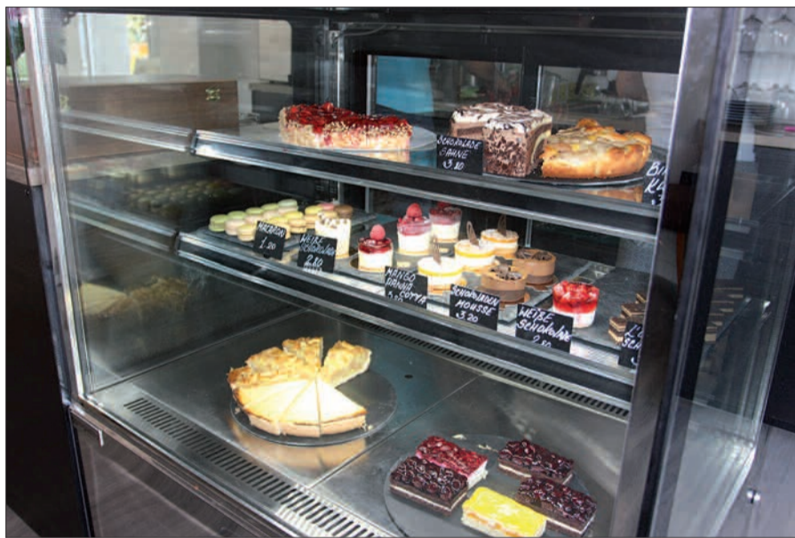
Macarons über Petit Fours bis traumhafte Törtchen. Naschkatzen kommen hier auf ihre Kosten.