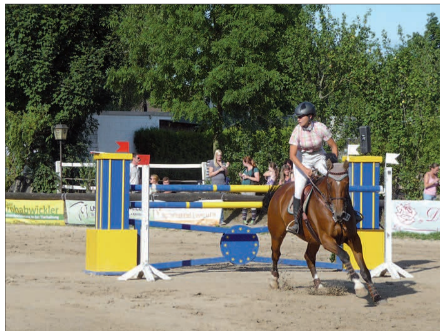
Beim Dressur- und Springreiterturnier in Lohausen messen sich die Besten aus der Region.

Der Verein ist sehr aktiv und erfolgreich in der Reitausbildung für Jung und Alt,