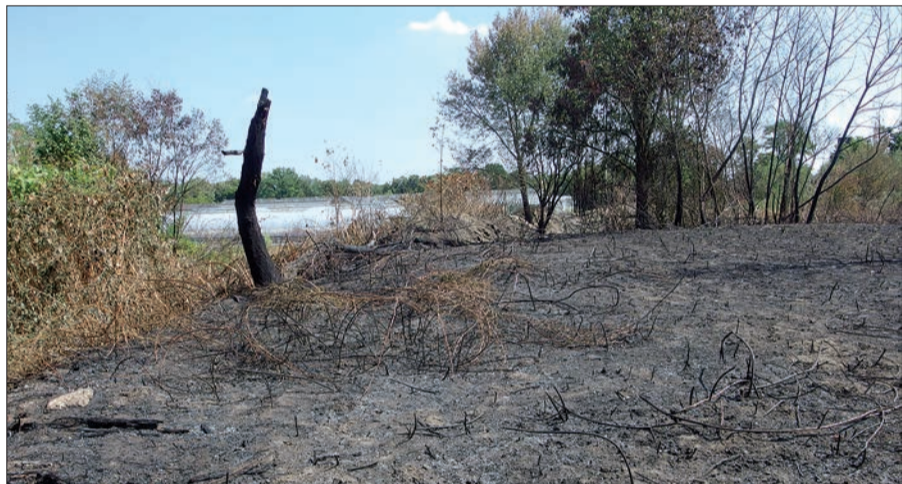
Brandfläche in Stockum nach einem Brand am 30. Juli.