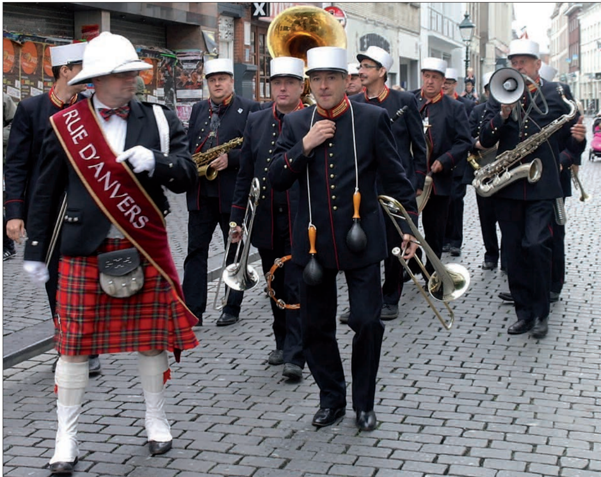
Zum ersten Mal ist die niederländische Marchingband „Rue d'Anvers“ zu Gast in Huckingen.

„Rue d'Anvers“ ist eine musikalische Band aus „Bergen op Zoom“ aus den Niederlanden. Ihr Bandleader ist ein alteingesessener Zerebrionmeister. Das Ziel der Band ist es, das Publikum und sich selbst mit „altem Jazz“ zu erfreuen, abgewechselt von spritzigen lateinamerikanischen Nummern. Dabei wird aber konsequent an den alten Jazz-Stücken festgehalten, die ihre Wurzeln am Mississippi und