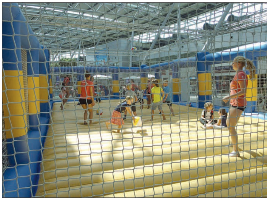
Jung und Alt hatten viel Spaß auf dem gut gesicherten und gepolsterten Beachvolleyballfeld mitten im Terminal.

und blauem Meer bis zum Horizont, aber doch ein angenehmer Vorgeschmack auf den Urlaub. Im Terminal waren Beachvolleyballfeld und Meereswellen aufgeblasenes Plastik, im klimatisierten Terminal aber angenehm und auch gefragt. Vor allem auf dem Beachvolleyballfeld tummelten sich Groß und Klein und hatten sehr viel Spaß (unser Foto). Darüber hinaus gab es natürlich die üblichen Kinderbelustigungen und -spiele, spezielle Angebote in der Gastronomie, günstiges Parken zum Pauschalpreis, kostenlose Kinderbetreuung, freien Eintritt auf der Zuschauerterrasse und nicht zuletzt, bei angenehmen Temperaturen, einen Bummel durch die Airport-Arkaden und über den Reise-