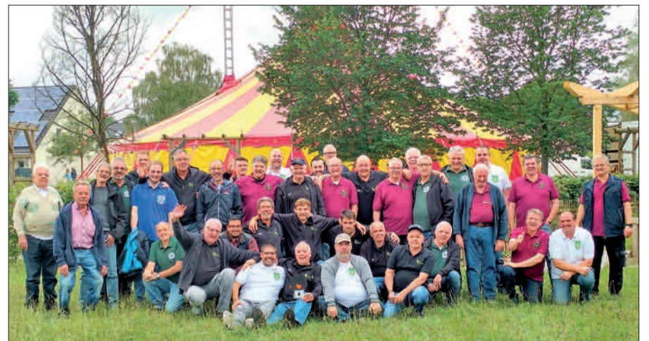
Alle Offiziere aus dem Jahr 2018 stellten sich in Rahm zum Gruppenfoto auf.