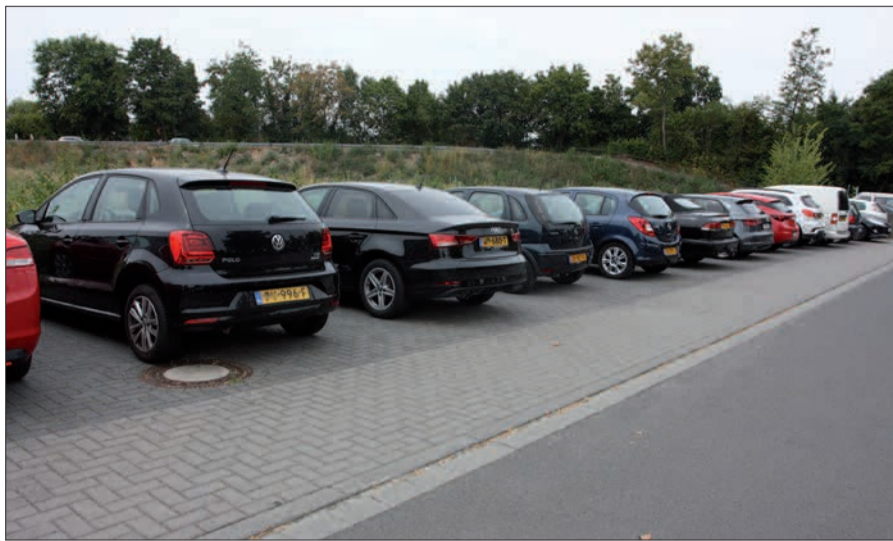
Dauerparker auf dem P & R Gelände des Angermunder S-Bahnhofs sorgen für Unmut, nicht nur unter den Parksuchenden, die auf den Platz angewiesen sind. Es sollte eine Regelung geben, die die Dauerparker mit Strafen belegt, fordern Anwohner.

nach 24 Stunden so minimal bewegt, dass es am Reifenprofil sichtbar ist. „Dagegen haben wir leider keine Handhabe“, bestätigt Udo Paehler. Pech für alle die Anwohner, die wochenlang Autos vor der Tür haben, und noch mehr Pech für die Parksuchenden, die auf dem P&R Platz in Angermund morgens nicht fündig werden. G.S.