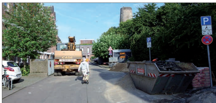
Die Sanierung der Fliednerstraße in Kaiserswerth hat bereits begonnen. Bis auf temporäre Ausnahmen bleibt aber eine enge Durchfahrt frei.

werden. Um das historische Ambiente von Kaiserswerth aufzuwerten, werden zwei kleine Teilstücke der Fliednerstraße in Höhe Gernandusstraße und Treppe Auf dem Hohen Wall mit Naturstein gepflastert. H.S.