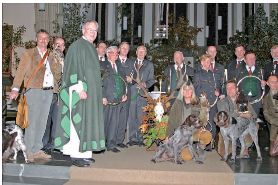
Regelmäßig gestaltet das Ensemble „Horrido“ die Hubertusmessen in der Umgebung mit. So wird es auch wieder in Mündelheim zu hören sein.