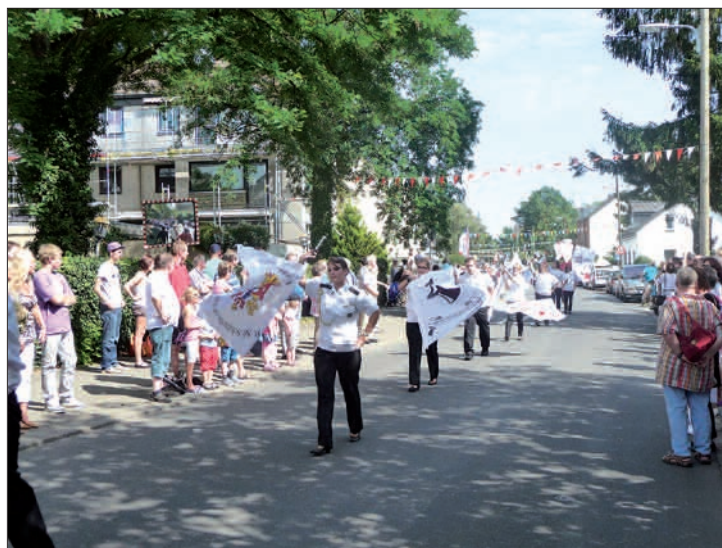
Die Fahnnenschwenker sind eine der Attraktionen im Festzug der Lohausen Schützen, aber auch bei anderen Veranstaltungen.