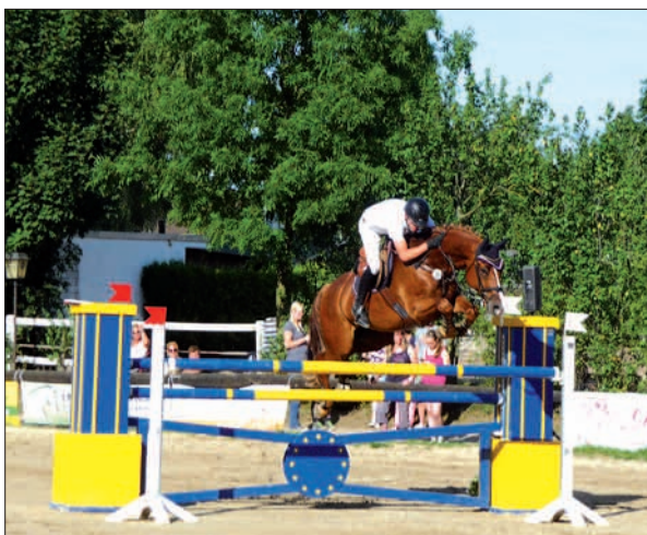
Beim jährlichen Dressur- und Springturnier des Reit- und Fahrvereins Lohausen e. V. geben Pferd und Reiter ihr Ganzes.

Müssen Sie hobeln, bohren, stechen? Erst mal mit dem Tischler sprechen!