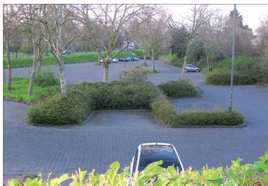
Zustand des Dreiecksparkplatzes nach der Reinigung durch die Mitglieder der Arbeitsgemeinschaft UNSER.KAISERSWERTH.