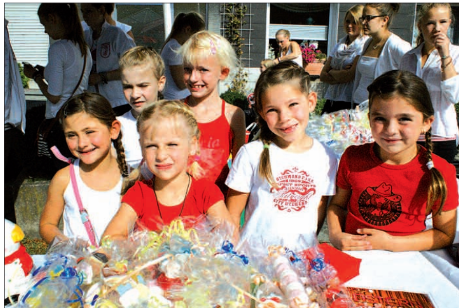
Selbst hergestellte Süßigkeiten verkauften die jungen Mitglieder der Tanzgarde.