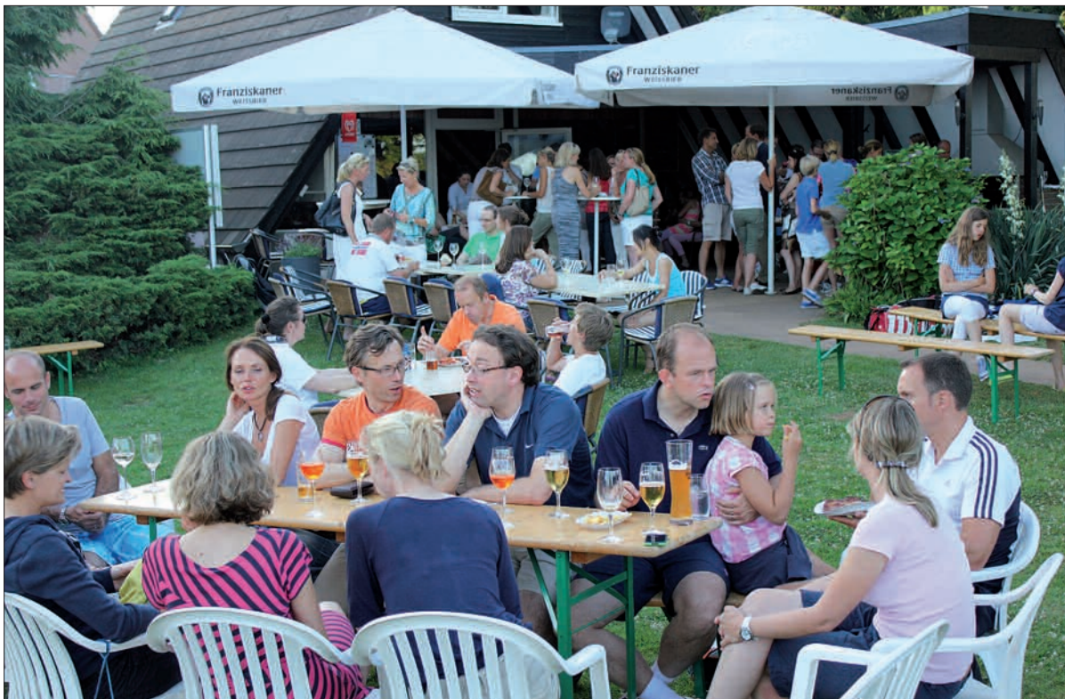
Familienfreundlich ist der Angermunder Tennisclub ohnehin. Dass auch die Nachwuchsförderung ganz zuoberst auf der Liste der Prioritäten ist, versteht sich von selbst.

Auch die Mixed-Meisterschaften beginnen bald, nämlich schon am Wochenende des 22. bis 24. August. Bis zum 20. August sollten sich alle angemeldet haben, die mitmachen möchten. Die vergangenen Jahre haben gezeigt, dass Mitmachen sich lohnt. Gute Stim-