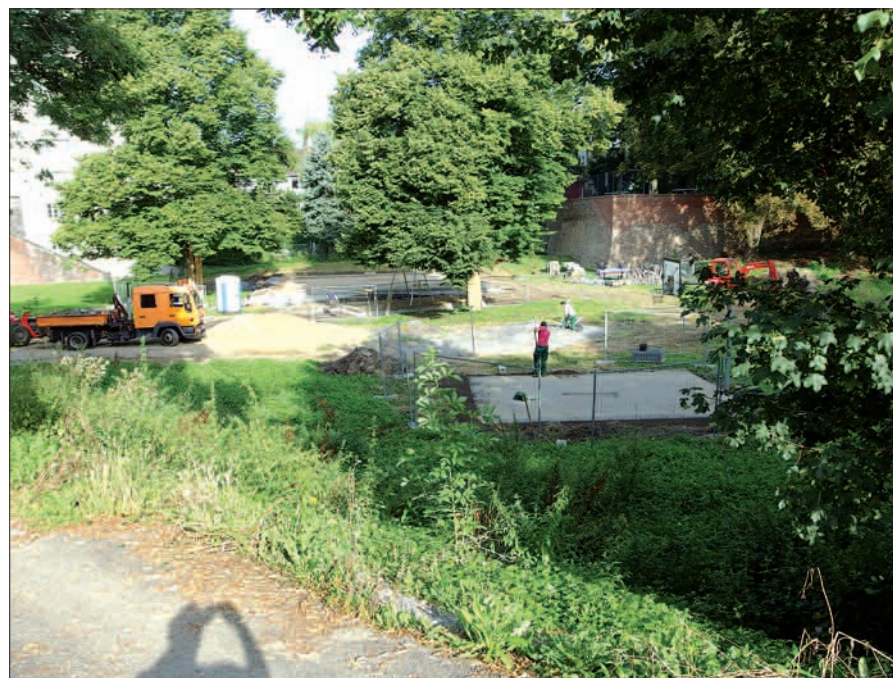
Die Auszubildenden des Garten-, Friedhofs- und Forstamtes haben die Erneuerung des Kinderspielplatzes unterhalb der Klemensbrücke übernommen.