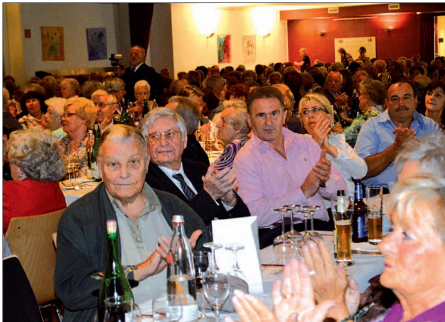
Das Weinfest im Steinhof ist ein beliebter Treffpunkt – nicht nur für die Huckinger.