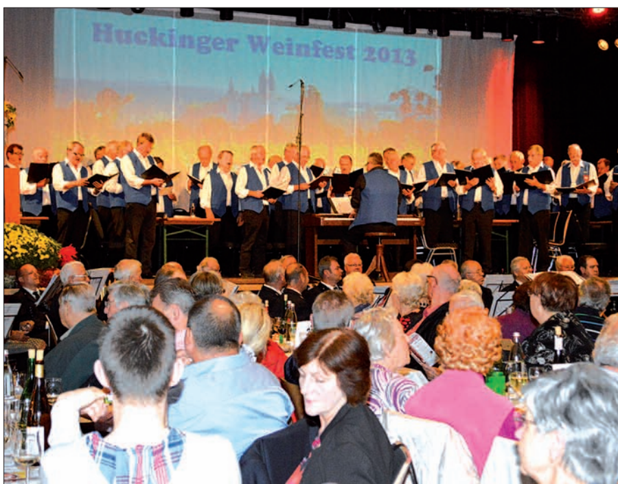
Mit Liedern und Prosa rund um den Wein verwöhnen die Sänger traditionell ihr Publikum. Karten sind ab sofort erhältlich. Text u. Fotos: sam