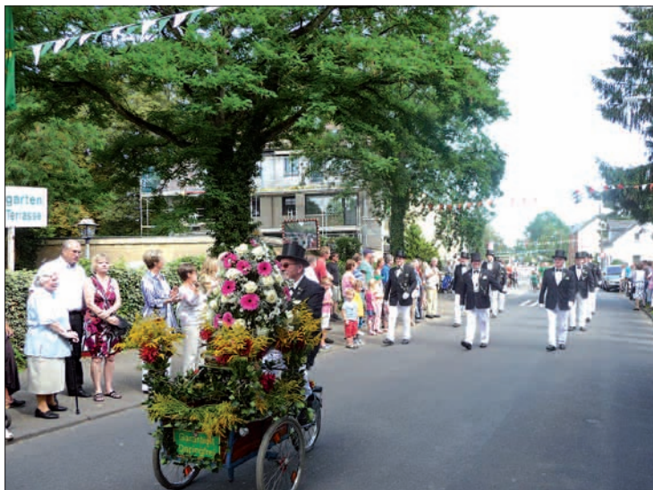
Mit Blumenschmuck voraus marschiert die Stammkompanie im Festzug zur Parade vor dem Landgasthof „Im kühlen Grund“.

Stadtwerke. Mit einer Schlagerparty ab Mitternacht klingt das Lohausen Schützenfest 2014 schließlich aus. H.S.