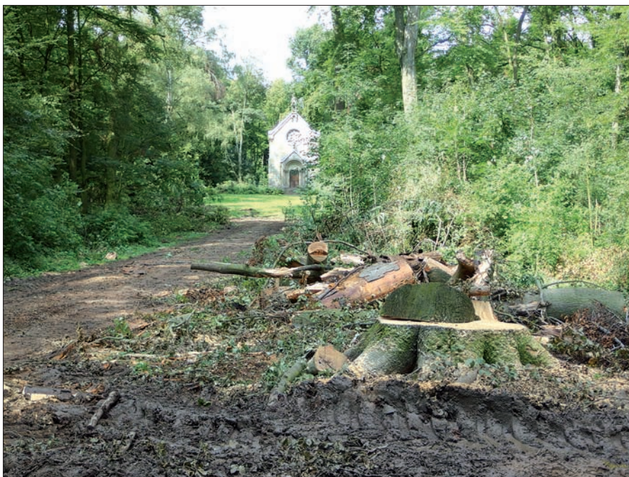
Orkan „Ela“ hat zwar grässliche Schneisen in den Lantz'schen Park gerissen, aber die Kapelle blieb unbeschädigt.