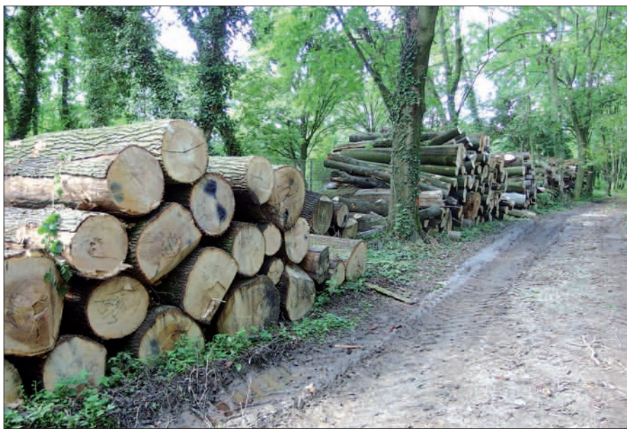
Lager der teils riesigen, alten Baumstämme, die Orkan „Ela“ im Lantz'schen Park umstürzen ließ. Bis zum Parkfest am 7. Sept. wird der Park wieder zugänglich sein.