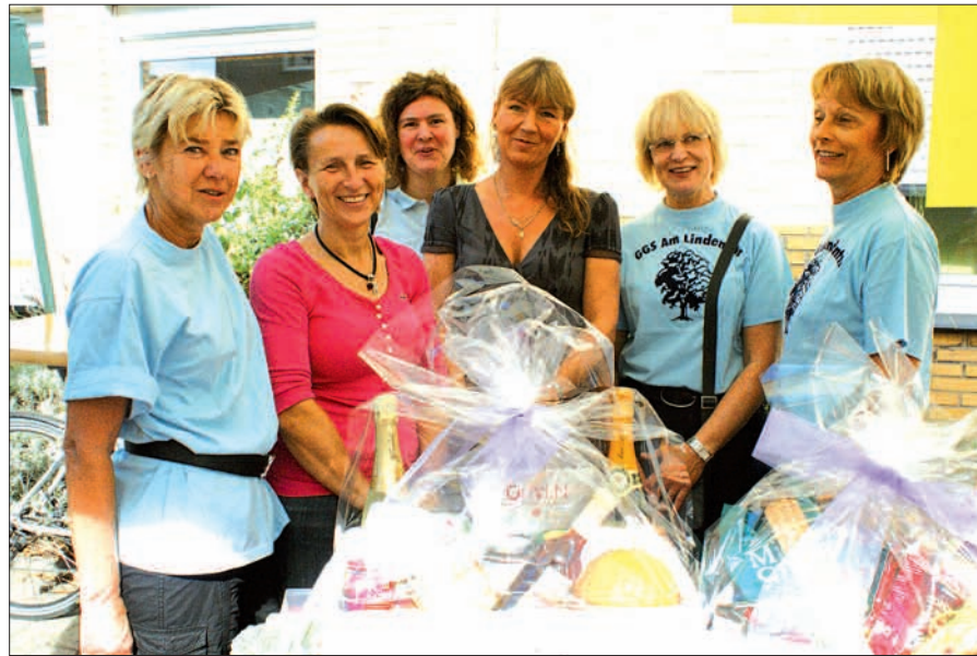
Die Eltern der Grundschule am Lindentor hatten sowohl für die jüngeren als auch für die älteren Besucher etwas vorbereitet.