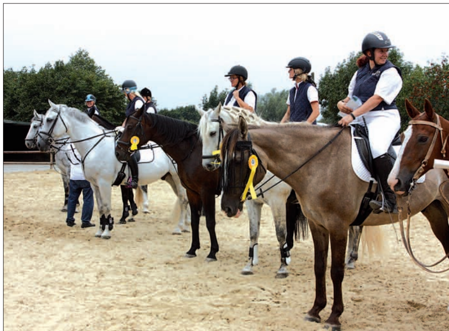
Viel los wird am letzten August Wochenende sein, wenn der Brokerhof in Angermund erneut Schauplatz der leicht abgespeckten, aber nicht minder attraktiven Reiterspiele sein wird.

Am Sonntag, den 24. August, geht es ab 9 Uhr mit den Prüfungen in der E-Dressur weiter. Es folgen der einfache Reiterwettbewerb (10 Uhr), der Geschicklichkeitswettbewerb WB mit Springen (12 Uhr), das Offene Ringstechen Einzeln (14 Uhr), das Offene Kappenrennen Einzeln (15 Uhr) und das Offene Tonnenrennen Einzeln (15.30 Uhr). Die Offene Geschicklichkeitsprüfung mit Pferd um 16.30 Uhr schließt die Reiterspiele auf dem Brokerhof in Angermund ab. Gute Laune, zünftige Verköstigung und frohe Gäste tun ein Übriges, die Wettbewerbe zu einem erfolgreichen Wochenende werden zu lassen. G.S.