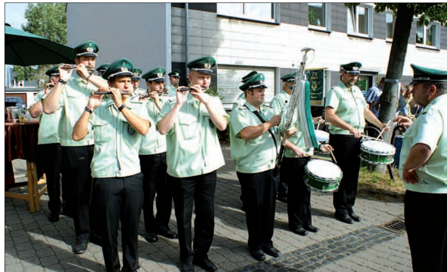
Das Tambourcorps Serm stimmte die Besucher gleich zu Beginn des Kappesmarktes auf einen netten Tag bei strahlendem Sonnenschein ein.