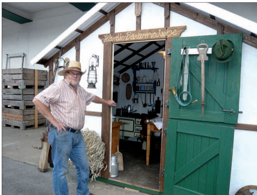
Hardis Bauernstube gibt es auf dem Historischen Erntefest zu bewundern.