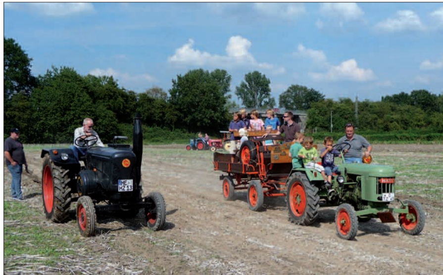
Auf freiem Feld gibt es nichts, was man rammen könnte, deswegen darf auch schon mal ein kleiner Knirps ans Lenkrad eines großen Schleppers.

te, dass gerade Kinder sich ein Bild davon machen“, betont der Schreinermeister aus Angermund. Das schmale und kurze Bett hat er selbst gefertigt. „Früher waren die Menschen kleiner und schmäler, da haben sie hervorragend gepasst“, fügt er hinzu. Neben dem Bauernstübchen gibt es noch jede Menge anderer Sehenswürdigkeiten und Aktionen auf dem Erntefest: Alte Landmaschinen und Traktoren, frisch gebackenes Brot aus dem Backhaus und eine Kinderbackstube. Der Ackerepress für die Kleinsten und der Tanz auf dem Acker am 11. August ab 20 Uhr dürften alle Generationen bedienen. Historisches Erntefest in Angermund, 11. und 12. August ab 11 Uhr, Eintritt ist frei, Im Kalkumer Feld an der B8n. G.S.