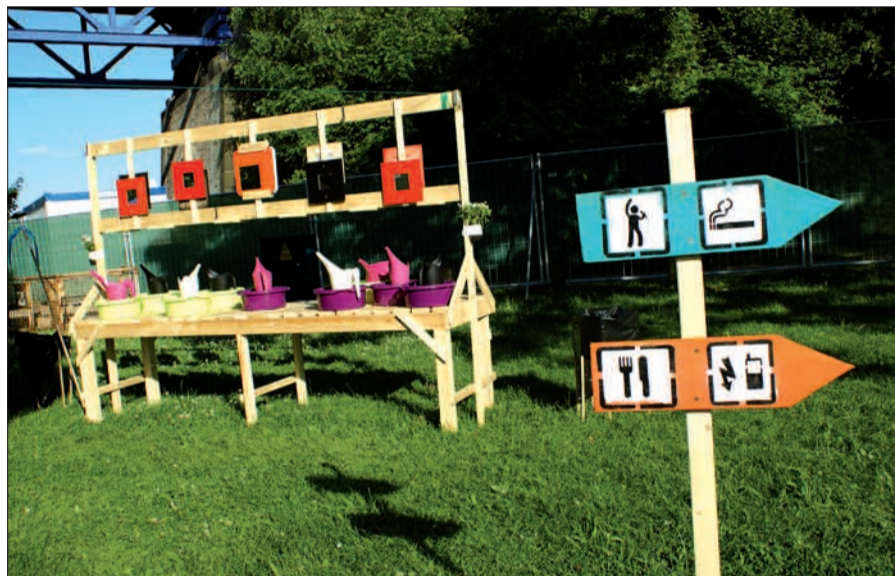
Mehr als 100 Jugendliche und Betreuer aus sechs Ländern zelteten auf der Mühlenweide. Phantasievolle Waschbecken hatte eine Campgruppe im Vorfeld gestaltet.