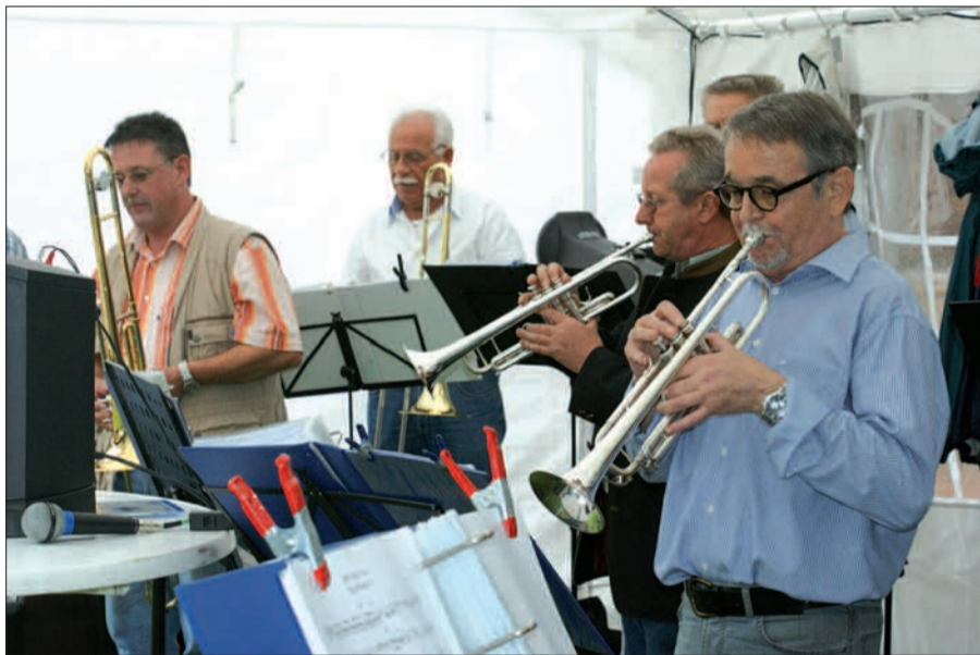
Mit bekannten Melodien animierte die „MGS Brass Band“ die Gäste des Gemeindefestes in Ungelsheim zum Mitsingen.