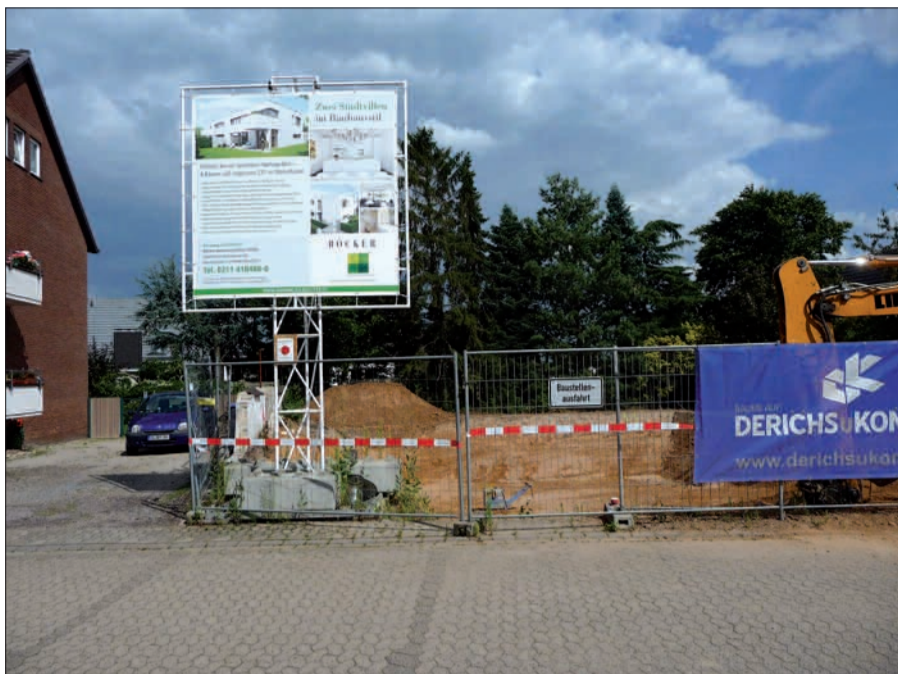
Baugrundstück in Zeppenheim, auf dem statt einem Einfamilienhaus zwei exklusive Villen entstehen.

Bauland ist im Düsseldorf-Norden sehr gefragt, Grundstücke und Wohnimmobilien erreichen immer höhere Preise. Jede denkbare Baulücke wird für Neu- und Erweiterungsbauten genutzt. Oft werden ältere Gebäude abgerissen und zwecks Verdichtung und Modernisierung durch einen Neubau ersetzt. Nicht alle Bauprojekte werden durch Vorlage in der Bezirksvertretung öffentlich, dort wird nur über Bauvorhaben auf Grundstücken über 1000 qm beschlossen. Die Errichtung von 4 Eigentumswohnungen an der Alten Landstraße, direkt neben der U 79 Haltestelle, Richtung Klemensplatz, wird dort somit nicht beraten. Auf einem vergleichsweise kleinen, dreieckigen Grundstück werden 4 Eigentumswohnungen errichtet. Es ist dort ausreichend „Luft“, denn nach Süden angrenzend befindet sich der große, plattierte Vorplatz der Haltestelle. Mancher Bauantrag muss wegen Bedenken in Bezirksvertretung oder Bauverwaltung mehrere Anläufe machen, gelegentlich wird von den Bauwilligen auch das Verwaltungsgericht angerufen. Das Grundstück Arnheimer Straße 58 soll sowohl mit einem Vorder-, als auch mit einem Hinterhaus bebaut werden, was zu Erörte-