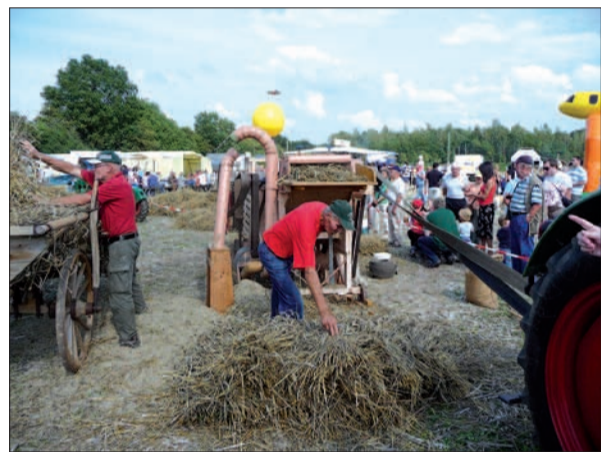
Eine historische Dreschmaschine erfordert viel Handarbeit bei der Getreideernte.