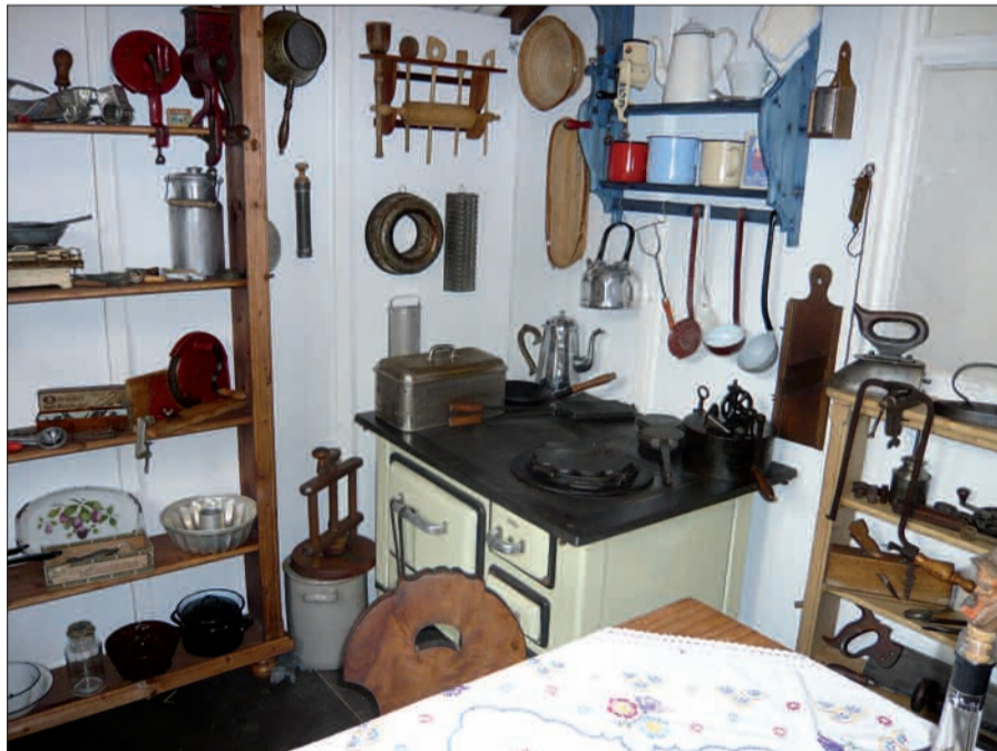
Ein Kleinod ist sie auch von innen.