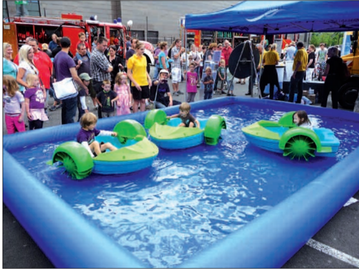
Ferienspass im Wasser.

auch in den Airport-Arkaden einkaufen, essen und trinken. Nur dafür brauchte man Geld. Alles andere war gratis. Die häufigste an diesem 5. August gestellt Frage dürfte gewesen sei: „Papa, wann gehen wir da wieder hin?“ An jedem ersten Sonntag im Monat ist „Air-lebnis-Sonntag“ im Terminal. Ob es immer so riesig ist, wissen wir nicht, aber auf jeden Fall kann man das Programm vorab im NORDBOTEN lesen. H.S.