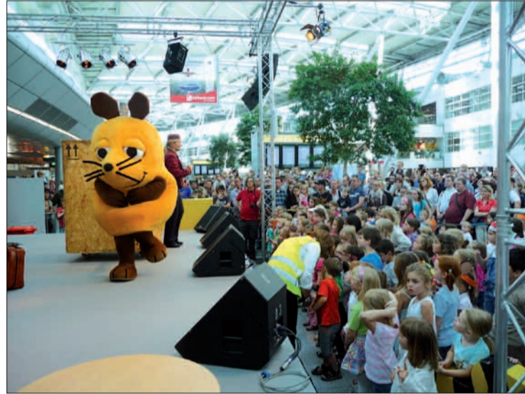
Großer Andrang und aufmerksame Zuschauer beim Gastspiel der Maus.