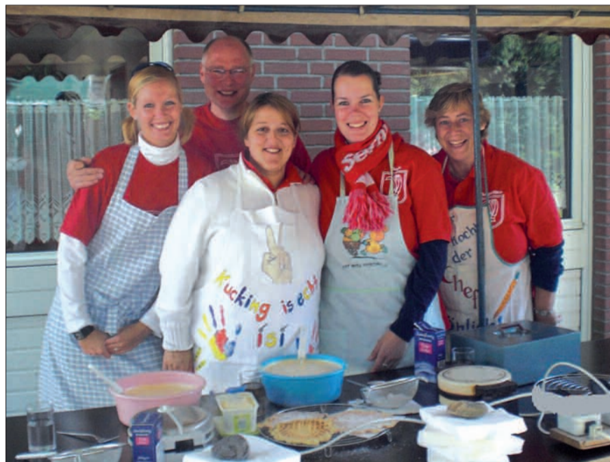
Wie in den Jahren zuvor werden auch in diesem Jahr wieder die fleißigen Waffelbäckerinnen der KG Südstern unermüdlich für frisches Gebäck sorgen.