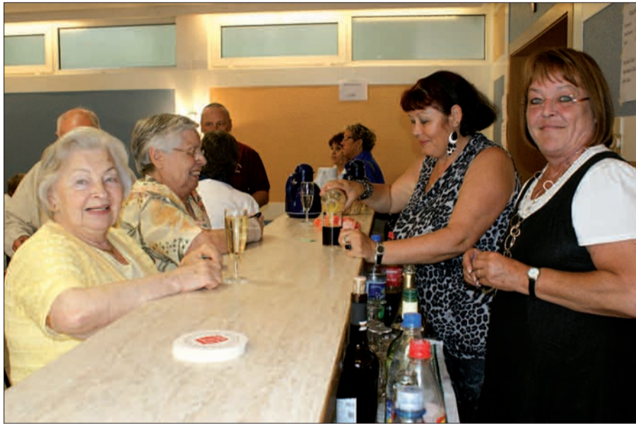
Im Gemeindesaal saßen und standen die Ungelsheimer, um die Gemeinschaft zu genießen.