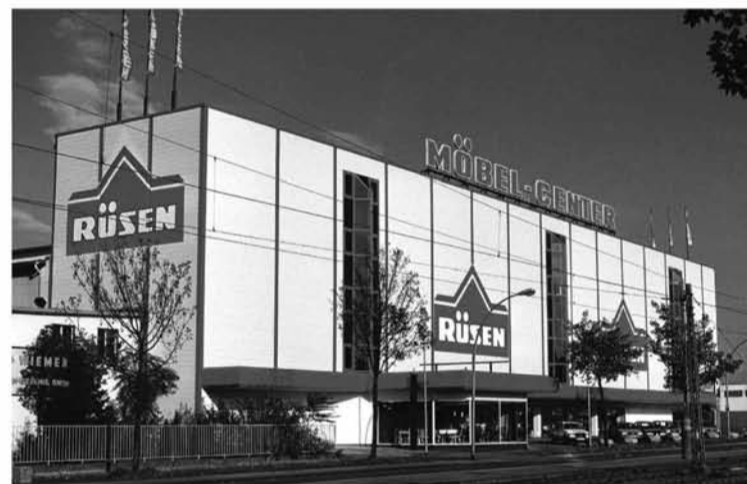
Rügen Möbel-Center, Obere Kaiserswerther-Str. 14, 47249 Duisburg-Wanheimerort