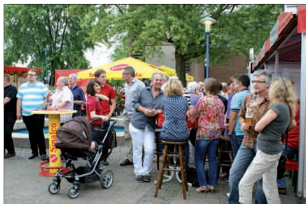
In ungezwungener Atmosphäre genossen es Bürger, Kommunalpolitiker und Verwaltungsmitarbeiter, miteinander zu feiern.