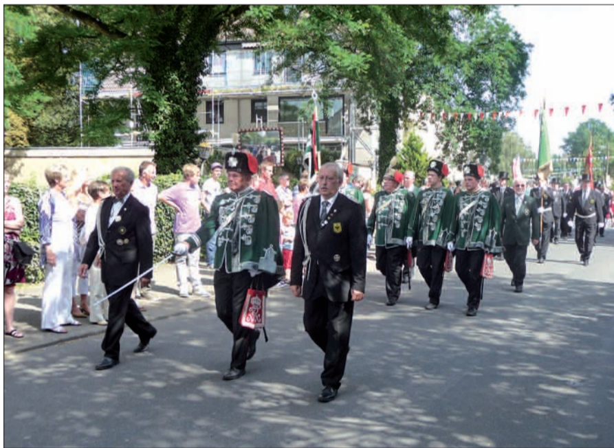
Schützen in prunkvoller Uniform im Marsch zur Parade.