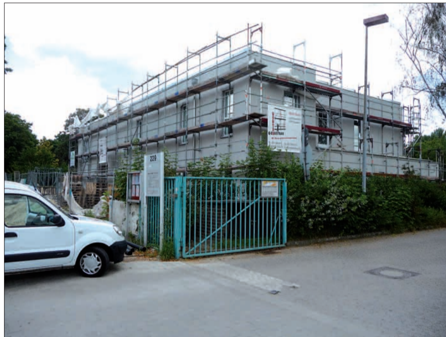
Die im September ihren Betrieb aufnehmende Kindertagesstätte „Rheinpiloten“ an der Niederrheinstraße 231.

Die noch im Bau befindliche neue Kindertagesstätte (KiTa) an der Niederrheinstraße 231 in Lohausen wird „Rheinpiloten“ heißen. Die echten erwachsenen Piloten werden nicht weit von den kleinen Piloten (6 Monate bis 6 Jahre) sein. Sie donern am Steuerknüppel ihrer Jets direkt über das Dach der KiTa und über den großen Garten. Eröffnung ist am 17. September mit zunächst 25 Kindern. Insgesamt ist die KiTa für 80 Kinder ausgelegt, davon 38 unter und 42 über 3 Jahren. Bauherr ist die „KiTa-Projekt-Verwaltungs UG“ in Lippstadt, Träger die „Kind und Beruf gemeinnützige GmbH“ in Stuttgart. Die Betreuungszeiten können fle-