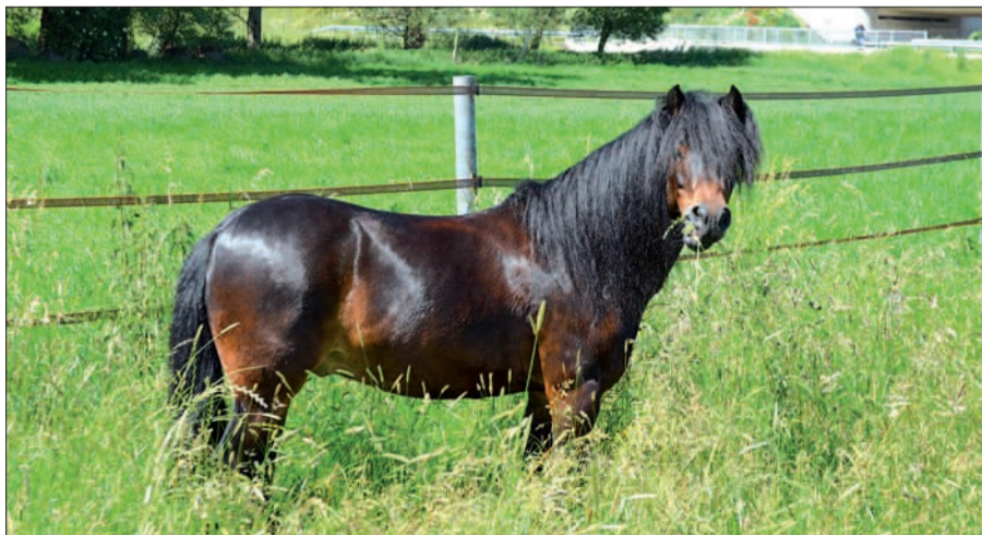
Das ist Snigger - ein Kandidat für das „Top Horse 2012“. Obwohl er erst sieben Jahre alt ist, läuft das Dartmoor Pony ganz routiniert im Schulbetrieb mit und nimmt vielen Kindern die Angst vorm Reiten.

heißt es bei der Vorstellung im Internet bei „Top Horse Of The Year 2012“. In der Kategorie Schulpferd kann man für Snigger, dem man nie lange böse sein kann, wenn er einen in die Augen schaut, abstimmen. Wer beim Voting die meisten Stimmen erhält, bekommt natürlich einen der vielen Preise. Aber auch derjenige, der seine Stimme bis Ende August abgibt, kann etwas gewinnen. Snigger kann man im Internet sehen, wenn man auf die Seite www.vorreiter-deutschland.de geht und bei „Top Horse 2012“ nach Snigger sucht.