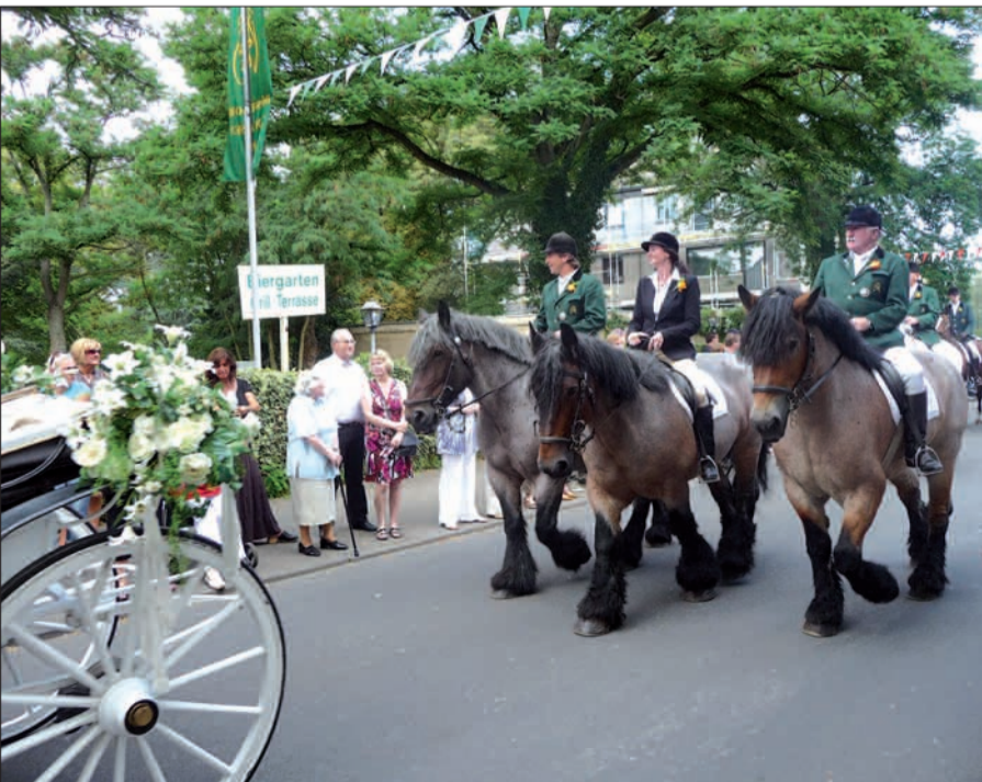
Im Dorf gehören Pferd und Reiter zum Festzug. Kaltblut war der „Traktor“ der Bauern bis in die Mitte des 20. Jahrhunderts.