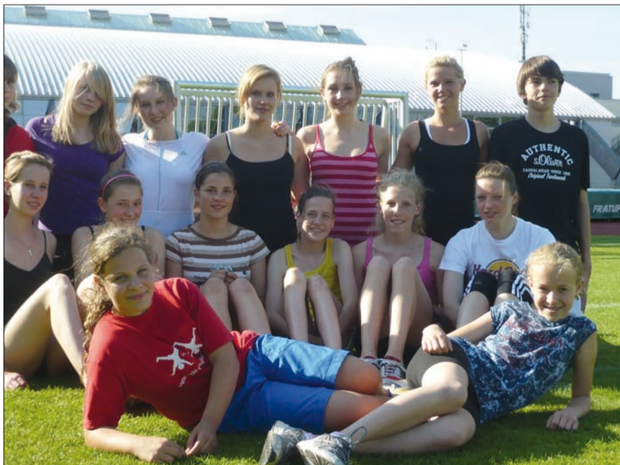
Die Leichtathleten im Juni beim Training vor der Esprit-Arena.

www.trocknungsservice-wks.de Gebäudethermografie Leckageortung Wasserschadentrocknung Bautrocknung, -beheizung info@trocknungsservice-wks.de Mobil: 0171-270 2437