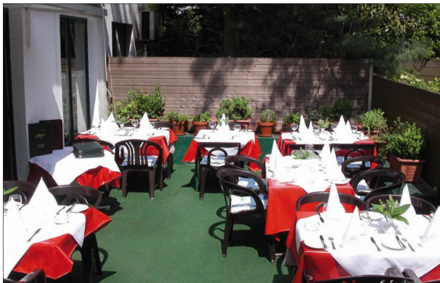
Außenterrassen gibt es bei „Sansone“ sowohl ruhig nach hinten als auch zur Niederrheinstraße.