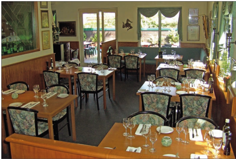
Klein aber fein, gemütliches italienisches Ambiente bietet Sansone in Kaiserswerth an der Niederrheinstraße. Es reicht aber auch durchaus für größere Familienfeste.