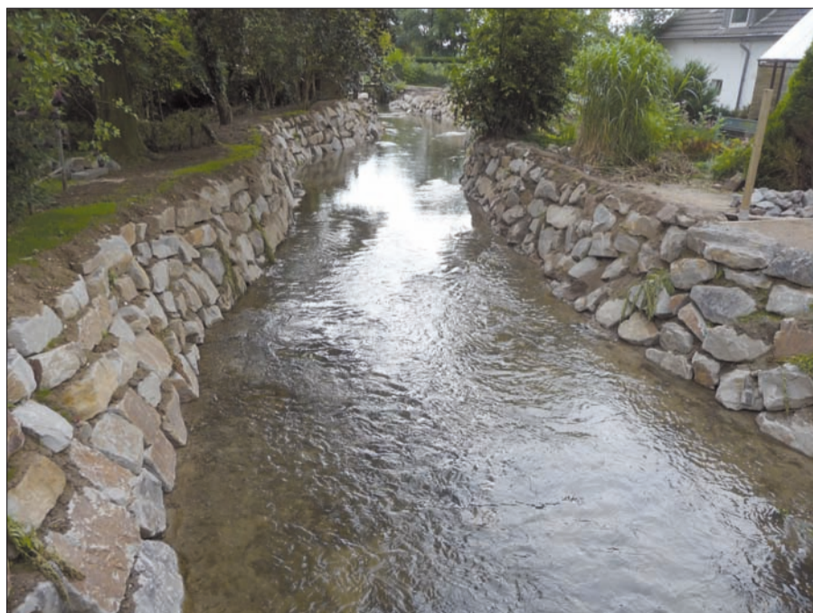
Die in Naturstein gefassten Ufer der Anger verändern das Stadtbild in Angermund, was durchweg positiv gesehen wird, ein Hauch von Gebirgsbach.