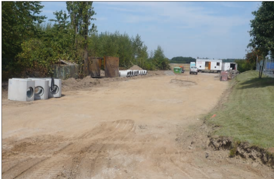
Direkt neben der Esso-Tankstelle am Ortsausgang von Angermund Richtung Kalkum wird die neue Lidl-Filiale entstehen.