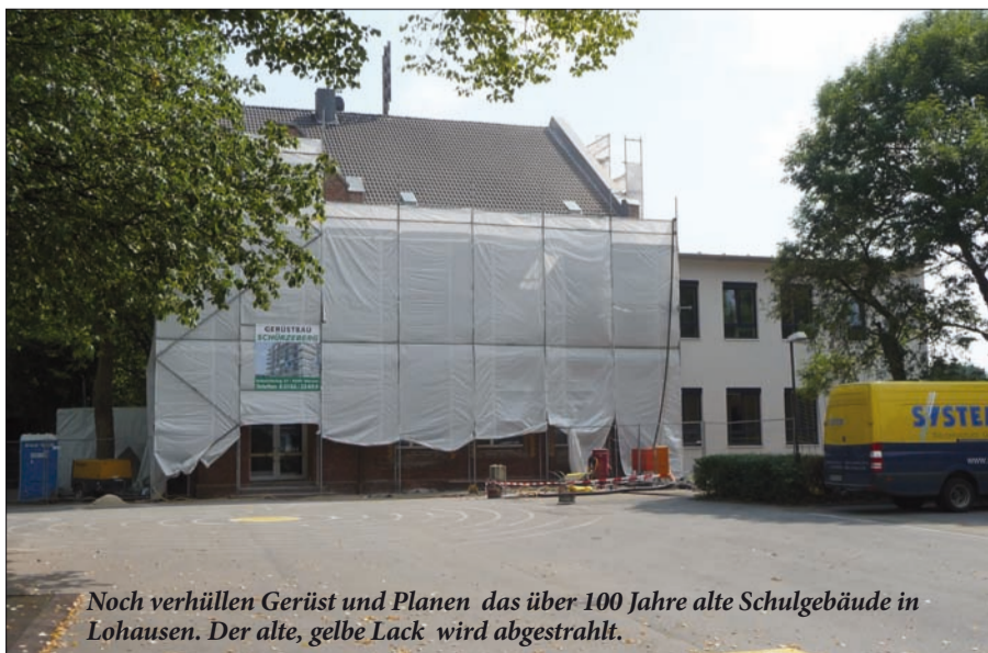
Noch verhüllen Gerüst und Planen das über 100 Jahre alte Schulgebäude in Lohausen. Der alte, gelbe Lack wird abgestrahlt.