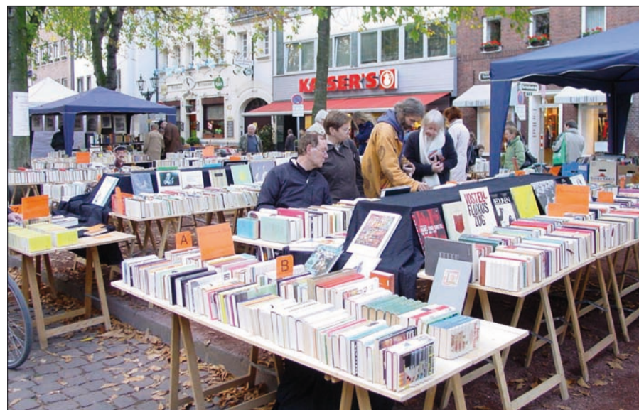
Stöbern und schmökern – der Kaiserswerther Büchermarkt lädt dazu ein.

Das Rahmenprogramm Kilowise Bücher – ein Kilo Buch gibt es in der Buchhandlung „Lesezeit“ für 6 Euro. Bücher schätzen – Samstag, 22.08., von 14-18 Uhr und Sonntag, 23.08., von 12-16 Uhr können die Besucher ihre alten Bücher kostenlos schätzen lassen. Lesung – Amore Amore, Lesung der Kaiserswerther Buchhandlung am Sonntag, 23. August, um 11.30 Uhr am Kaiserswerther Markt 34. Karten gibt's ab sofort für 10 Euro in der Buchhandlung 0211/409-2101.