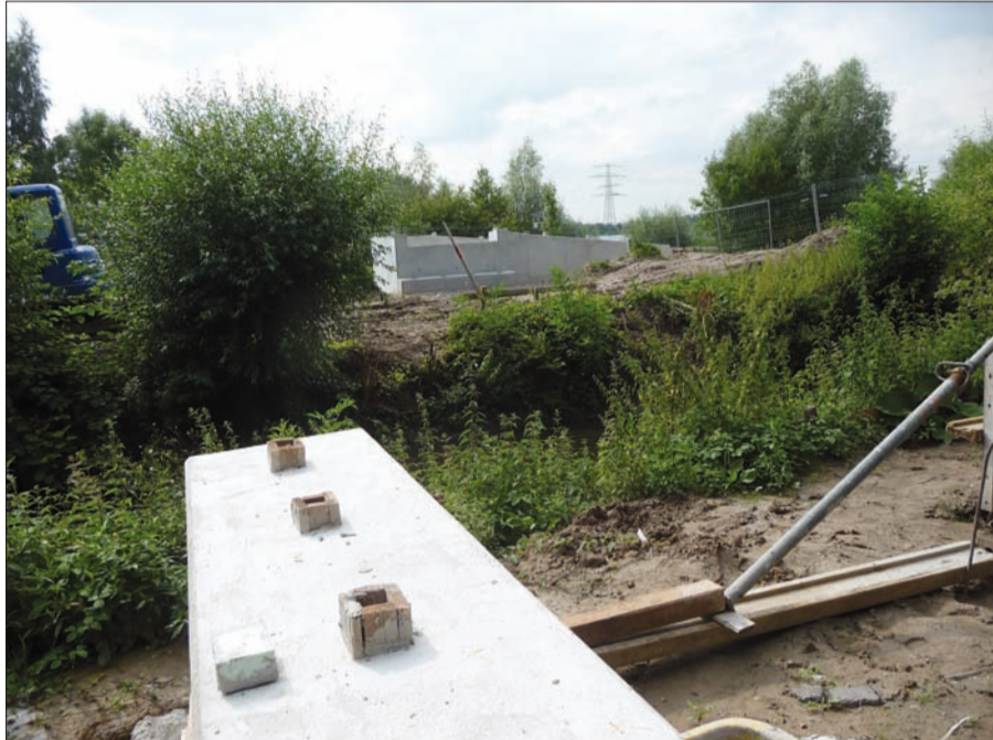
Betonfundamente für eine Brücke über die Anger am Angermunder Baggersee. Hoffentlich ist damit nicht wieder für lange Zeit Stillstand beim Ausbau zum Landschaftspark des durch die Auskiesung und durch Besucher stark strapazierten Umfeldes.

tungen auch nicht empfohlen werden. Sehr im Argen liegt noch das Südufer. Hier fehlen ordentliche Wegeverbindungen, was den dortigen Eichenwald sehr strapaziert. Die hohen Erdaufschüttungen schreien geradezu nach einer Rekultivierung und die Personen, die sich dort der Sonne aussetzen rufen nicht bei jedem Mann Begeisterung hervor.