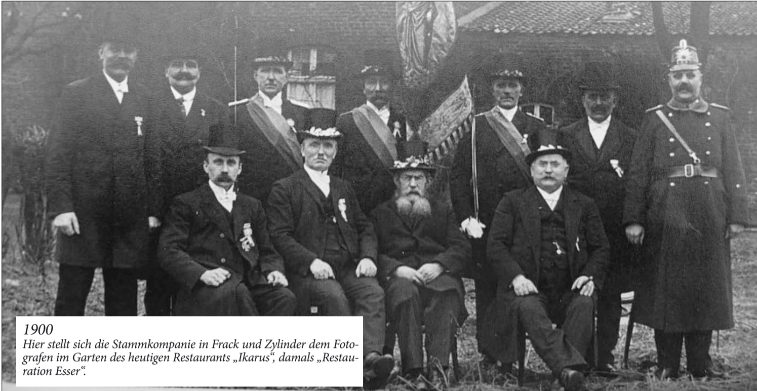
1900 Hier stellt sich die Stammkompanie in Frack und Zylinder dem Fotografen im Garten des heutigen Restaurants „Ikarus“, damals „Restauration Esser“.