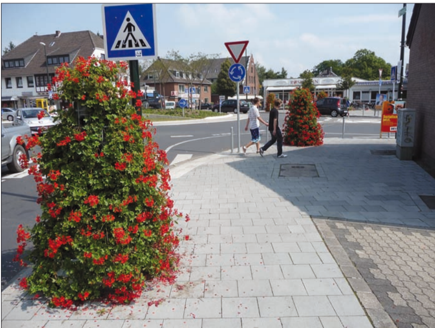
Auch wenn keine Kirschblüte ist, in Lohausen blüht es. Der neue Kreisverkehr ist angenommen und samt der blühenden Geranien ein Schmuckstück im Dorf. HS