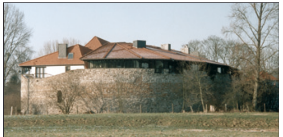
Die Burg (Kellnerie) in Angermund, eines der vom Institut für Denkmalschutz und Denkmalpflege betreuten Objekte im Düsseldorfer Norden.