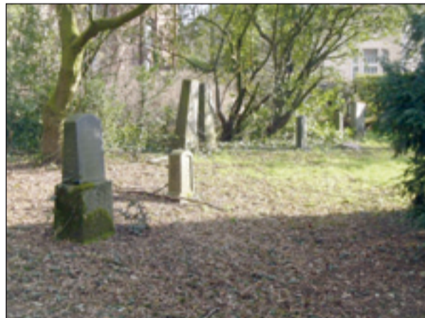
Etwas versteckt, aber erhalten und gepflegt: Der jüdische Friedhof in Kaiserswerth.