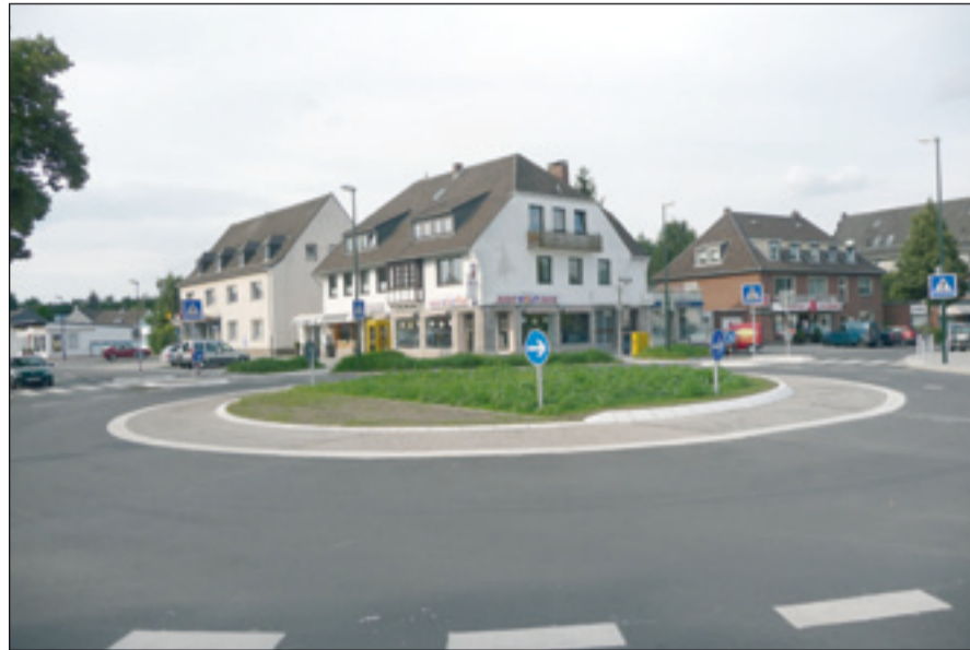
Mit der kleinsten, aber nicht kostengünstigsten, öffentlichen Grünanlage im Düsseldorfer, dem Innenkreis des Verkehrskreisels in Lohausen hat sich die Bezirksvertretung 5 ausführlich befasst. Auf unserem Foto hat Wildwuchs ihn noch fest in der Hand. Der weniger bewachsene Teil links ist befestigt, damit auch größere Lastzüge über die Kreuzung kommen.