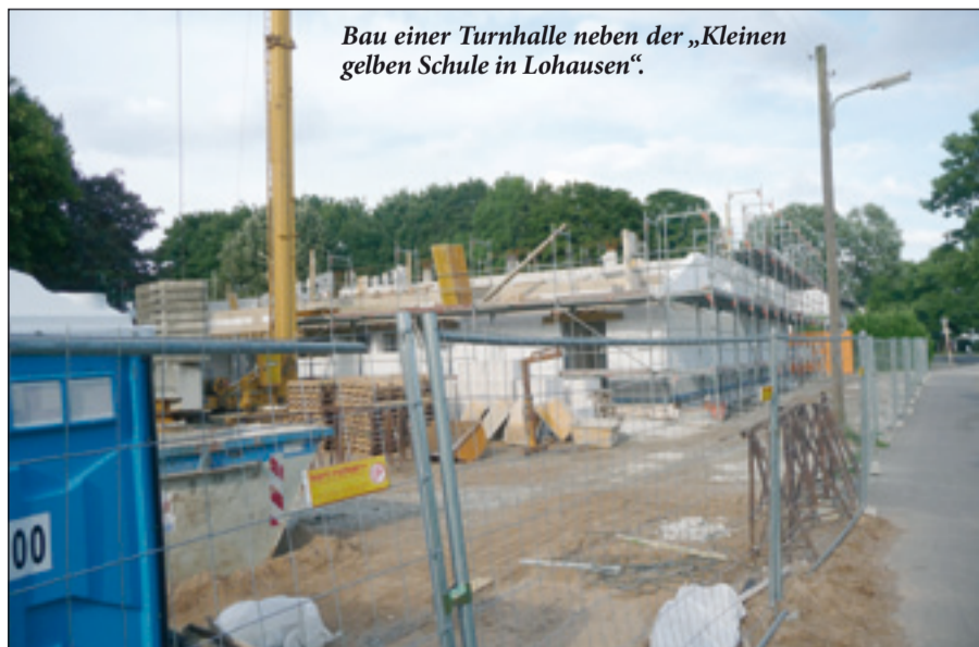
Bau einer Turnhalle neben der „Kleinen gelben Schule in Lohausen“.

zahlen. Der seit längerem bestehende Wunsch auf Beleuchtung des Fußweges vom Nagelsweg zu den Sportanlagen am Neusser Weg wird nun auch erfüllt. Die Erweiterung der „Kleinen gelben Schule“ im Grund ist schon weit fortgeschritten (unser Foto). Nicht nur die Kinder freuen sich sehr auf endlich eine eigene Turnhalle. Direkt neben dem alten, gelben Schulgebäude gähnt noch eine große Baugrube für weitere Schulräume (der Nordbote hatte über dieses Bauvorhaben schon ausführlich vorab berichtet). Nach dem Einschulungsgottesdienst am 13. August soll dort noch eine Grundsteinlegung stattfinden. Sehr verständlich, dass dieser große Gewinn für Lohausen und seine Kinder aus jedem Anlass gefeiert wird. Es fehlen nur noch Räume für eine Schulbibliothek.