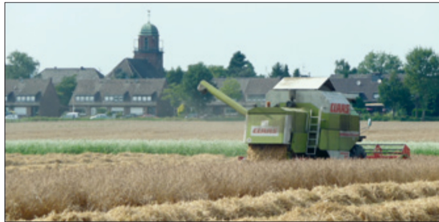
Mähdrescher im Ernteeinsatz südlich Serm.

feld von Serm immer noch von Ackerbau geprägt ist. Nutztierhaltung gibt es in Serm aber nicht mehr, nur noch nebenberuflich in Rheinheim.