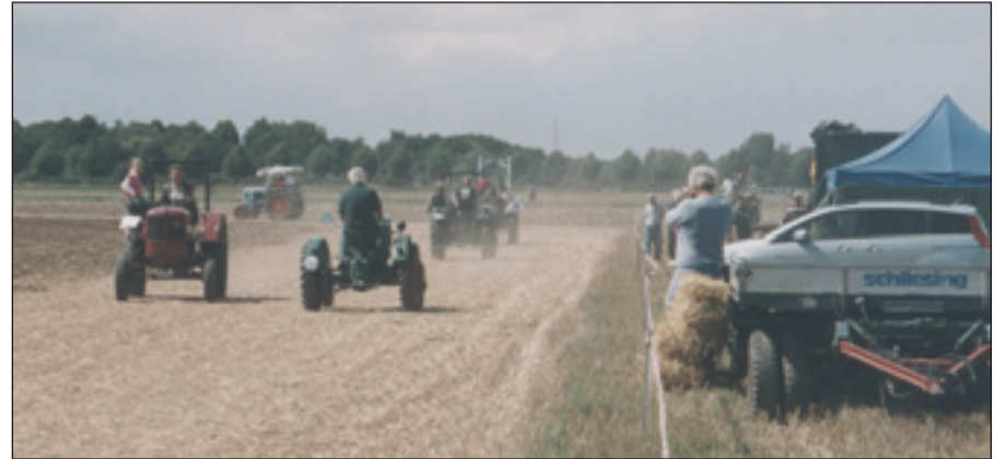
Gemütliche Treckerfahrten auf dem „Speedway“.