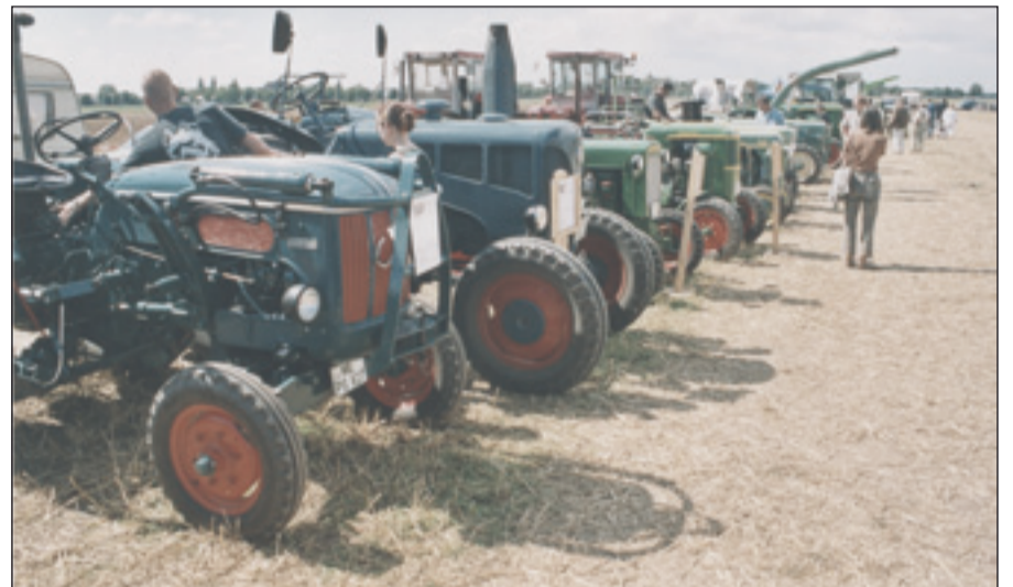
Treckerparade auf den Äckern zwischen Kalkum und Angermund (an der Viehstraße)