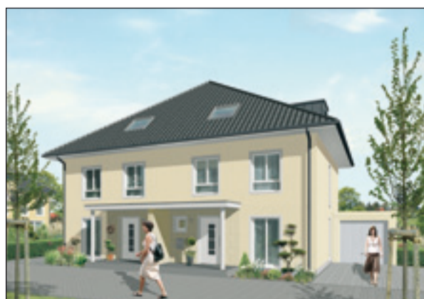
Foto: (privat) Fast mediterran hinsichtlich der Farben und Stilelemente muten die Häuser im Neubaugebiet auf dem Bilkrather Weg an. Text: Gabriele Schreckenberg

häusern machen's möglich. Drei bis fünf Häuser pro Hauszeile sollen für Auflockerung sorgen, hellgelbe Fassaden mit weißen Fensterrahmen und hellgrauen Einfassungen geben den Häusern eine stilvolle Note. Das preisgünstigste Haus hat 141 qm Wohnfläche, 240 qm Grundstück und kostet 271.000 Euro. Alle Häuser entstehen in Massivbauweise. Beratung vor Ort: Sonntags, 11-13 Uhr, Infotelefon: 0211-405 43 04, www.dornieden.com