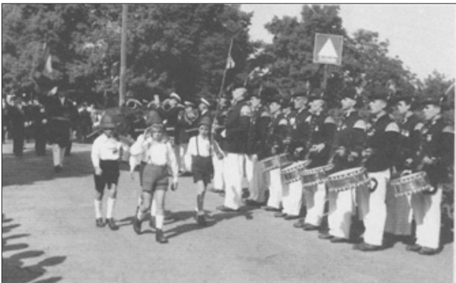
Foto (historisch): Kinder waren den Lohausern schon immer wichtig und in der Schützengemeinschaft dabei: Schützenzug 1949.