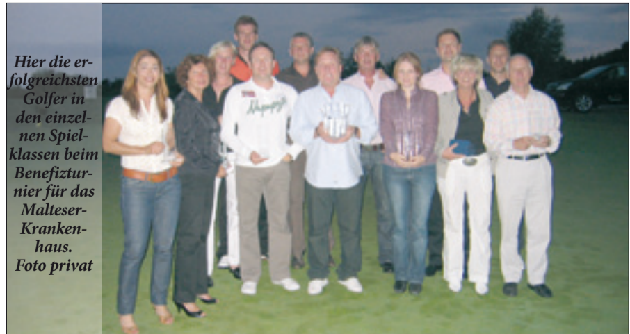
Hier die erfolgreichsten Golfer in den einzelnen Spielklassen beim Benefizturnier für das Malteser-Krankenhaus.