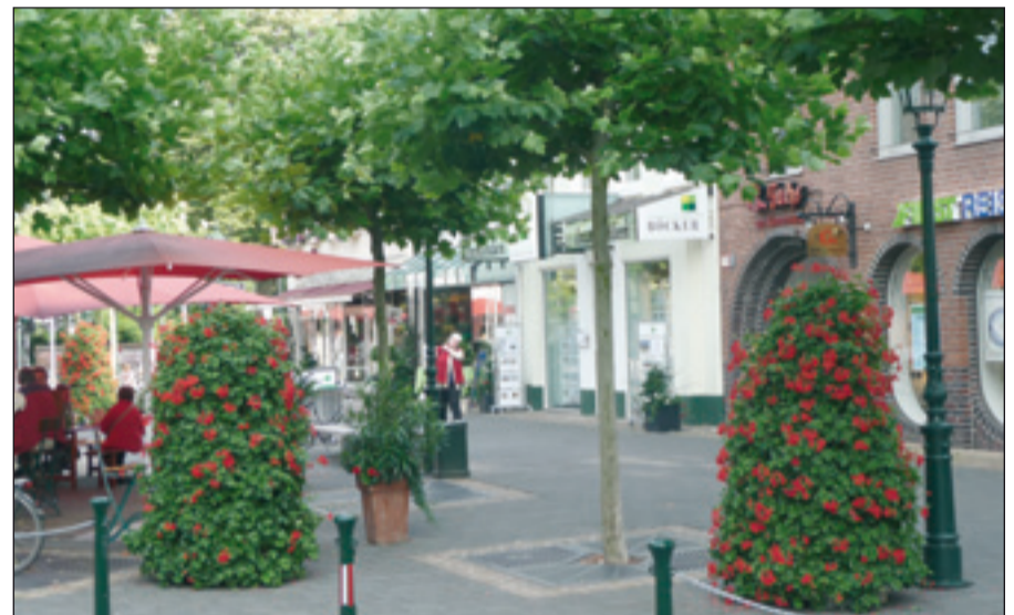
Leuchtend rote Geraniensäulen werten das liebenswerte Kaiserswerth im zweiten Wettbewerbsjahr der „Entente Florale“ auf. Hoffentlich wird das ein Dauerzustand.

Je näher es auf den 29. Juni zuzug, umso mehr blühte Kaiserswerth auf. Wunderschöne Geraniensäulen umranden den Klemensplatz, schattenverträgliche Blumenkübel werten den Mittelstreifen auf dem Markt auf. Schließendlich standen auch riesige, blühende Oleander auf der Uferpromenade. Die „Entente Florale“ hielt endlich auch in Kai-