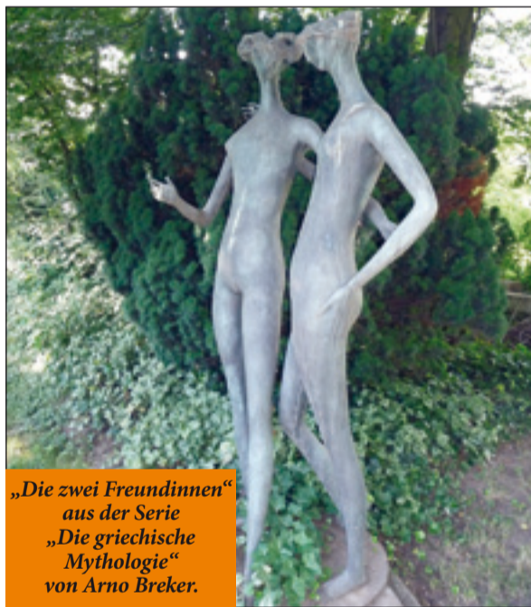
„Die zwei Freundinnen“ aus der Serie „Die griechische Mythologie“ von Arno Breker.