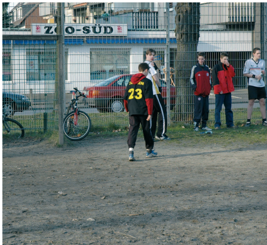
Huckinger Jugend auf ihrem Bolzplatz