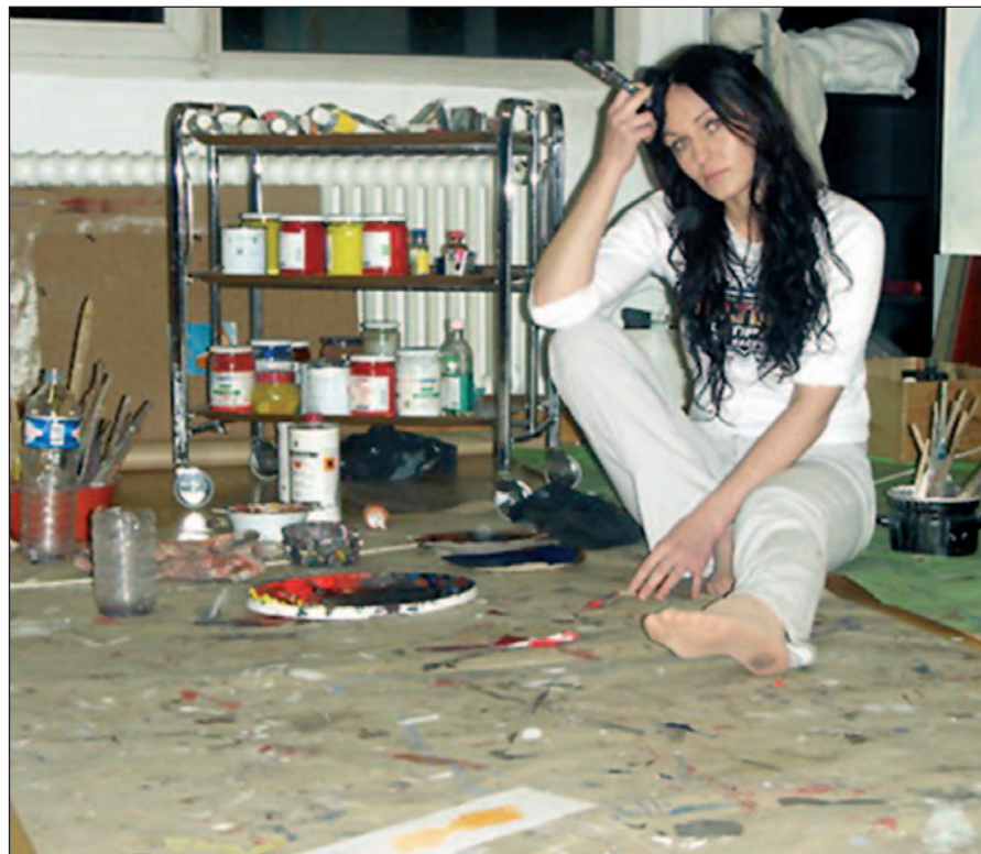
Life und in Farbe - so sieht der Alltag der jüngst ausgezeichneten Künstlerin im Atelier aus.