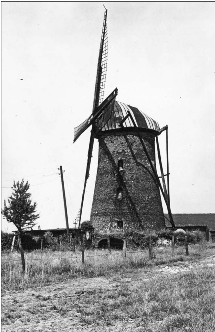
Die Sermer Windmühle um 1920