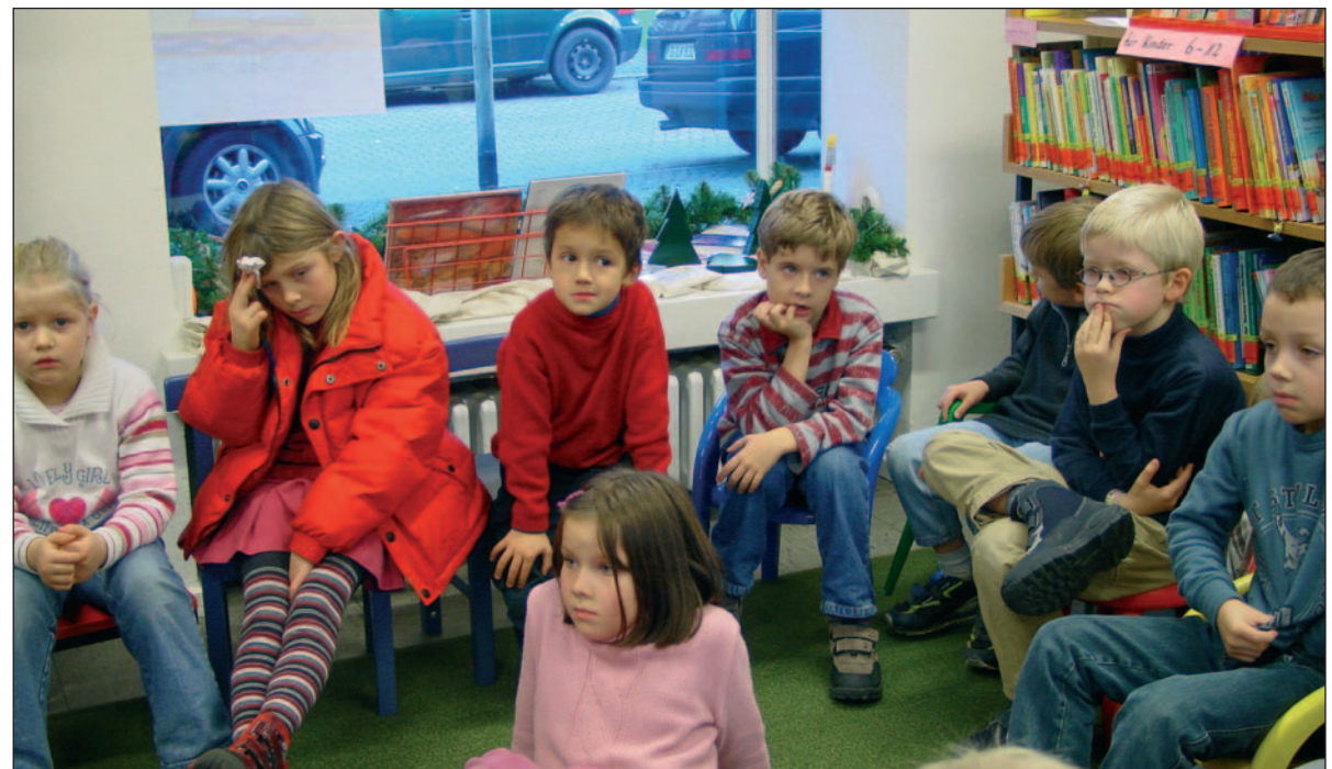
Aufmerksamkeit pur. Das wird die Aufgabe der Kirche in Zukunft sein, die Jugend für ihre lebendigen Inhalte zu begeistern.