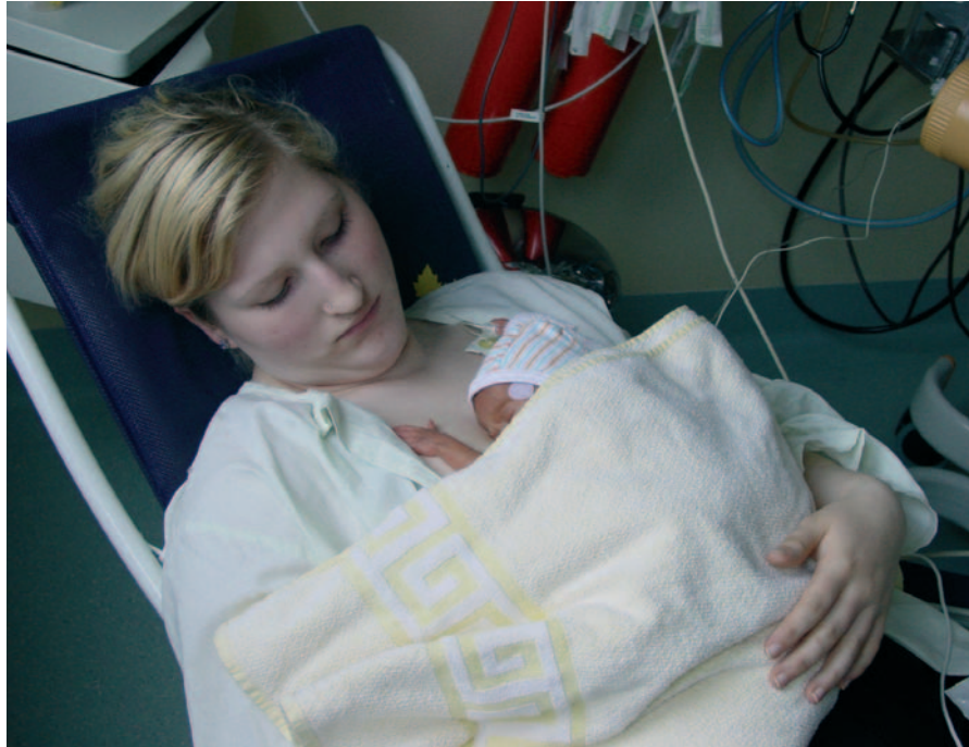
Die junge Mutter verbringt jetzt viel Zeit auf der Kinderintensivstation. Denn ihr Frühchen braucht viel Wärme und Zuwendung.

ler Technik zum einen und zeitintensiver Zuwendung zum anderen ist also da. Nach der Geburt zum Neonatologen - quer über den Flur „Wir sind glücklich über die Wand-an-Wand-Lö-