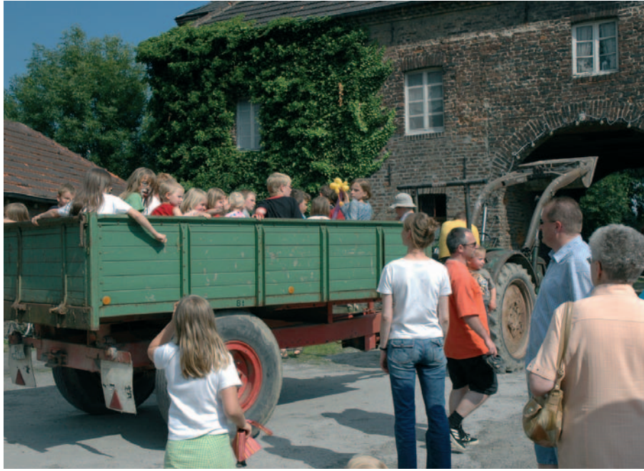
Besonders beliebt war der alte Trecker, der den Wagen mit den Kindern durch die Huckinger Feldmark zog.

Zum 14. Huckinger Burgfest lud der CDU Ortsverband Huckingen, Hüttenheim, Ungelsheim am ersten Ferienwochenende nach Haus Böckum ein. Rund 400 Besucher waren bei strahlendem Sonnenschein, diesem Aufruf gefolgt. Bei dem inzwischen traditionellen Burgfest stand auch dieses Mal jede Menge Kinderunterhaltung wie die beliebten Treckerfahrten, Reiten, Schminkefahrten, Reiten, Schminkestand und Hüpfburg auf dem Programm. Clown August wusste die Gäste mit seinen Späßen und dem fantasievollen Formen von Luftballons zum Lachen zu bringen. Für die musikalische Unterhaltung des bunten Familienfestes sorgte Mike's Party Express.