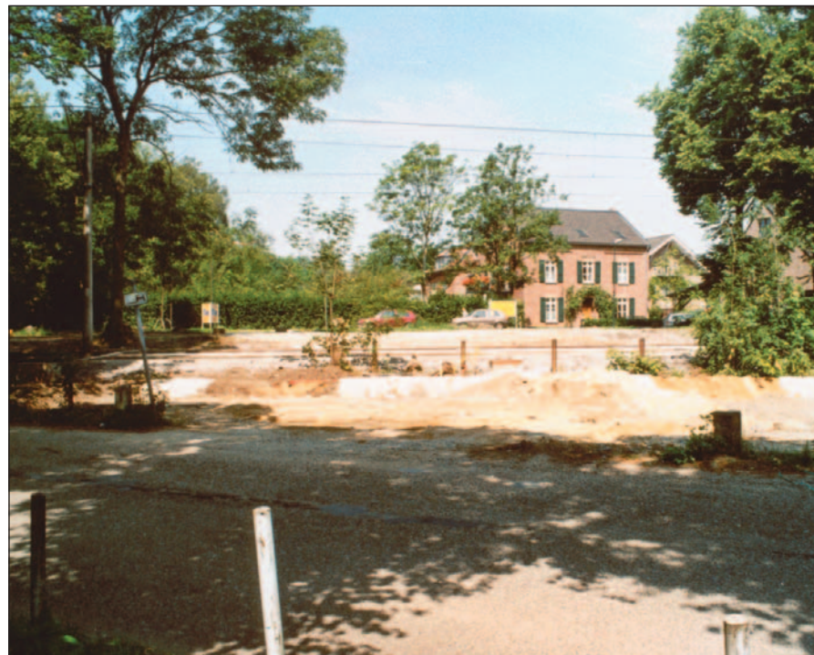
Die umfangreichen Bauarbeiten auf und um den Klemensplatz eröffnen auch neue Durchblicke: Hier von der Kreuzbergstrasse zum Gutshof.

TROSPERDELLE 3 02 03.93 57 08 80 47269 DUISBURG WWW.PHASE4-DESIGN.DE