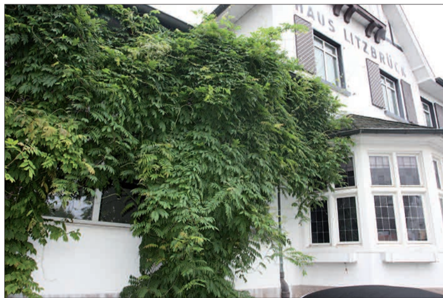
Haus Litzbrück liegt im Dornröschenschlaf. Und nicht nur die Angermunder sind gespannt, wie es weitergeht.

aus und sind mit Unkraut übersät. Der neue Eigentümer, die Salia Verwaltungs GmbH mit Sitz in Wesel, hat vor Monaten angedeutet, möglicherweise das Haus Litzbrück als Restaurant weiterzuführen. Thomas Hecker, der in der Unternehmensgruppe für Immobilien verantwortlich ist, hat das im März bestätigt. Noch scheint die Findungsphase zu laufen, auf Anfrage des NORD-BOTE haben wir am 30. Juni noch keine Antwort bekommen. Bleibt abzuwarten, wie lange das Efeu noch braucht, um das Dach hochzuranken. Und wann Dornröschen befreit wird. G.S.