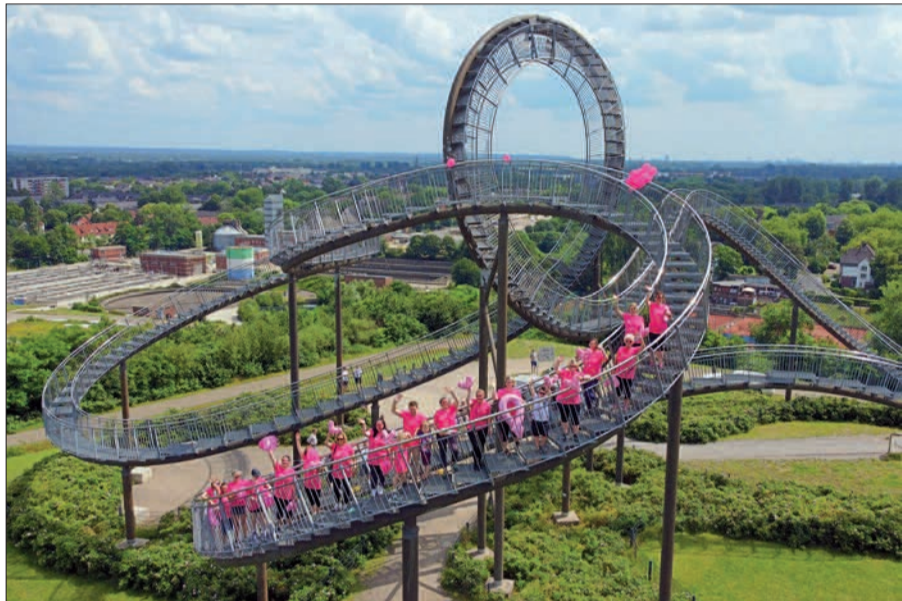
Mit ihren pinken Shirts machen die Kolleginnen der Helios St. Anna-Klinik jedes Jahr auf das Thema „Brustkrebs“ aufmerksam. In diesem Jahr hatten sie auf „Tiger & Turtle“ eine besonders schöne Kulisse.

Um das Bewusstsein für Brustkrebs zu erhöhen, laufen seit vielen Jahren Kolleginnen aus dem Brustzentrum der Helios St. Anna-Klinik in Huckingen in pinken Shirts beim Muddy Angel Run mit. Eigentlich - denn vergangenes und dieses Jahr machte Corona dem offiziellen Lauf einen Strich durch die Rechnung. Doch im Sport wie auch im Kampf gegen Krebs gilt: niemals aufgeben!