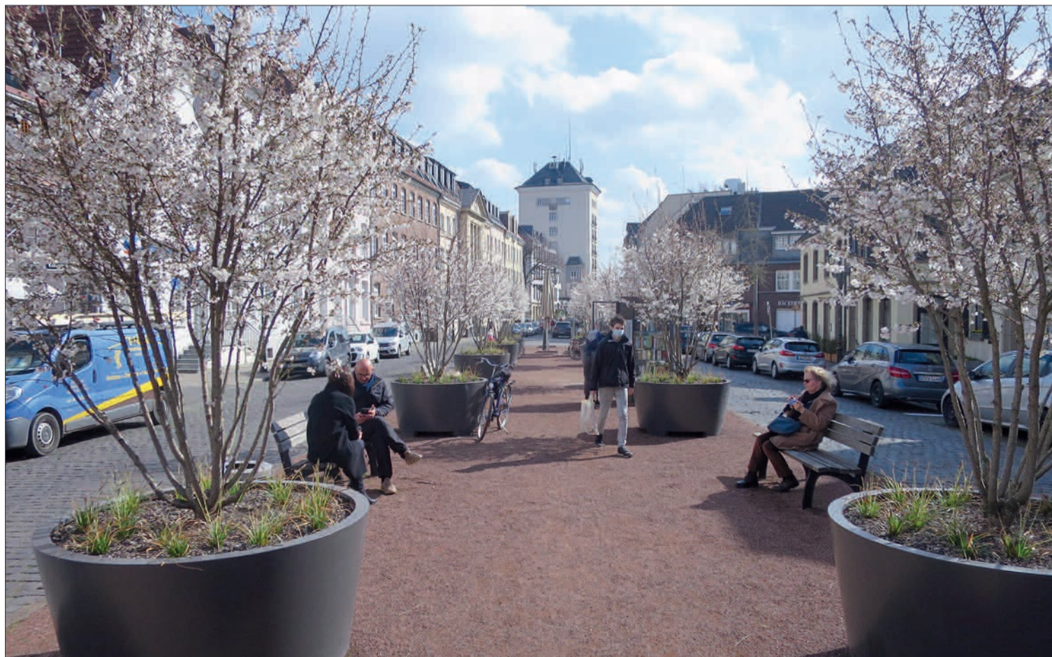
Der Kaiserswerther Markt im derzeitigen Zustand mit der Brautkirschen-Kübel-Allee als Klima-Test-Projekt.

malschutz, Allee, Bodendenkmal, Gaslaternen, parallel laufender Kanalbau) als nicht zielführend angesehen. Ein Landschaftsplanungsbüro war 2016 beteiligt. Dessen Arbeitsergebnisse würden in einem Architektenwettbewerb mit anschließender Beauftragung des Siegerbüros verlost gehen. Ein Antrag, vorab jetzt die Fahrbahnen auszubessern (fehlende, beschädigte und verkantete Pflastersteine), fand in einer Abstimmung keine Mehrheit. H.S.