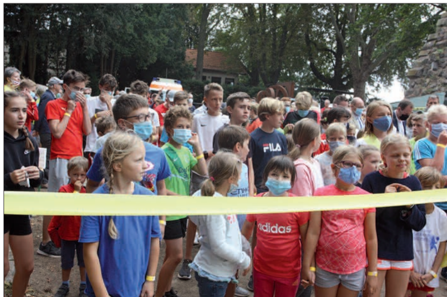
Auf die Plätze fertig los - am 29. August startet der 2. Hospizlauf in Kaiserswerth an der Kaiserpfalz.