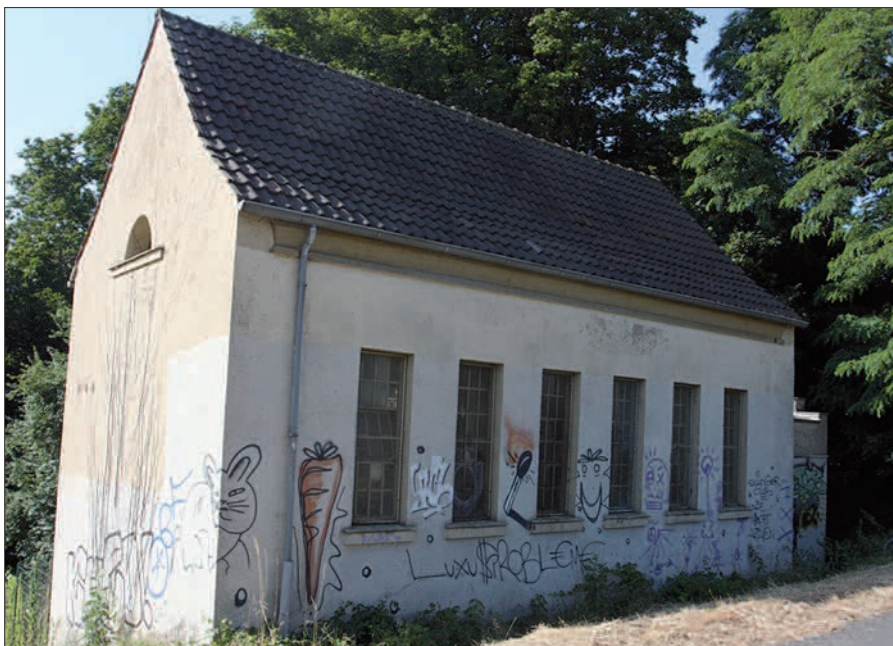
Einsam und alleine steht die alte Pumpstation am Herbert-Eulenberg-Weg, gleich gegenüber vom Rheinufer. G.S.

die CDU-Fraktion im Kaiserswerther Rathaus gespannt.