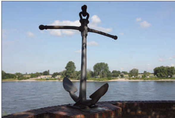
Ein herrlicher Platz ist es am Anker, und der darf auch von Menschen aller Couleur genutzt werden. Nur ohne Glasscherben und Randalere und Hinterlassenschaften.

Der Treffpunkt besteht nach wie vor und wird auch von zahlreichen Jugendlichen der benachbarten Schulen aufgesucht. Das ist völlig in Ordnung. Es ging einfach nur um nächtliche Ruhestörung und kräftige Randalere. Und das war nicht in Ordnung. So scheint nun der Betrieb in vernünftige Bahnen gelenkt. G.S.