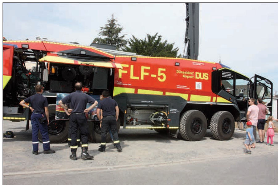
Top modern ist das Einsatzfahrzeug namens FLF-5, das nur auf dem Flughafen in Düsseldorf eingesetzt wird.