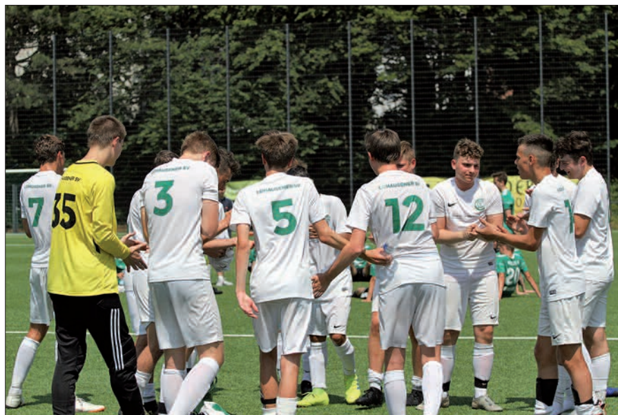
Nichts für spannende Nerven war das letzte Quali-Spiel der B-Junioren gegen den Polizei SV. Das LSV-Team siegte mit 2:1.

Etwas enttäuscht ist der LSV über die verpasste Qualifikation der D-Junioren. „Aber kein Vorwurf an das Team, denn im entscheidenden Spiel hatten wir beim Aufstieg perfekt zu machen“, so Eichwald. Die