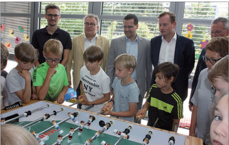
Großes Aufgebot bei der Einweihung des neuen Tischfußballs.