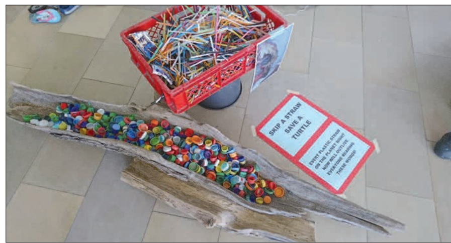
In mehreren Räumen der Grundschule waren Fundsachen aus dem Rhein zu sehen.

Einteilung, die ihren Nullpunkt an der Konstanzer Rheinbrücke hat. Anm. der Red.) Lustig und traurig zugleich Es gibt mehrere Arten von Müll am Rhein. Müll, den Menschen hinterlassen, wenn sie sich getroffen haben, zum Essen, zum Trinken, zum Picknicken. Und es gibt Müll, den der Rhein angespült hat. „Nun organisiere ich in regelmäßigen Abständen Aufräumaktionen am Rhein. Viele Kinder unserer Schule machen mit“, fügt sie hinzu. Und die Fundsachen sind skurril: Blech, Schuhe, Taschen, Kleidung, Plastikboxen, Schilder, alles Mögliche ist dabei. Die Montessori-Grundschule am Farnweg liegt nah am Rhein. Deshalb ist nicht nur die Lehrerin überzeugt, dass die Pädagogen einen klaren Auftrag haben. In den letzten Wochen war sie immer wieder mit ihren Viertklässlern am Rhein, um Müll zu sammeln. Dabei haben die Pen-