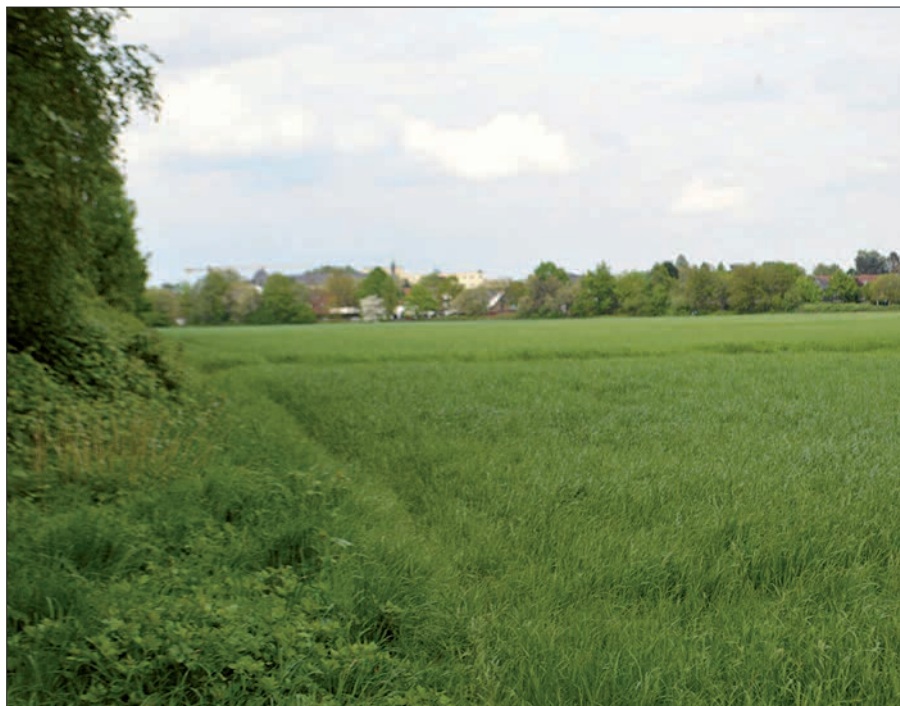
Bislang wird die Fläche „Alter Angerbach“ landwirtschaftlich genutzt. Im Herbst sollen die ersten Bagger anrücken.

Der Baubeginn soll im vierten Quartal dieses Jahres erfolgen. Der Abschluss der Arbeiten ist für 2024 vorgesehen. Die GEBAG führt die ihr übertragenen Aufgaben im eigenen Namen und auf eigene Rechnung aus. Die sich aus der Erschließung ergebenden Straßen, Wege, Park- und Erholungsflächen verbleiben langfristig bei der Stadt.