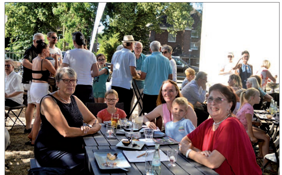
Unter den zahlreichen Besucher feierten auch viele treue Kunden den 1. Geburtstag im idyllischen Garten an der Anger.