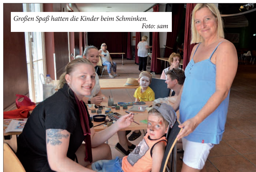
Großen Spaß hatten die Kinder beim Schminken.

die großen Gerätewagen der benachbarten Freiwilligen Feuerwehr an und staunten über so mach technisches Detail. Auch MSV-Maskottchen Ennatz schaute vorbei. Selbstverständlich hatten die Schützen auch für das leibliche Wohl gesorgt. Mit auf der Speisekarte standen etwa Muffins, Pommes und Grillgut. Kalte Getränke waren natürlich der Renner. Das Fest stand unter dem Motto „Kinder helfen Kinder“. Der Reinerlös geht an das Kinderhospiz St. Raphael in Huckingen. sam