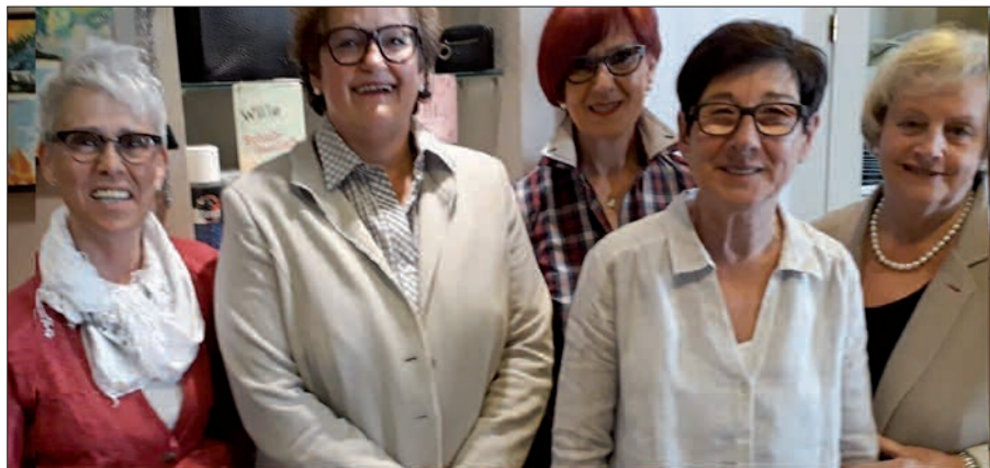
Seit 125 Jahre Hornscheidt Schuhe in Kaiserswerth