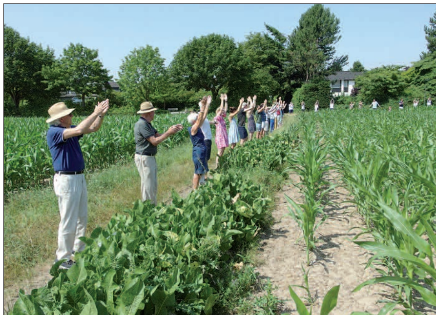
Aus Protest gegen die Absicht, den Schlossacker zu bebauen, bildeten weit über 300 Kalkumer und ihre Mitsstreiter eine Menschenkette um das vorgesehene Baugelände.

Ein merkwürdiger „Deal“ beschäftigt die Kalkumer Bürger schon seit Februar. Die Einrichtung einer „Akademie für Musik und Kunst“ im seit Jahren leerstehenden Schloss soll durch die Gewährung von Baurecht auf einem besonders sensiblen Landschafts-, Denkmalschutz- und Erholungsgebiet, dem Schlossacker vor dem Schlosspark, sozusagen „erkauft“ werden. Dabei gibt es keine Bedarfsanalyse und kein Konzept für die Akademie, auch kein Finanzierungskonzept. Träger der Akademie soll eine noch zu gründende Stiftung wer-