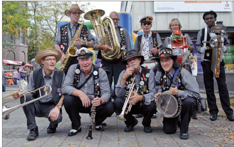
Die EFKES ANDERS JASSKAPEL spielt am 14. August beim Jazz-Frühschoppen in Huckingen.

zu erreichen, interpretieren sie die Musik der alten New Orleans Bands, wenn auch nicht ganz streng. Zwischen schnellen Stücken spielen sie langsame, zum Teil traurige Balladen, genauso wie es früher getan wurde, als die Streetbands Teil des täglichen Lebens, mit seinen schönen und traurigen Seiten, waren. Natürlich gibt es bei diesem Jazz-Frühschoppen nicht nur musikalische Leckerbissen. Auch für das leibliche Wohl ist bestens gesorgt. Auf die Besucher warten neben kühlen Getränken auch herzhaftes Grillfleisch.