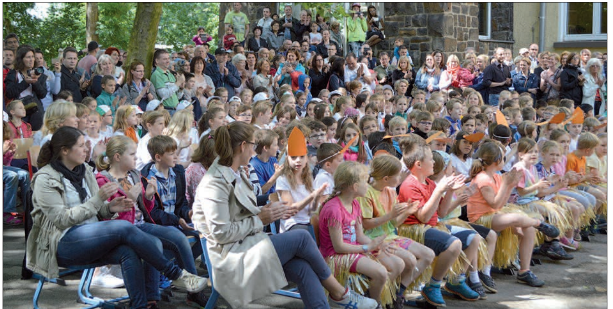
Für ihre Mühe erhielten die jungen Darsteller viel Applaus. Familie und Freunde waren gekommen, um das selbst geschriebene Musical live zu verfolgen.