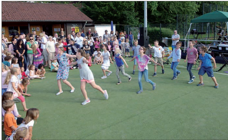
Tanzvorführungen der Schülerinnen, denen sich hier ein paar mutige Schüler angeschlossen haben.

programm sorgte die Band „No Service“. Der „Sparda Bank Surf Contest“ brachte jungen und junggebliebenen Teilnehmern viel Spaß (Bullriding auf einem Surfbrett). Dank der Flutlichtanlage konnte sich das Fest bis in die Dunkelheit fortsetzen, bei diversen Ballspielen, Musik, leckerem Grillgut, kühlem Sekt, Wein, Bier und alkoholfreien Getränken. Dass dieses Fest auch im nächsten Jahr der Ausklang des Schuljahres sein wird, konnte man den Worten von Dirk Becker entnehmen, Vorstandsmitglied im Heimat- und Kulturkreis und Hauptorganisator der Party, der viele fleißige Helfer und Unterstützer hatte. H.S.