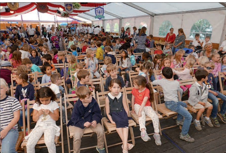
Nachwuchspflege muss sein. Das Festzelt am Rhein war am Kindertag gut gefüllt und die Stimmung gut und lebhaft.

Schon wieder vorbei ist das Schützenfest Kaiserswerth der Sebastianus Bruderschaft 1285 e.V., das traditionell Anfang Juli direkt am Rhein gefeiert wird. Die Stimmung war an allen Tagen bestens, das Wetter perfekt. Kein plötzlicher Regenguss, der störte, kein Gewitter, das die Parade am Sonntag, 3. Juli, verdarb, keine dunklen Wolken am Himmel.