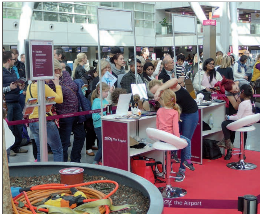
Geschminkt zu werden wie eine Prinzessin, Fee oder Fabelwesen ist der Wunsch vieler Mädchen. Beim Familien-Eventsonntag am 7. August werden diese Wünsche kreativ erfüllt.

port-Arkaden mit Shops und Gastronomie (mit „Gastro“-Spezialangeboten) zum Bummeln an. Kinder (2 - 11) werden solange kostenlos in der Kinderbetreuung beaufsichtigt oder können im geliehenen Kinderwagen von Mami Poppins am Bummeln teilnehmen. Alles kostenlos. Auch die Flughafenrundfahrten und der Eintritt zur Zuschauerterrasse sind frei. Glücksspiele gewinnen bei der Airport-Rallye oder beim Gewinnspiel „Sie buchen - wir zahlen“. Parken kostet von 10 bis 20 Uhr pauschal € 5,- (nicht auf P 11 und 12, im Maritim-Parkhaus und am IC-Bahnhof und bei Einfahrt mit EC-, Kredit- oder Parkkarte, Parkticket bis 18 Uhr an der Erlebnis-Info umtauschen oder bis 20 Uhr an der Park-Service-Zentrale im EG Parkhaus 3). Ein Urlaubstag in der Ferne kann kaum erlebnisreicher sein. H.S.