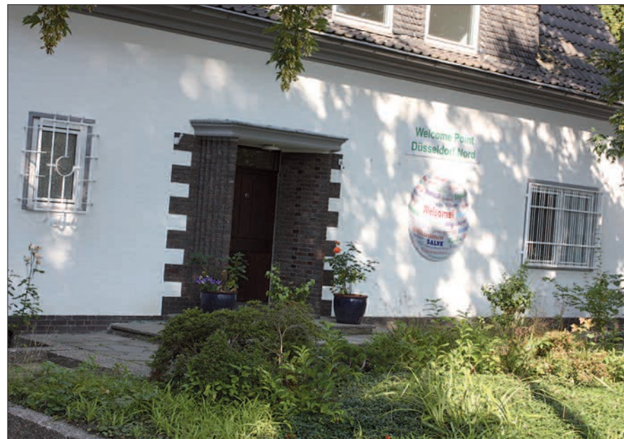
Eine alte Villa bietet den Rahmen für den Welcome Point in Lohausen. Von hier aus koordiniert ein erfahrenes Team um Jürgen Gocht alle Aktivitäten für die Flüchtlinge, die im Stadtnorden untergebracht sind.