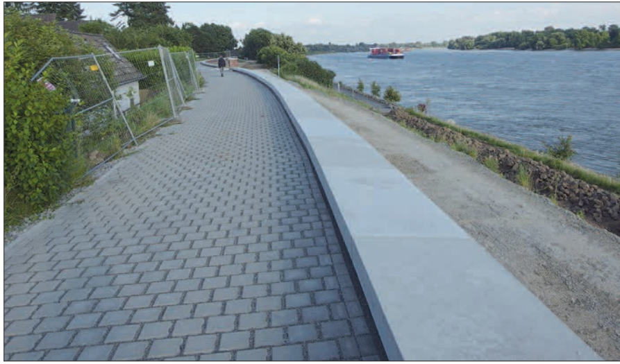
Eine wunderbare Promenade entlang des Rheins auf der Deichkrone in Wittlaer-Bockum. Rechts unterhalb ist bereits der Unterbau des „Mittelweges“ zu erkennen, noch ohne Belag. Noch weiter rechts am Rheinufer der jetzt asphaltierte Leinpfad.

Als dritter Weg, ebenfalls nur wenige Meter parallel zum „Mittelweg“, verläuft der Leinpfad, der bis „Am Krienengarten“ (Stadtgrenze zu Duisburg) jetzt verbreitert und asphaltiert wurde (der NORBOTE berichtete darüber). Drei Wege unmittelbar nebeneinander, das ist ein Luxus und eine Verschwendung von Steuermitteln, die man nur als Schildbürgerstreich bezeichnen kann. Ob die Exklusivität des Deichverteidigungsweges auf der Deichkrone auf Dauer durchzuhalten ist? Die bisherige Exklusivität des Leinpfades nur für Fußgänger wurde auch nicht durchgängig respektiert. H.S.