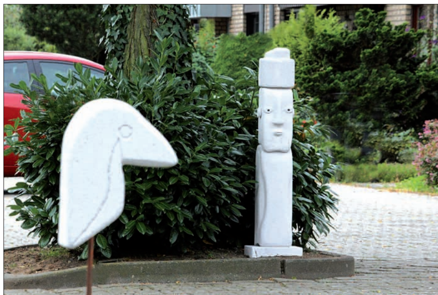
Unter dem Motto „Kunst im öffentlichen Raum“ sind beim Hirsestraßenfest in Rahm-West schöne Kunstwerke entstanden.

leine oder wie bei uns im Rahmen einer Gemeinschaftsaktion. In jedem Fall ist es ein schönes Gefühl, den Künstler in sich oder zumindest im Nachbarn zu entdecken.“ sam