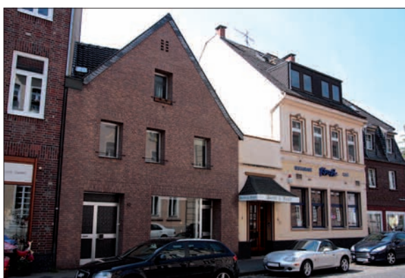
Die Abrissarbeiten können beginnen: Kleier und Kaiserpfalz.

Die Speisen aus dem Land der aufgehenden Sonne scheinen nicht nur den Kaiserswerthern gut zu munden. Denn das japanische Restaurant „Four Seasons“ hat nach zähen Verhandlungen mit dem Eigentümer die leerstehenden Räume Kaiserswerther Markt/Ecke An St. Swibert angemietet und wird ab September sein Restaurant erweitern. G.S.