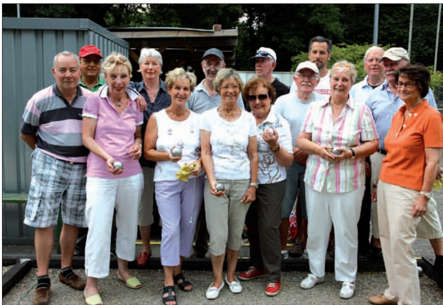
Eine überaus nette Truppe sind die Angermunder Bouler, die gern noch Verstärkung suchen.