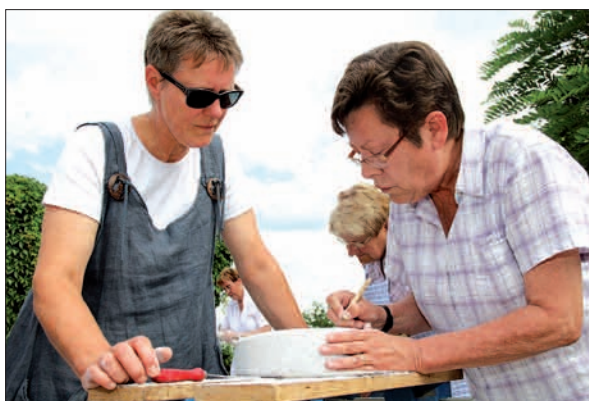
Voll konzentriert bei der künstlerischen Arbeit: die Anwohner der Hirsestrasse.