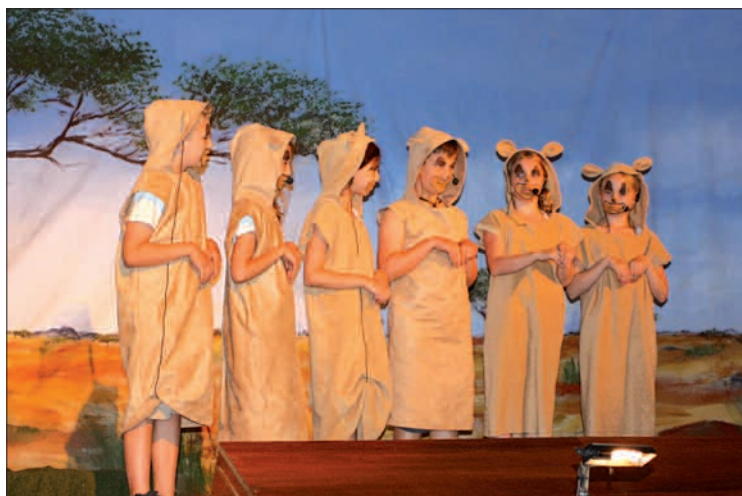
Die Erdmännchen sorgen für Eintracht.