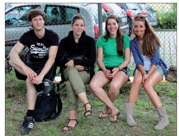
Charmante Zaungäste und Helfer beim Benefiz Cup.