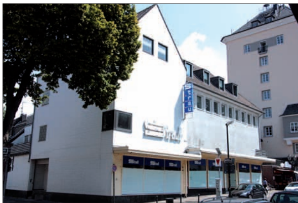
Der Leerstand des ehemaligen Kaufhaus Strauß ist ein herber Verlust für die Kaiserswerther.