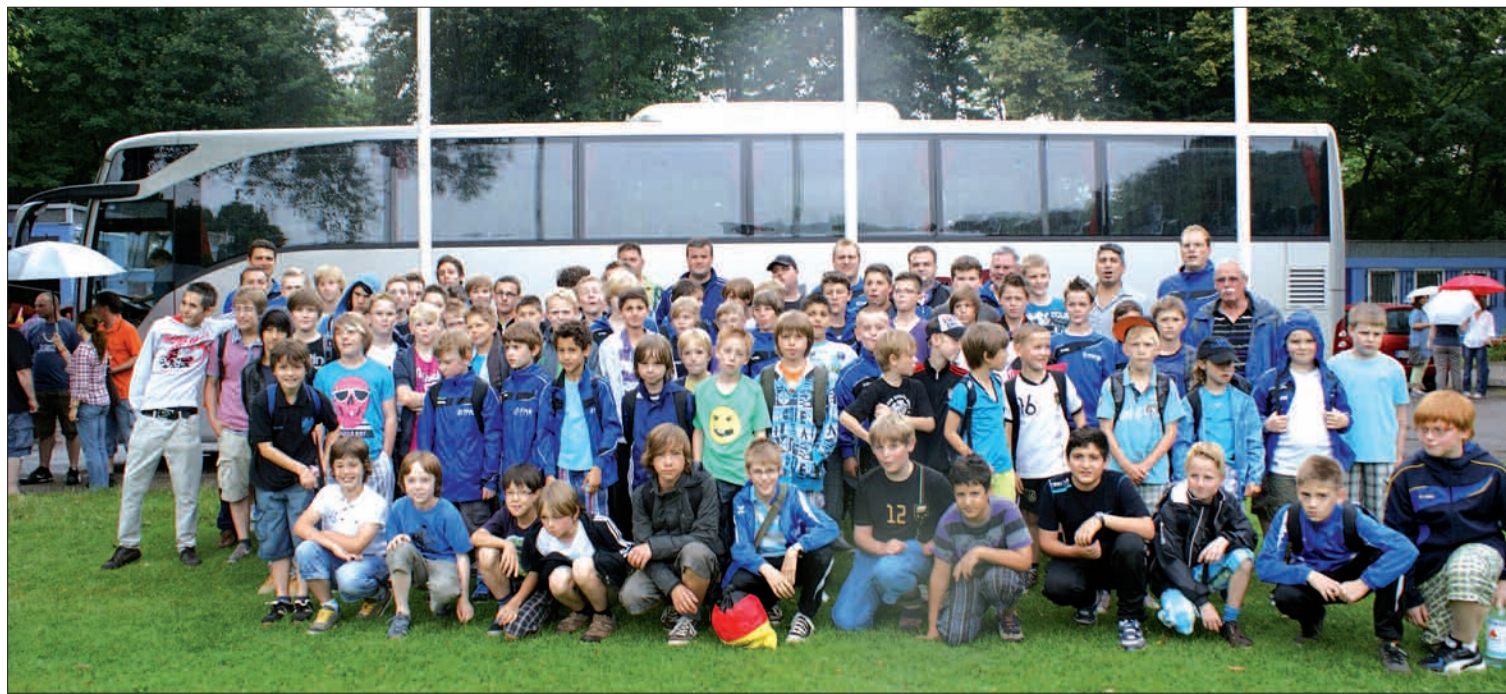
In zwei Bussen fuhren 100 junge Sportler mit ihren Betreuern zur Wewelsburg in die Nähe von Paderborn.

Rückfahrt nach Duisburg gab es Sonntagmittag noch ein Rittermahl zum Abschied. sam