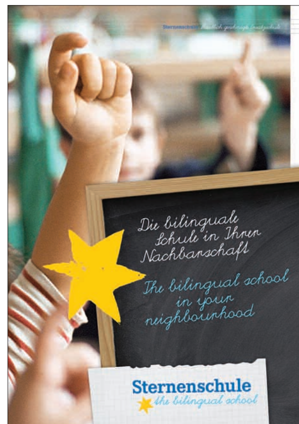
Die Infobroschüre ist zweisprachig.

zent der Unterrichtsstunden auf Englisch abgehalten. Nur Deutsch und Mathe werden in deutscher Sprache unterrichtet. Gründungsdirektor Manfred Scherrer möchte in der neuen Schule die Basis für ein erfolgreiches Lern- und Arbeitsleben legen: „Zur individuellen Förderung ihres Kindes setzen wir zeitgemäße Lernmethoden an.“ Die Sternenschule ist als zweizügige Einrichtung beantragt, so dass 160 Mädchen und Jungen sie besuchen können. Voraussetzung ist, dass die Eltern Mitglied im Förderverein werden. Als Schuluniform wird es eine einheitliche Oberbekleidung geben. Angestrebt wird auch die Errichtung einer weiterführenden Schule, die das Konzept fortführt. Weitere Informationen erteilt gerne Michaela Hilgers unter der Rufnummer 0203/93560293. Auch im Internet stehen unter www.sternenschule-duisburg.de interessante Details.