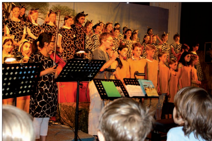
Wunderbar phantasievoll die selbst gestaltete Kulisse.

mierten, singenden Darstellerinnen und Darstellern das Stück unter bewährter Leitung von Lie Bruns. Ob die zuschauenden Menschen begriffen haben, dass das nicht nur für Tiere gilt?? G.S.