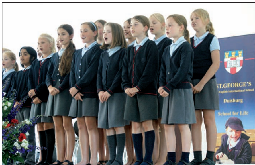
Mit musikalischen Einlagen bereicherte der Chor die Einweihungsfeier in der modern eingerichteten Aula.