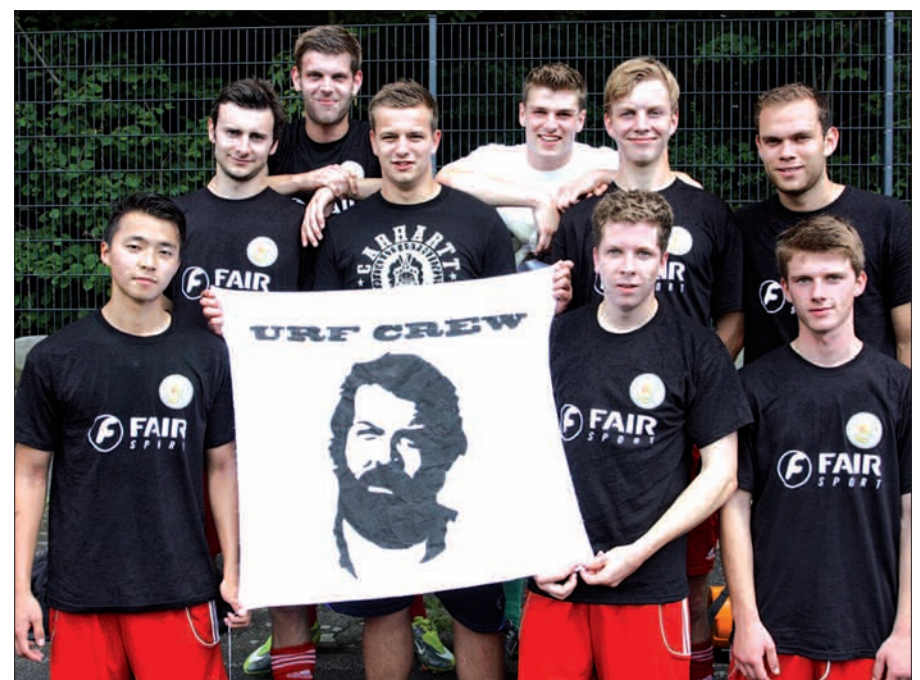
Die Gewinner des Turniers: Die Glasbier Rangers aus Düsseldorf.