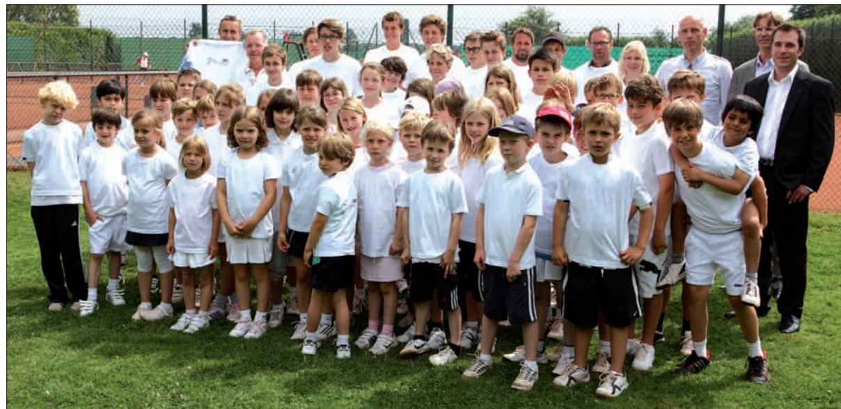
Über Nachwuchsmangel kann der ATC nicht klagen. Die Kinder vom Tenniscamp mit den frisch gesponserten T-Shirts von Angerfinanz.