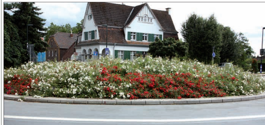
Rosenpracht in voller Blüte auf dem Kreisverkehr.

neuen blauen Mobil durch den Ort flitzt, hält sie in Ordnung. Beiden gebührt ein dickes Danke-schön für solch ein ansprechendes Bild. Der Kreisverkehr macht der Rosenstadt Angermund alle Ehre. G.S.