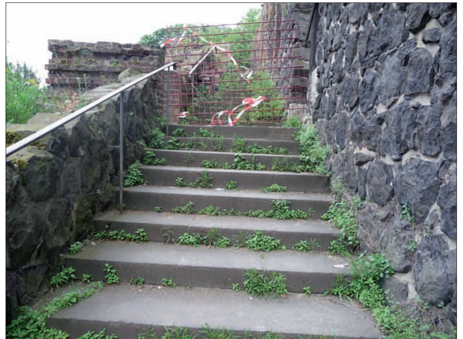
Die „begrünte“ Treppe in der Kaiserpfalz mit Absperrung in halber Höhe.

Erläuterungstafeln an den beiden Eingängen strotzen vor Dreck. Möglicherweise sind die Scheiben noch nie gereinigt worden. Das lobenswerte, ehrenamtliche Engagement der Tischgemeinschaft „Kaiserpfalz“ beim Heimatverein „Düsseldorfer Jonges“ bei der Pflege und Reinigung der Kaiserpfalzruine, kann die Verpflichtungen der Stadtverwaltung ganz offensichtlich in diesen Punkten nicht allein übernehmen. H.S.