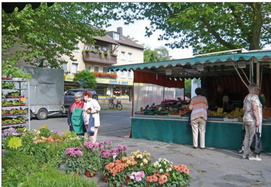
Für die Bürger von Ungelshheim gibt es neben dem Wochenmarkt in ihrem Stadtteil keine alternative Einkaufsmöglichkeit für Lebensmittel mehr. Auch die Anbindung an den öffentlichen Nahverkehr ist seit Sommer 2008 ohne umsteigefreie Busverbindung nicht mehr möglich, womit ihnen auch die Versorgung aus benachbarten Ortsteilen erschwert wird. Bleibt für die Zukunft doch nur die Luftbrücke?

hinderung. Es muss eine Chance für einen Neuanfang geben und unter dem Applaus der "Trauergäste" rief Ludwig dazu auf, jetzt erst recht, den Kampf für eine neue Nahversorgung aufzunehmen. „Hoffen wir, dass es ein Wiedersehen gibt mit unserem Lebensmittelgeschäft, unter neuer und menschenfreundlicher Leitung!“