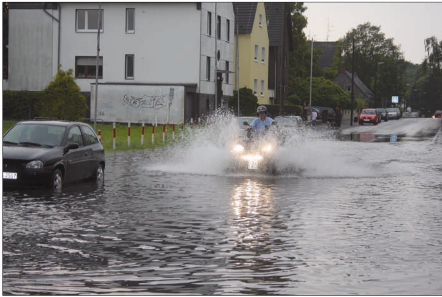
Vollwaschgang ohne Schleudern am Lohausener Schützenplatz.