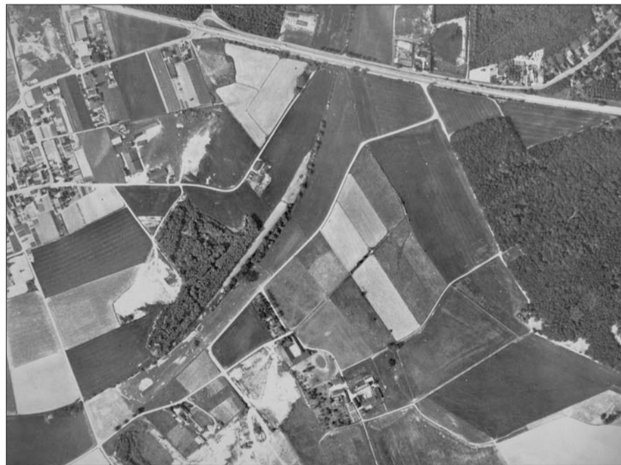
Luftbild von Serm und Holtum um 1960

Vieles hat sich in Serm und Holtum in den letzten 50 Jahren verändert, wenn auch die dörfliche Struktur weitgehend erhalten geblieben ist. Auf diesem Luftbild, das uns ein Sermer überlassen hat, sehen wir auf der rechten Bildhälfte den Heidberg und im unteren Teil des Fotos die (ehemalige) Holtumer Mühle (Mühlhof), den Holtumer Hof und den Postenhof. Die früheren, großflächigen Auskiesungen am unteren Bildrand sind noch nicht abgeschlossen. Zwischen Holtum und dem östlichen Teil von Serm liegt der Ungelheimer Graben und die damalige Sermer Ziegelei Wilmes. Damals standen noch die Gebäude, der Betrieb war aber bereits eingestellt. Inzwischen sind in diesem Bereich neue Wohngebiete entstanden. Auffällig sind auch die damals noch kleinteiligen Äcker, da weit mehr Sermer als heute mit weniger modernen Maschinen noch in der Landwirtschaft arbeiteten.