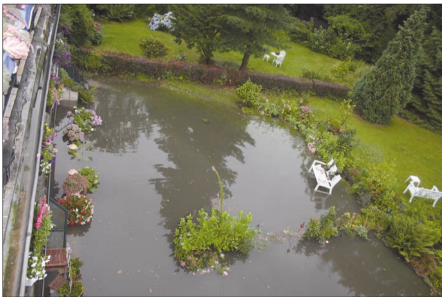
Dieser Gartenteich war so nicht geplant!