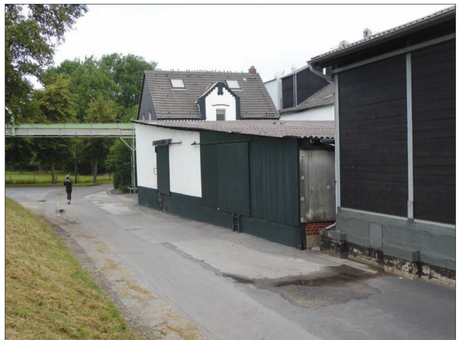
Der mittlere Gebäudetrakt der Einbrunger (Korn)mühle Röllekens soll erneuert werden.

Ohne Ortsbeiratsvertretung 5 in ihrer letzten Sitzung diesem Bauvorhaben nicht zustimmen und erwartet außerdem eine verbindliche Erklärung oder Vereinbarung des Eigentümers zur Renaturierung des Schwarzbachs.