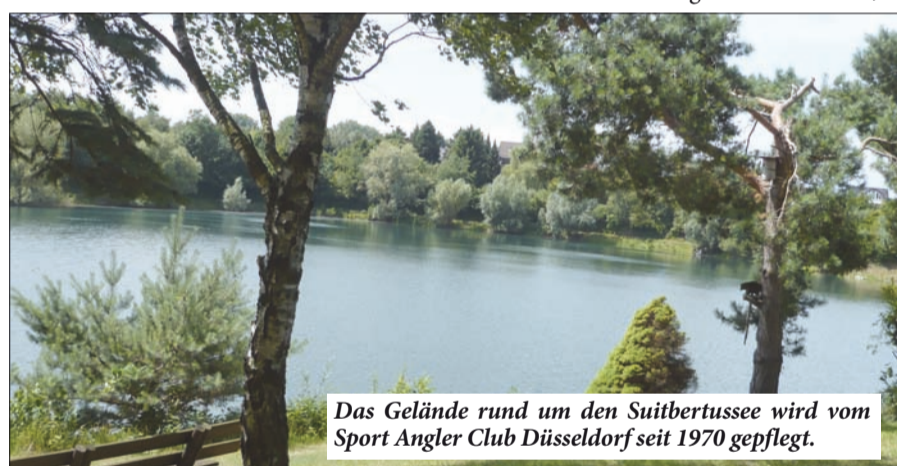
Das Gelände rund um den Suitbertussee wird vom Sport Angler Club Düsseldorf seit 1970 gepflegt.

glied sich mit dem großen Fisch ablichten lässt und ihn dann zurück in den See