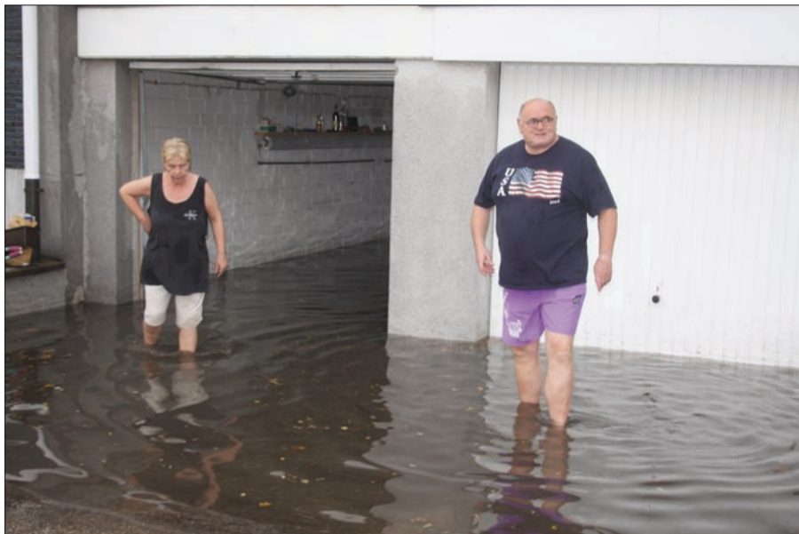
Wohl dem, der sein Auto nicht in diesen Garagen hatte...