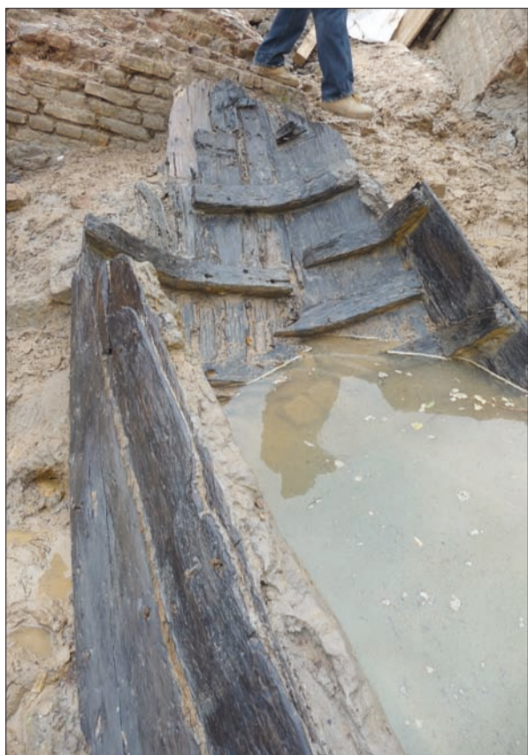
Ein ungefähr 300 Jahre altes Plattbodenschiff ist unter dem Kaiserswerther Deich gefunden worden. Es liegt tief im Grundwasser, nur der Bug ragt aus dem Wasser.

In Verbindung der archäologischen Untersuchungen der Festungsmauerreste, die beim Deichbau nördlich Kaiserswerth gefunden wurden (der Nordbote hatte darüber berichtet), kam jetzt auch ein Plattbodenschiff zum Vorschein. Es ist im 18. Jahrhundert gesunken, nach der Sprengung und Schleifung der Kaiserswerther Festung, aber vor der Errichtung von Uferbefestigung an dieser Stelle, die auf eine Verladestelle oder einen Hafen hinweisen.