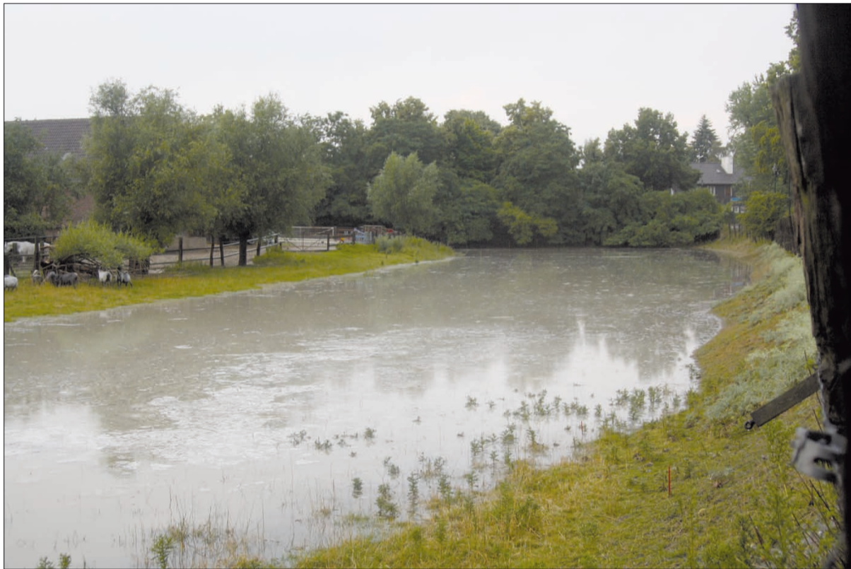
Eindrucksvoll hat eine Anwohnerin festgehalten, wie die Wiese An den Hingbenden nach dem Unwetter am 3. Juli aussah.

Arheimer Straße 50 40489 Düsseldorf-Kaiserswerth Telefon (0211) 59 811 802 - www.casa-massimo.de Täglich durchgehend von 12:00 - 24:00 Uhr, warme Küche bis 22:30 Uhr geöffnet. Montags ab 17:00 Uhr geöffnet.