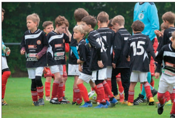
Erinnerungen an das letzte Fußballcamp in 2019 werden wach. Nun freuen sich alle auf die neuen Camps.