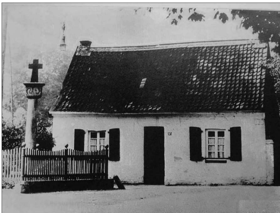
Lohauer Dorfkreuz den 1920-er Jahren.

Ihr Fachbetrieb für: • Bedachungen • Kunststoffabdichtungen • Bauklempnerei • Schieferarbeiten • Fassadenbau • Dachfenstereinbau • Balkon- und Terrassenabdichtungen • Solaranlagenbau • Planung und Ausführung von Schallschutz-Dächern • Reparaturen aller Art Stefan Goliß Bedachungen e.K. Dachdeckermeister · Betriebswirt (HWK) Gebäudeenergieberater im Handwerk · Solateur® Vogelsanger Weg 25 · 40470 Düsseldorf Telefon: (+49) 0211 93079075 Mobil: (+49) 0172 7950743 Telefax: (+49) 0211 24092125 info@golissa.com · www.golissa.com