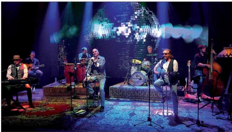
„NIGHT FEVER - A Tribute To The BEE GEES“ beenden Ende Juli, Anfang August mit besonderen Konzerten die kulturlose Zeit im Huckinger Steinhof.