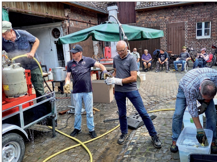
Mit voller Kraft haben die Mitglieder der St. Remigius Kompanie in 2020 Erbsensuppe gekocht. Der Erlös ging an das Demenz-Cafe' Isolde.

der Überschuss wird einem guten Zweck gespendet. Bestellungen ab sofort unter erbsensuppe.wittlaer@t-online.de. Und im Hofladen des Gemüsehofs Peters, Kalkstraße 23 oder unter der Nummer 0172/2030 333. Die Bestellungen können ab 29. Juni im Gemüsehof Peters abgeholt werden. In Ausnahmefällen werden die Suspendosen nach Hause geliefert. G.S.