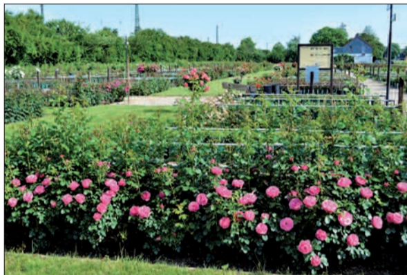
Einen guten Überblick über die verschiedenen Rosenarten erhält man im Rosengarten am Grünen Weg zwischen Rahm und Angermund.

Rosen Ruland, Grüner Weg 55 in 47269 Duisburg-Rahm. Die Öffnungszeiten: montags bis freitags von 9 bis 18 Uhr, samstags von 8 bis 14 Uhr, sonntags von 10 bis 13 Uhr. Der SB-Verkauf ist täglich von 9 bis 19 Uhr geöffnet. Weitere Infos: www.rosen-ruland.de .