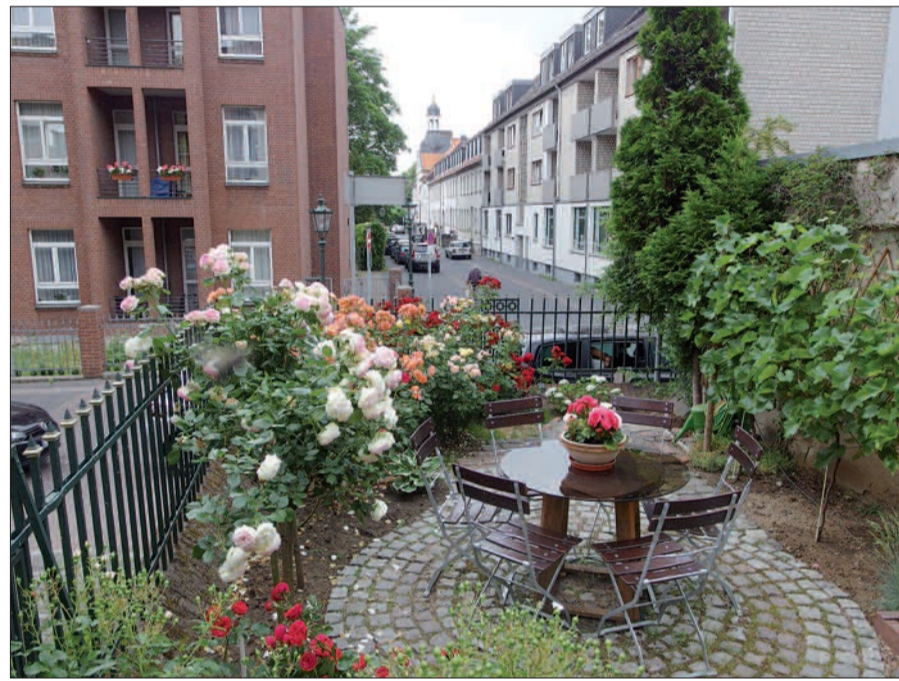
Das „Kaisergärtchen“ des Heimat- und Bürgervereins Kaiserswerth e.V. in der Rosenblüte.