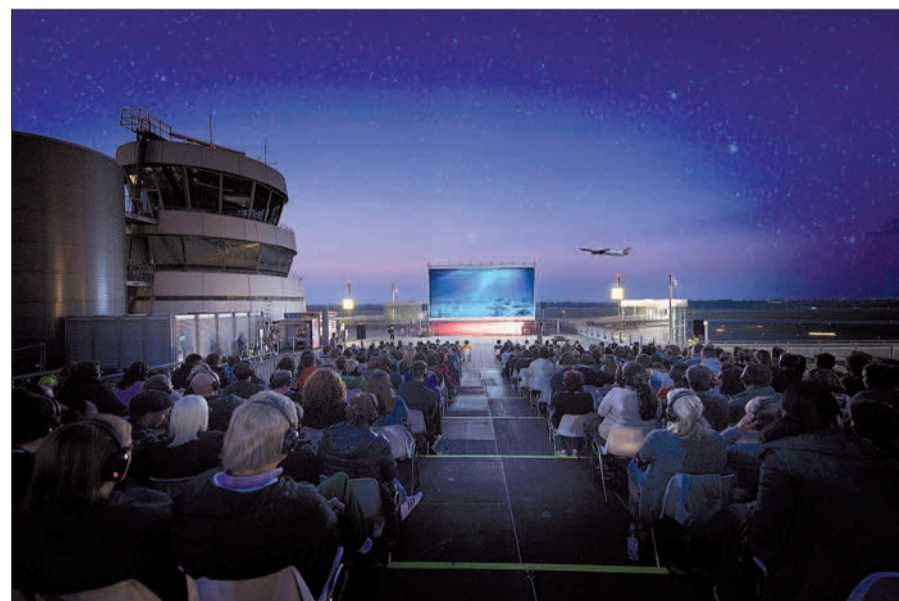
Ein außergewöhnliches Ambiente im Freilichtkino auf der Flughafen-Zuschauerterrasse.

Bitte daran denken, dass am Zugang zur Zuschauerterrasse die flughafenübliche Sicherheitskontrolle stattfindet.