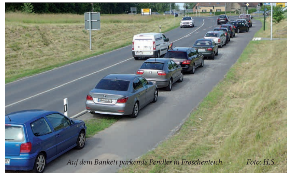
Auf dem Bankett parkende Pendler in Froschenteich.

baut wird. Oder sind sie davon ausgegangen, dass der vorhandene private Parkplatz genutzt werden kann? Den hat der Privateigentümer nach Bau des Haltepunktes gesperrt und in eben dem von der Stadtverwaltung als nicht für Parkplätze zulässigen Bereich Ersatz gefunden. Die bedauernden Pendlern parken auf dem Bankett. Lässt die StVO und die von der Stadtverwaltung angeführten Gesetze und Regelungen das zu? Fühlt sich die Düsseldorfer Stadtverwaltung für einen P & R Parkplatz auf Düsseldorfer Stadtgebiet, den voraussichtlich viele Pendlern aus Duisburg nutzen werden, nicht zuständig? Oder will sie ihre wunderbaren grünen Freiräume hier dafür nicht „verschwen-