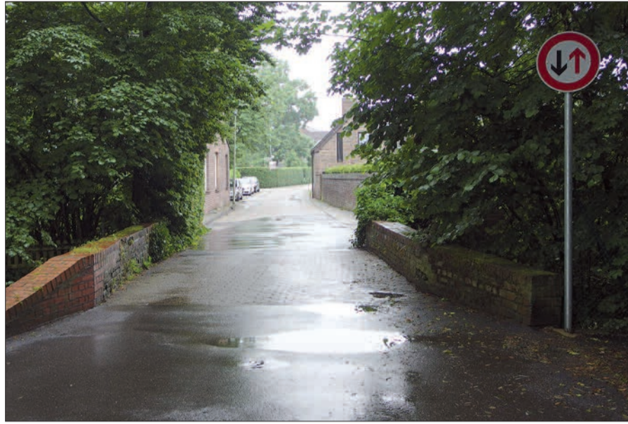
Kalkum wird gelegentlich als „vergessenes Dorf“ bezeichnet. Es scheint so, als ob zu mindestens die Brücke über den Schwarzbach bei der Verwaltung in Vergessenheit geraten ist.

„aus technischen Gründen“ einen Monat länger dauern. Die Kinder würden aber mit entsprechendem Behelf über den Bach kommen. Folgerichtig stellte die CDU-Fraktion in der Sitzung am 31. Juni die Frage an die Verwaltung nach dem Grund dieser weiteren Verzögerung, ob die Arbeiten beschleunigt werden können und ob der Bus 760 direkt nach Fertigstellung der Brücke wieder die früheren Haltestellen im Dorf anfährt. Anmerkung: Die Kanal- und Straßenbauarbeiten sind schon seit rund 9 Monaten abgeschlossen und der Bus 760 fährt immer noch die erbärmlichen Ersatzhaltestellen auf der Umgehungsstraße an. H.S.