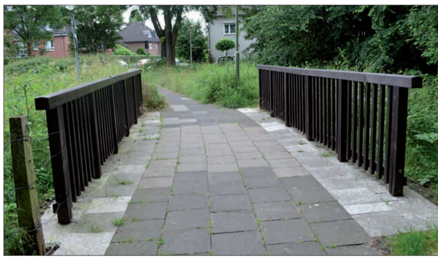
Die Mitglieder des Bürgervereins Huckingen sorgen für den Erhalt der Geländer der Schobbesbröck. Sie verbreiterten auch die Plattierung unterhalb der Geländer.

ckinger Bürgervereins. „Auf Grund fehlender vorbeugender Instandhaltung durch die Stadt Duisburg hat sich der Bürgerverein zumindest den Erhalt dieser Brückengeländer zur Aufgabe gemacht. Die Arbeiten wurden in Absprache mit der Stadt Duisburg durchgeführt.“ Diese Maßnahme sei ein weiteres Beispiel für das Bemühen des Bürgervereins Huckingen zur Erhaltung eines lebens- und liebenswerten Huckingens. sam