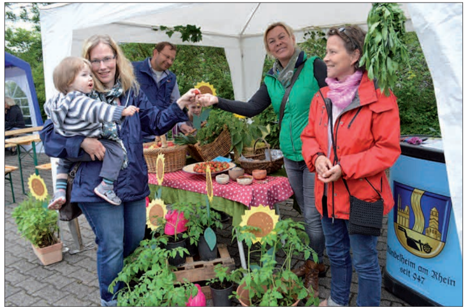
Im vorigen Jahr stellte sich die Projektgruppe „Essbares Mündelheim“ vor. Was daraus geworden ist, kann man sicherlich beim Grillfest am 1. Juli erfahren.