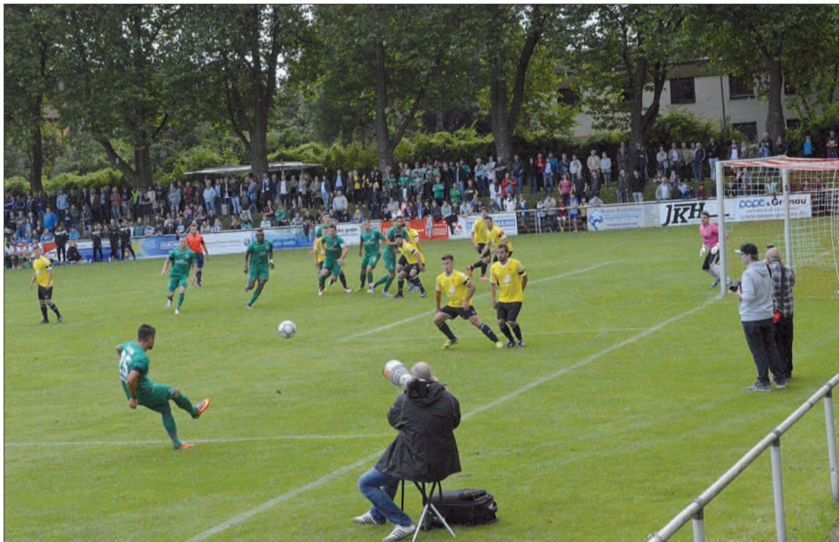
Das Ergebnis des Spiels (14:0 für den MSV) stand am Sonntag nicht im Vordergrund. Jetzt möchten die Huckinger zurückfinden in den Alltag.

Für die Vertreter der Vereine aus dem Düsseldorfer Norden und Duisburger Süden war es keine Frage, sich an dem Benefizspiel zu beteiligen und so zu einer