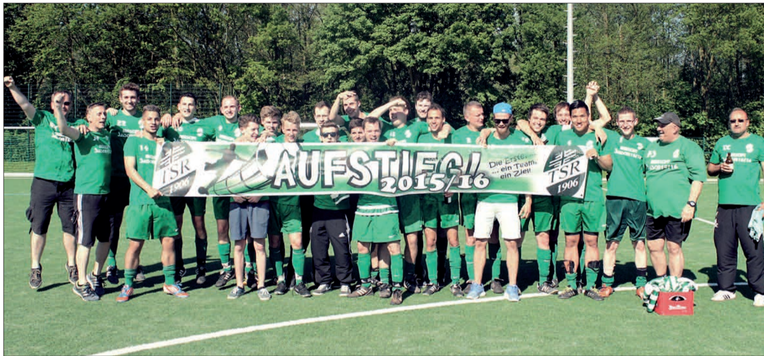
Das Ziel ist erreicht: Die 1. TSR-Mannschaft ist in die Kreisliga B aufgestiegen. Herzlichen Glückwunsch!

sonende als Aufsteiger feststand. Die Verantwortlichen sind sehr froh über diese Entwicklung.