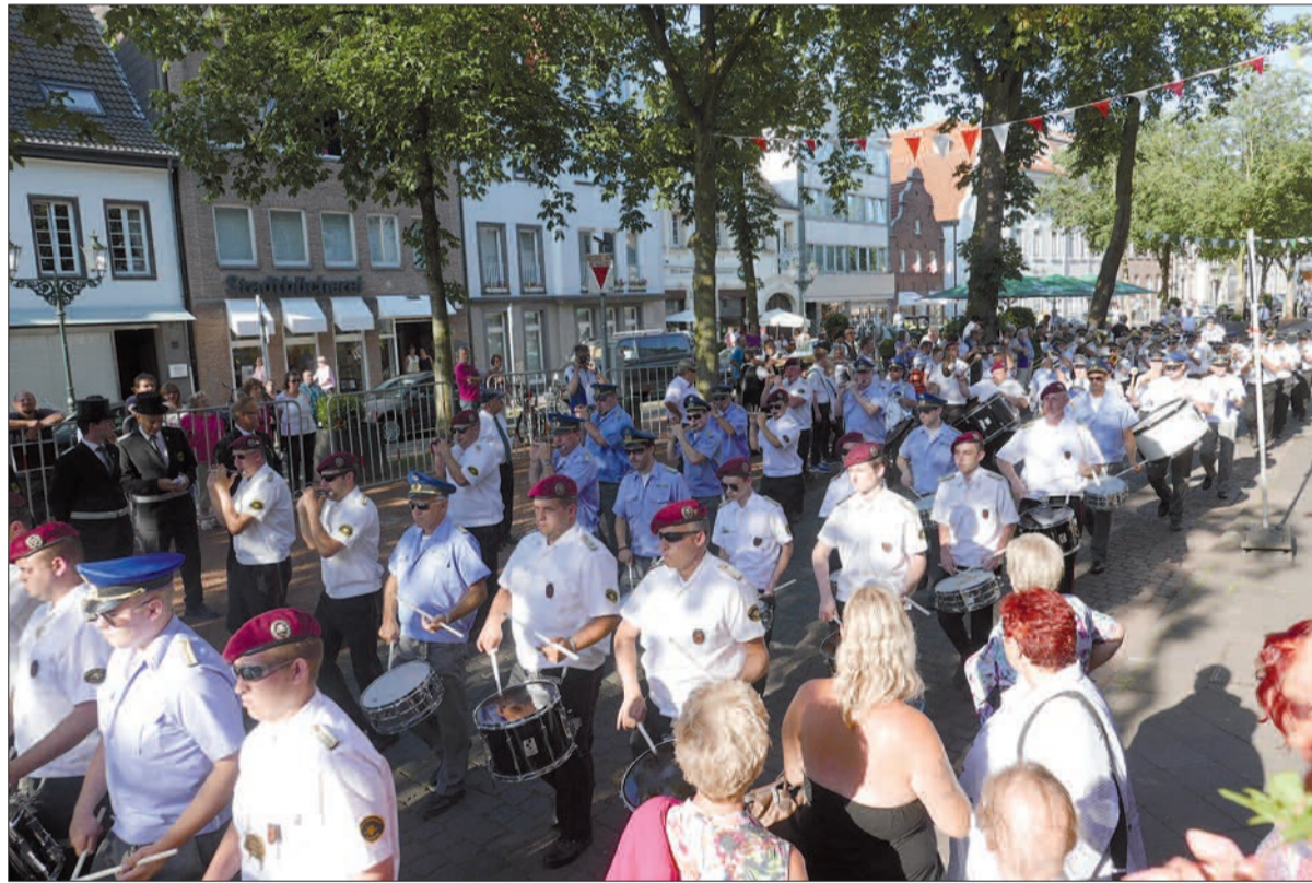
Wenn das Tambour-Corps Barbarossa aufspielt, und das bei herrlichem Sonnenschein unter mächtigen Kastanien, bleibt kein Auge trocken.

beschließt das 731. Schützenfest in Kaiserswerth. G.S.