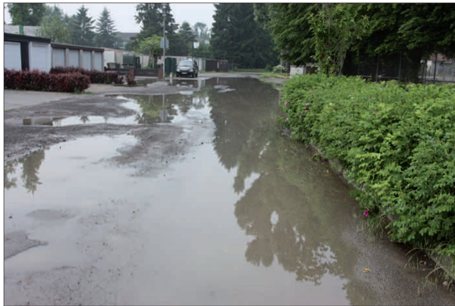
Schlaglöcher, nicht abfließendes Regenwasser – der Freiheitshagen ist in einem katastrophalen Zustand. Nun muss die Stadt aktiv werden.