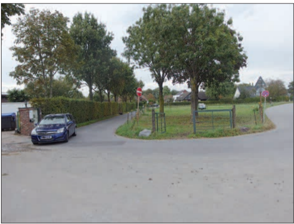
Das Zeppenheimer Dreieck wird wohl noch längere Zeit umfahren werden müssen.